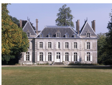
Vue générale sud IVR53_19963501627XA