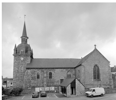
Elévation Sud : vue générale IVR53_19943500695X