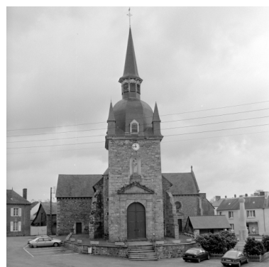
Elévation Ouest : vue générale IVR53_19943500694X