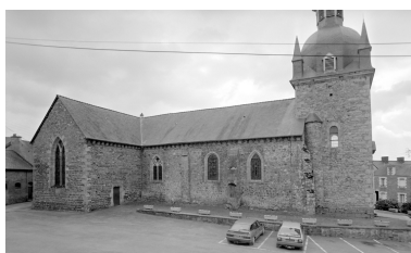
Elévation Nord : vue générale IVR53_19943500693X