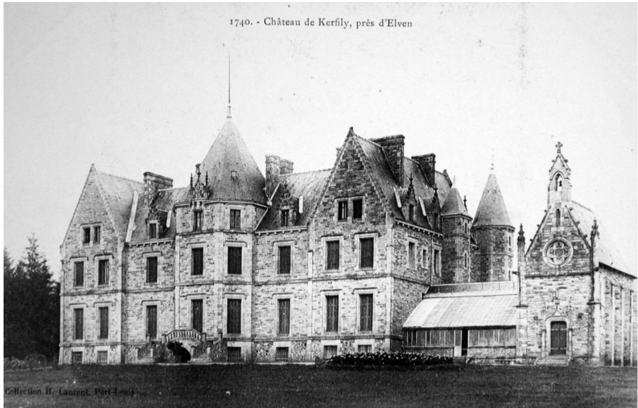
Vue générale des élévations sur jardin