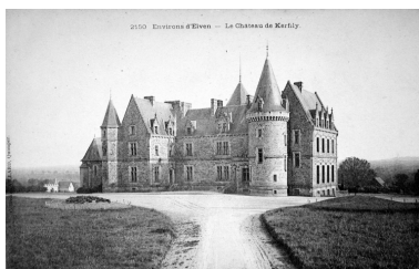
Vue générale des élévations sur cour