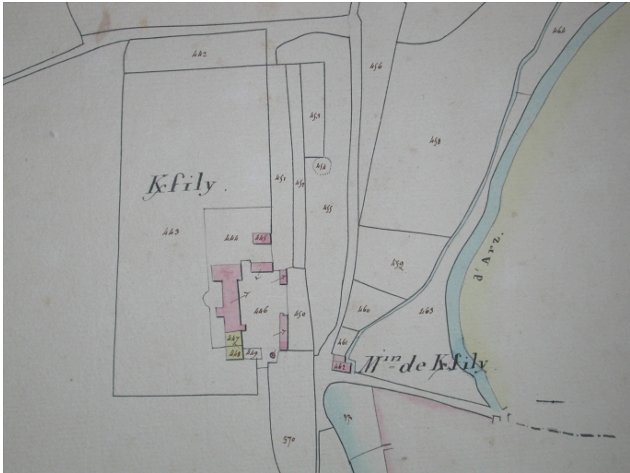
L'ancien manoir de Kerfily sur le cadastre de 1830