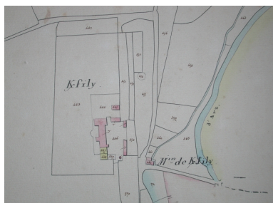
L'ancien manoir de Kerfily sur le cadastre de 1830