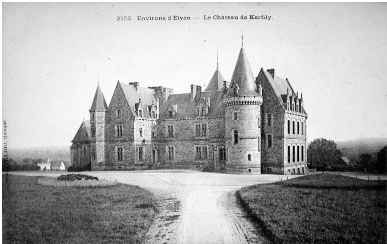
Vue générale des élévations sur cour