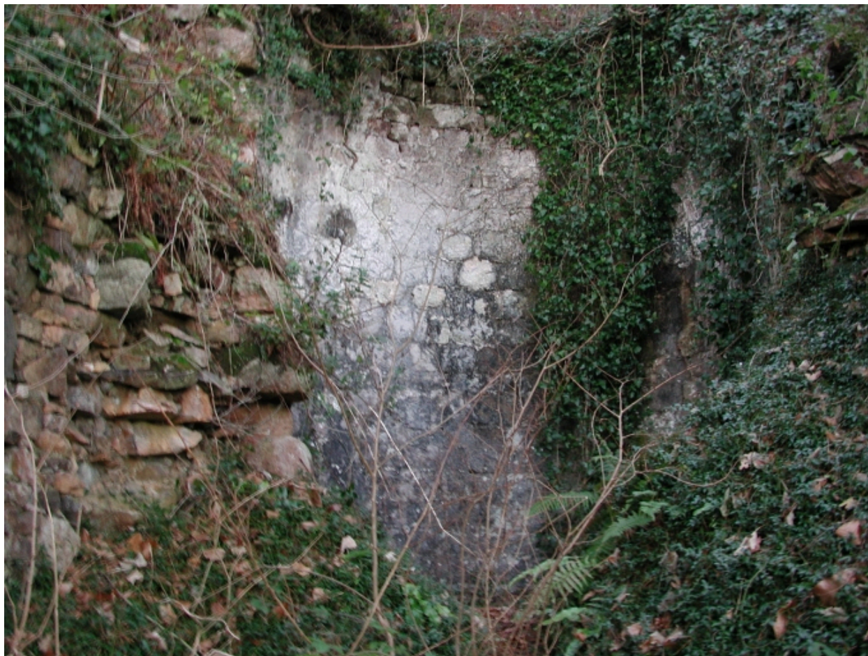
Vue du four à chaux, entouré de murs en ruine