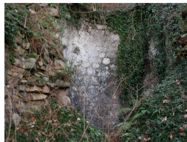
Vue du four à chaux, entouré de murs en ruine