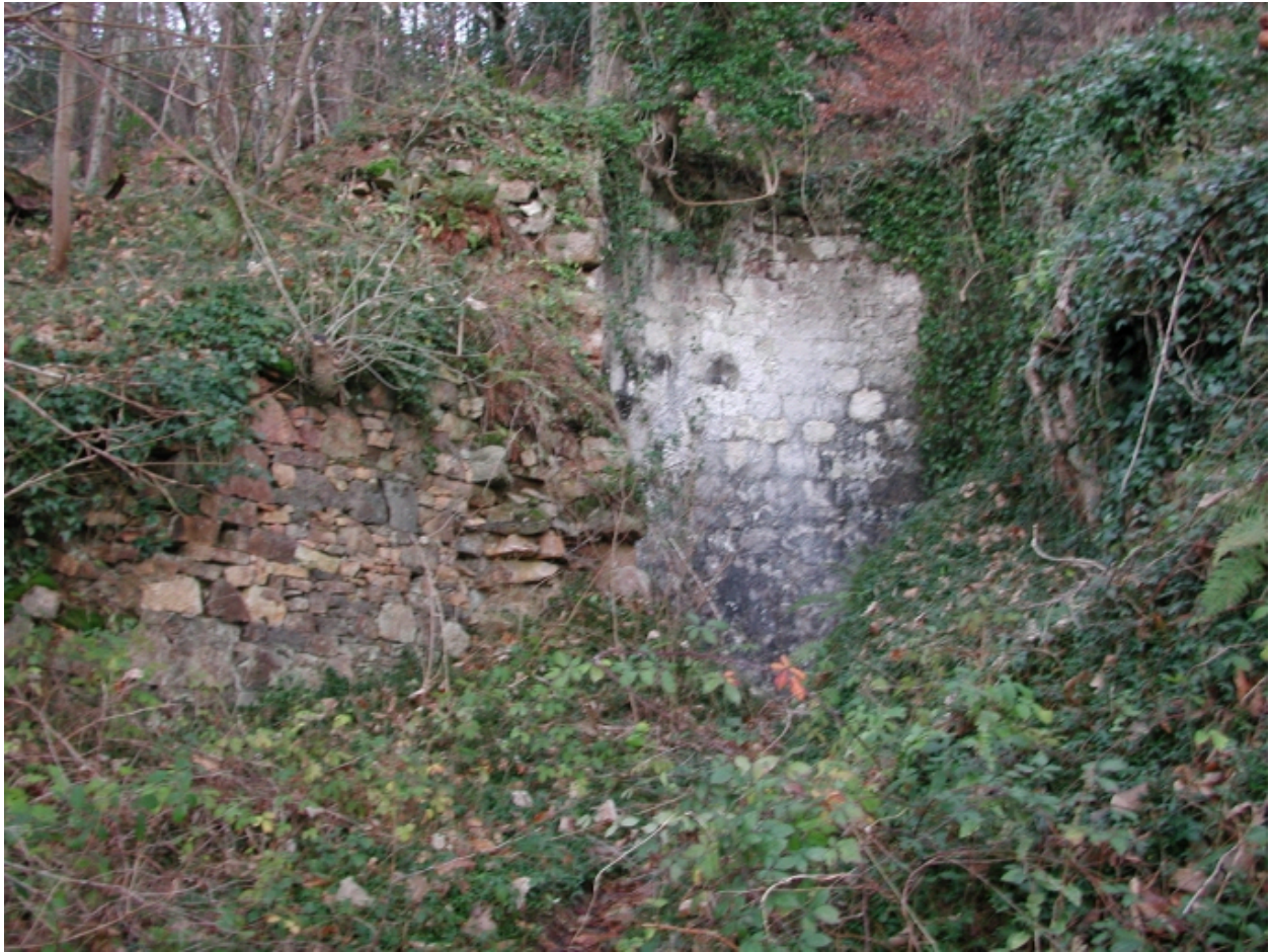
Vue du four à chaux dans son environnement