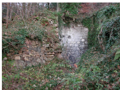
Vue du four à chaux dans son environnement