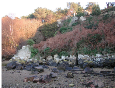
Les rivages du Trieux à 100 mètres du four à chaux IVR53_20082207769NUCA