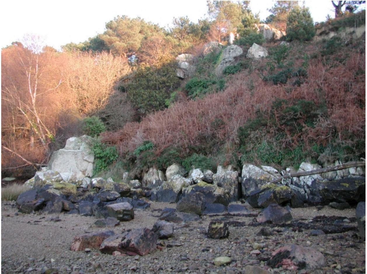
Les rivages du Trieux à 100 mètres du four à chaux