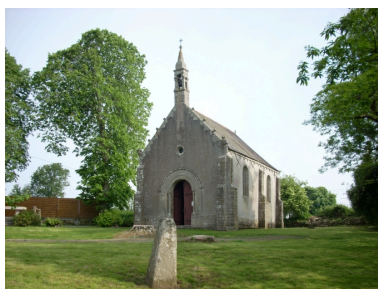
Plonéour-Lanvern, chapelle Notre-Dame-de-Bonne-Nouvelle : vue générale sud-est IVR53_20082905867NUCA