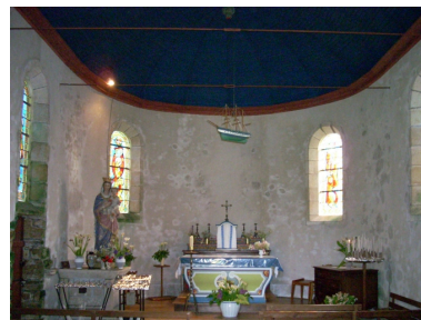
Plonéour-Lanvern, chapelle Notre-Dame-de-Bonne- Nouvelle : vue axiale est