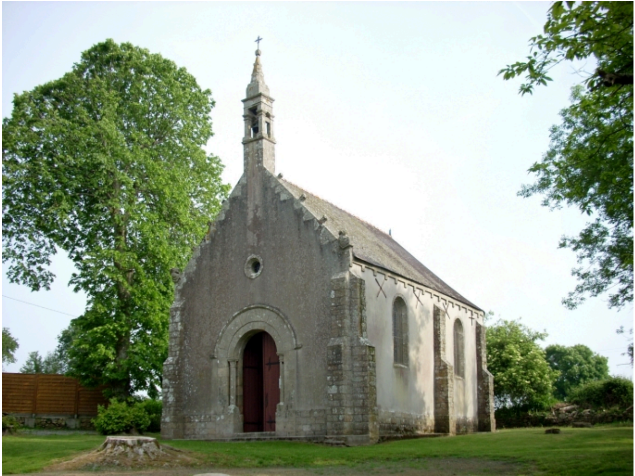
Plonéour-Lanvern, chapelle Notre-Dame-de-Bonne-Nouvelle : vue générale sud-est