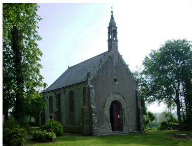
Plonéour-Lanvern, chapelle Notre-Dame-de-Bonne- Nouvelle : vue générale nord-ouest