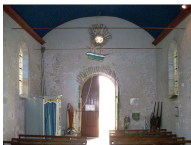
Plonéour-Lanvern, chapelle Notre-Dame-de-Bonne- Nouvelle : vue axiale ouest IVR53_20082905872NUCA