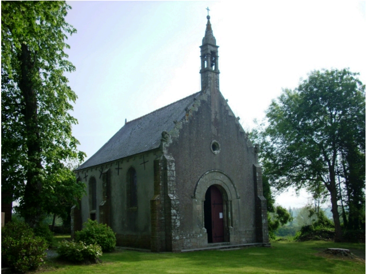
Plonéour-Lanvern, chapelle Notre-Dame-de-Bonne-Nouvelle : vue générale nord-ouest