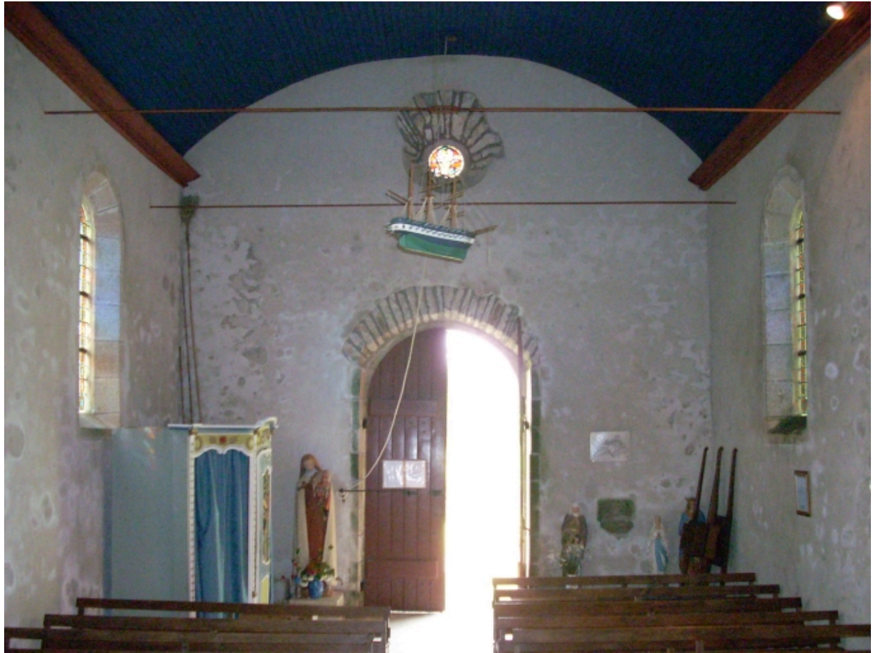
Plonéour-Lanvern, chapelle Notre-Dame-de-Bonne-Nouvelle : vue axiale ouest