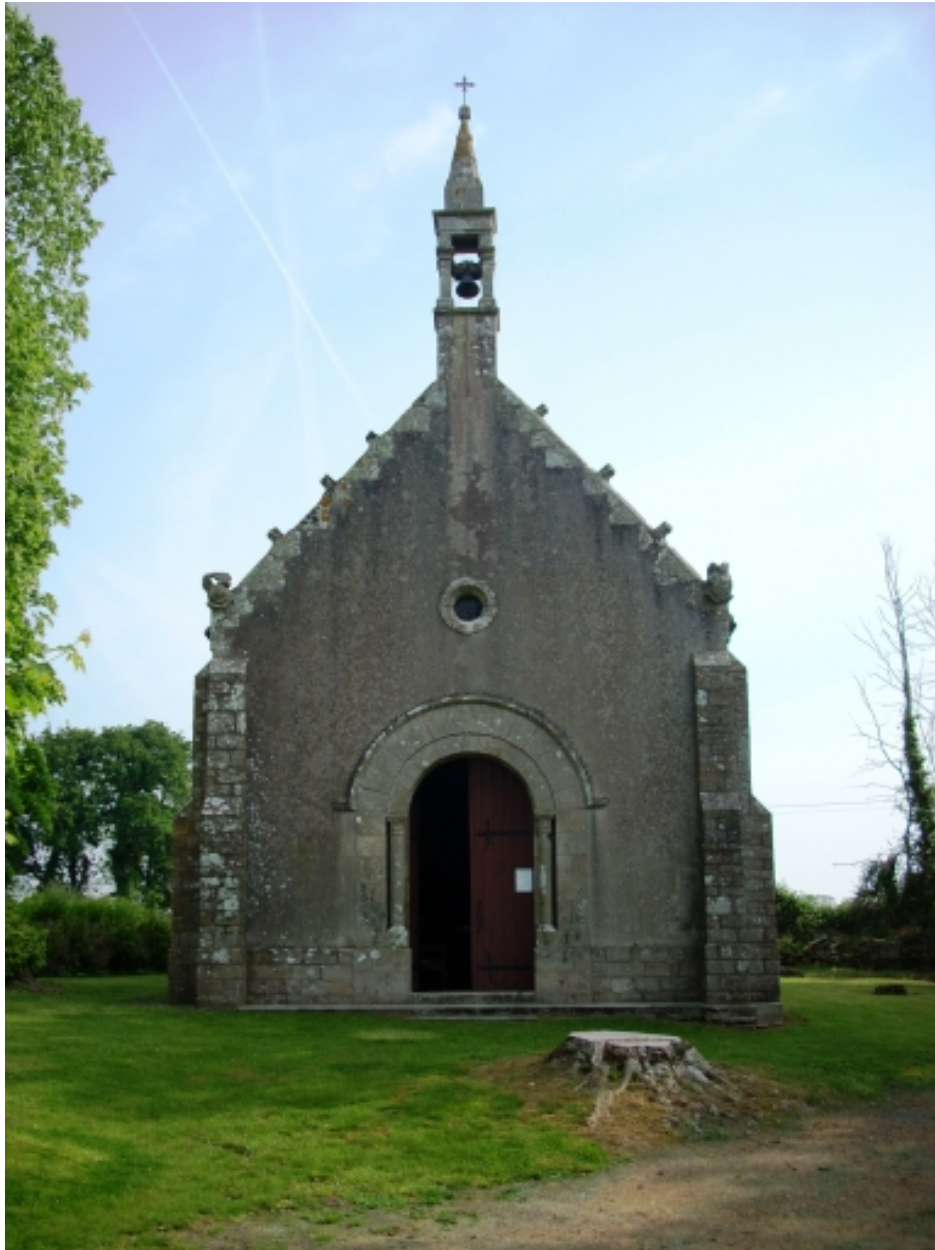
Plonéour-Lanvern, chapelle Notre-Dame-de-Bonne-Nouvelle : élévation ouest