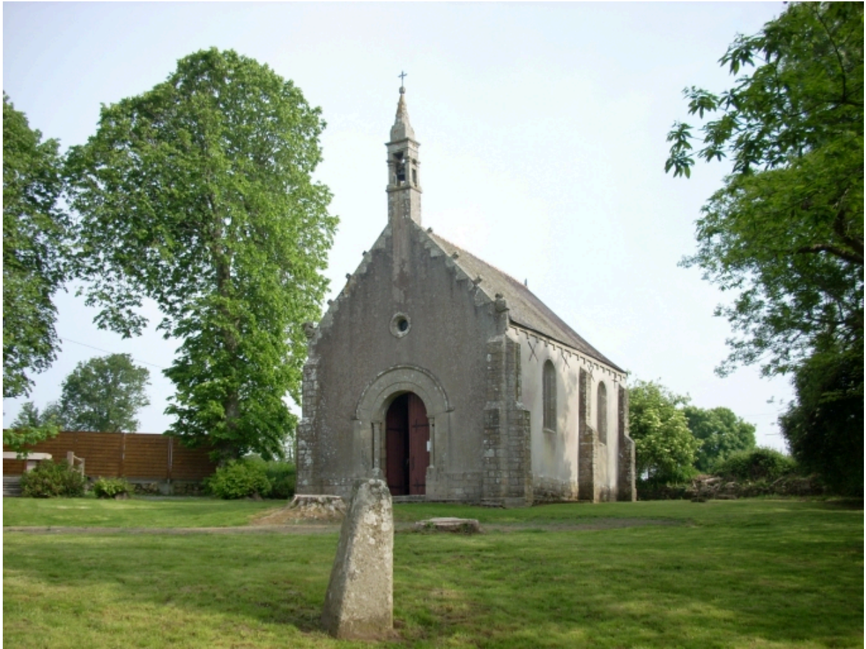
Plonéour-Lanvern, chapelle Notre-Dame-de-Bonne-Nouvelle : vue générale sud-est