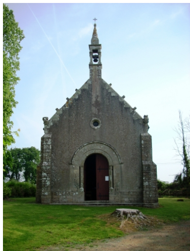
Plonéour-Lanvern, chapelle Notre-Dame-de-Bonne- Nouvelle : élévation ouest