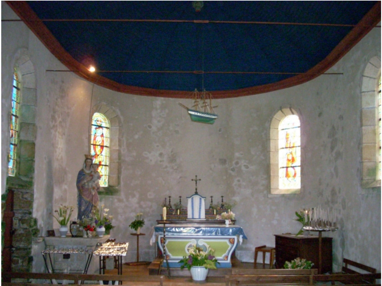
Plonéour-Lanvern, chapelle Notre-Dame-de-Bonne-Nouvelle : vue axiale est