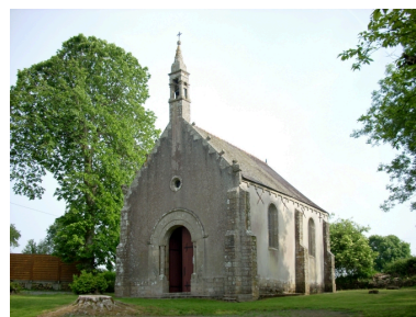
Plonéour-Lanvern, chapelle Notre-Dame-de-Bonne-Nouvelle : vue générale sud-est IVR53_20082905868NUCA