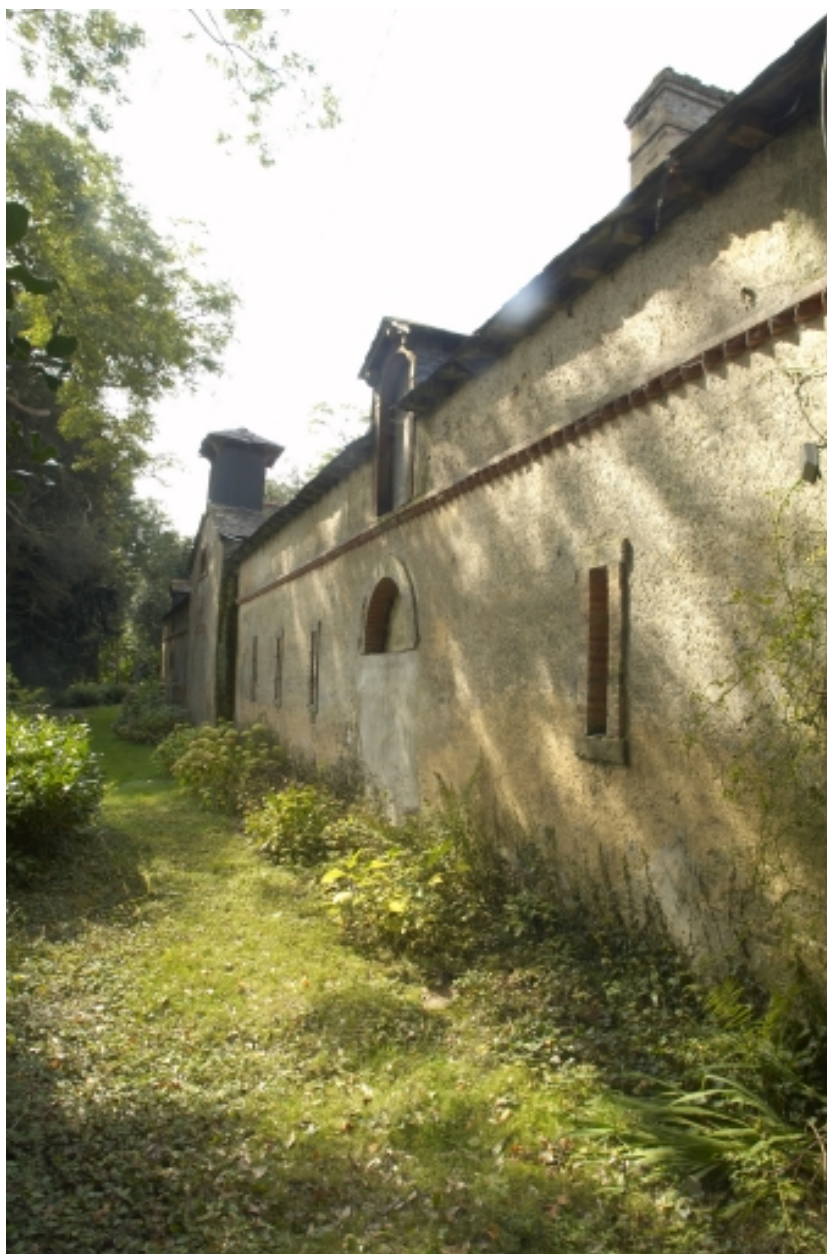
Communs du château