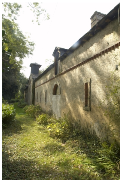
Communs du château IVR53_20083501294NUCA