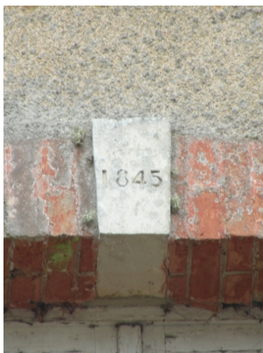
Date portée : 1845 IVR53_20073508960NUCA