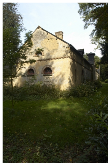
Les communs du château