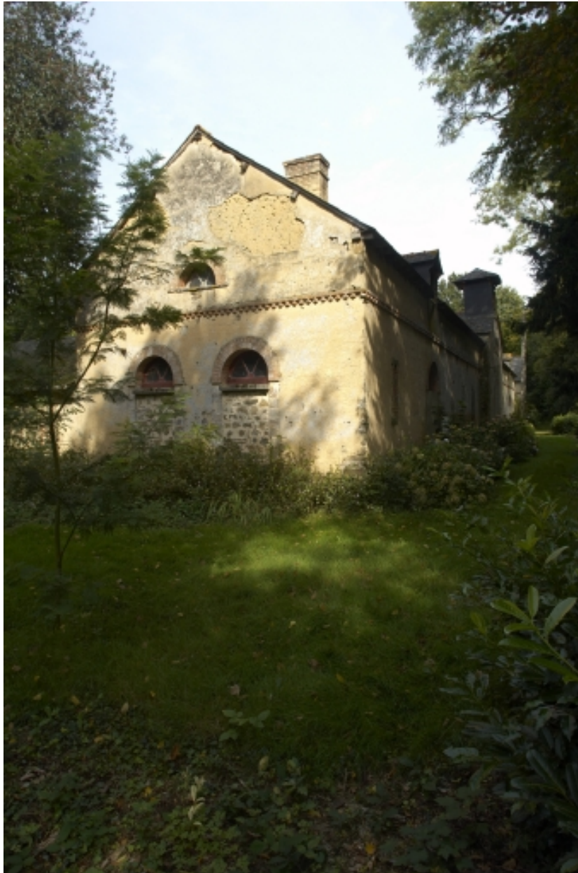
Les communs du château