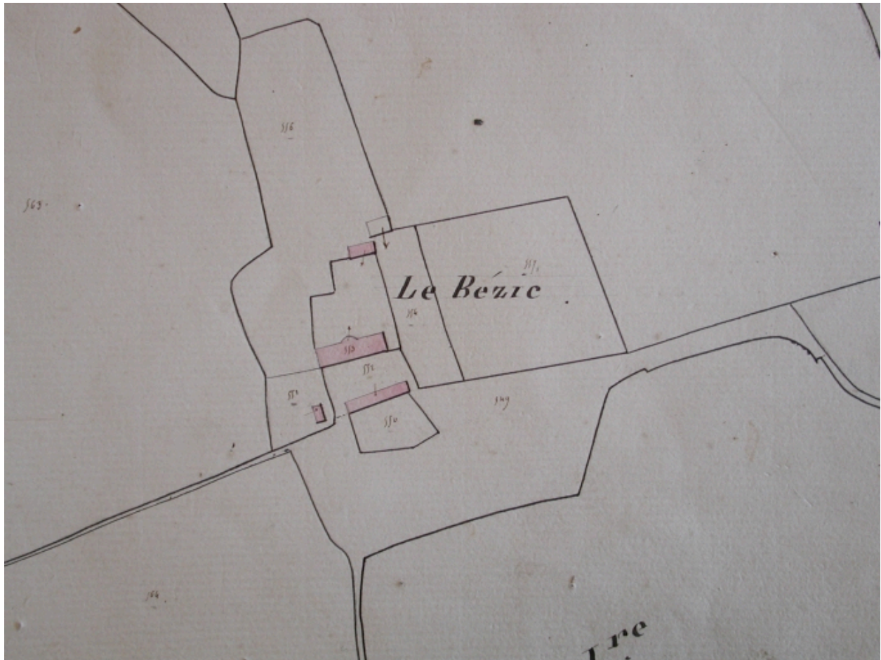
Le Bézic sur le cadastre de 1830