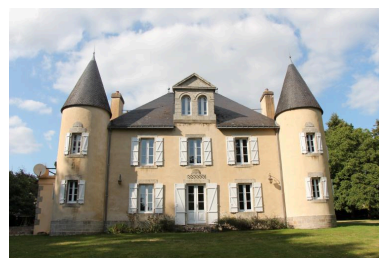
Vue de la façade sur jardin IVR53_20185607900NUCA