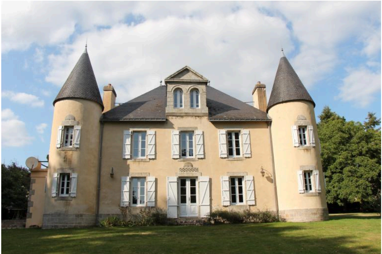
Vue de la façade sur jardin