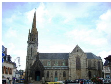
Landivisiau, église paroissiale Saint-Thuriau : élévation sud