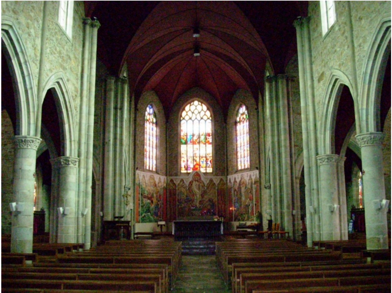
Landivisiau, église paroissiale Saint-Thuriau : vue axiale est