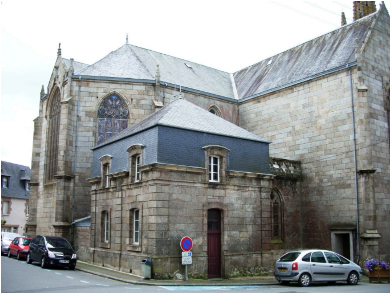
Landivisiau, église paroissiale Saint-Thuriau : sacristie, détail