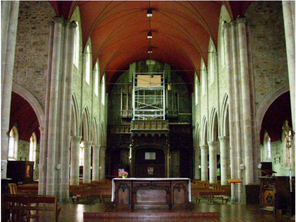
Landivisiau, église paroissiale Saint-Thuriau : vue axiale ouest