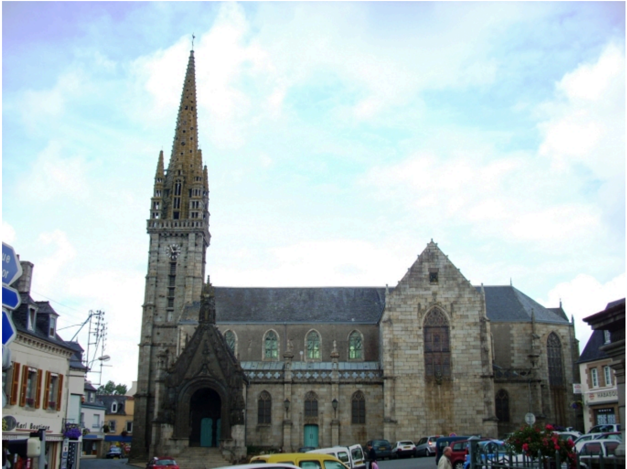
Landivisiau, église paroissiale Saint-Thuriau : élévation sud