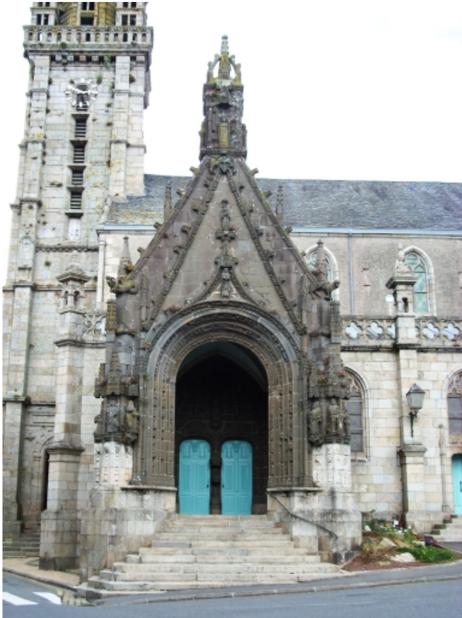
Landivisiau, église paroissiale Saint-Thuriau : porche sud, détail