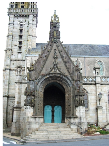
Landivisiau, église paroissiale Saint-Thuriau : porche sud, détail