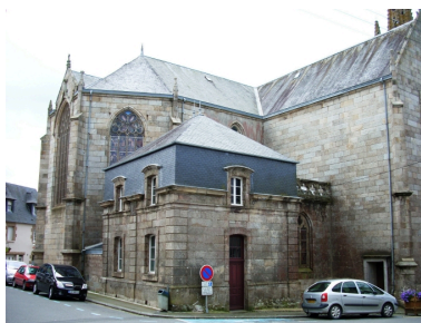
Landivisiau, église paroissiale Saint-Thuriau : sacristie, détail IVR53_20082906505NUCA