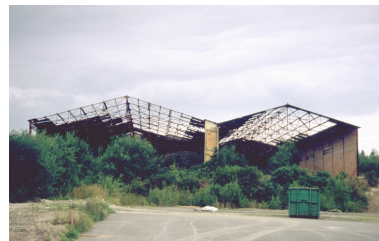
Atelier de fabrication en friche, vue générale sud. IVR53_19983505083ZA