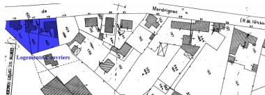
Extrait cadastral : 1980 AE (logements d'ouvriers).