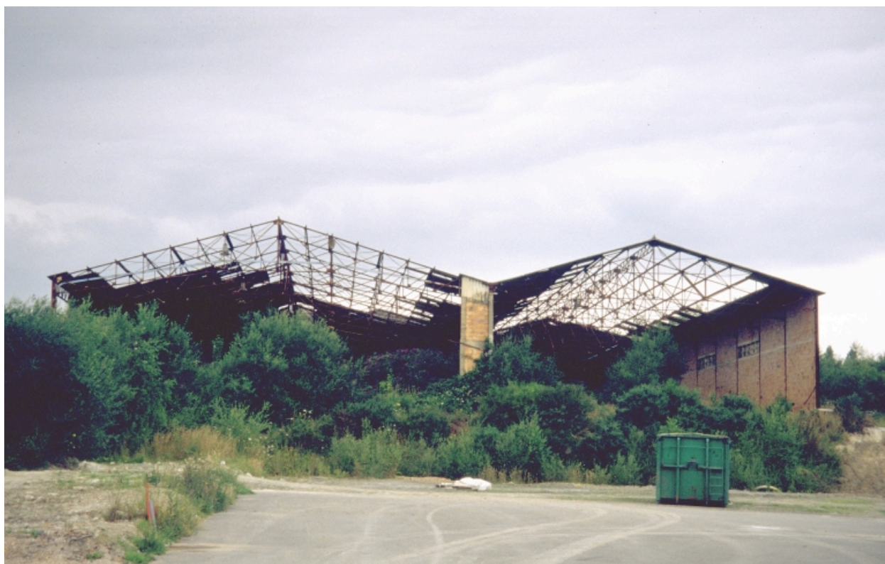
Atelier de fabrication en friche, vue générale sud.