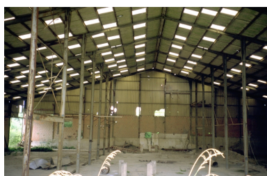
Atelier de fabrication, vue intérieure (colonnes et charpente métallique).