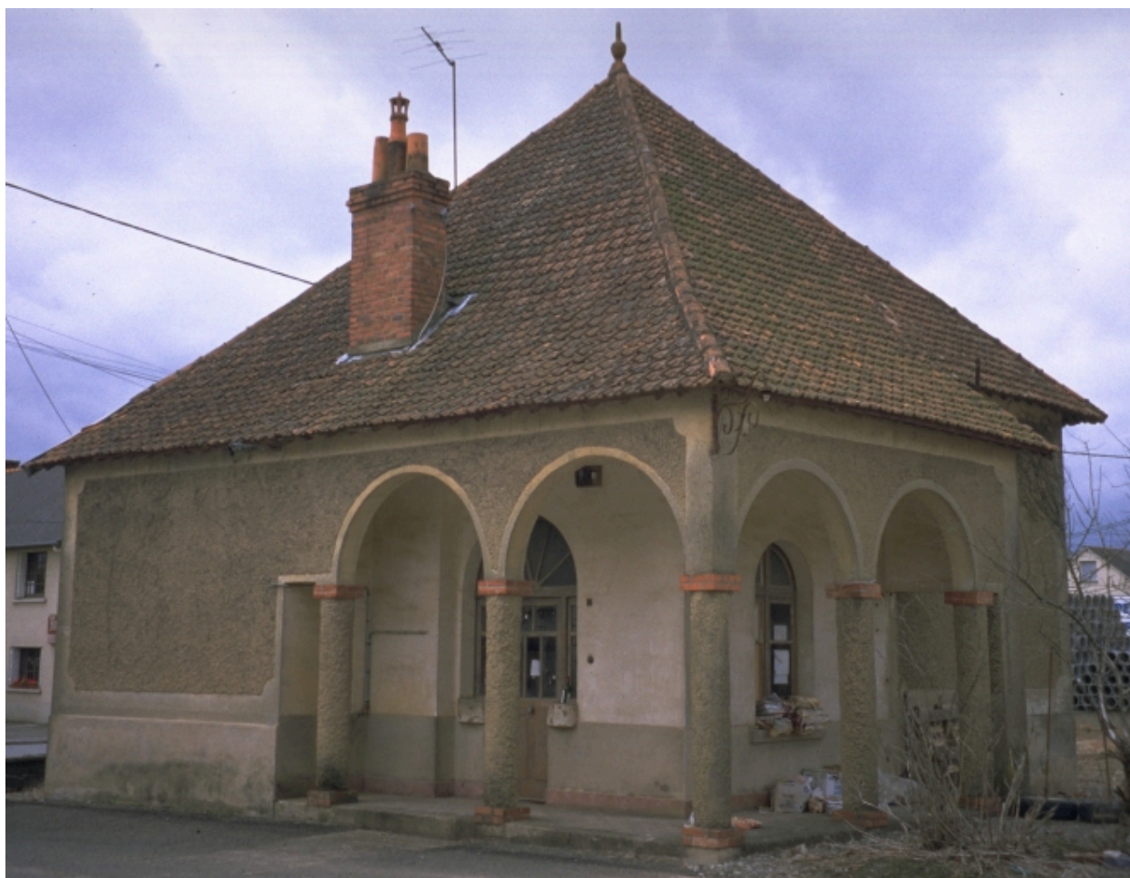
Conciergerie située à l'entrée du site.