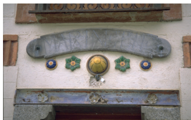
Logement d'ouvriers caractérisé par la présence d'un décor en céramique polychrome, qui surmonte la porte d'entrée.