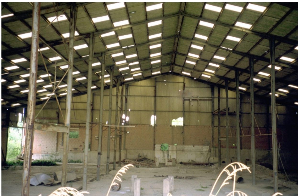
Atelier de fabrication, vue intérieure (colonnes et charpente métallique).