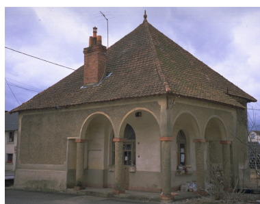
Conciergerie située à l'entrée du site. IVR53_19993502842ZA