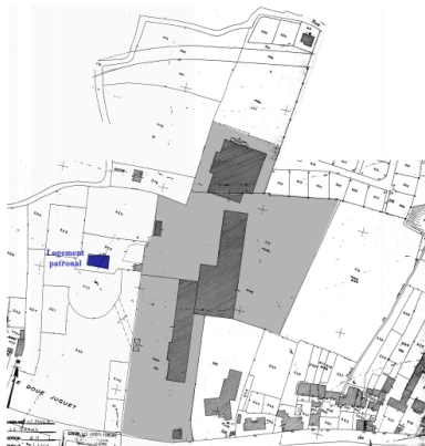
Extrait cadastral : 1980 sections AE et AH fusionnées. IVR53_20023518996NUC