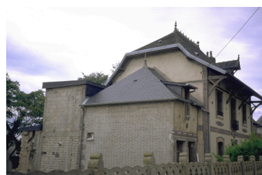
Logement d'ouvriers. IVR53_19983505085ZA