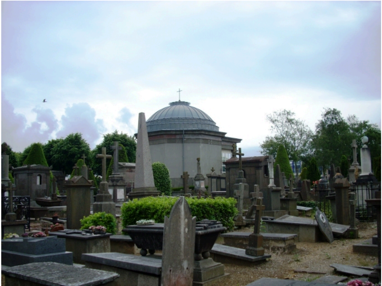
Chapelle du cimetière Saint-Martin : vue générale nord-est