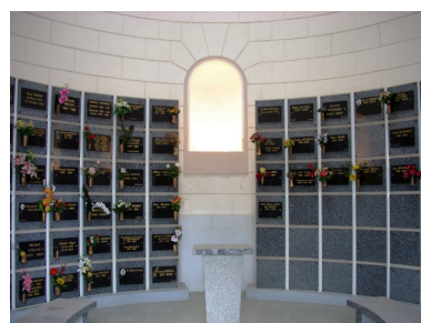
Chapelle du cimetière Saint-Martin : vue axiale est IVR53_20082906008NUCA