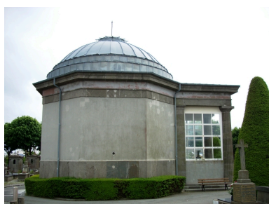
Chapelle du cimetière Saint-Martin : élévation nord IVR53_20082906006NUCA