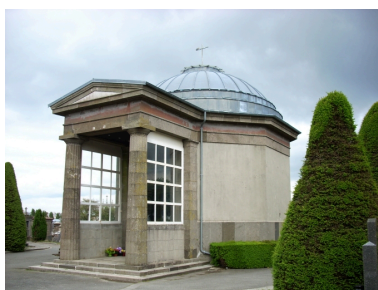
Chapelle du cimetière Saint-Martin : vue générale sud-ouest