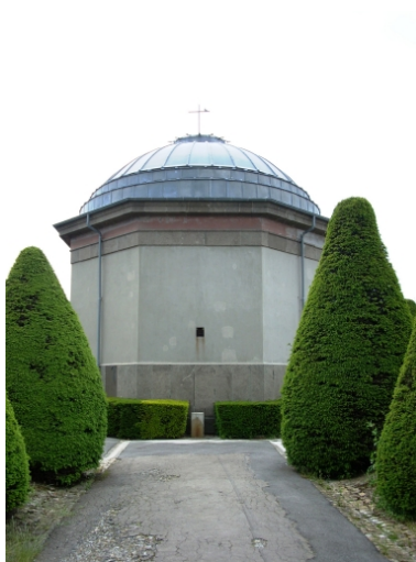
Chapelle du cimetière Saint-Martin : élévation est IVR53_20082906007NUCA