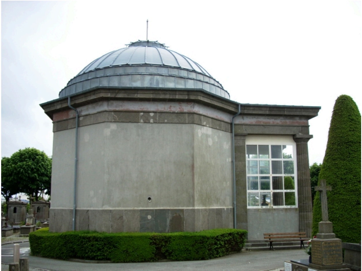
Chapelle du cimetière Saint-Martin : élévation nord