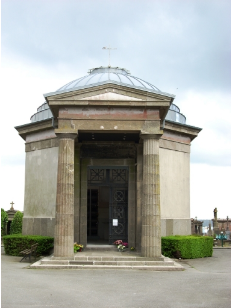
Chapelle du cimetière Saint-Martin : élévation ouest