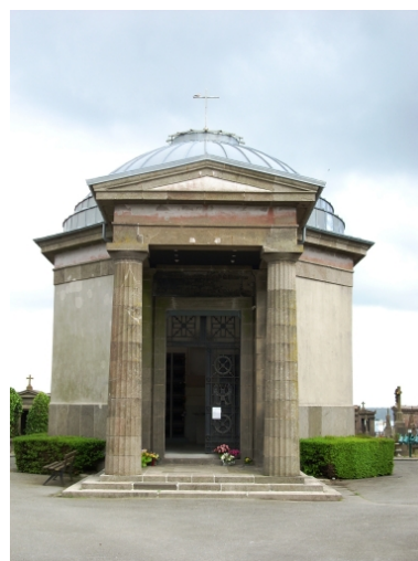
Chapelle du cimetière Saint-Martin : élévation ouest IVR53_20082906005NUCA