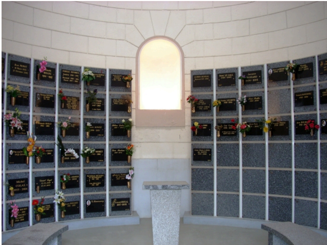
Chapelle du cimetière Saint-Martin : vue axiale est