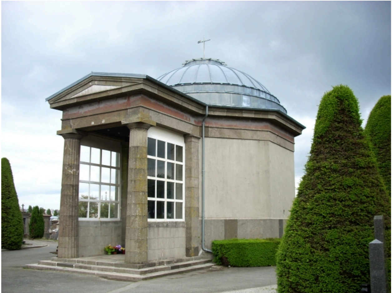
Chapelle du cimetière Saint-Martin : vue générale sud-ouest