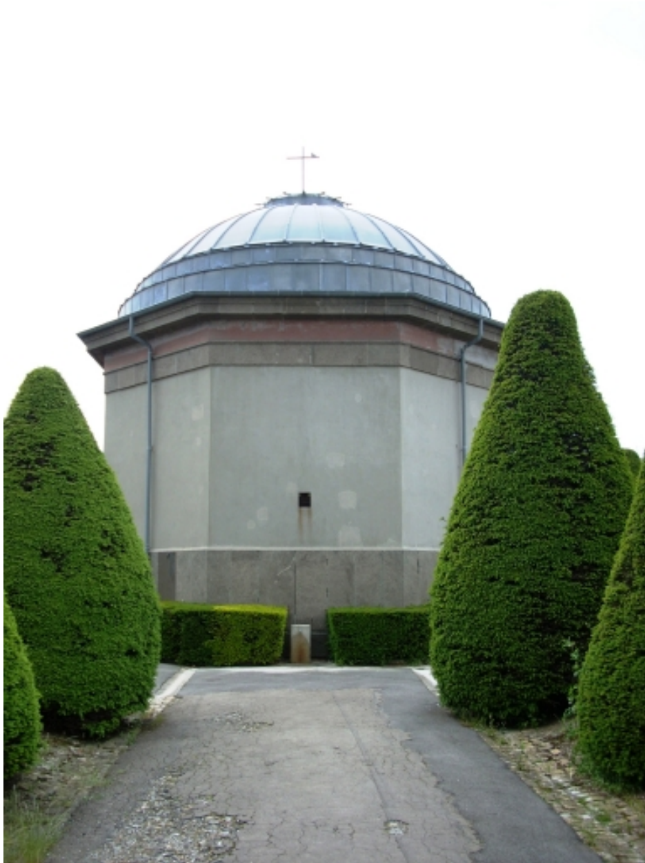
Chapelle du cimetière Saint-Martin : élévation est