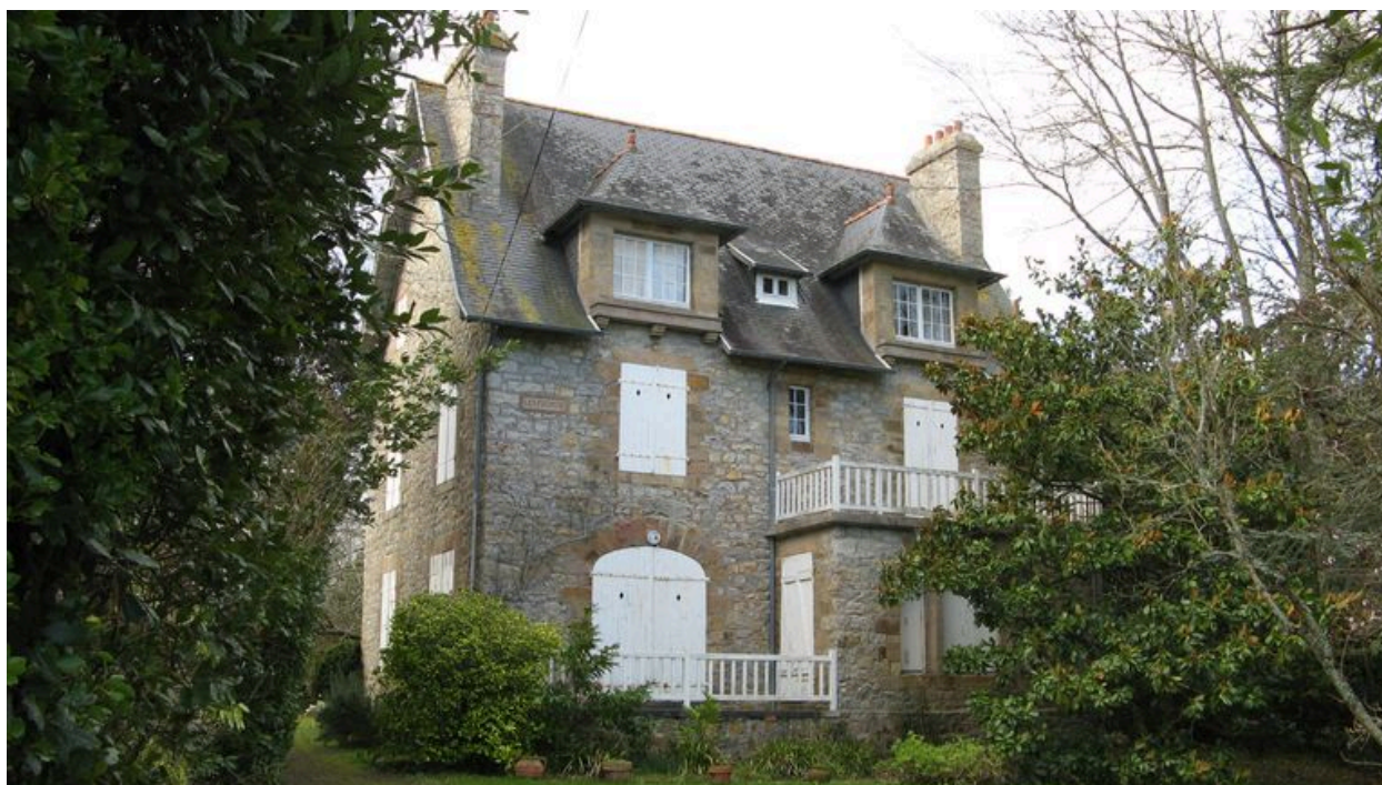
Vue générale de la villa Les Fuchsias