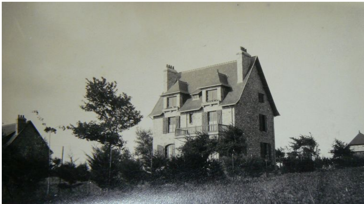
Vue ancienne de la villa Les Fuchsias par Jacqueline Péchin