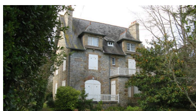
Vue générale de la villa Les Fuchsias