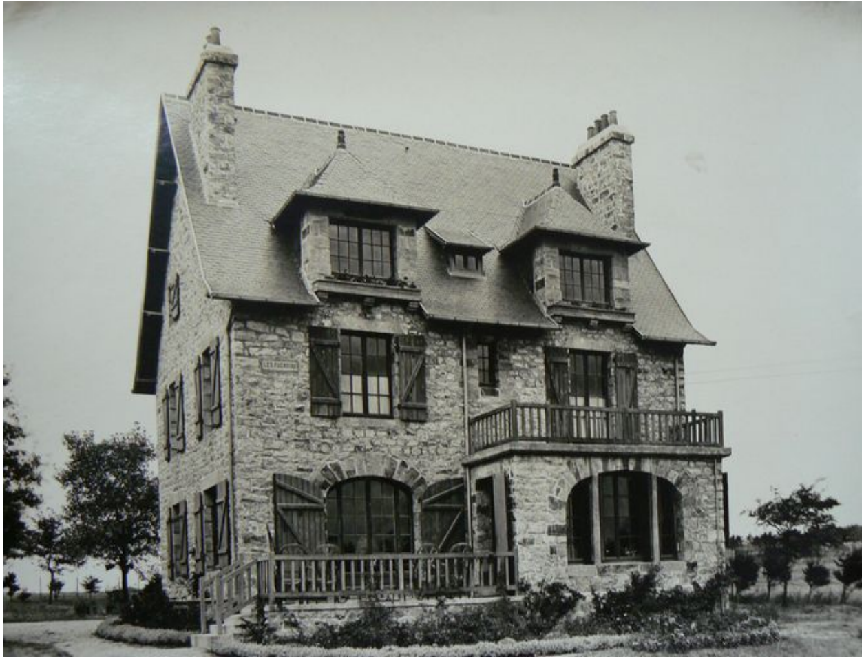
Vue ancienne de la villa Les Fuchsias par Jacqueline Péchin