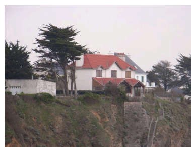
Villa Ker-Jo