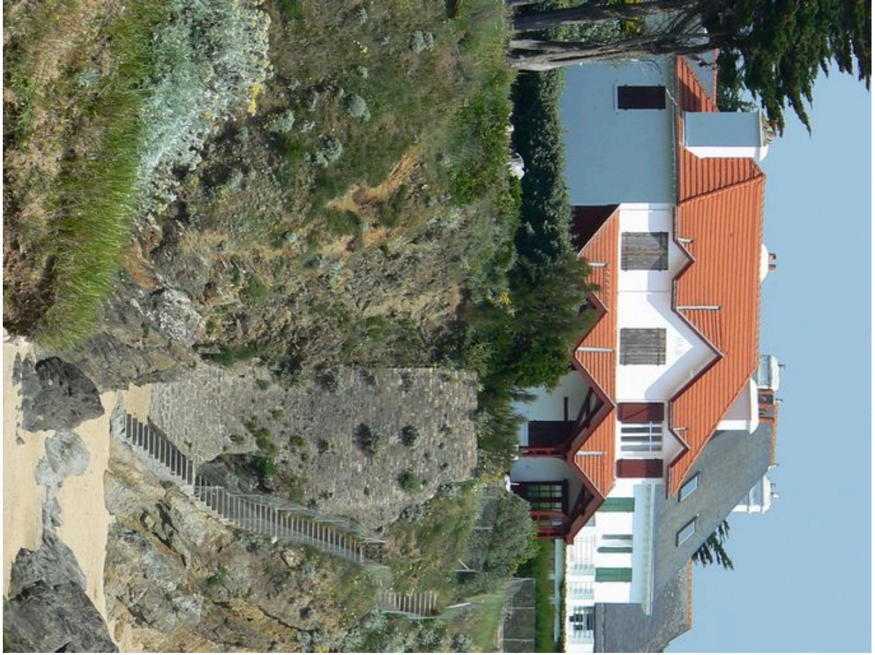
Villa Ker-Jo et son escalier descendant sur la plage des Grands-Sables