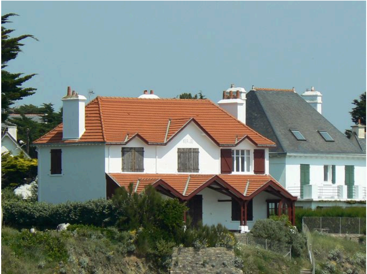
Vue générale de la villa Ker-Jo