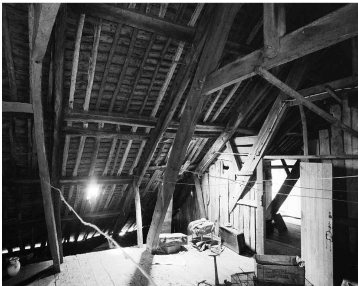
Maison : charpente et grenier (état en 1994)