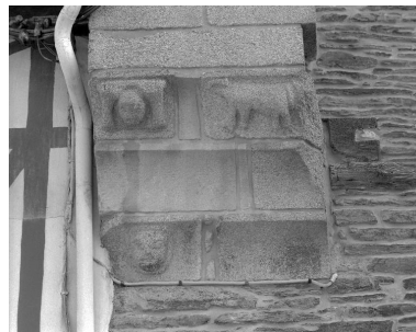
Maison, élévation sur rue, partie supérieure : décor sculpté dans le granite (état en 1994)