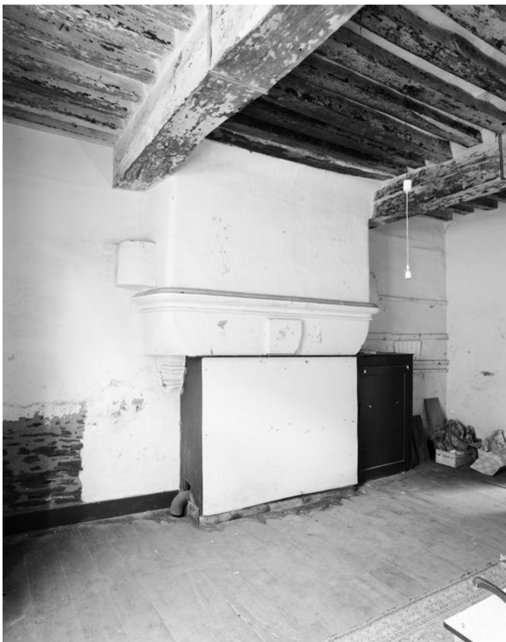
Maison, rez-de-chaussée, pièce nord : cheminée (état en 1994)