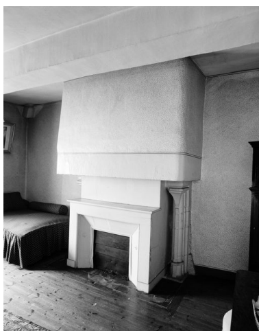
Maison, premier étage, pièce nord : cheminée (état en 1994)