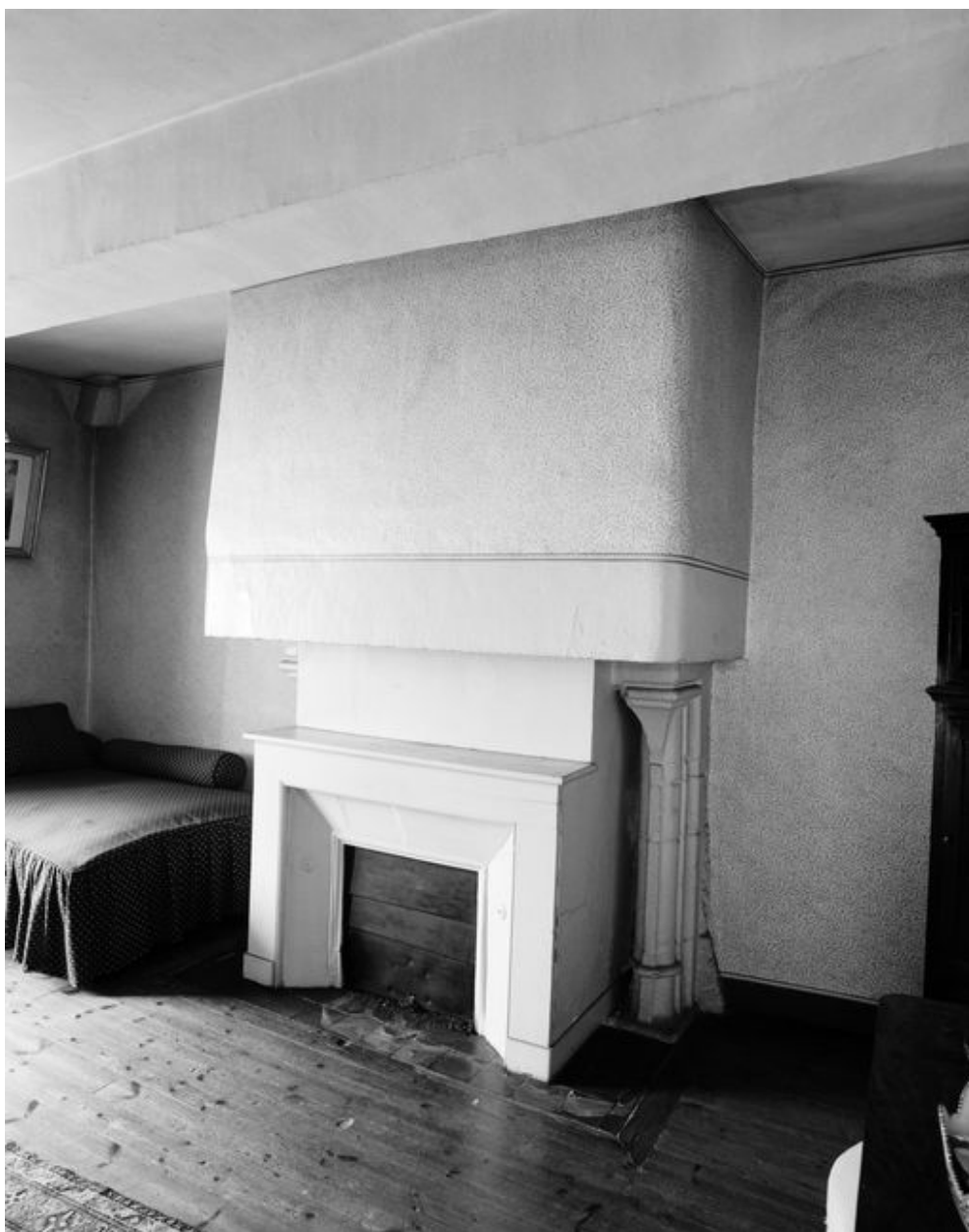
Maison, premier étage, pièce nord : cheminée (état en 1994)