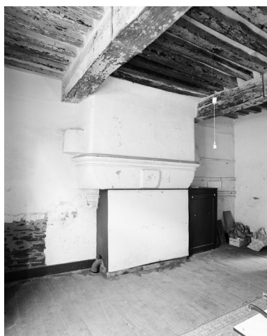
Maison, rez-de-chaussée, pièce nord : cheminée (état en 1994) IVR53_19945600638X