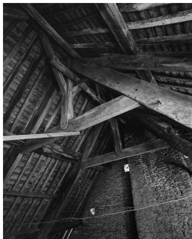
Maison : charpente et grenier (état en 1994) IVR53_19945600641X