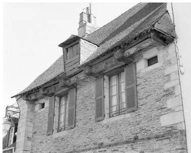
Maison, élévation sur rue : décor de la sablière supérieure (état en 1994)