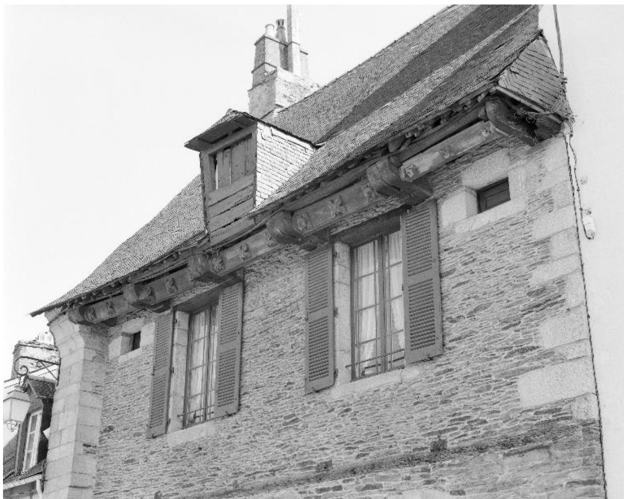
Maison, élévation sur rue : décor de la sablière supérieure (état en 1994)