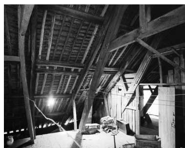
Maison : charpente et grenier (état en 1994), IVR53_19945600640X