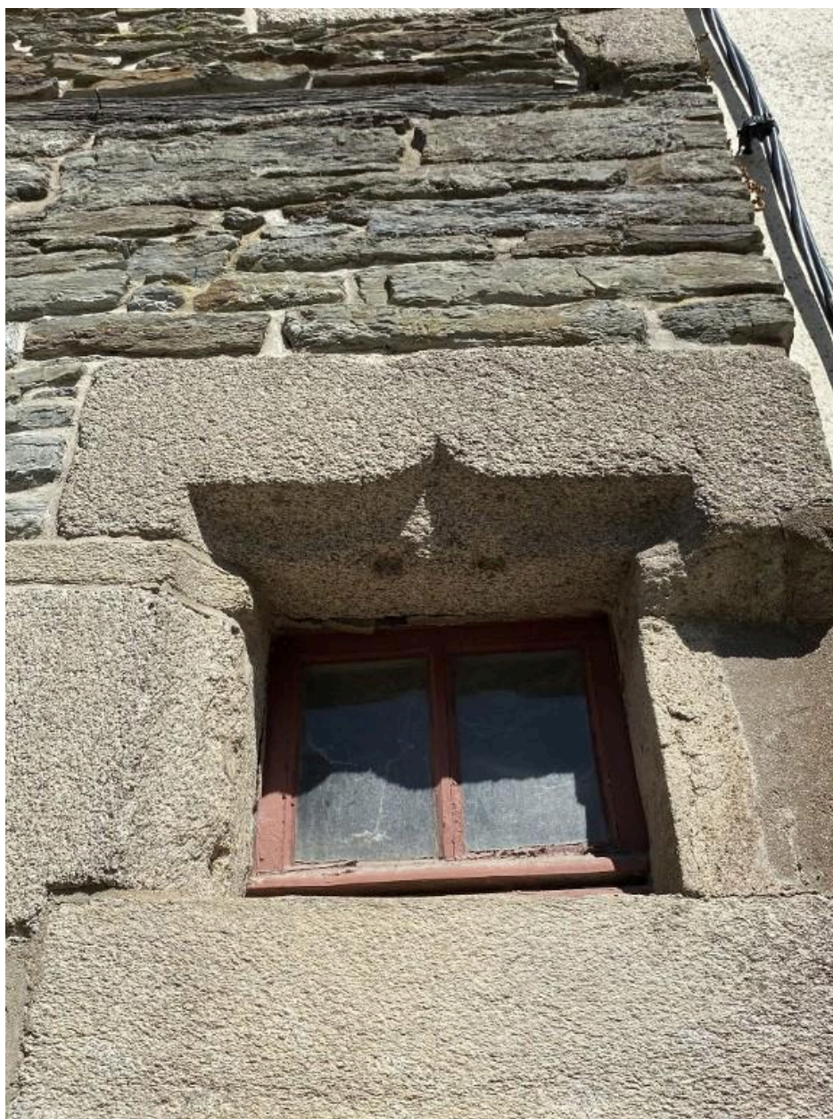
Linteau en accolade, détail, façade ouest