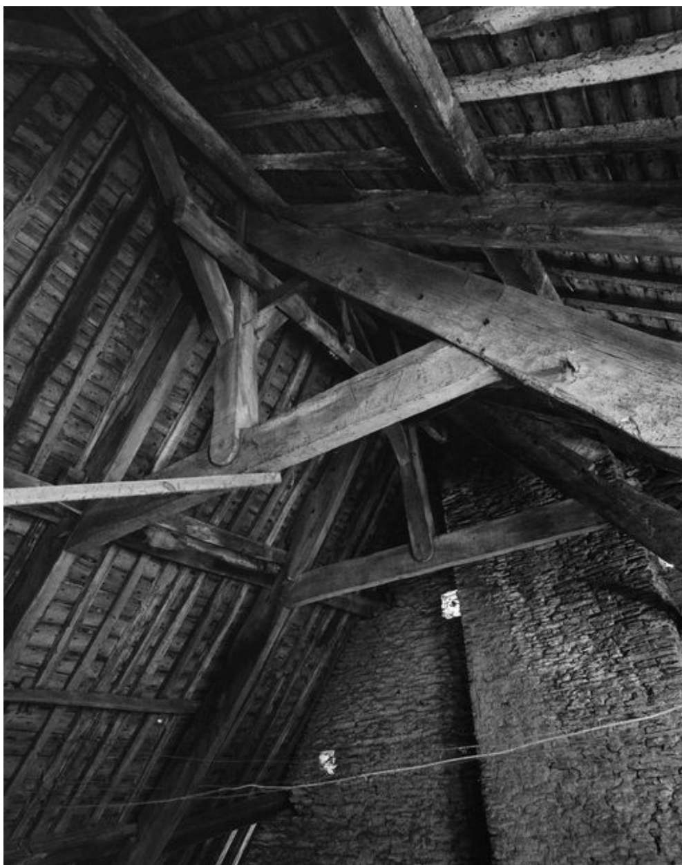
Maison : charpente et grenier (état en 1994)