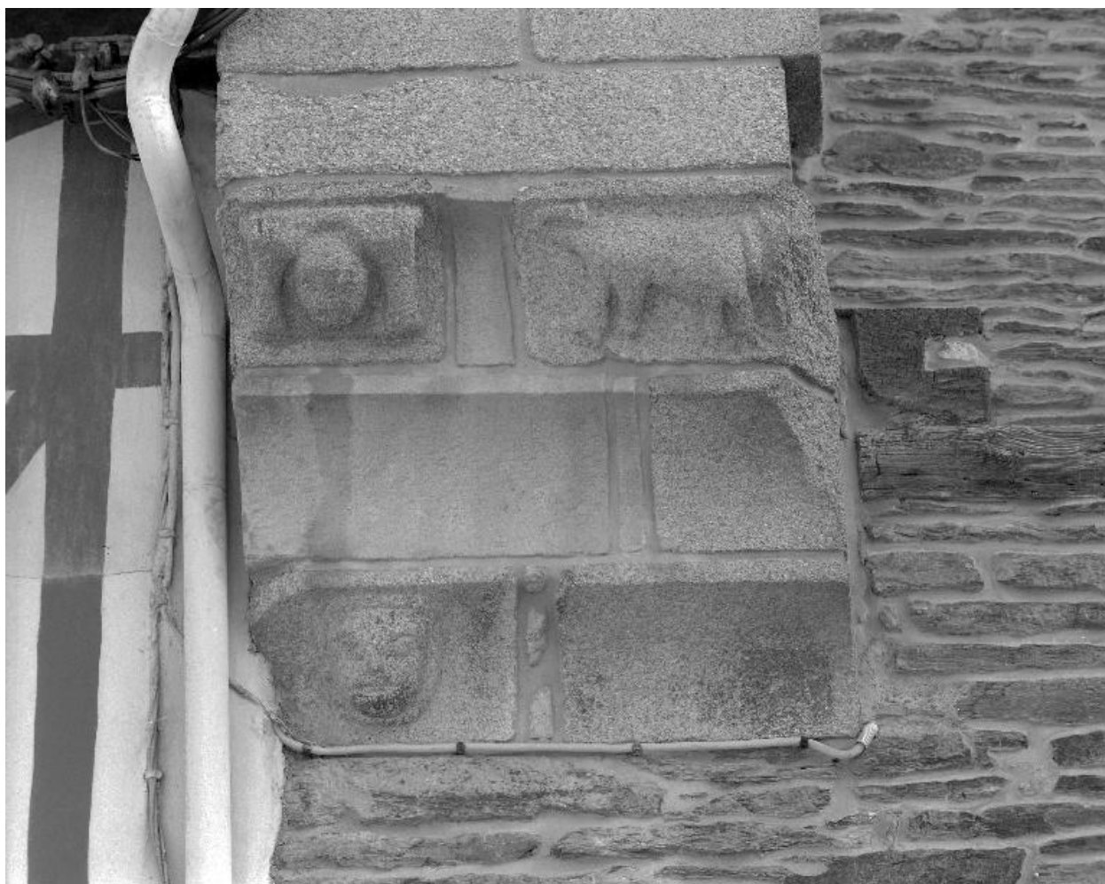
Maison, élévation sur rue, partie supérieure : décor sculpté dans le granite (état en 1994)