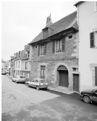
Maison, élévation sur rue : vue générale prise de l'ouest (état en 1994) IVR53_19945600522X