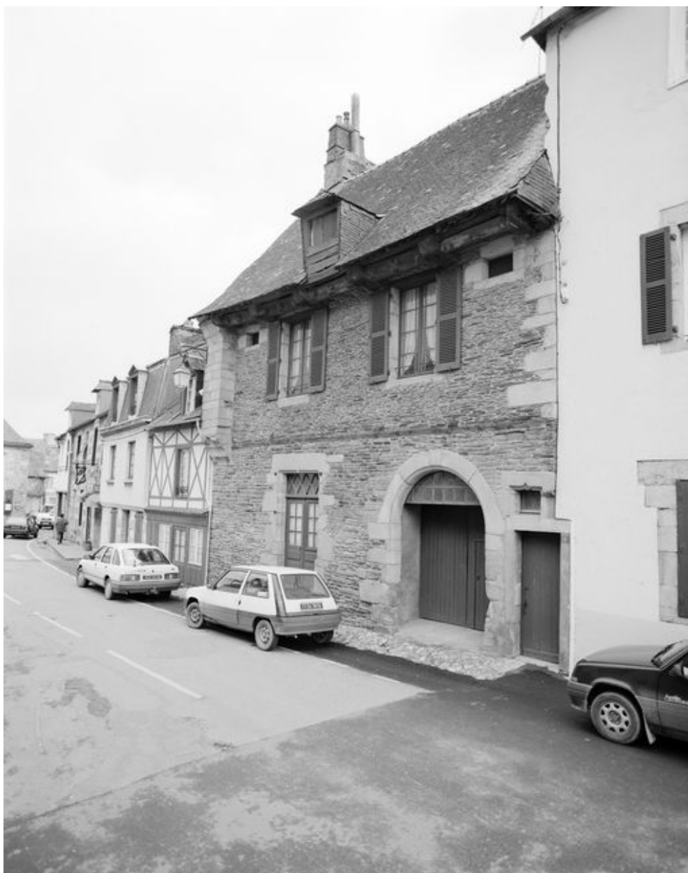
Maison, élévation sur rue : vue générale prise de l'ouest (état en 1994)