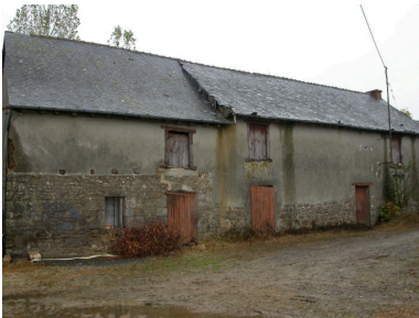
Vue générale IVR53_20053518846NUCA