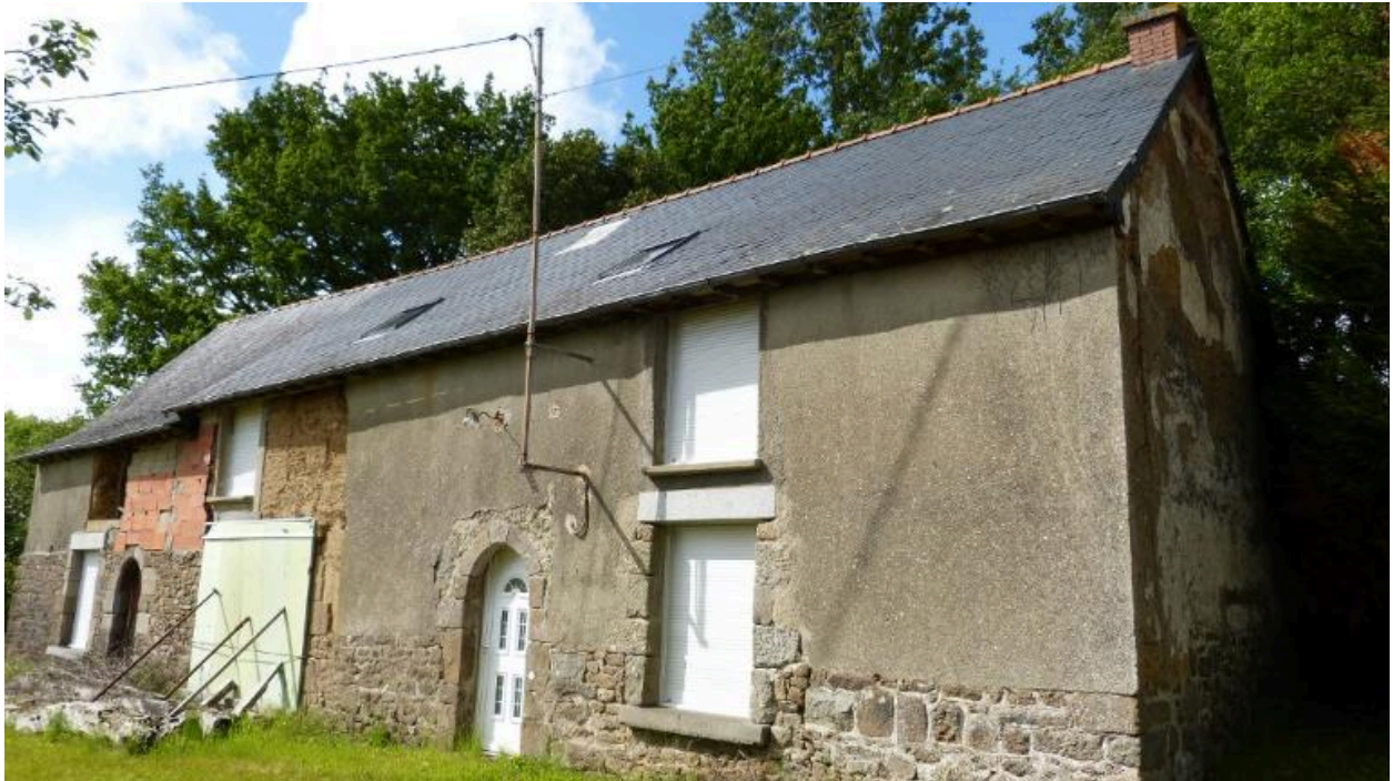
Vue générale sud est