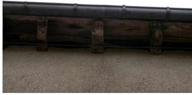
Détail de la corniche de la partie ouest IVR53_20053518849NUCA