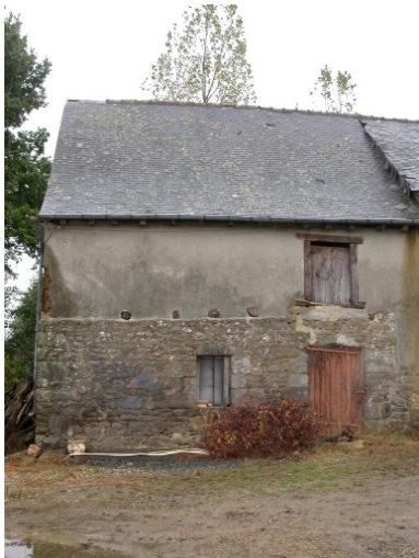
Partie ouest IVR53_20053518847NUCA