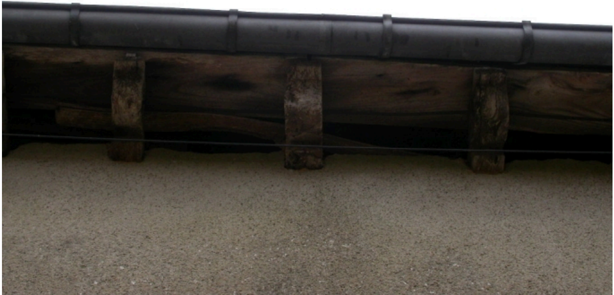
Détail de la corniche de la partie ouest