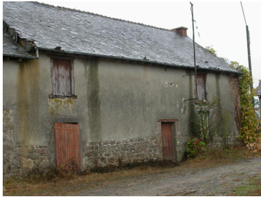
Partie est IVR53_20053518848NUCA