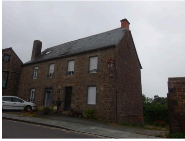
Vue de la façade est