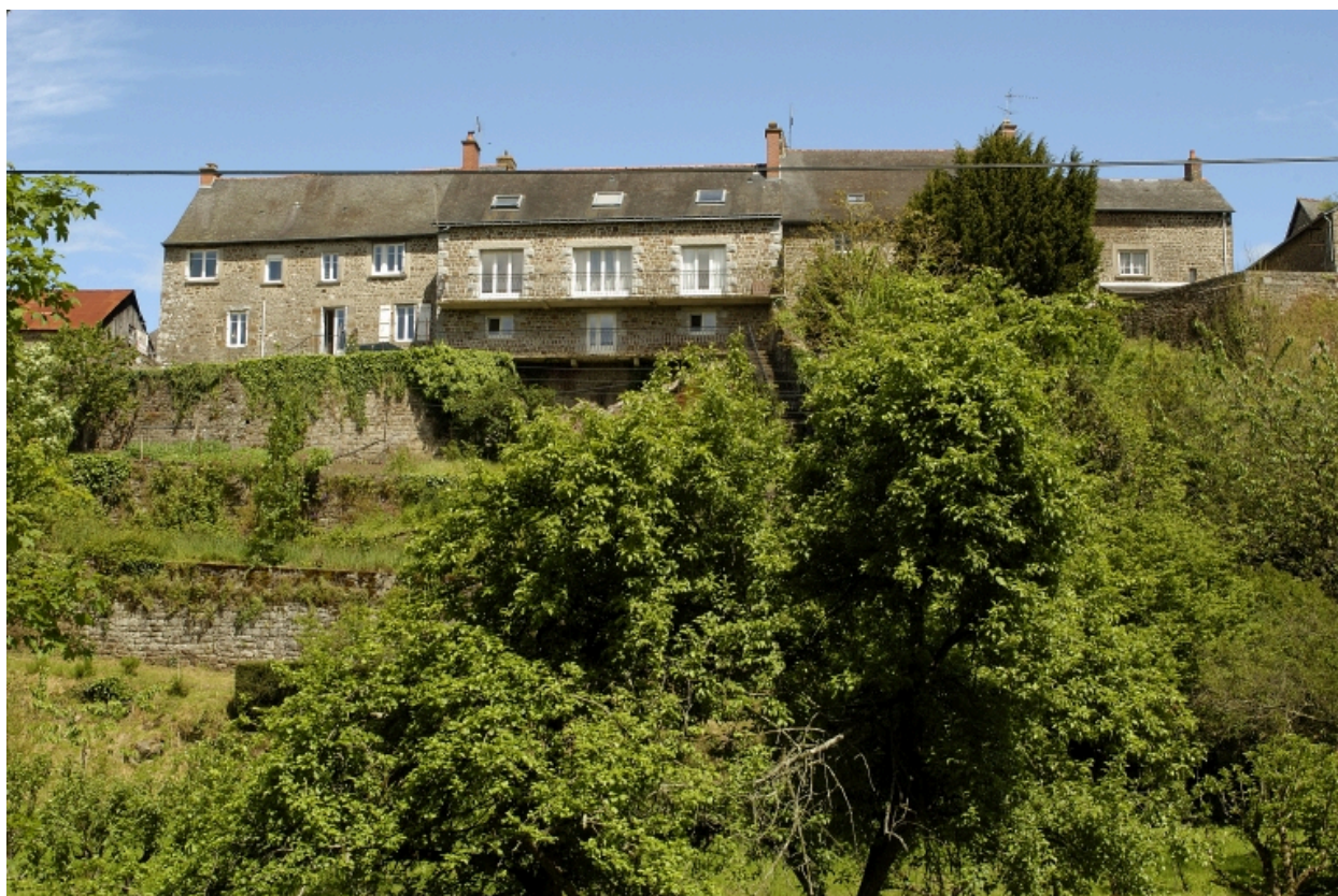
Vue de la façade postérieure