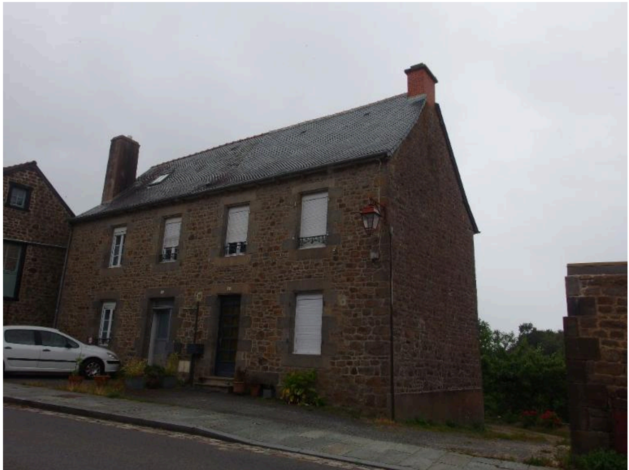
Vue de la façade est