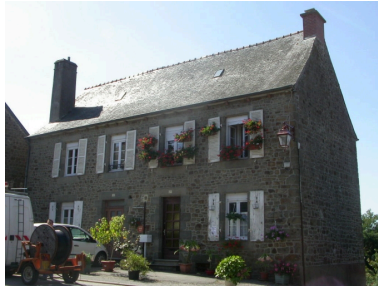
Vue générale nord-est IVR53_20053518455NUCA