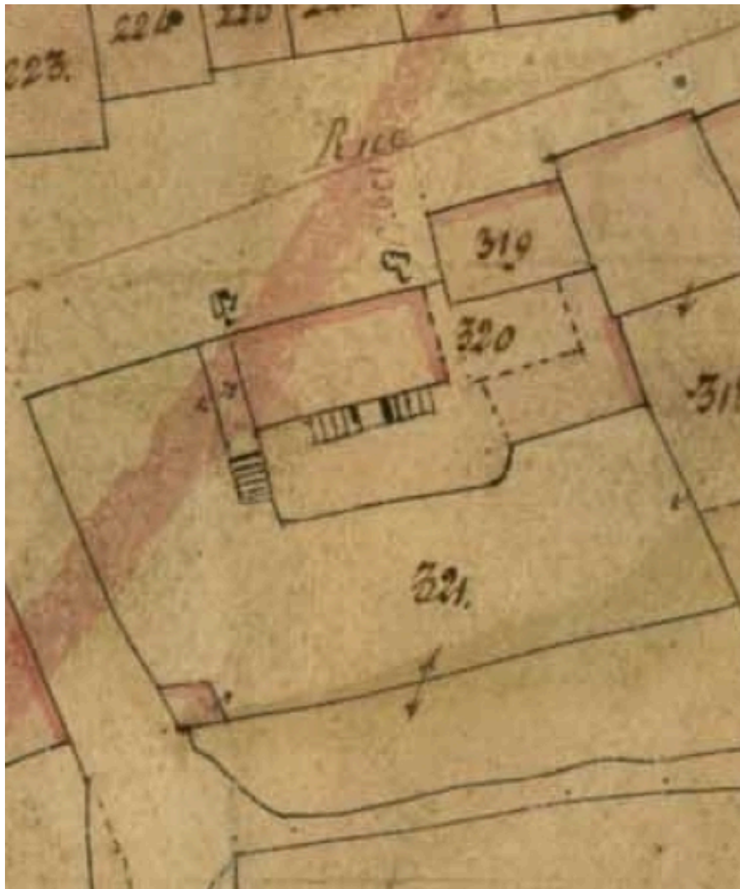
La maison sur le cadastre de 1835