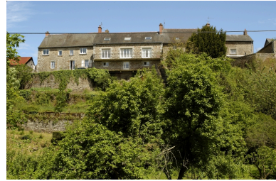
Vue de la façade postérieure IVR53_20053501698NUCA