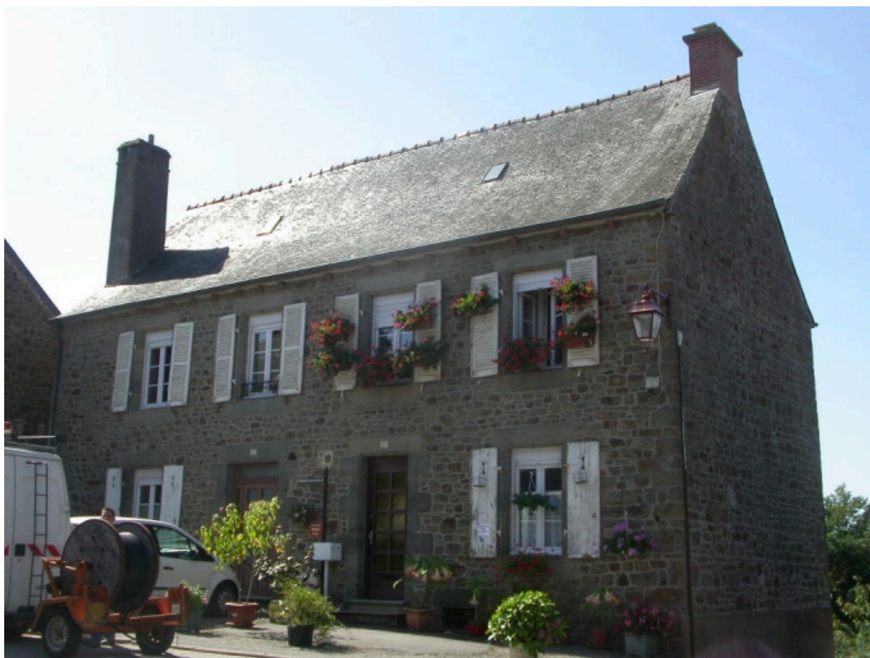
Vue générale nord-est