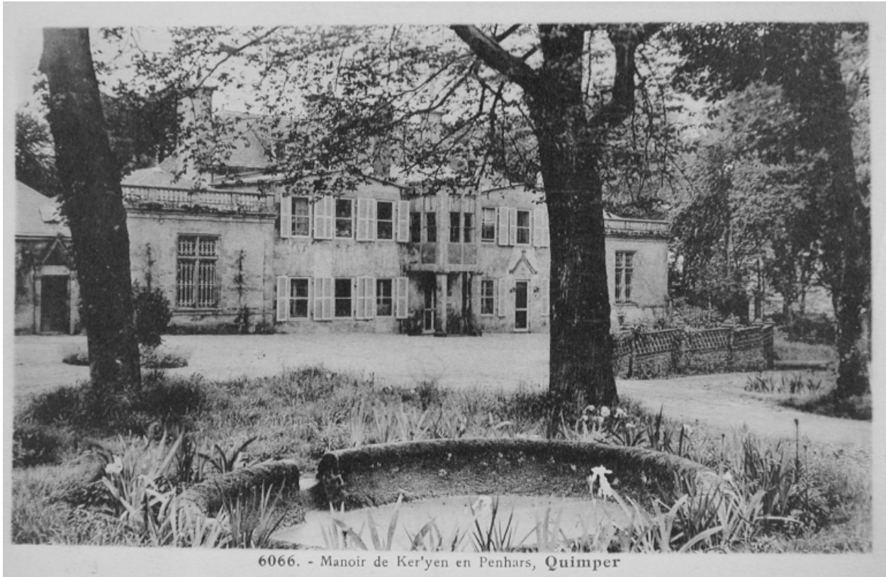
6066. - Manoir de Ker'yen en Penhars, Quimper