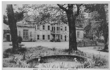
Vue générale IVR53_20032902770NUCB