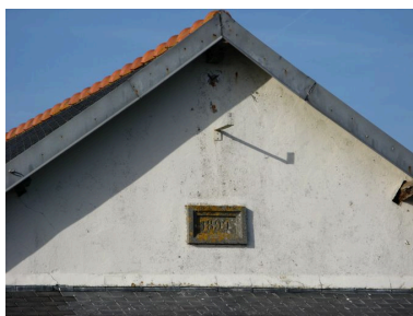
Détail d'un casernement de Lagatjar