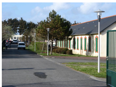
Casernements de Lagatjar