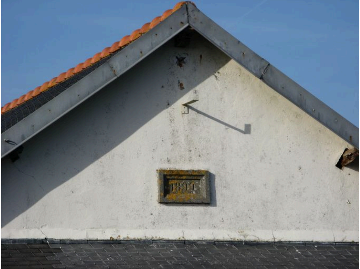
Détail d'un casernement de Lagatjar