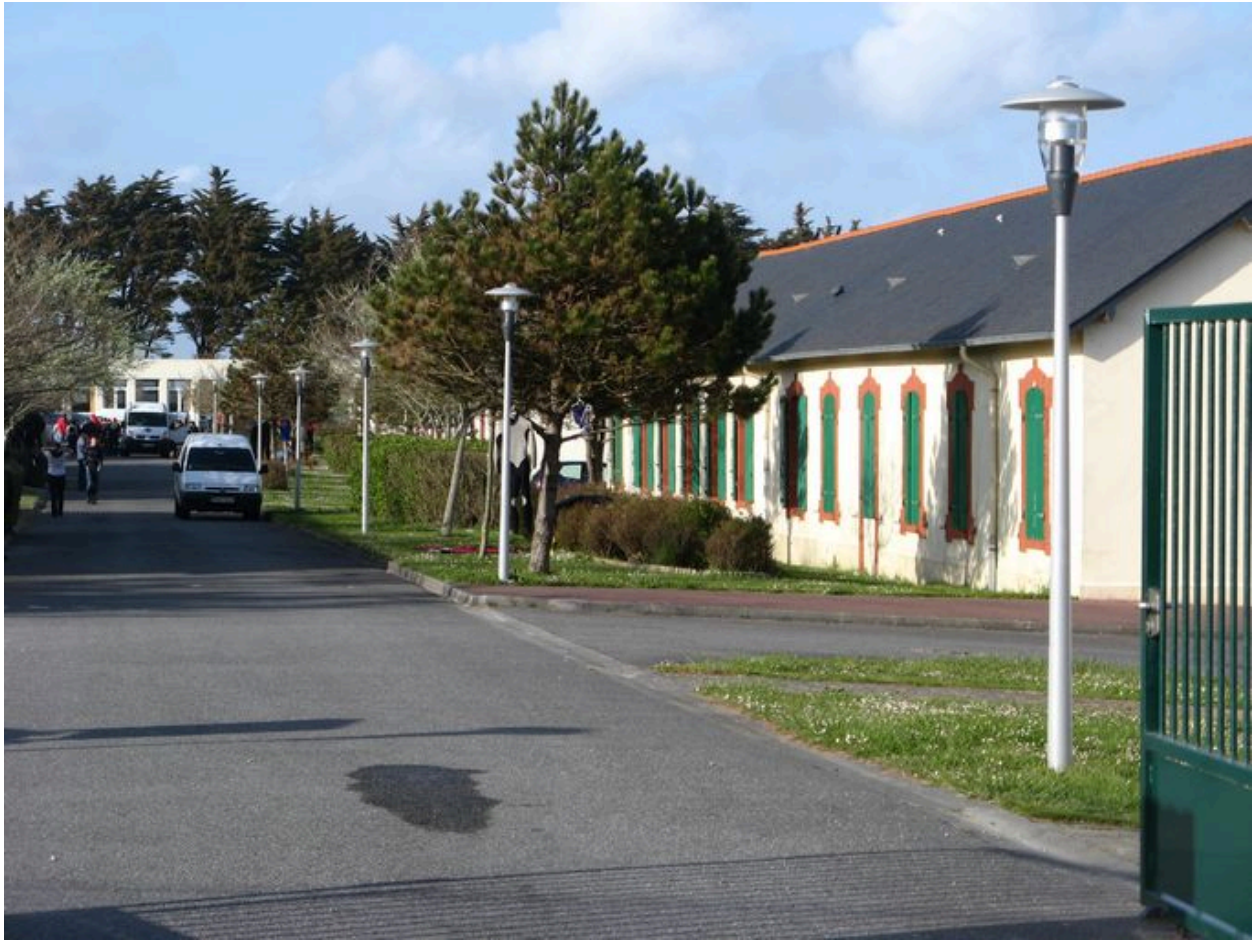
Casernements de Lagatjar