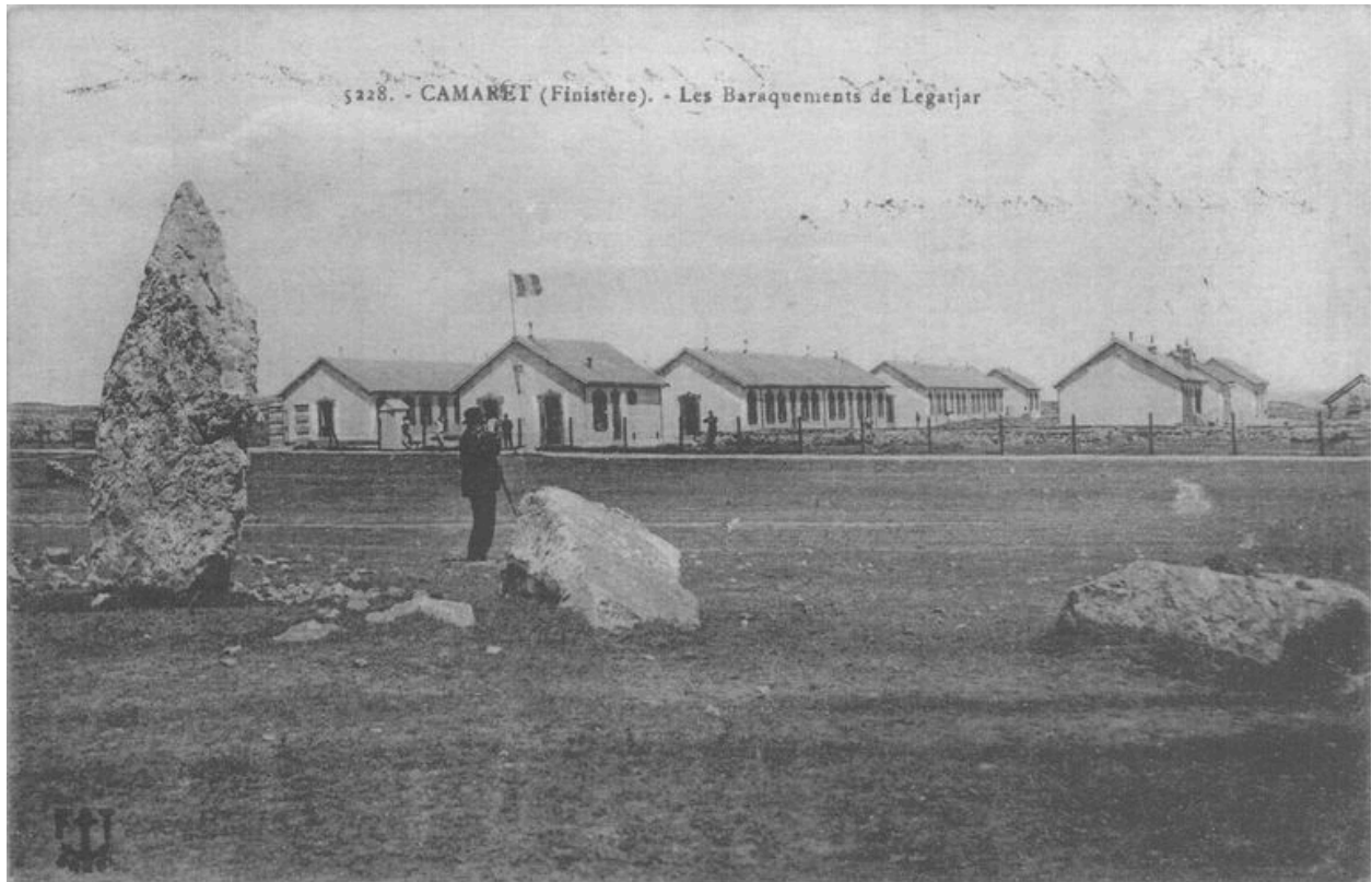
Vue ancienne des casernements de Lagatjar