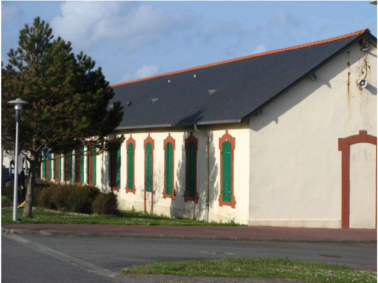
Vue générale des casernements de Lagatjar