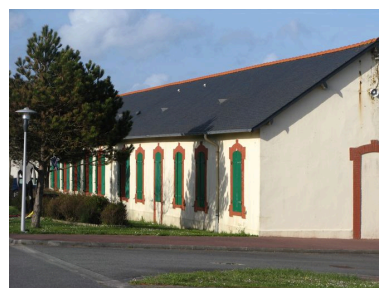
Vue générale des casernements de Lagatjar