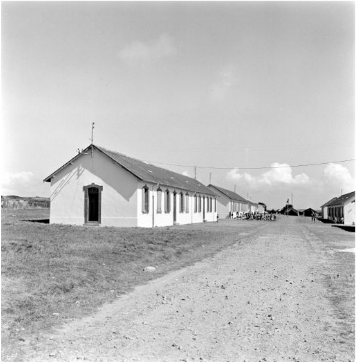
Vue ancienne des casernements de Lagatjar en 1969