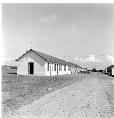
Vue ancienne des casernements de Lagatjar en 1969 IVR53_20072908588NUC