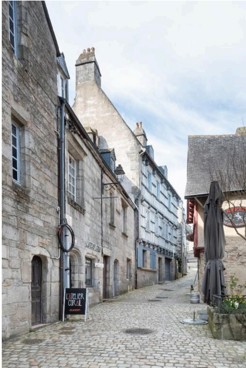
Maison à gouttereau sur rue dont les deux étages sont en pan de bois en encorbellement.