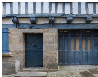
La porte d'entrée centrale s'ouvre dans un rez-de- chaussée maçonné et remanié. IVR53_20252900586NUCA