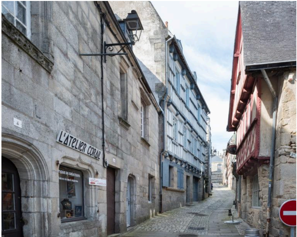
Maisons en pan de bois conservées rue du Lycée à Quimper.