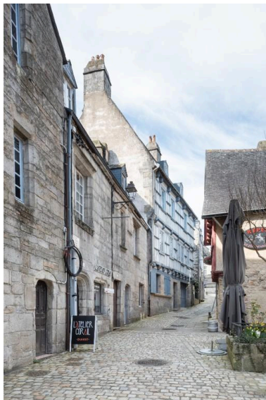
Maison à gouttereau sur rue dont les deux étages sont en pan de bois en encorbellement. IVR53_20252900514NUCA