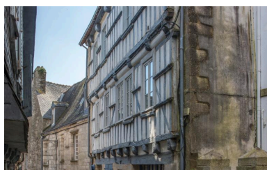
L'encorbellement de l'étage repose sur des solives débordantes.