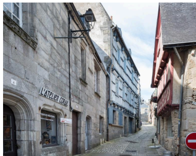
Maisons en pan de bois conservées rue du Lycée à Quimper.