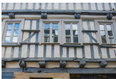
L'étage témoigne de remaniements du pan de bois, notamment au niveau des ouvertures.