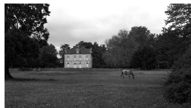
Vue générale sud. IVR53_19833500354Z

IVR53_19883500262X