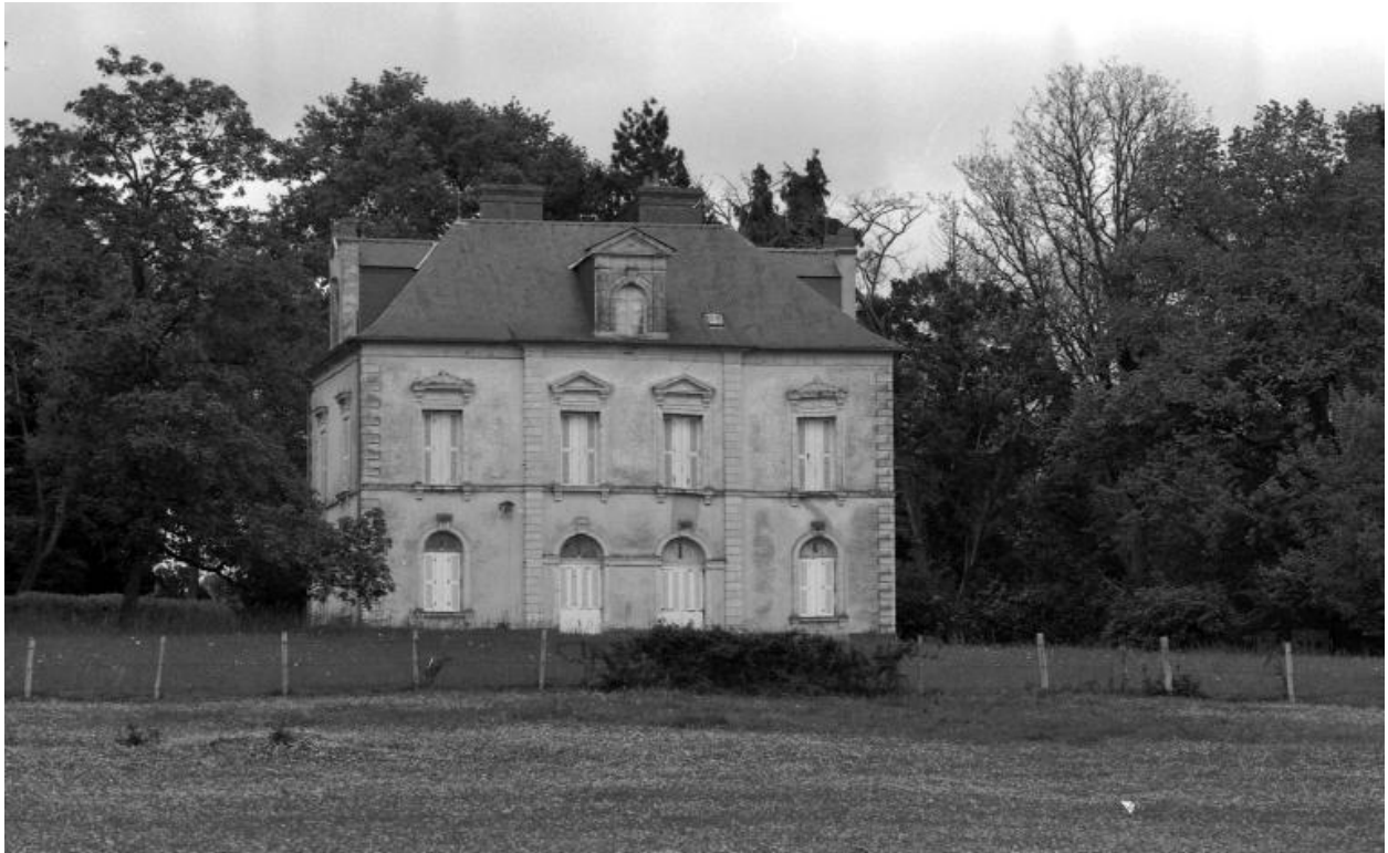
Vue générale sud.