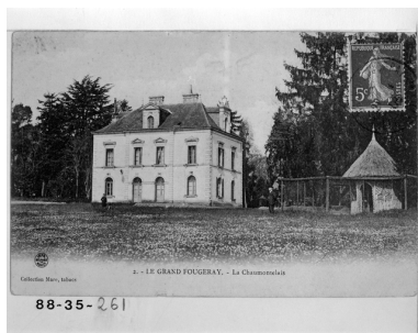
Fonds Lagrée - Carte postale ancienne. 2 - LE GRAND-FOUGERAY La Chaumontelais.

Repro. Guy Artur, Repro. Norbert Lambart IVR53_19883500261X