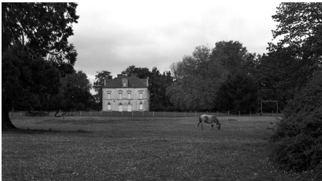
Vue générale sud.