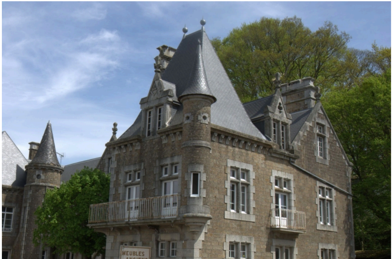
Détail de la façade