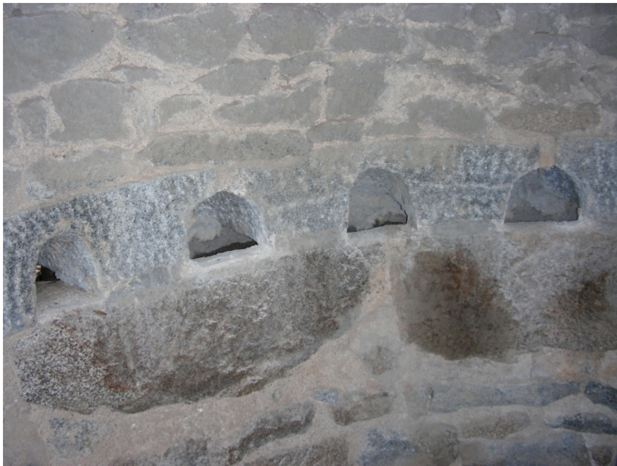
Système de gouttière en granite