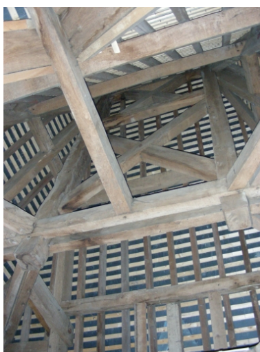
Vue de la charpente, partie sud Phot. Stéphanie Bardel