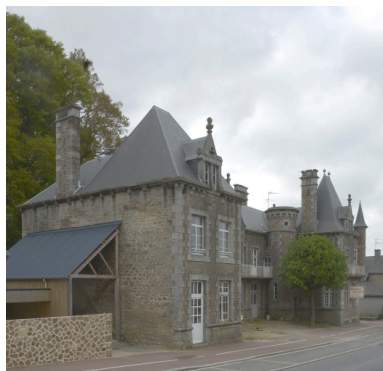
Vue du château