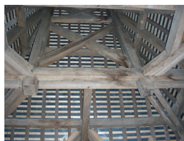
Vue de la charpente, partie sud