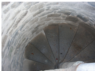
Escalier dans la tour sud IVR53_20093505685NUCA