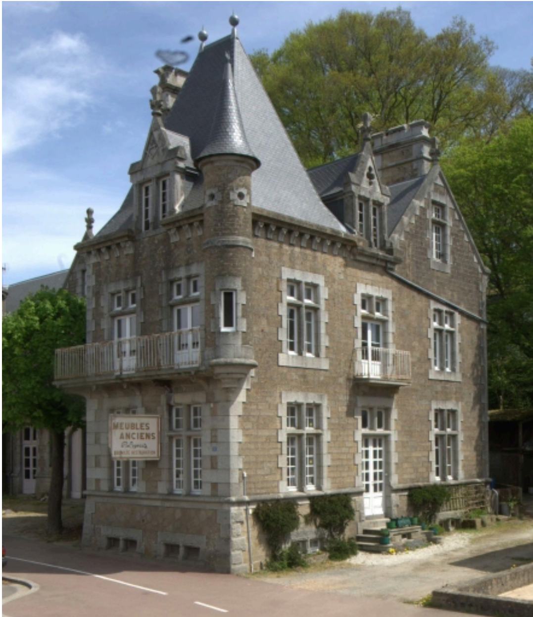
Aile sud du château