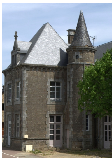
Détail de la tourelle d'escalier IVR53_20103503389NUCA