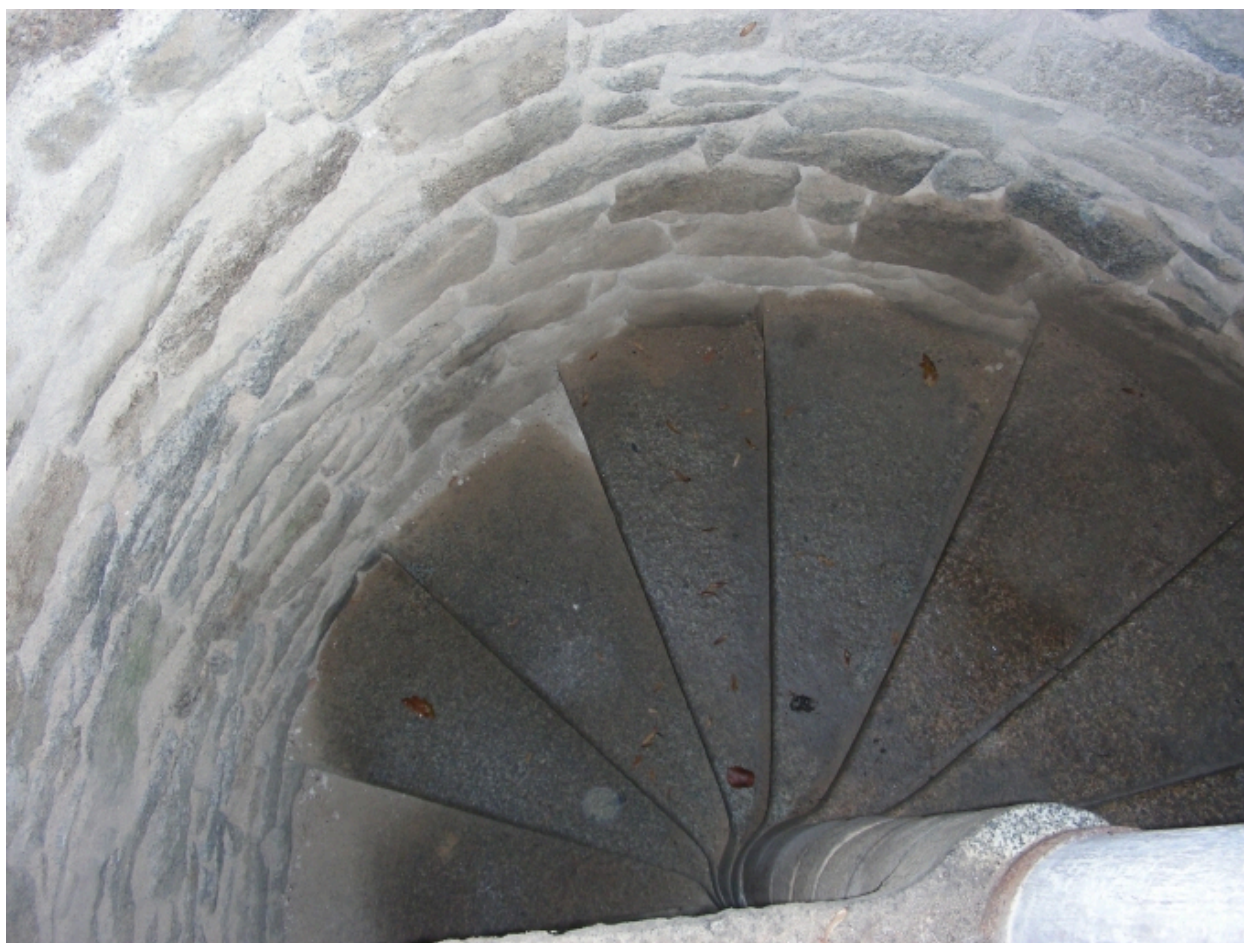
Escalier dans la tour sud