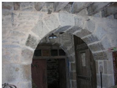
Vue de la cave IVR53_20093505876NUCA