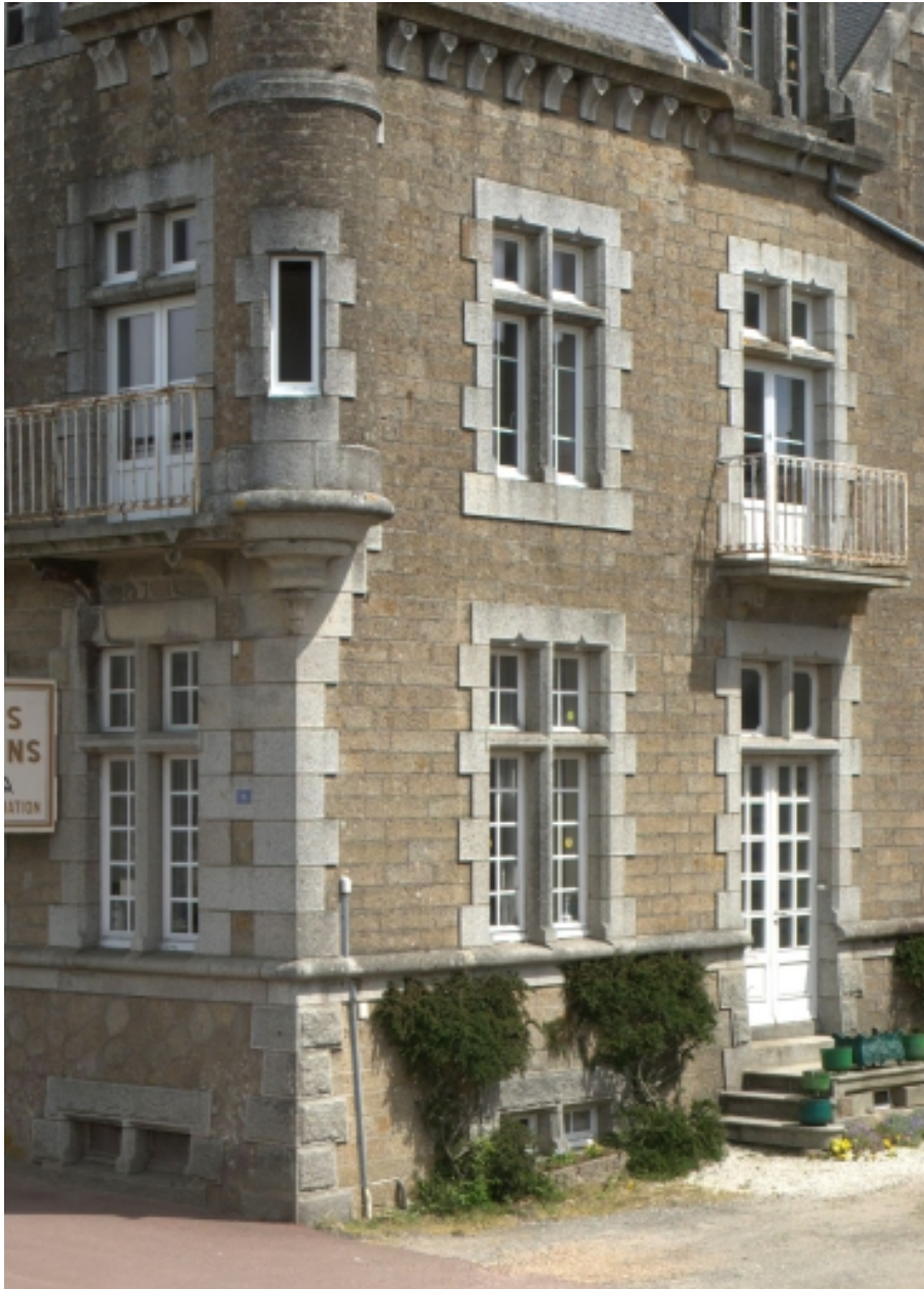
Détail des ouvertures