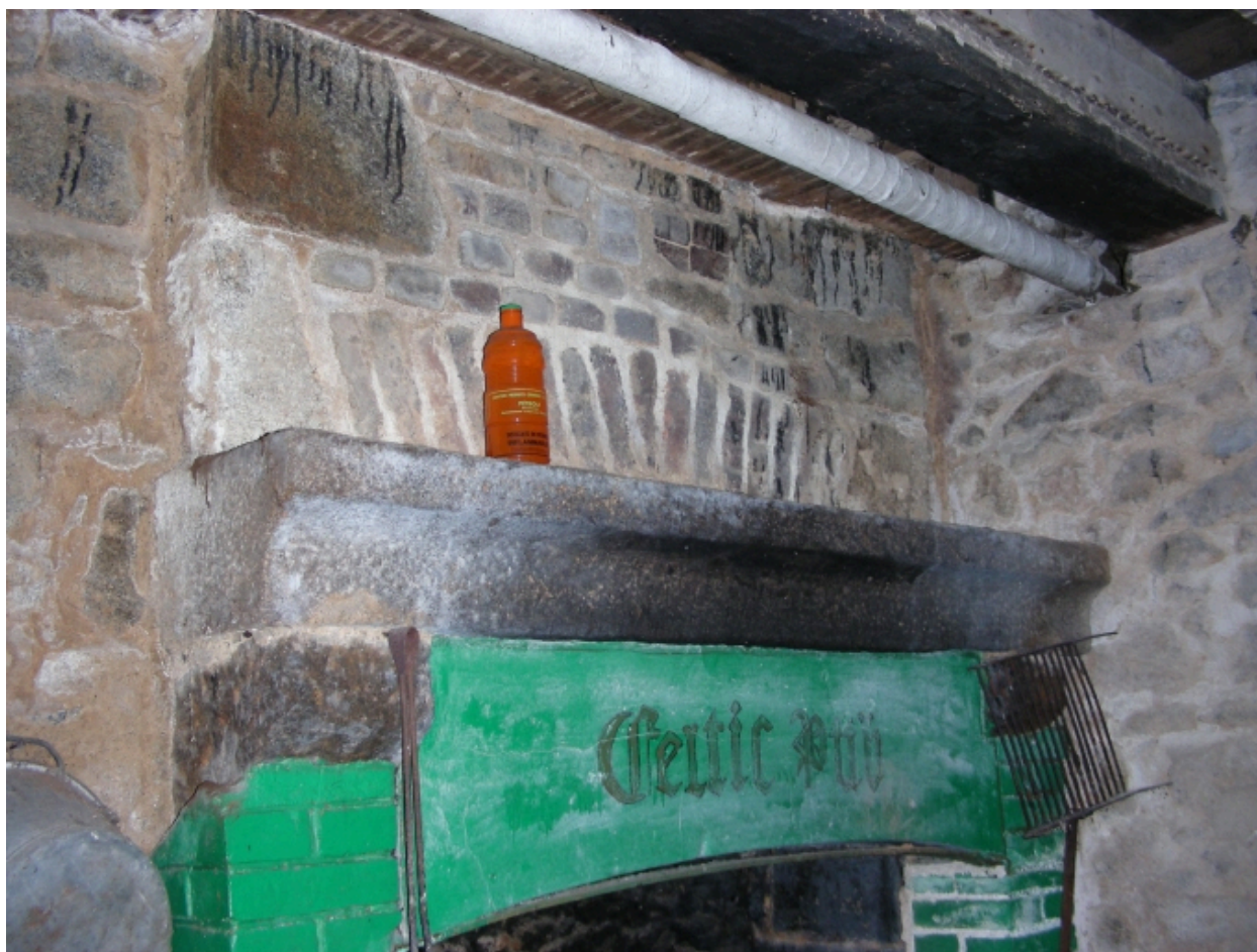
Cheminée dans la cave sous l'écurie