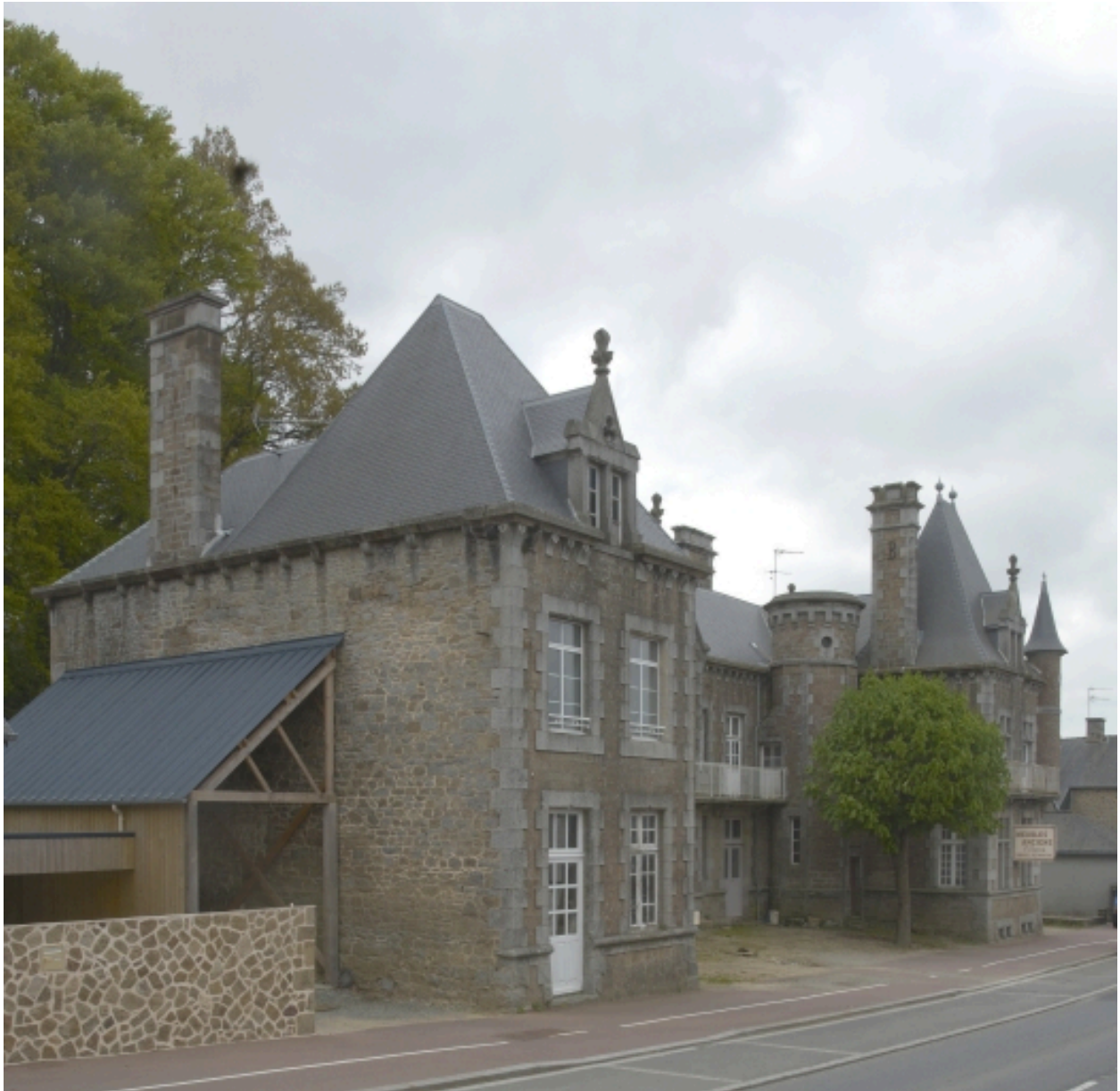
Vue du château