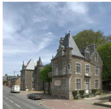
Vue générale IVR53_20103503385NUCA