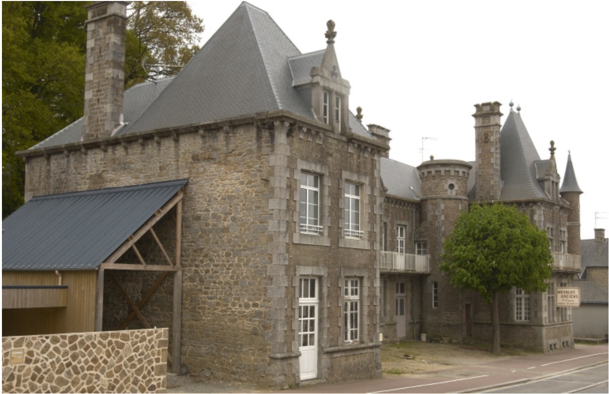
Vue générale du château