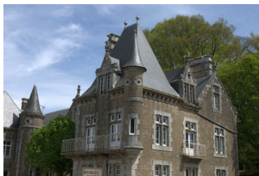
Détail de la façade IVR53_20103503387NUCA