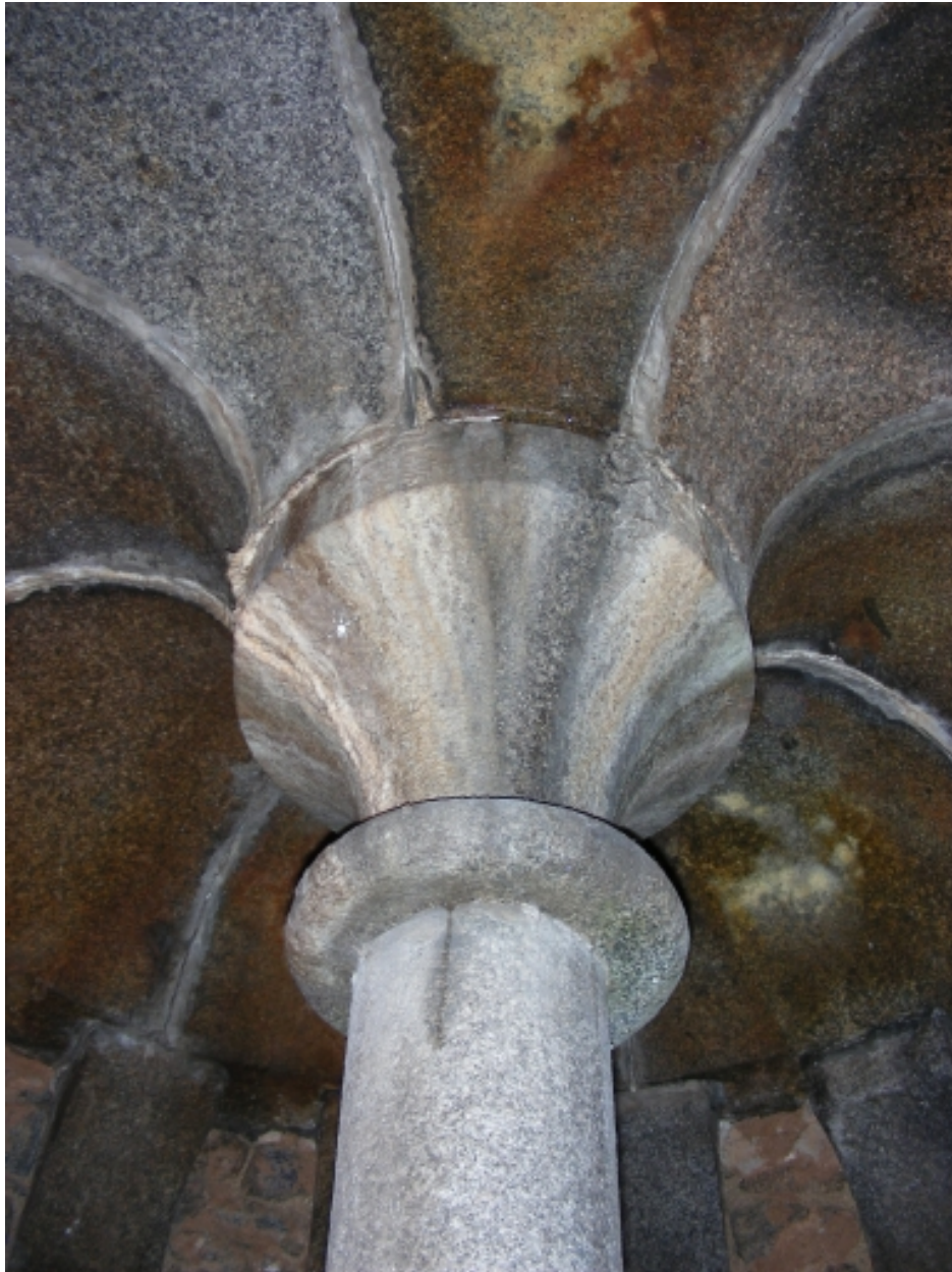
Voûte en granite dans la tour sud