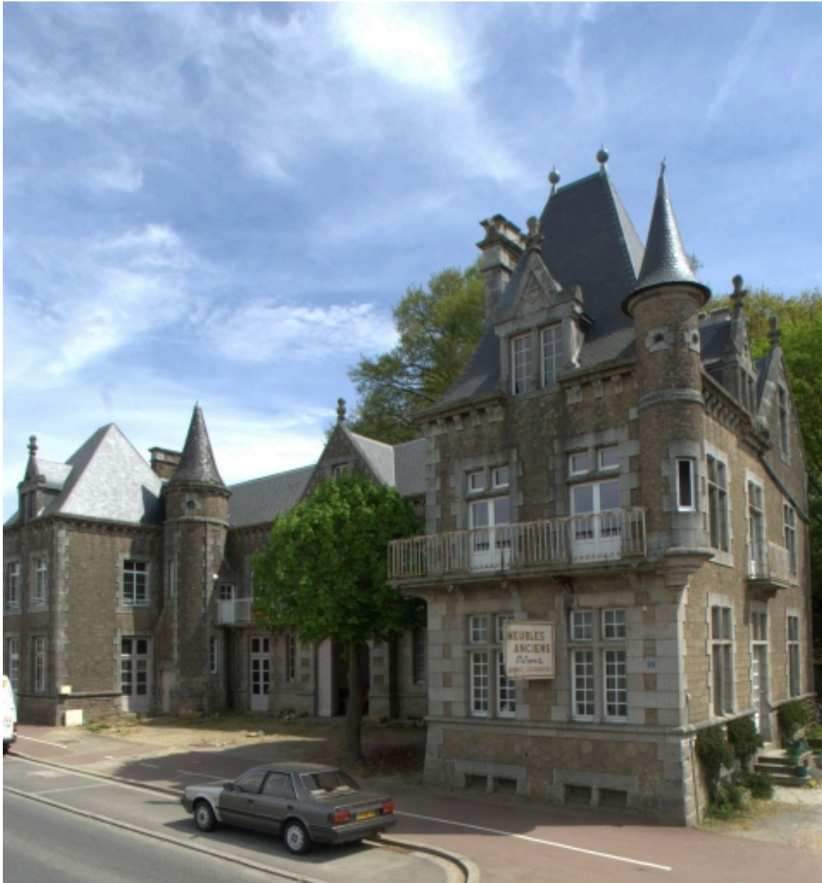
Le château de la Touche