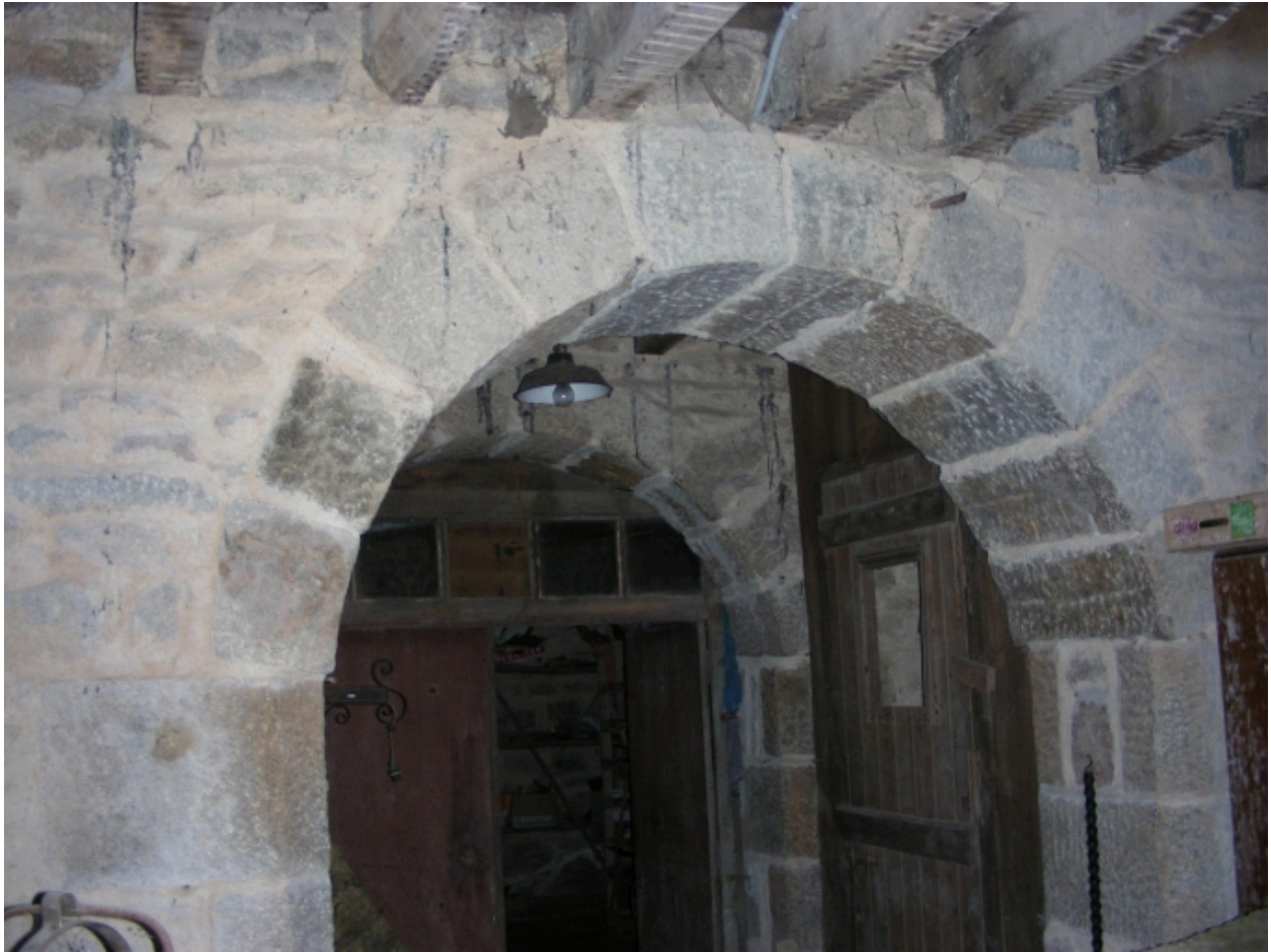
Vue de la cave