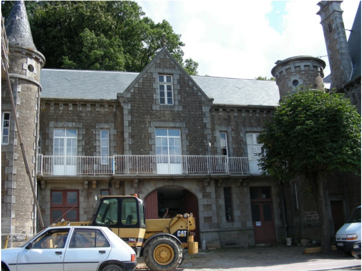
La partie centrale