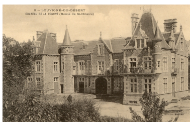
Carte postale ancienne du château IVR53_20093506039NUCB