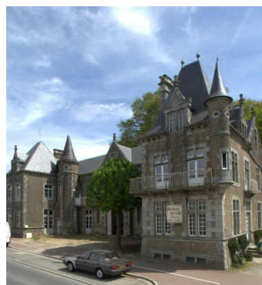
Le château de la Touche IVR53_20103503384NUCA