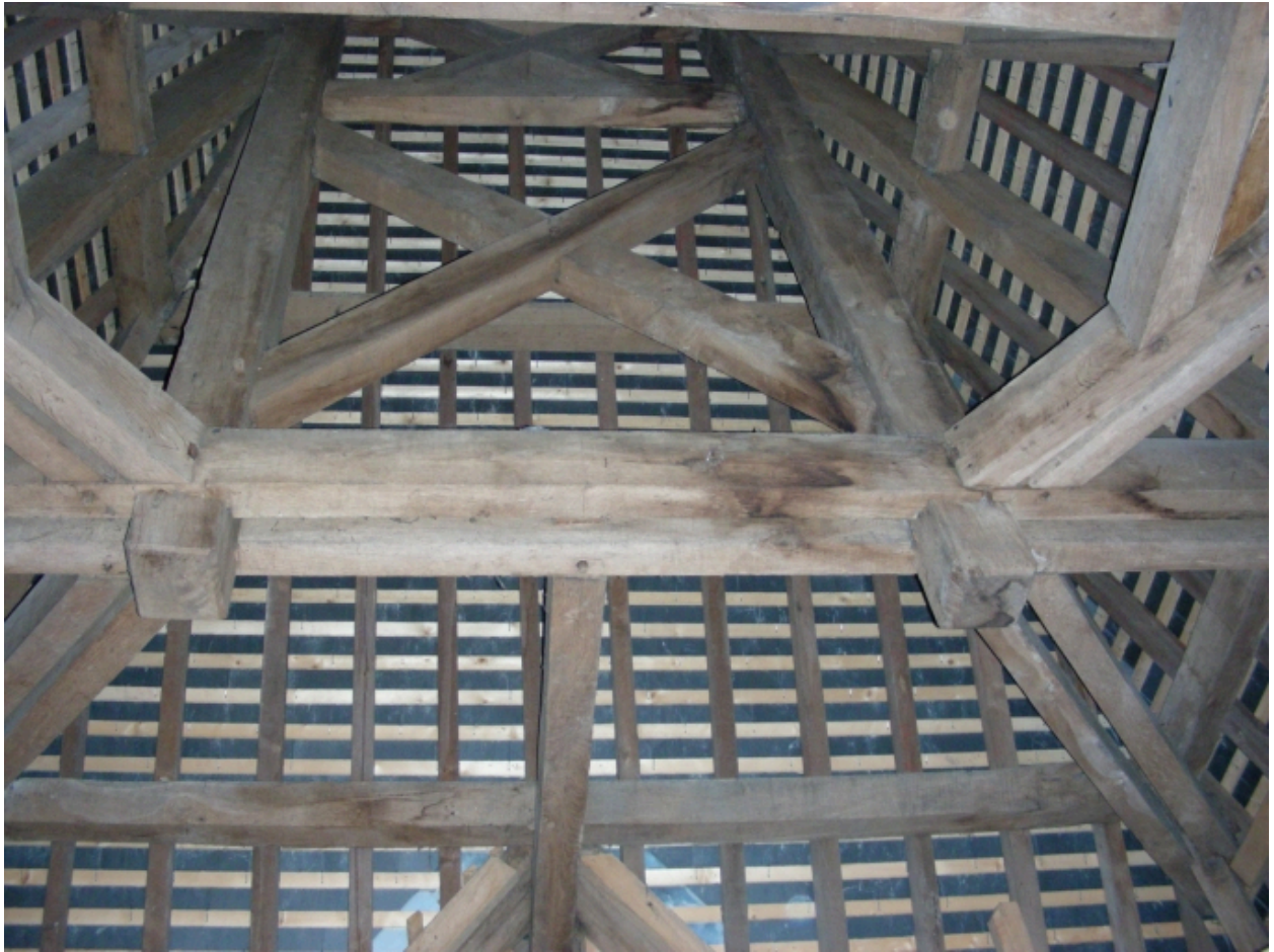
Vue de la charpente, partie sud