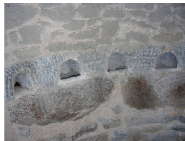
Système de gouttière en granite