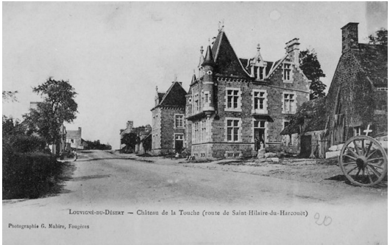
Carte postale ancienne : le château vu de la route