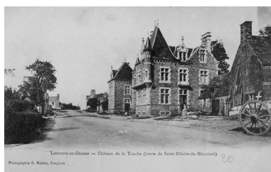
Carte postale ancienne : le château vu de la route