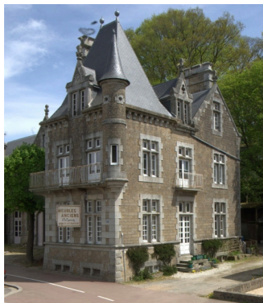
Aile sud du château IVR53_20103503386NUCA