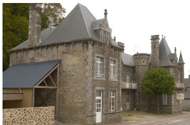
Vue générale du château IVR53_20103503455NUCA