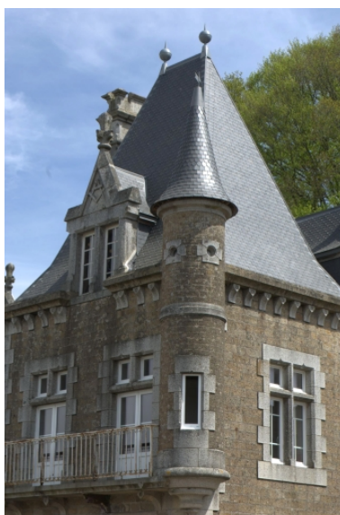
Détail de la toiture IVR53_20103503390NUCA