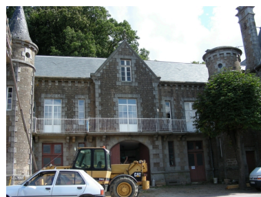
La partie centrale IVR53_20093505684NUCA