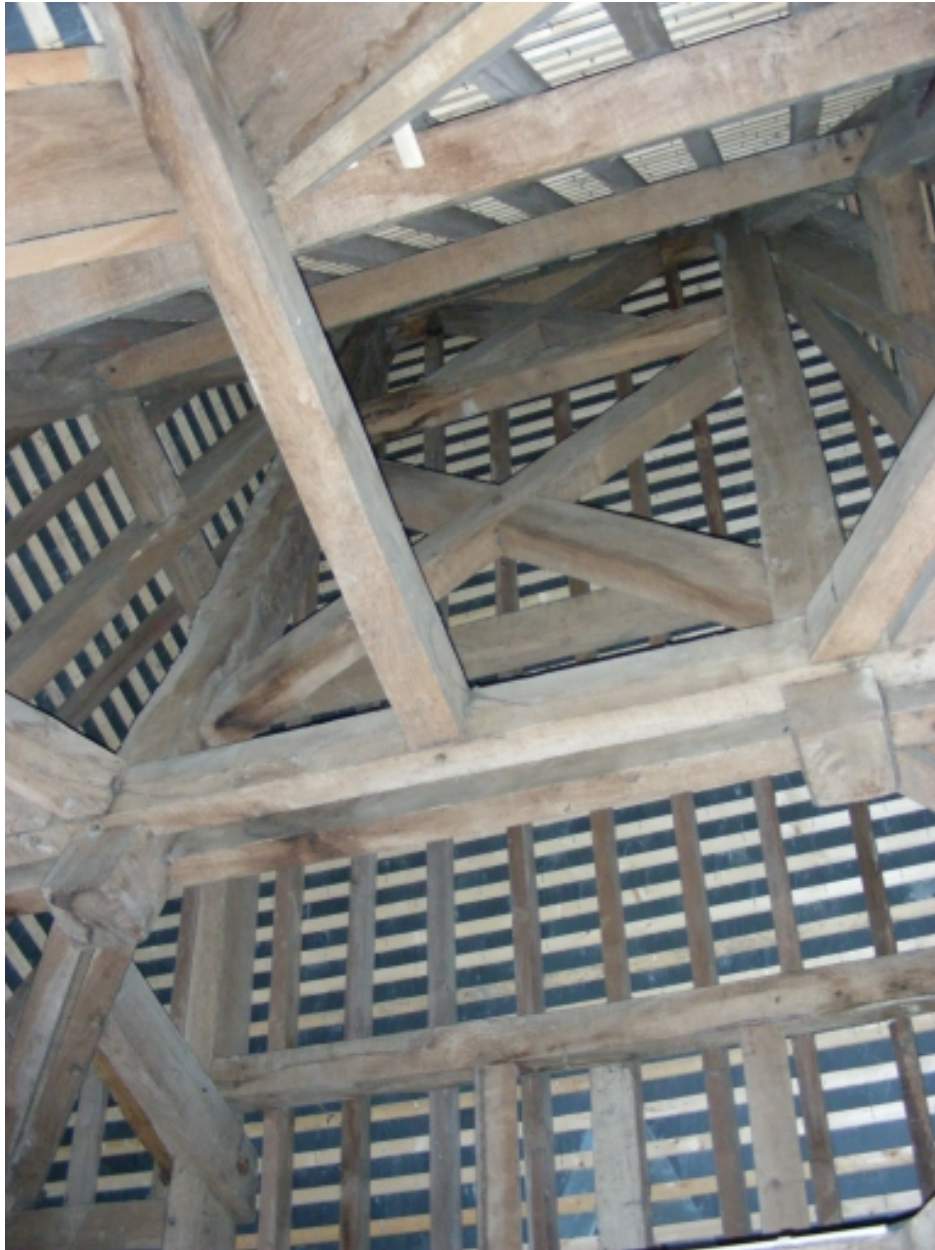
Vue de la charpente, partie sud