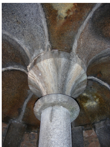
Voûte en granite dans la tour sud