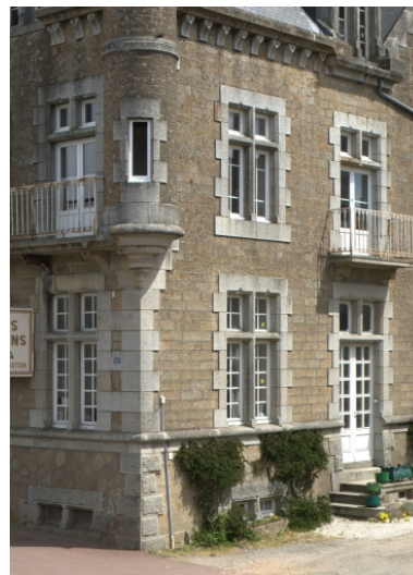
Détail des ouvertures