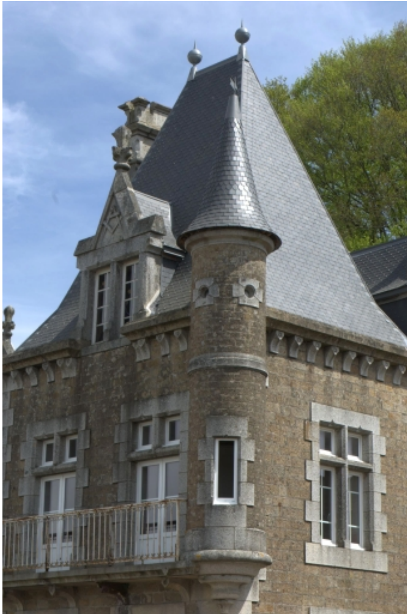
Détail de la toiture