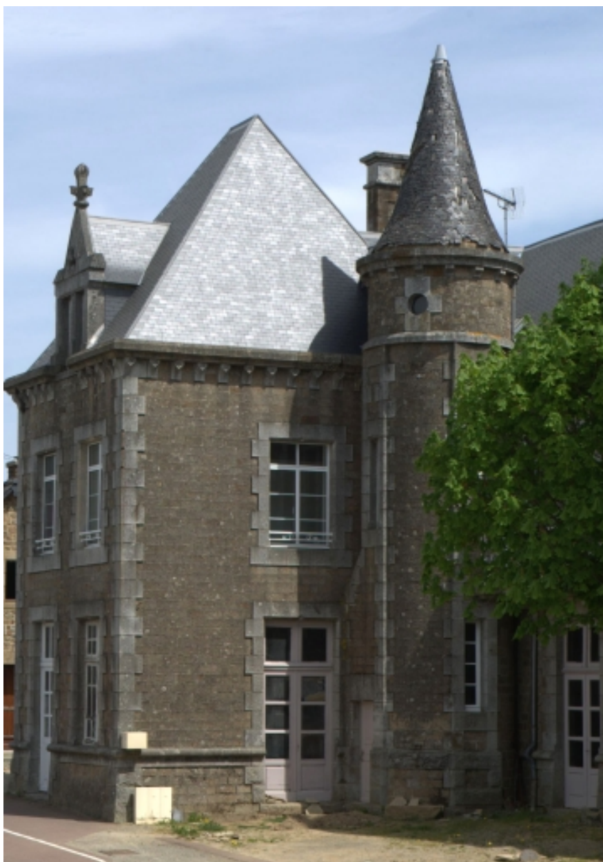
Détail de la tourelle d'escalier