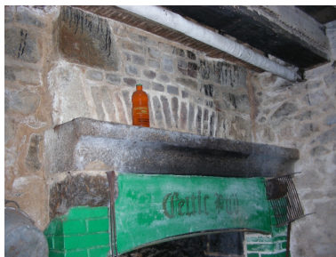
Cheminée dans la cave sous l'écurie IVR53_20093505877NUCA