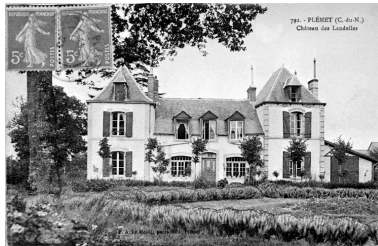
Le château. Carte postale ancienne