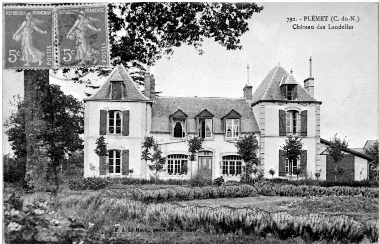
Le château. Carte postale ancienne