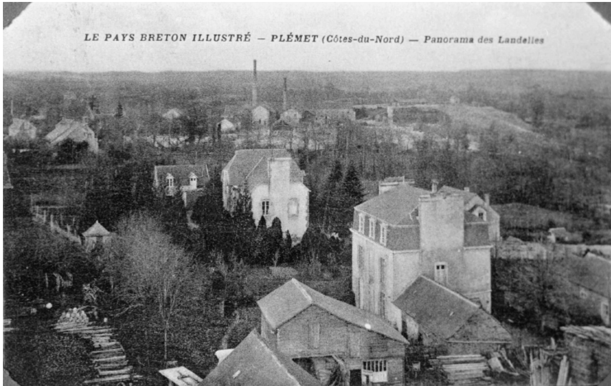
Vue du site. Carte postale ancienne