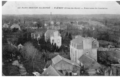
Vue du site. Carte postale ancienne (coll. Le Pays Breton illustré) IVR53_19952200202XB