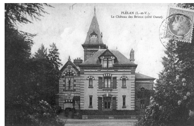
Carte postale ancienne du château : vue générale ouest IVR53_19883500484X