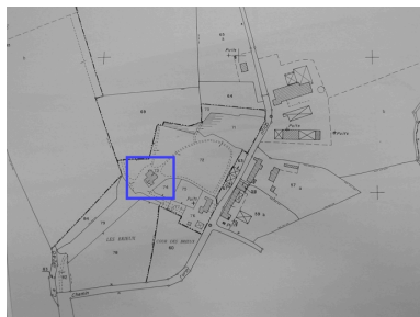
Extrait du cadastre de 1995 IVR53_20023514209NUC