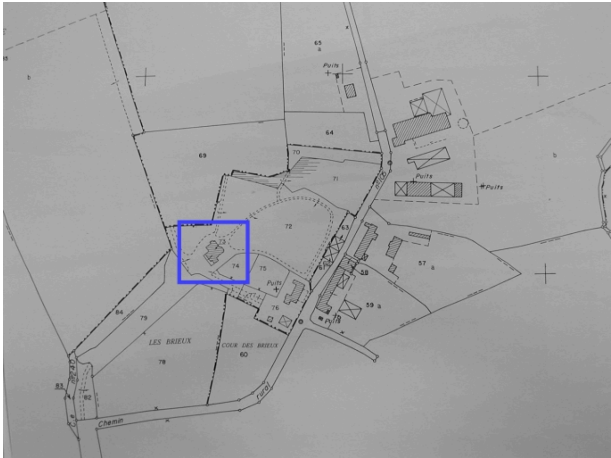
Extrait du cadastre de 1995