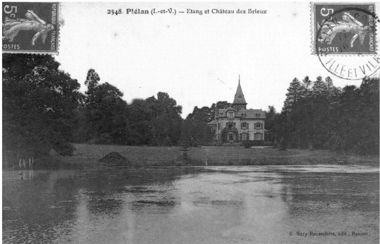
Carte postale ancienne : vue générale nord