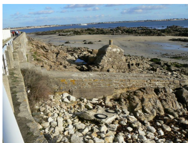
Vue latérale de la rampe et de la borne géodésique du fort de Locqueltas IVR53_20085606025NUCA