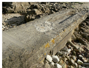
Rampe du fort de Locqueltas IVR53_20085606026NUCA