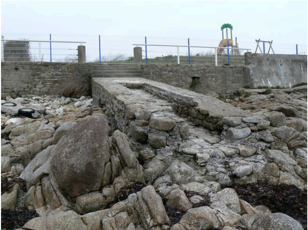
Vue générale de la rampe du fort de Locqueltas