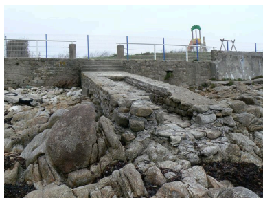
Vue générale de la rampe du fort de Locqueltas IVR53_20085606024NUCA