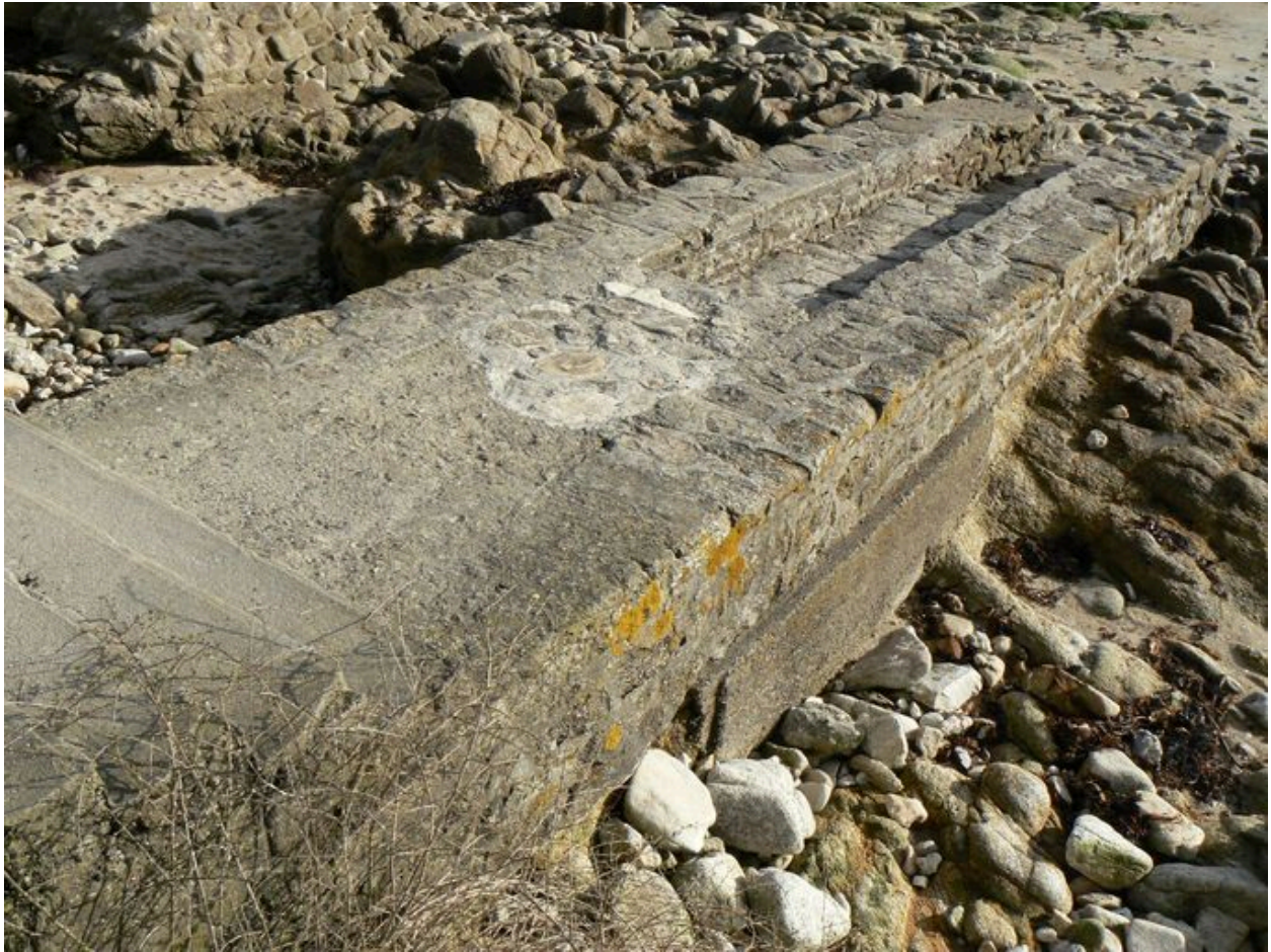
Rampe du fort de Locqueltas