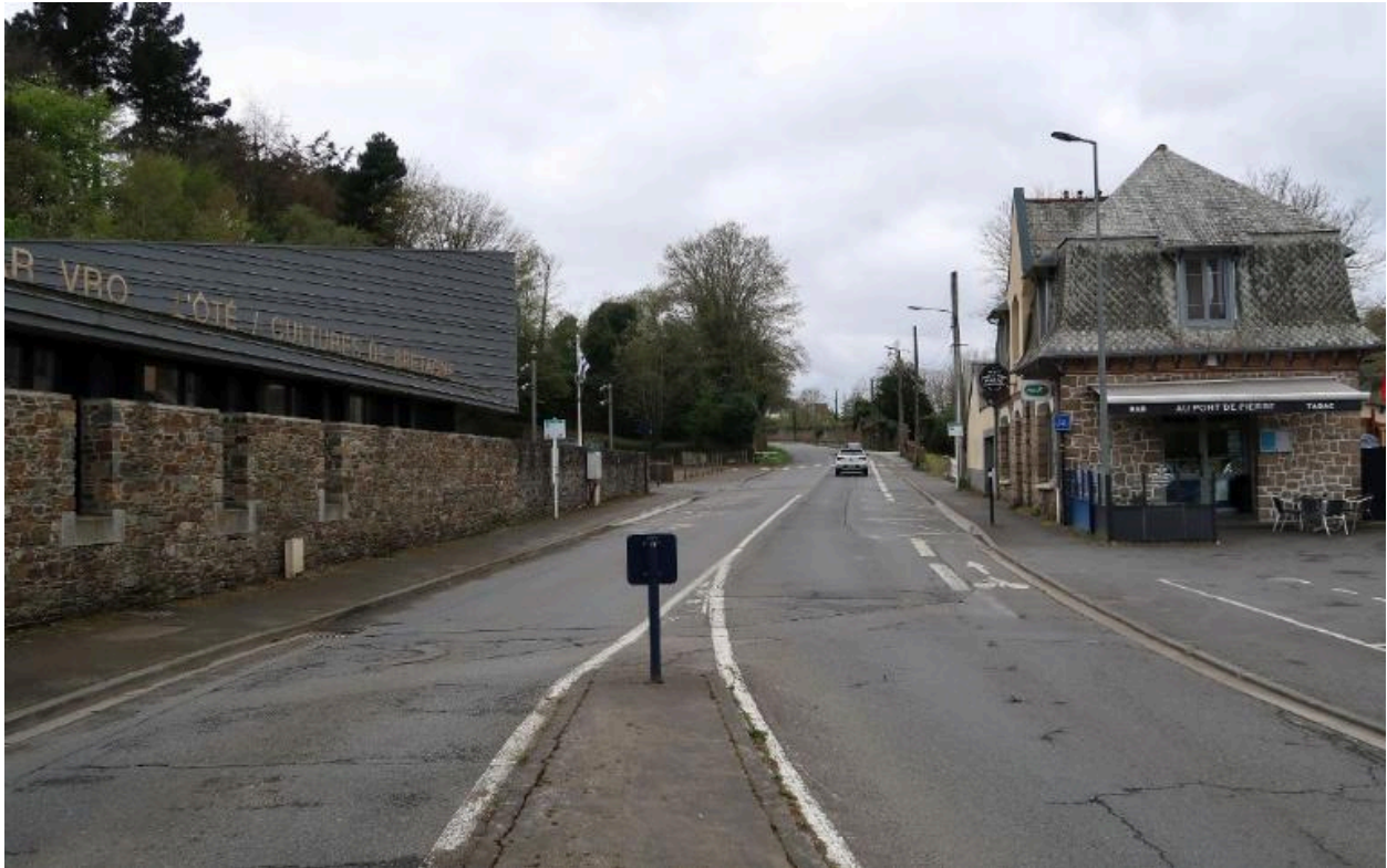
Vue de la rue du Légué depuis le port