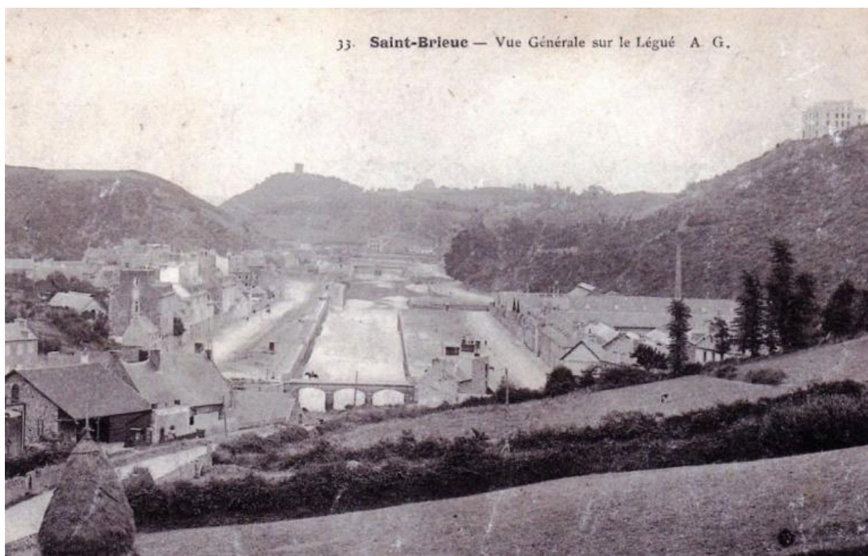
Carte postale, vue générale sur le Légué (rue du Légué sur la gauche de l'image)