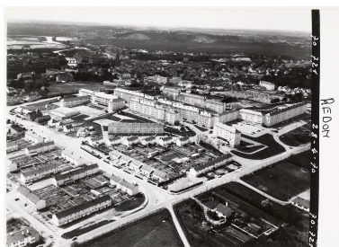
Photographie aérienne du quartier Bellevue peu avant la construction. L'église actuelle occupe le terrain à l'extrême droite de la photographie. IVR53_20233505339NUCA