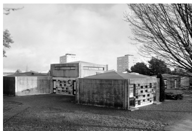
Élévation Nord : vue générale IVR53_19943502422X