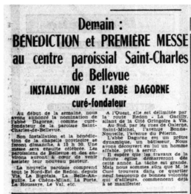
Article dans Ouest-France du 4 janvier 1965 annonçant la nouvelle paroisse ainsi que la construction d'une chapelle provisoire IVR53_20233505340NUCA