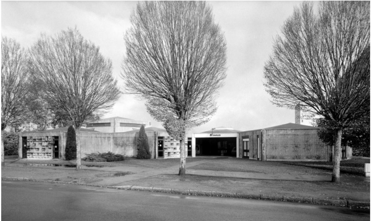
Intérieur, chapelle, autel : vue générale (Carte postale ancienne, AD35 : 6Fi)