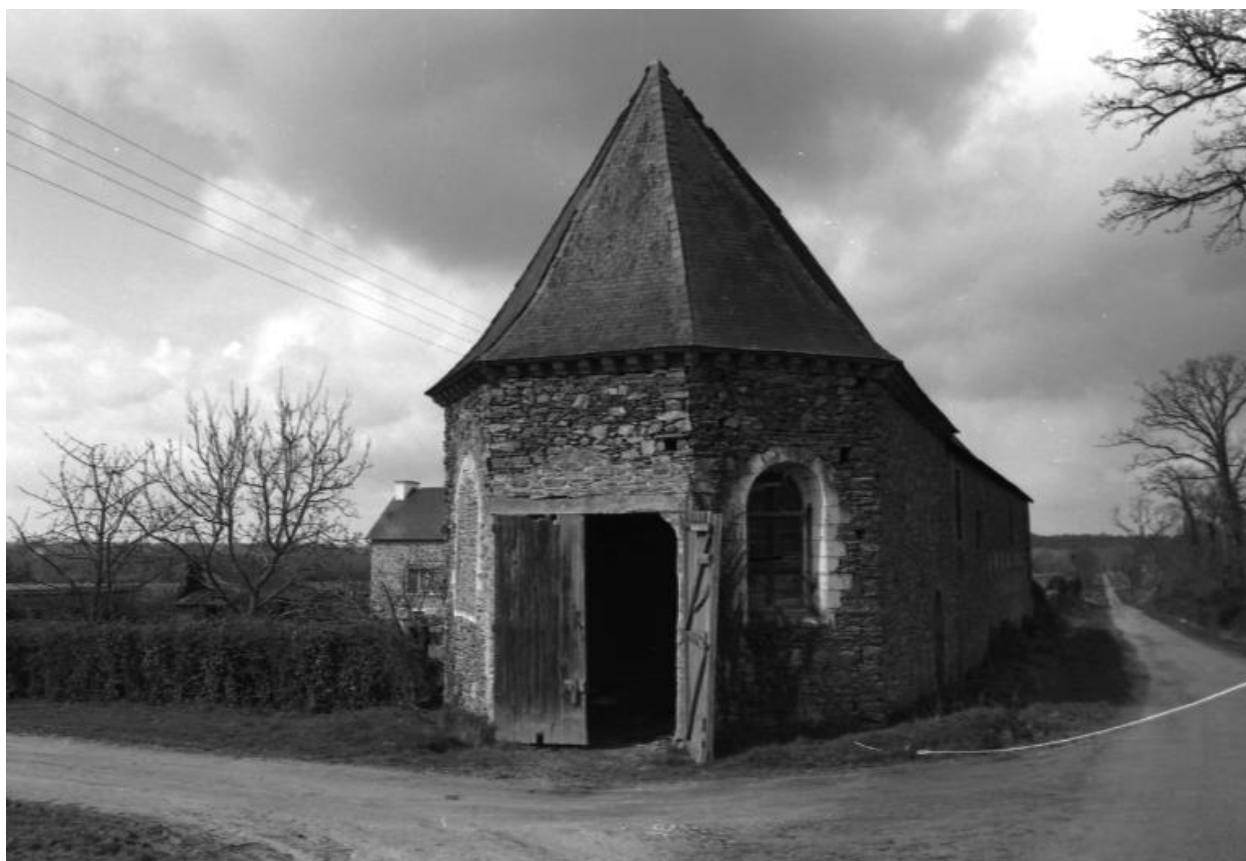
Ferme - Chevet de la chapelle.