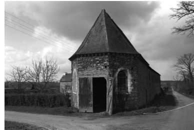
Ferme - Chevet de la chapelle. IVR53_19673500418Z