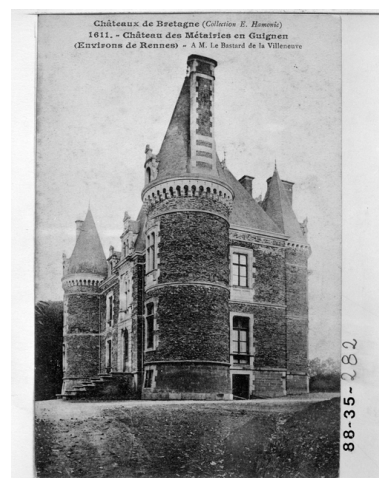
Fonds Lagrée - Carte postale ancienne - Collection E. Hamonic : Châteaux de Bretagne - 1611 - Château des Métairies en Guignen.

IVR53_19883500281X