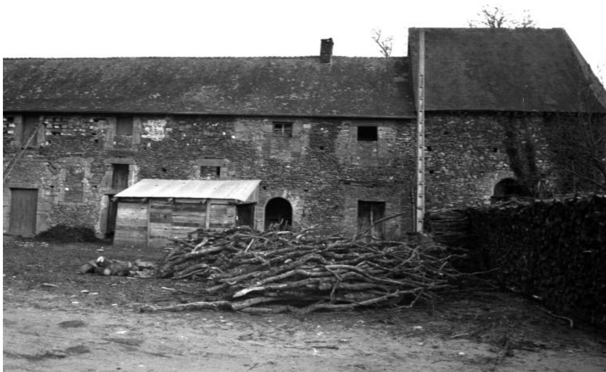
Ferme - Face est des bâtiments.