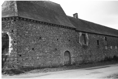
Ferme - Face ouest des bâtiments.