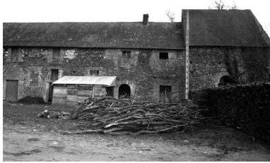
Ferme - Face est des bâtiments. IVR53_19673500419Z

IVR53_19883500282X