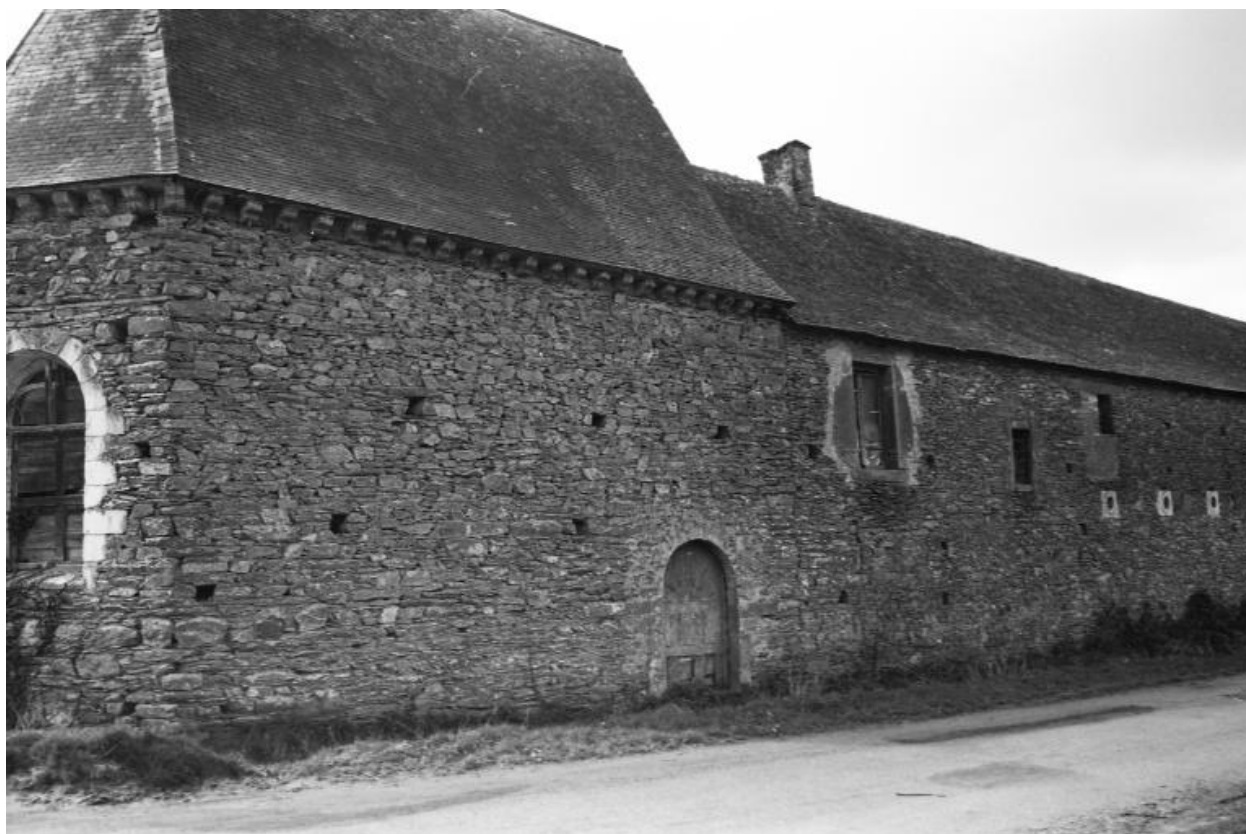
Ferme - Face ouest des bâtiments.