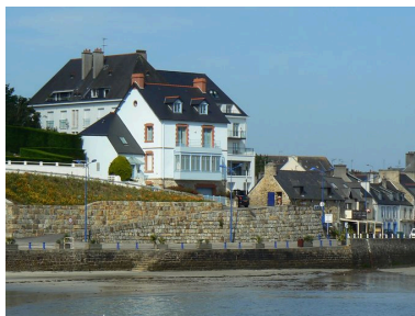
Quais et rue de la Fontaine