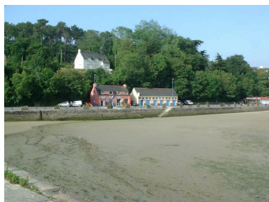
Quais de Morgat à la hauteur de l'Amicale des plaisanciers IVR53_20062908612NUCA