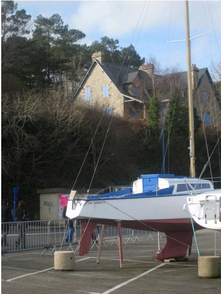
Quais et terre-plein à proximité du môle de Morgat