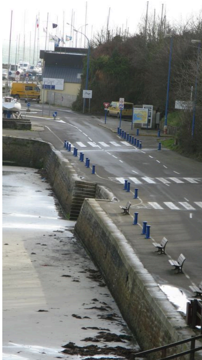
Quais de Morgat