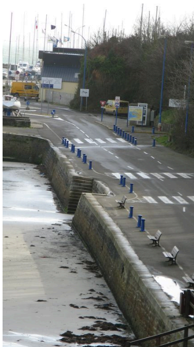
Quais de Morgat IVR53_20072908616NUCA