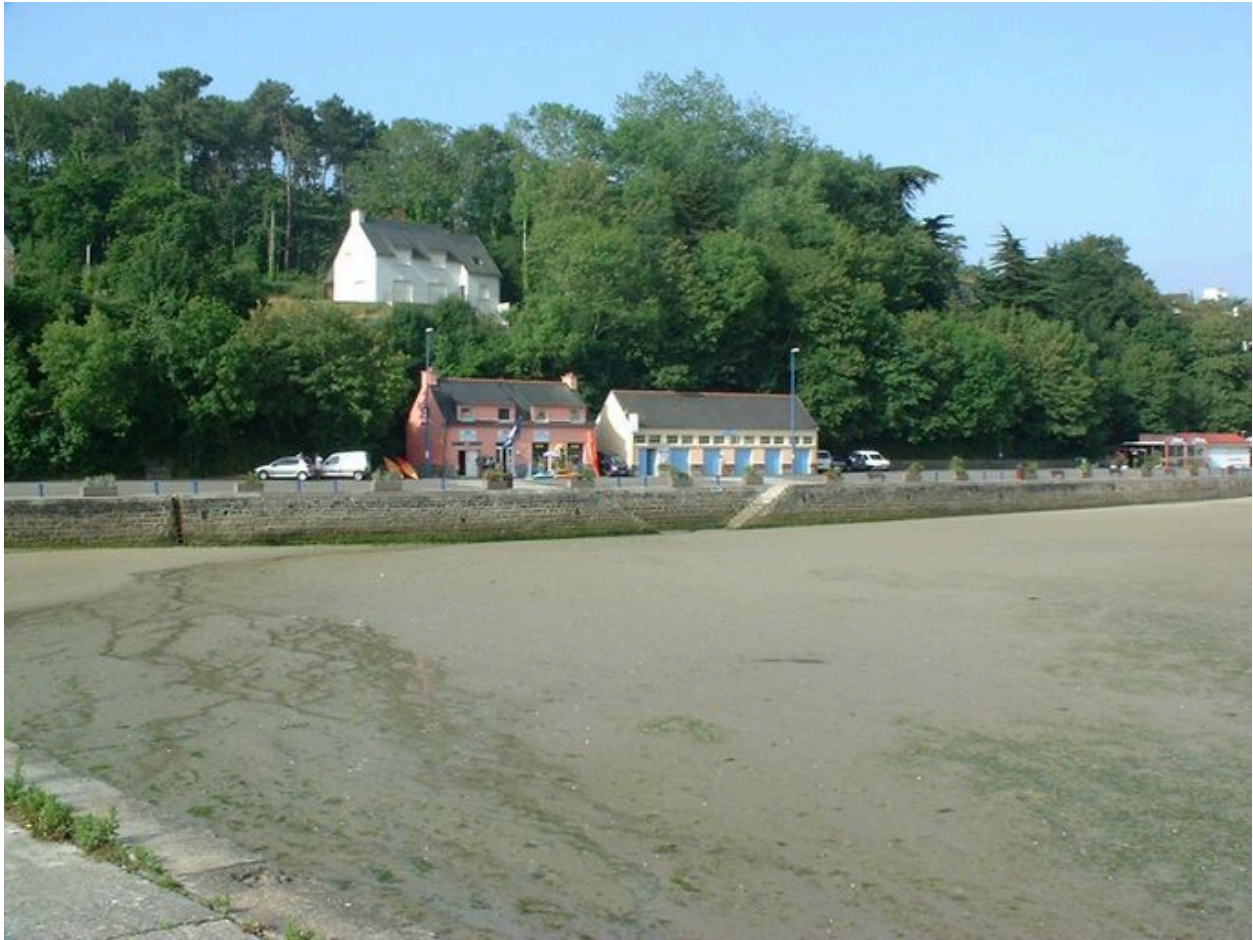
Quais de Morgat à la hauteur de l'Amicale des plaisanciers