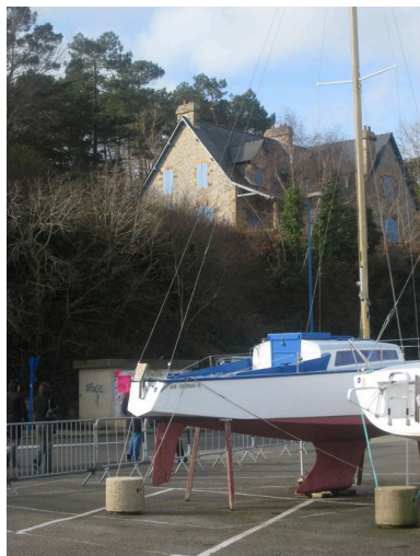
Quais et terre-plein à proximité du môle de Morgat IVR53_20072908618NUCA