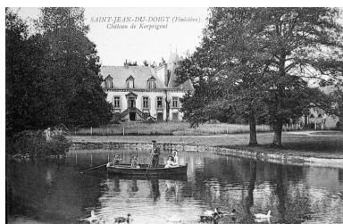
Vue générale IVR53_20042905584NUCB