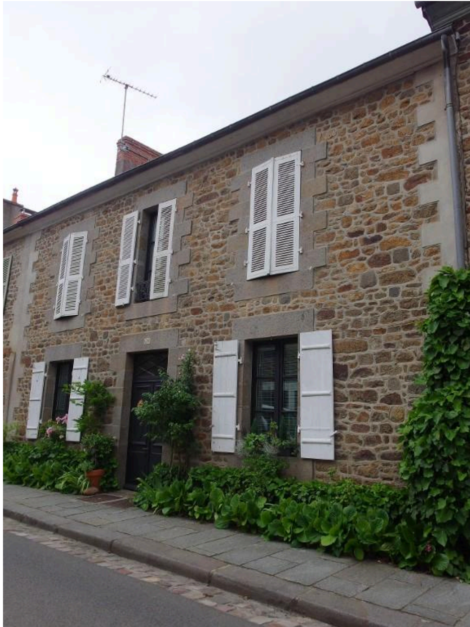
Vue de la façade est