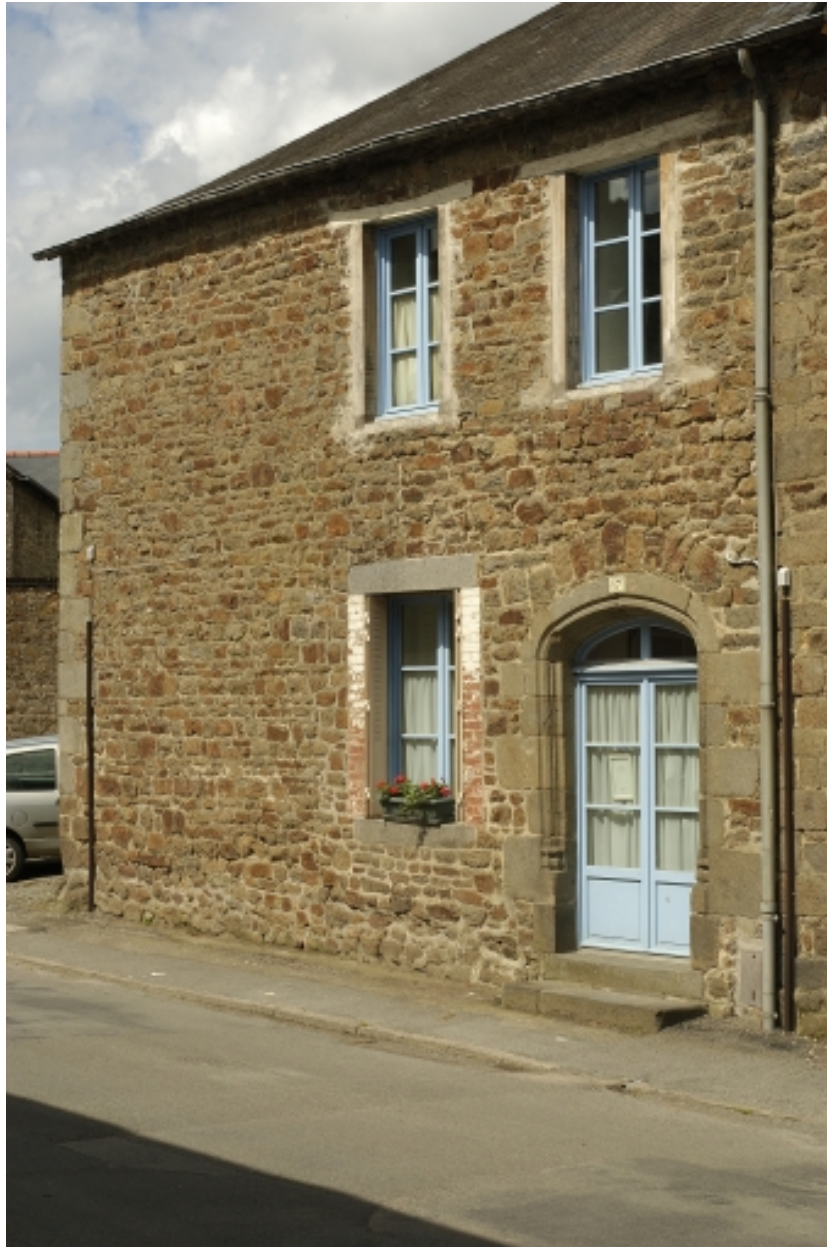
17 rue des Forges