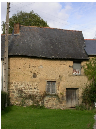
Maison de la Lande à Glets IVR53_20053519193NUCA