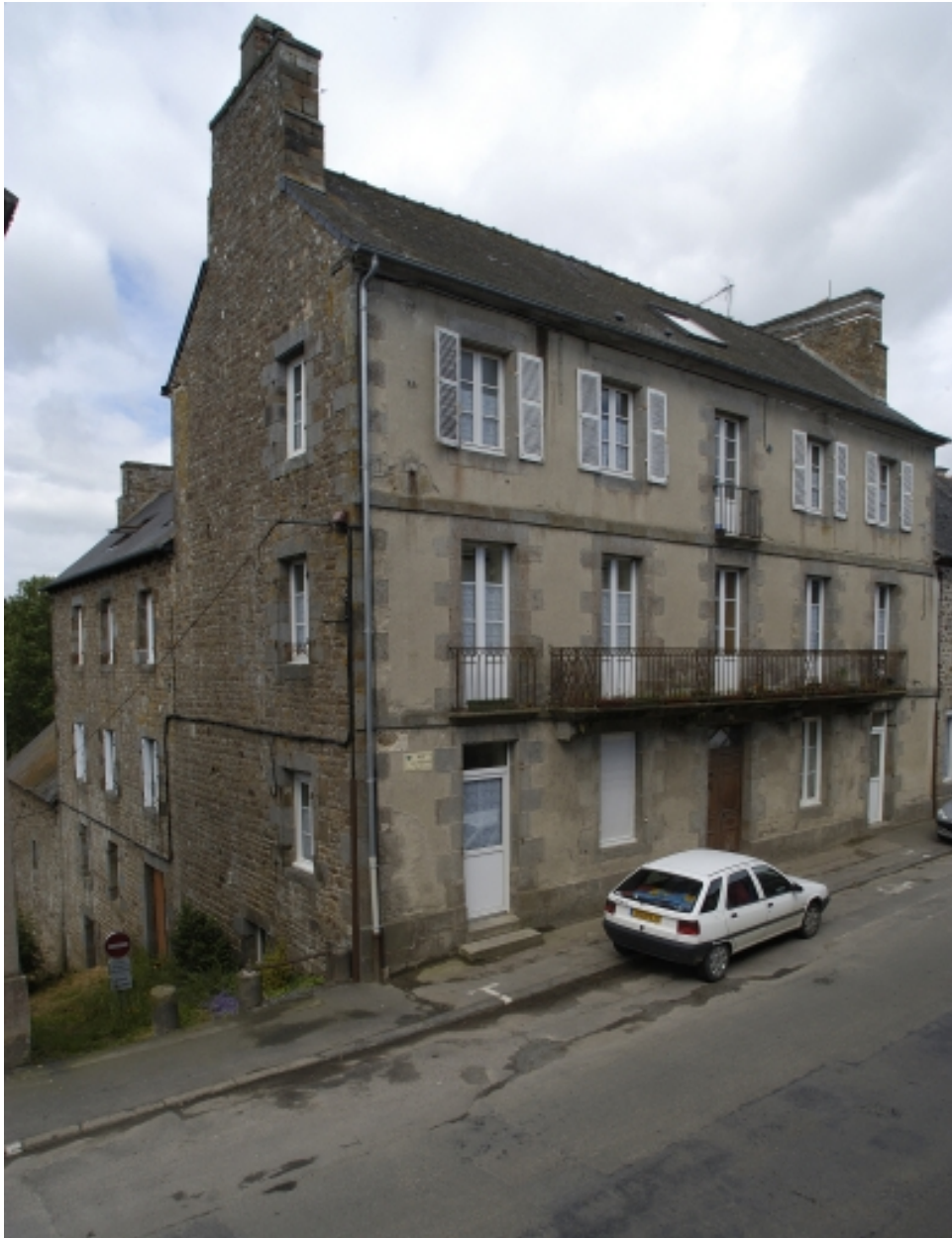
32-34 rue Jean Boucher