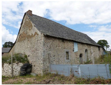
Vue générale sud ouest, Ferme, Belême (Hédé-Bazouges) IVR53_20243531365NUCA