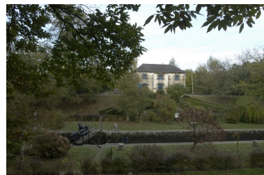
Une maison éclusière IVR53_20053502977NUCA