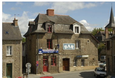
23-25 place de la Mairie IVR53_20053501472NUCA