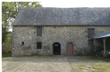
La Chambrette IVR53_20053502960NUCA