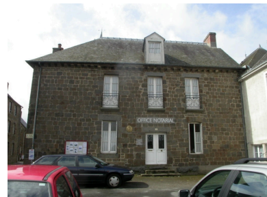
2 place de la Mairie IVR53_20053518289NUCA