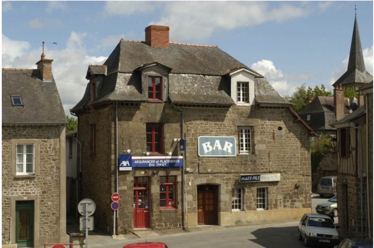
23-25 place de la Mairie