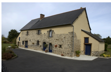
Le Haut Poncel IVR53_20053502658NUCA