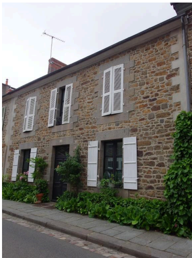
Vue de la façade est IVR53_20243532323NUCA