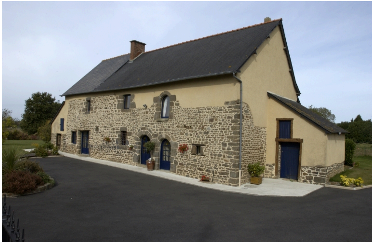
Le Haut Poncel