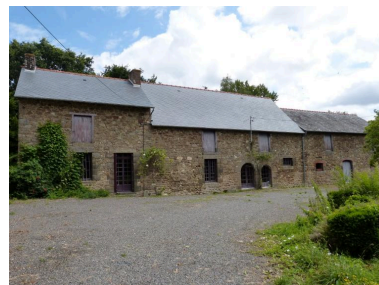
Vue générale sud IVR53_20243531276NUCA