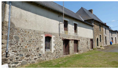
Vue générale sud, Ferme, Belême (Hédé-Bazouges) IVR53_20243531437NUCA