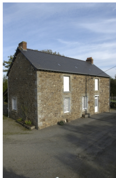
La Chambrette