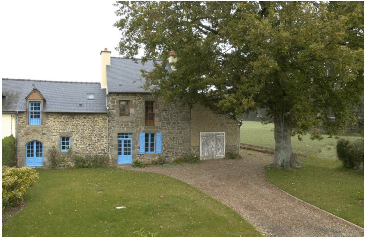
Bâtiment de la Petite Madeleine