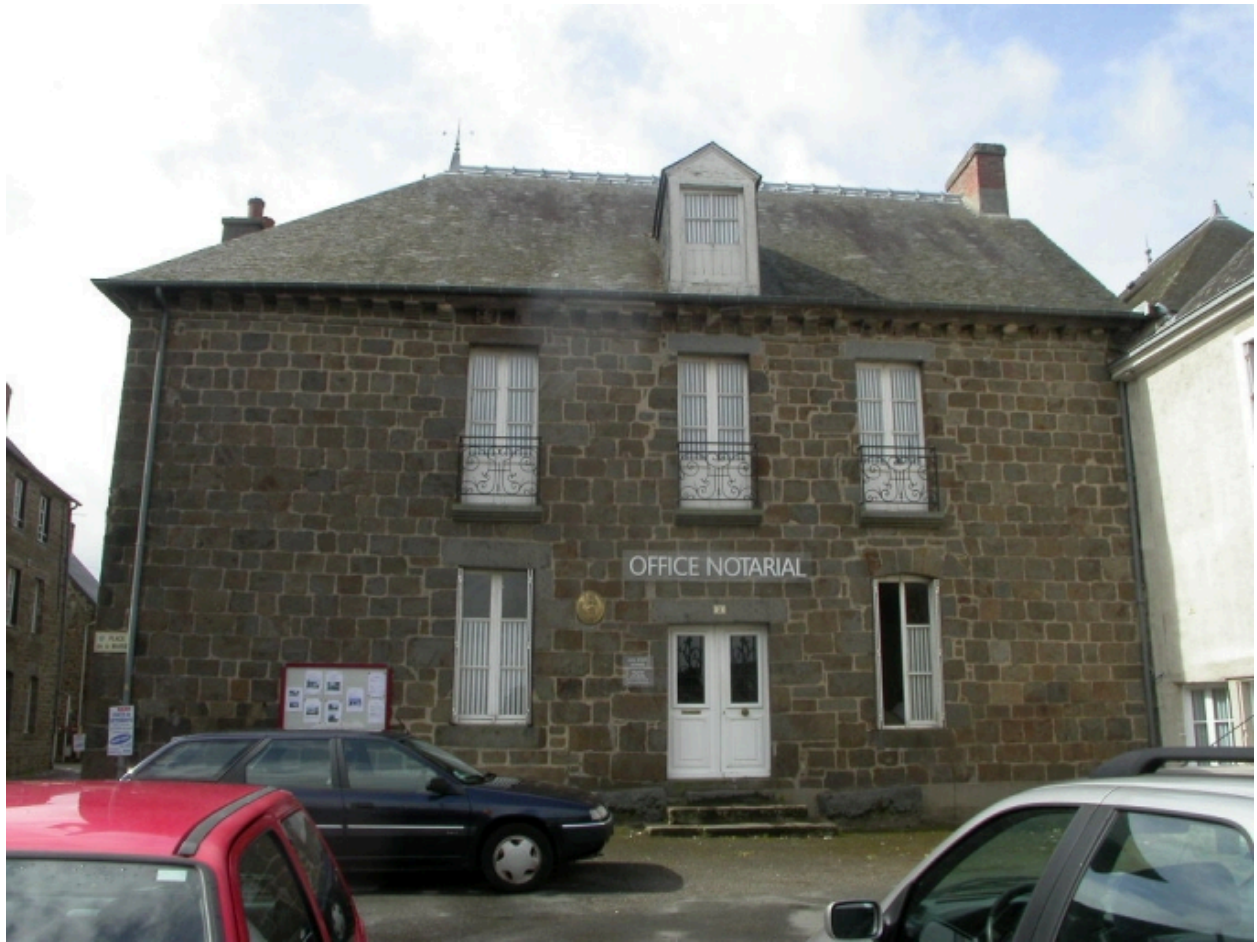
2 place de la Mairie