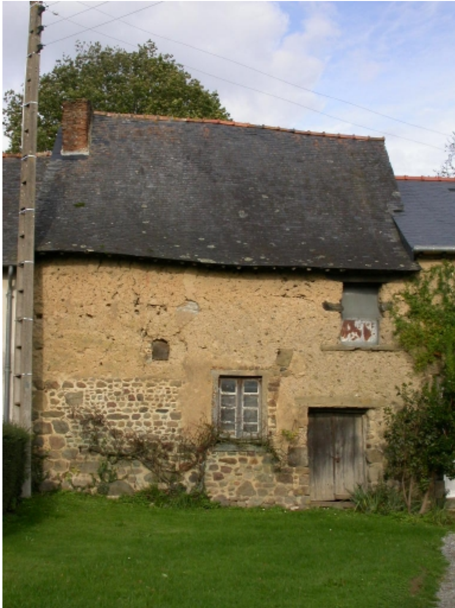
Maison de la Lande ès Glets