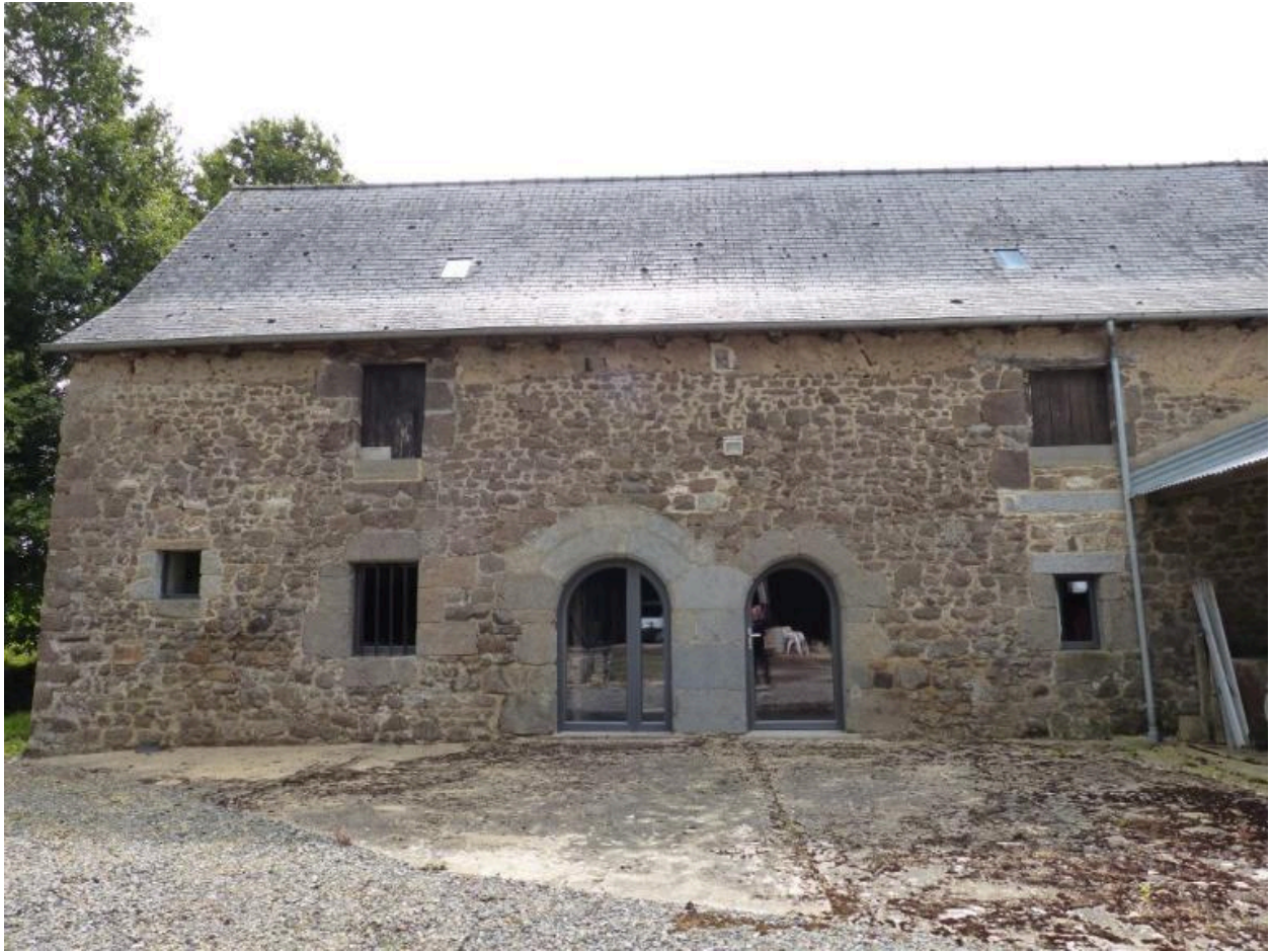
Vue de la façade ouest, La Chambrette (Hédé-Bazouges)