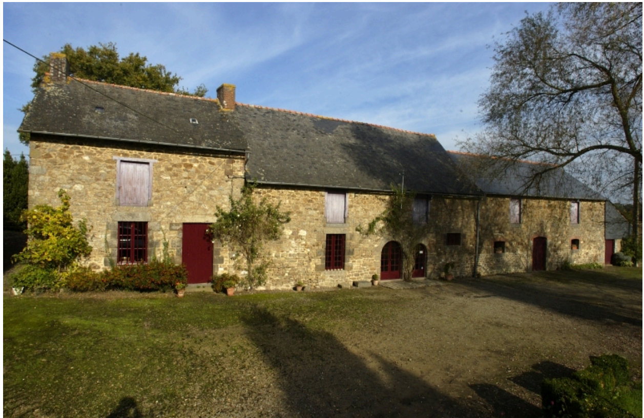
La Grande Haie