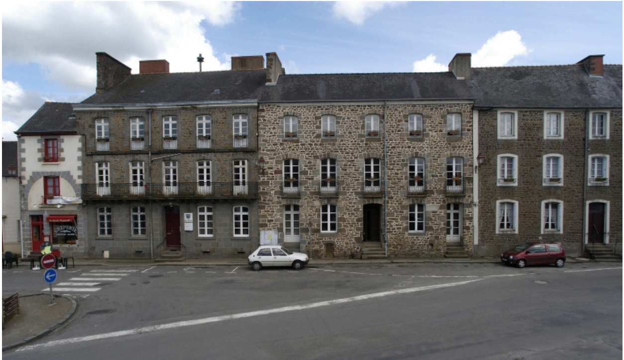
Place de la Mairie