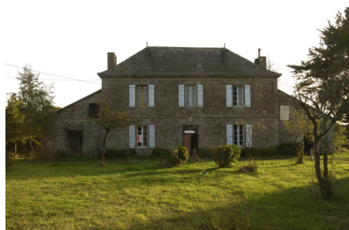
Le presbytère de Bazouges-sous-Hédé