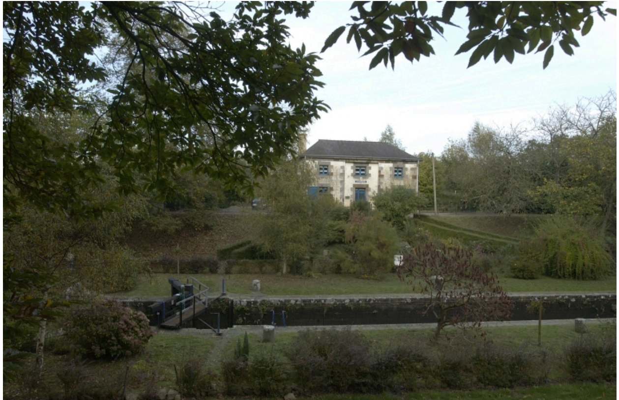
Une maison éclusière