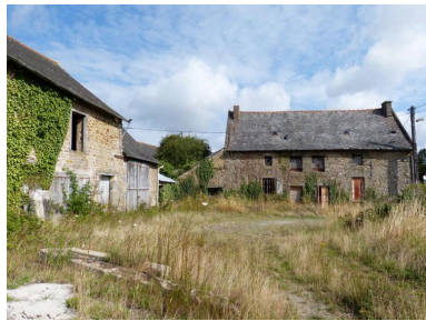
Vue d'ensemble depuis le sud IVR53_20243531491NUCA