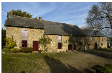
La Grande Haie