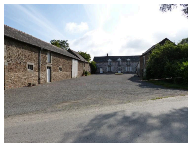
Vue d'ensemble ouest IVR53_20243531201NUCA