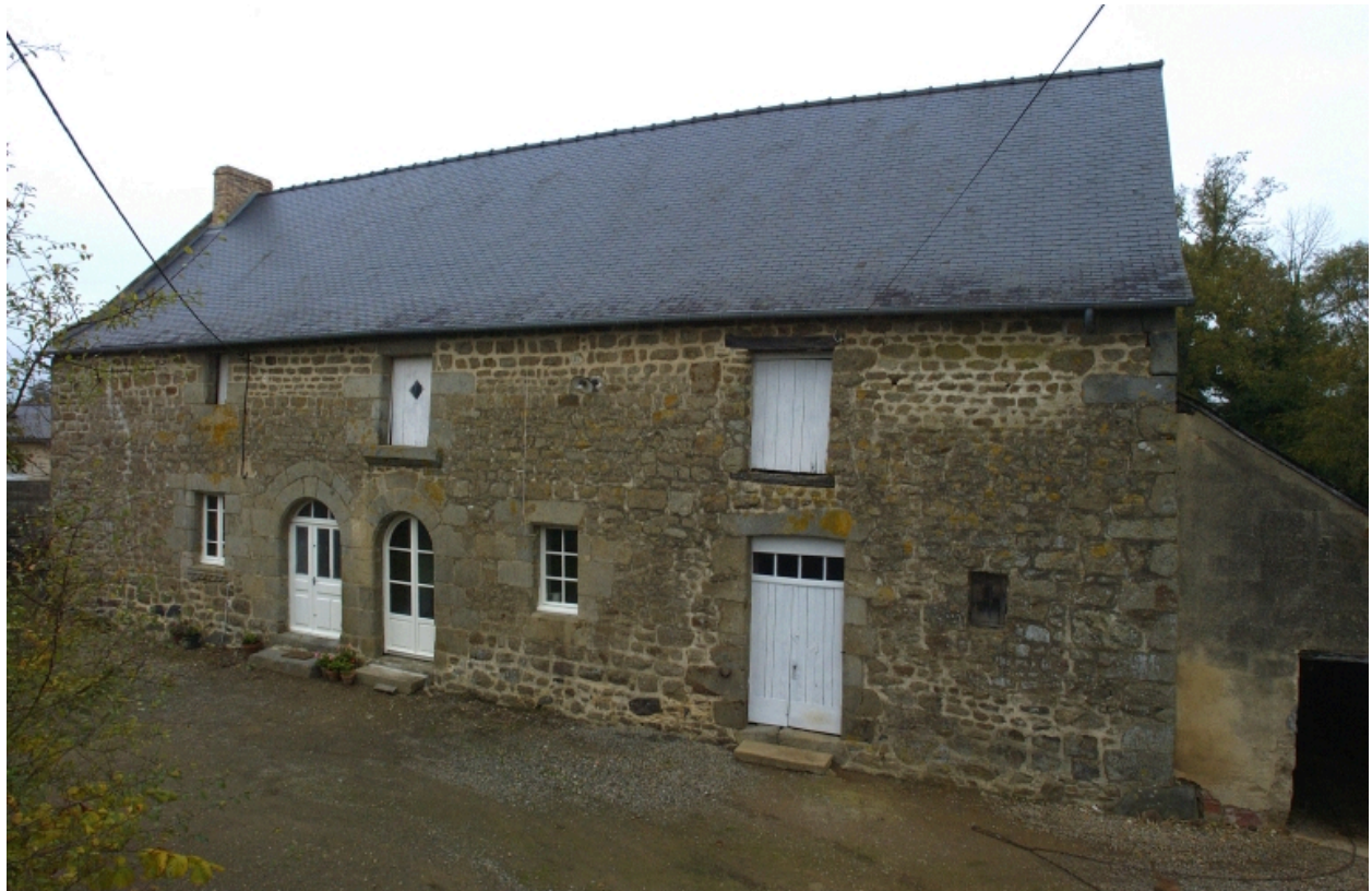
La Ville Neuve