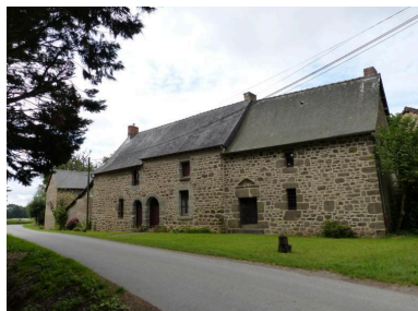
Vue d'ensemble depuis l'ouest IVR53_20243531218NUCA