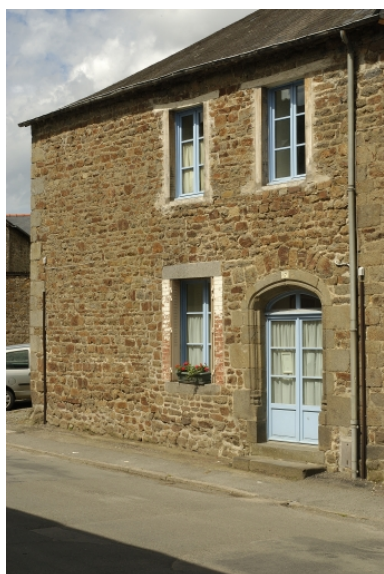
17 rue des Forges IVR53_20053501699NUCA