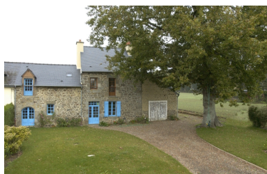
Bâtiment de la Petite Madeleine