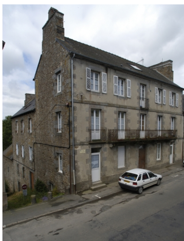
32-34 rue Jean Boucher IVR53_20053501706NUCA