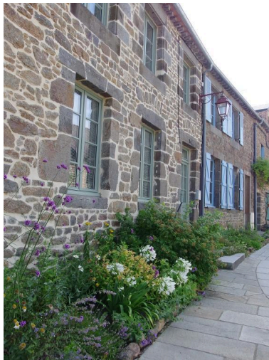
Vue ouest IVR53_20243531686NUCA