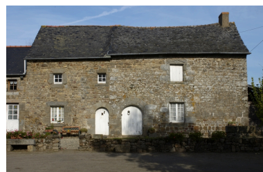
La Limonière IVR53_20053502822NUCA