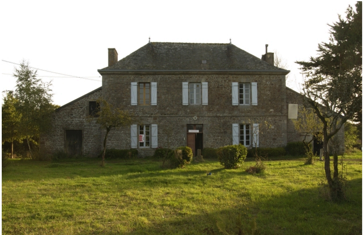
Le presbytère de Bazouges-sous-Hédé