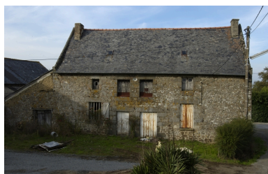
La Ville Allée IVR53_20053502966NUCA