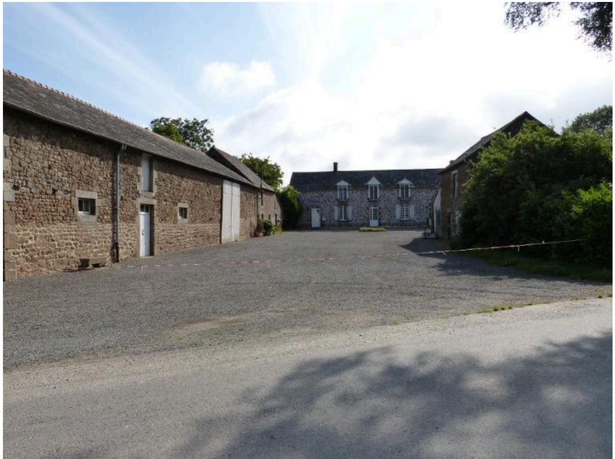
Vue d'ensemble ouest