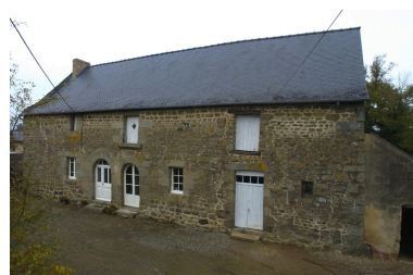
La Ville Neuve IVR53_20053503181NUCA