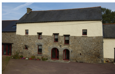
La Grémillière IVR53_20053502829NUCA