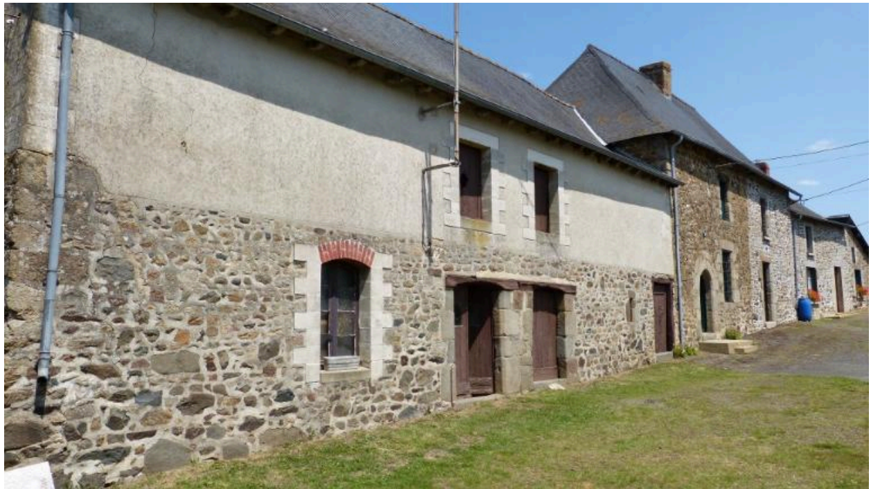
Vue générale sud, Ferme, Belême (Hédé-Bazouges)