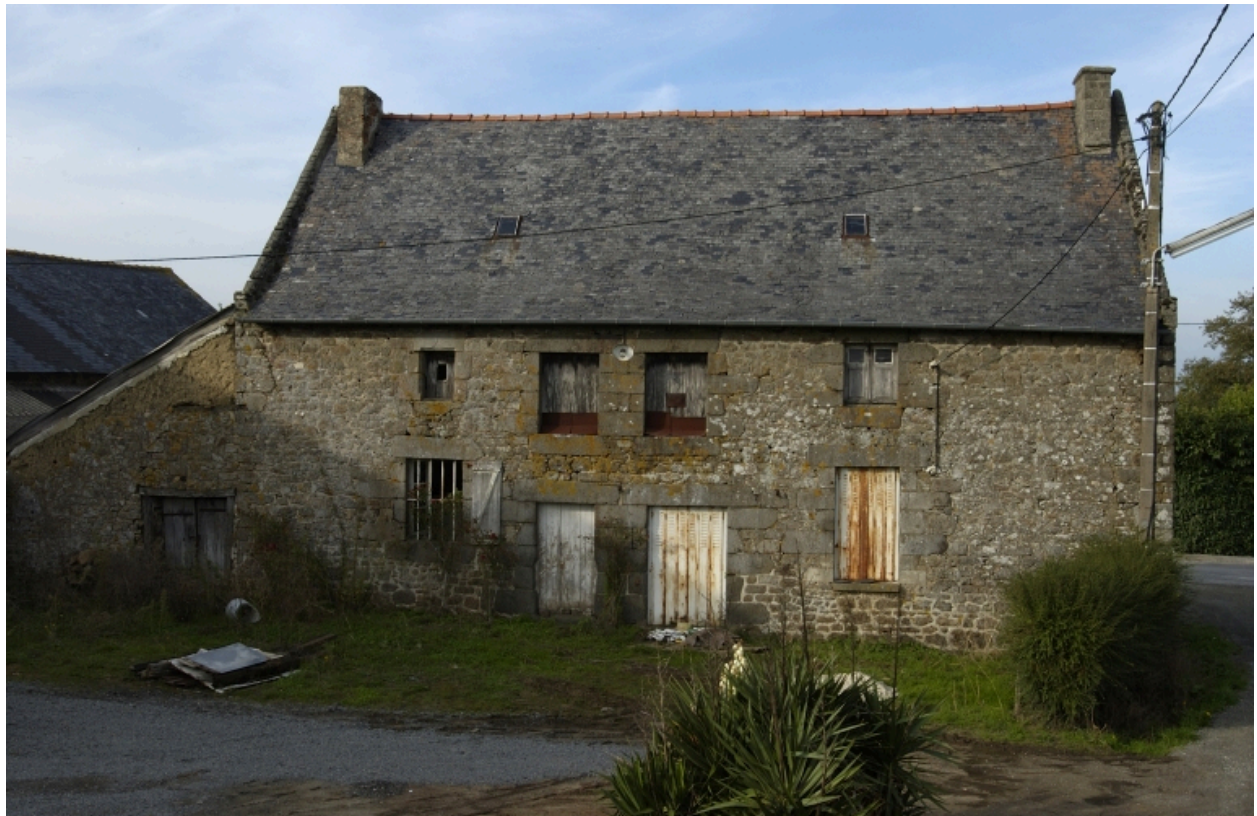
La Ville Allée