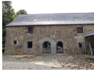
Vue de la façade ouest, La Chambrette (Hédé-Bazouges) IVR53_20243532218NUCA