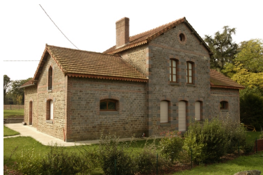
La Châtière