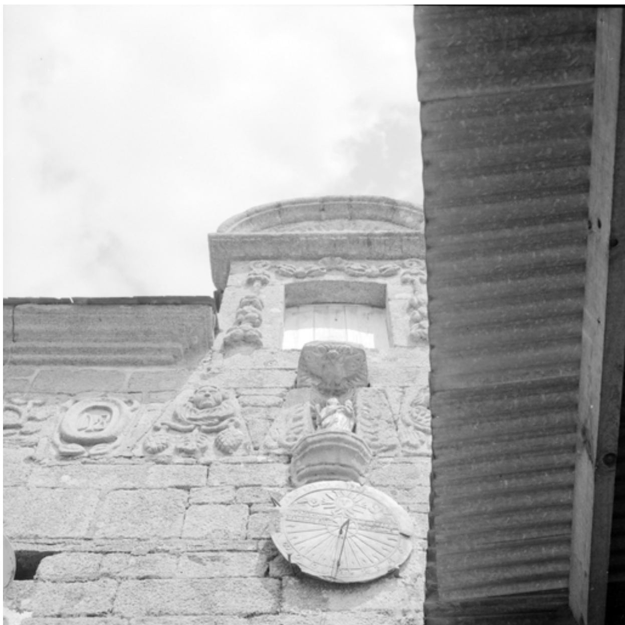
Détail du cadran solaire et de la niche sur la façade sud.