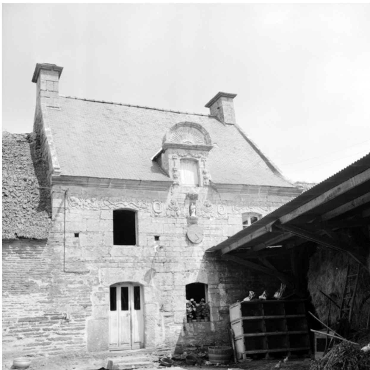
Vue générale de la façade sud.