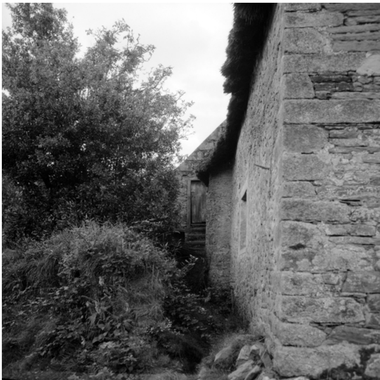
Communs, vue d'ensemble de la façade nord, tourelle d'escalier.