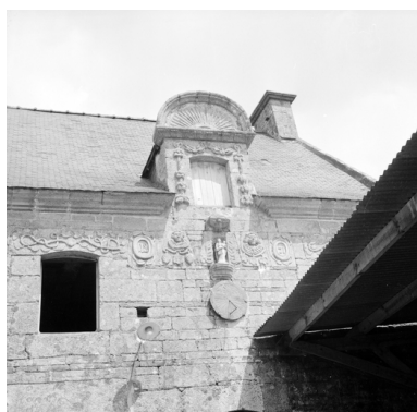
Détail des ouvertures et de la décoration du 2è niveau de la façade sud.