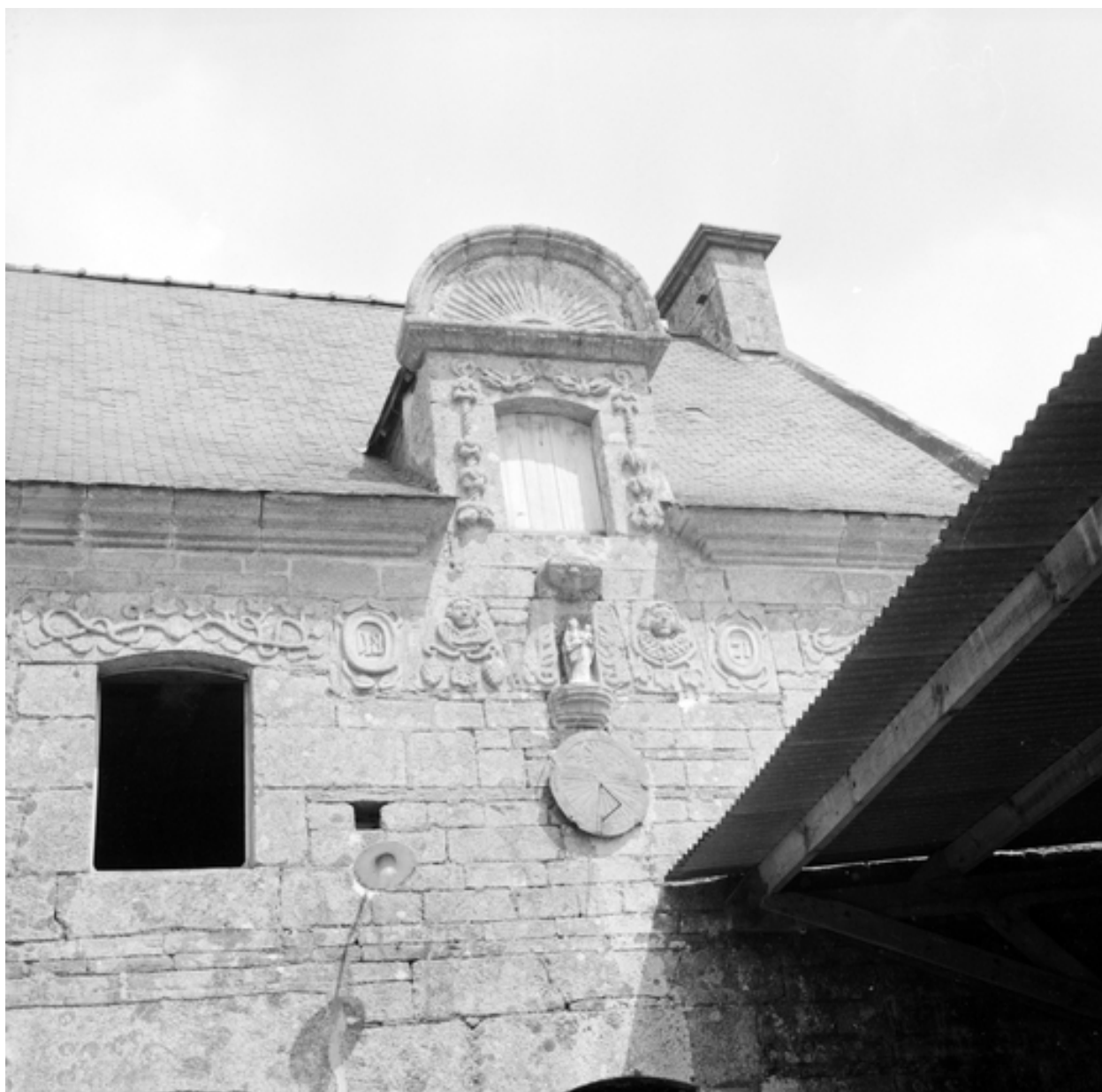
Détail des ouvertures et de la décoration du 2 e niveau de la façade sud.