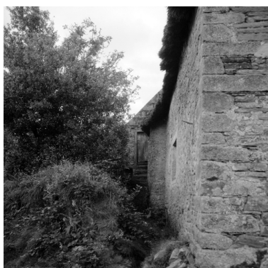
Communs, vue d'ensemble de la façade nord, tourelle d'escalier.