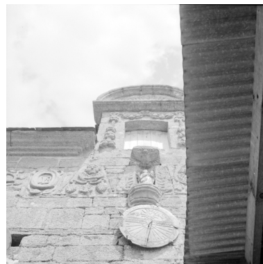
Détail du cadran solaire et de la niche sur la façade sud.