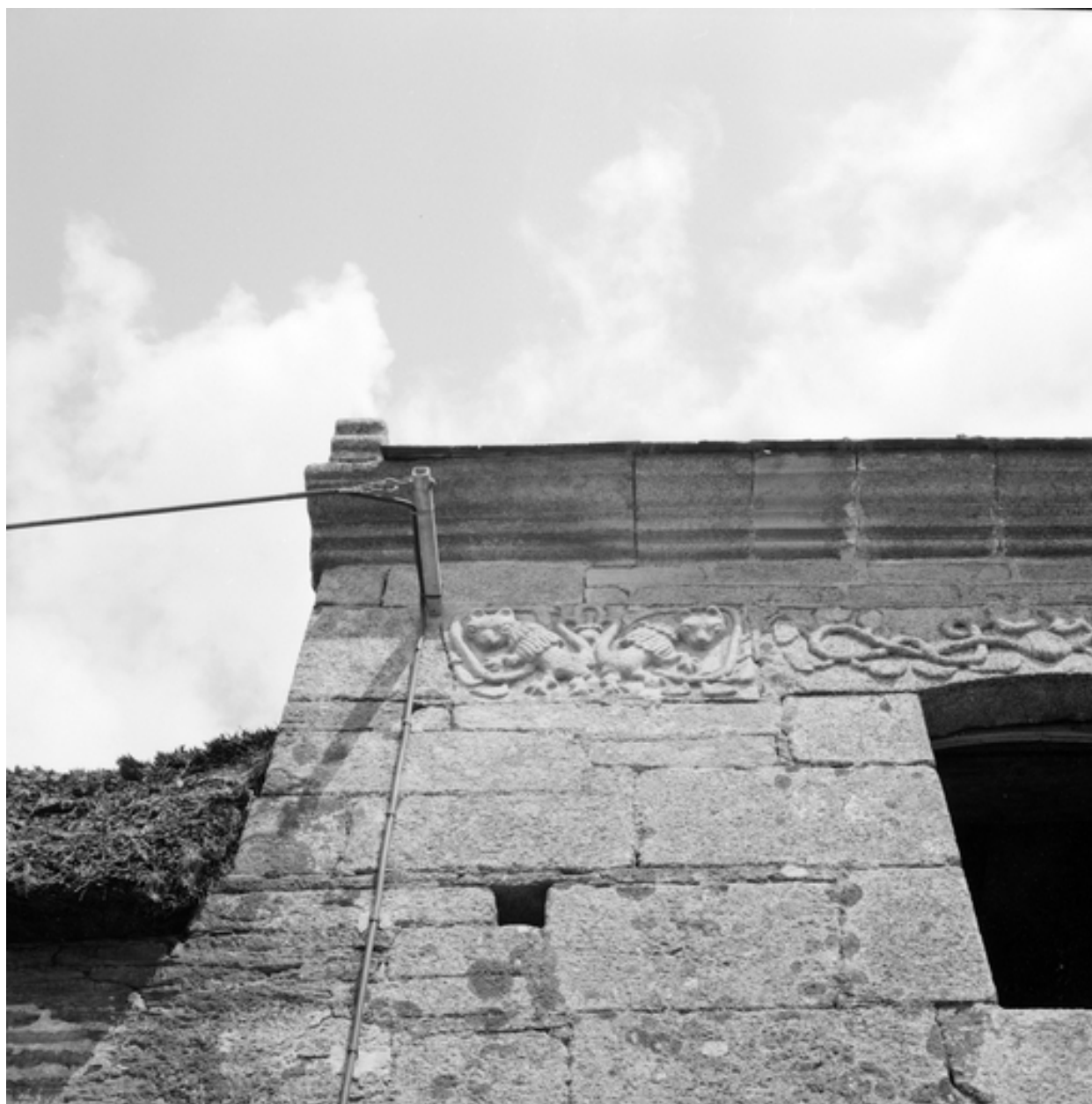
Détail de la décoration sous la corniche, à l'ouest de la façade sud.