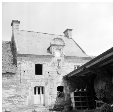
Vue générale de la façade sud. IVR53_19665600803X