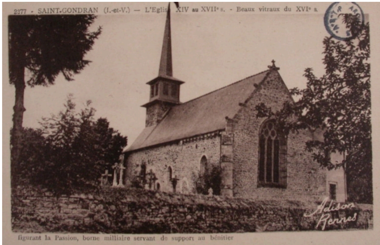
L'église sur une carte postale du début du 20e siècle