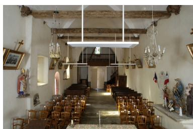
Vue intérieure prise du chœur vers la nef IVR53_20053503025NUCA