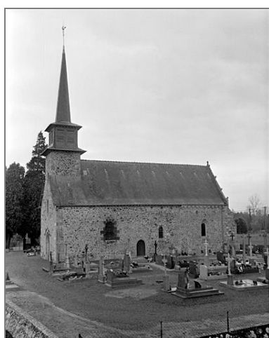
Elévation Sud : vue générale