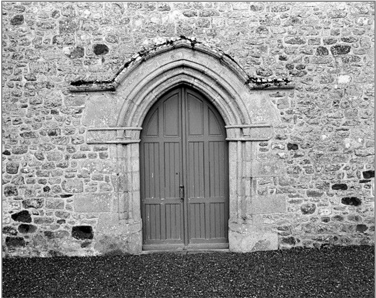
Elévation Ouest, porte principale : vue générale