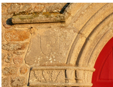
Détail du décor de la porte ouest IVR53_20053520573NUCA