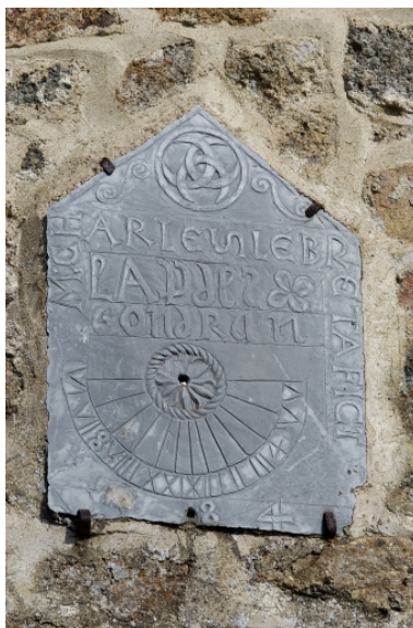
Cadran solaire, mur sud IVR53_20053502781NUCA