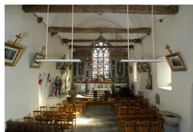
Vue intérieure prise de la nef vers le chœur IVR53_20053503026NUCA