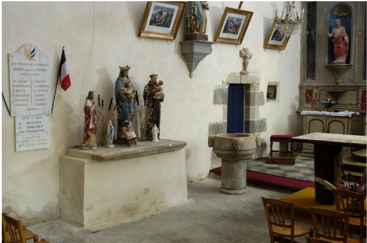
Vue intérieure, chœur, angle nord-est