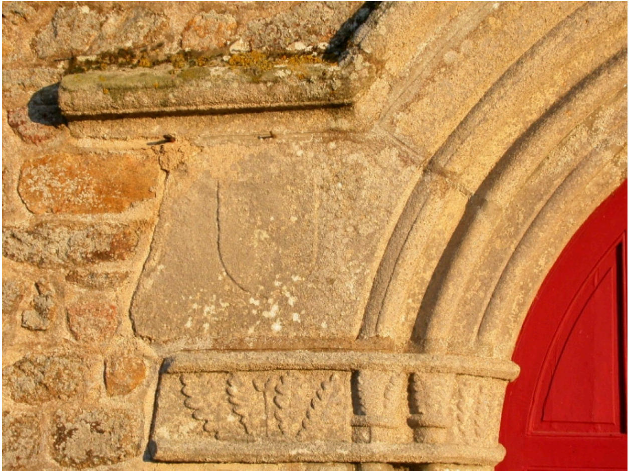
Détail du décor de la porte ouest