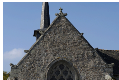
Pignon est