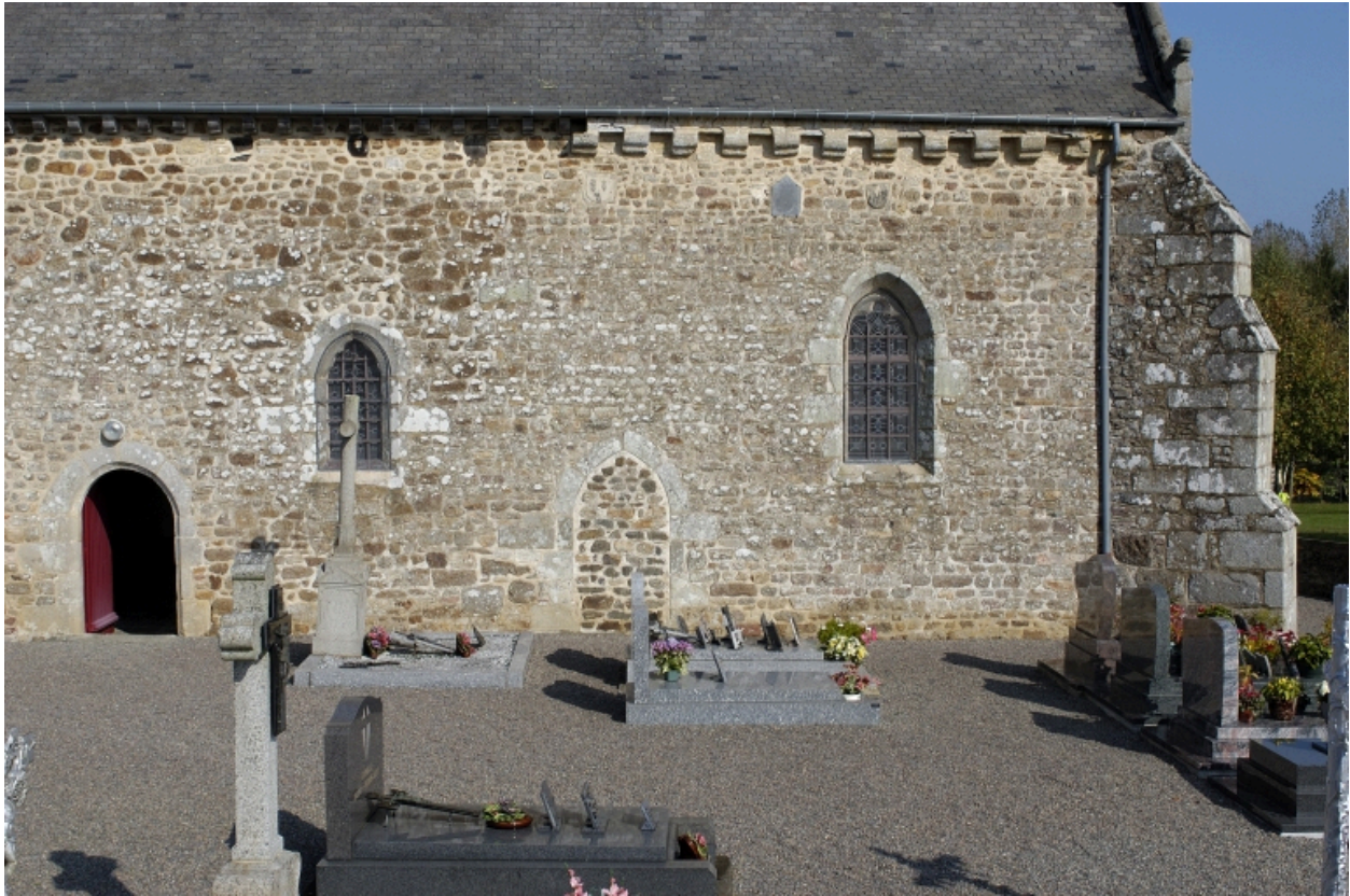
Détail de la partie sud-est