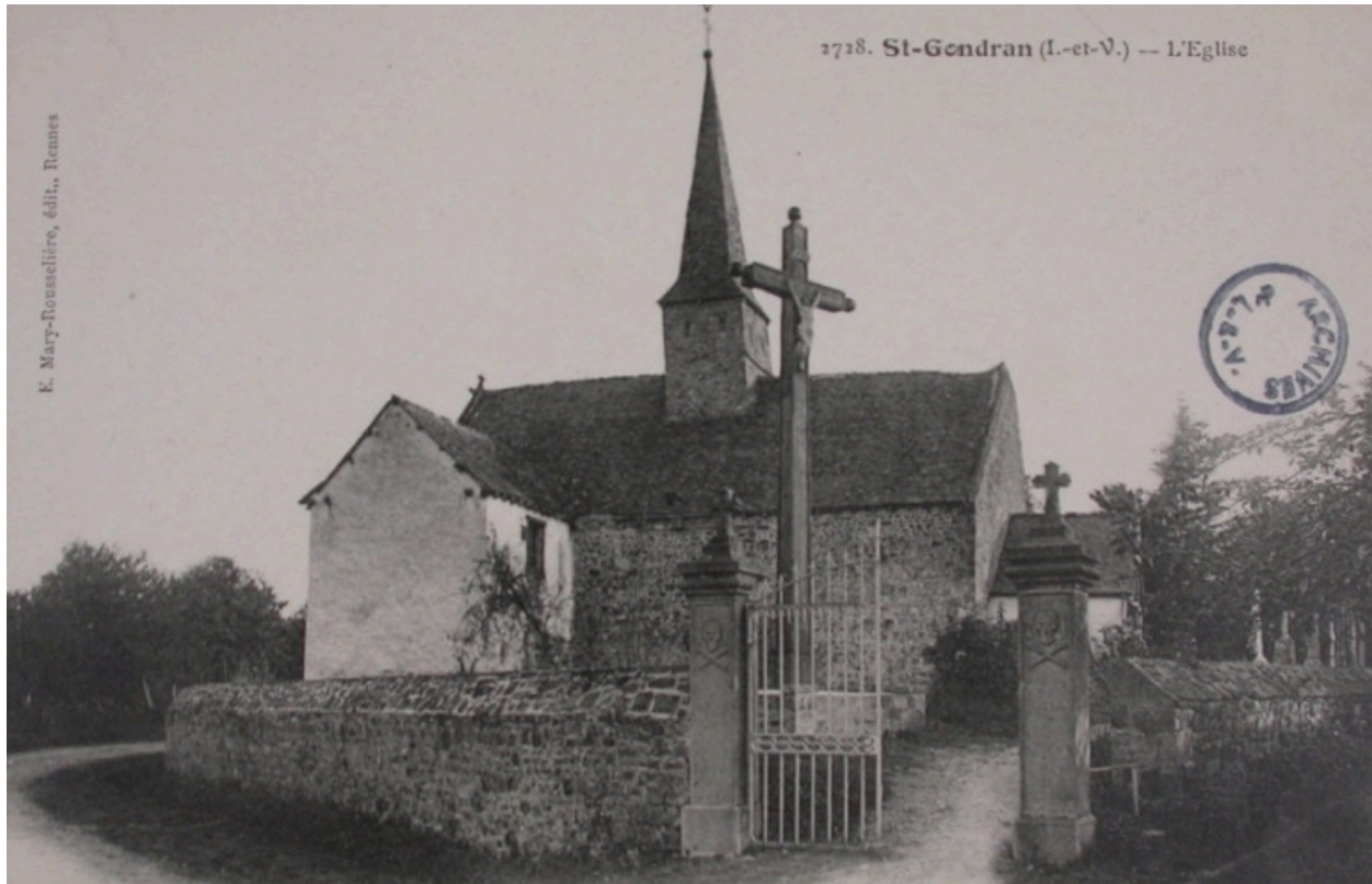
L'église sur une carte postale ancienne