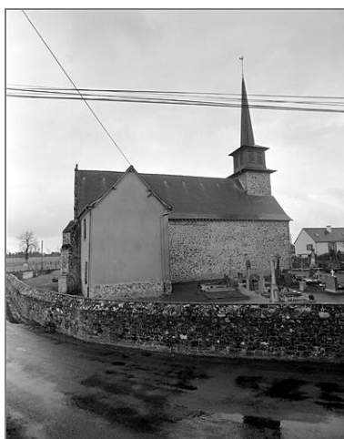
Elévation Nord : vue générale IVR53_19943500700X