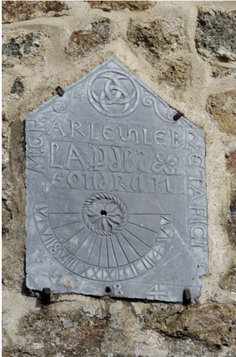
Cadran solaire, mur sud