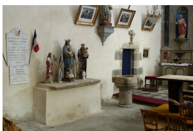
Vue intérieure, chœur, angle nord-est IVR53_20053502790NUCA