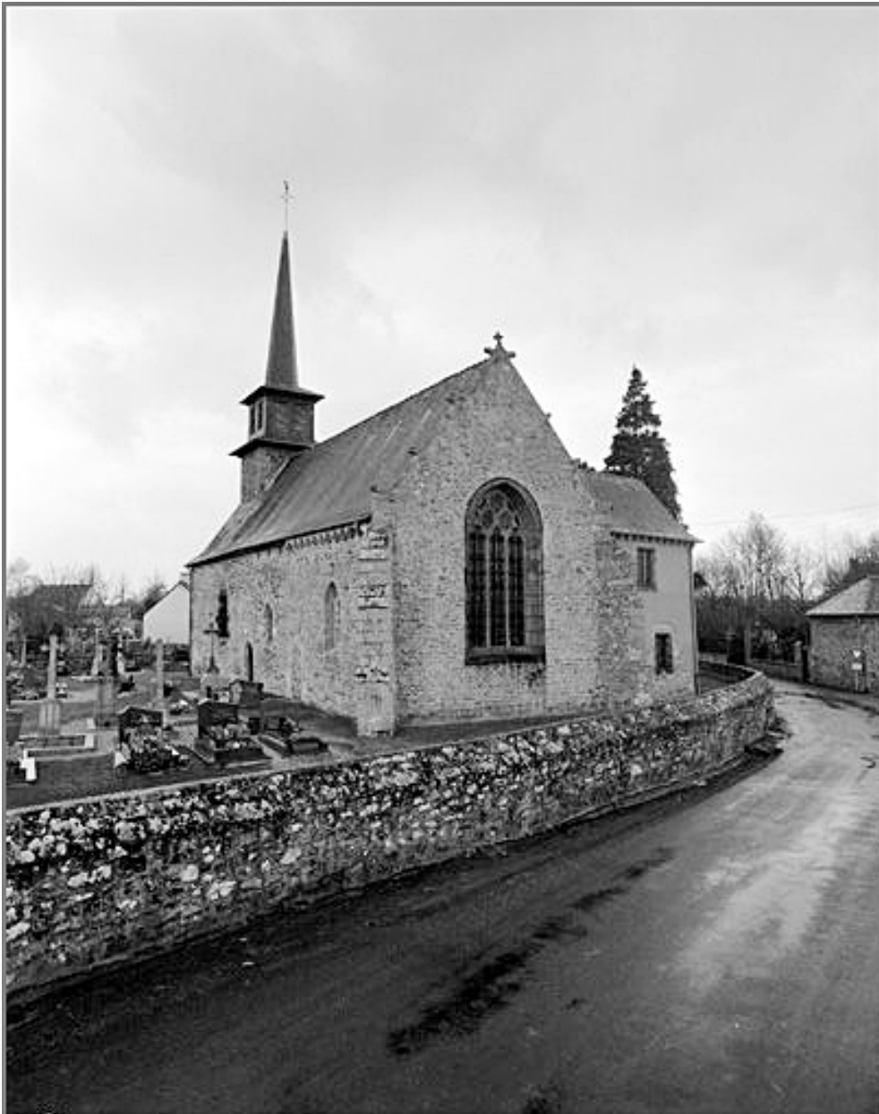
Elévation Est : vue générale