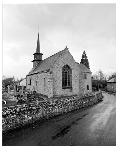
Elévation Est : vue générale IVR53_19943500699X