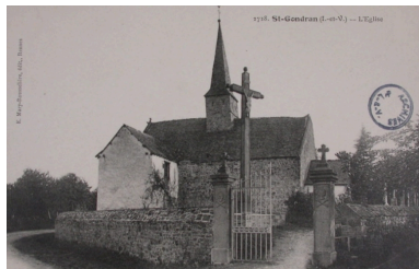
L'église sur une carte postale ancienne IVR53_20053520582NUCA