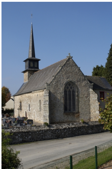
Vue sud-est IVR53_20053502787NUCA