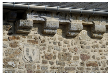
Détail de la corniche IVR53_20053502782NUCA