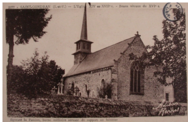
L'église sur une carte postale du début du 20e siècle