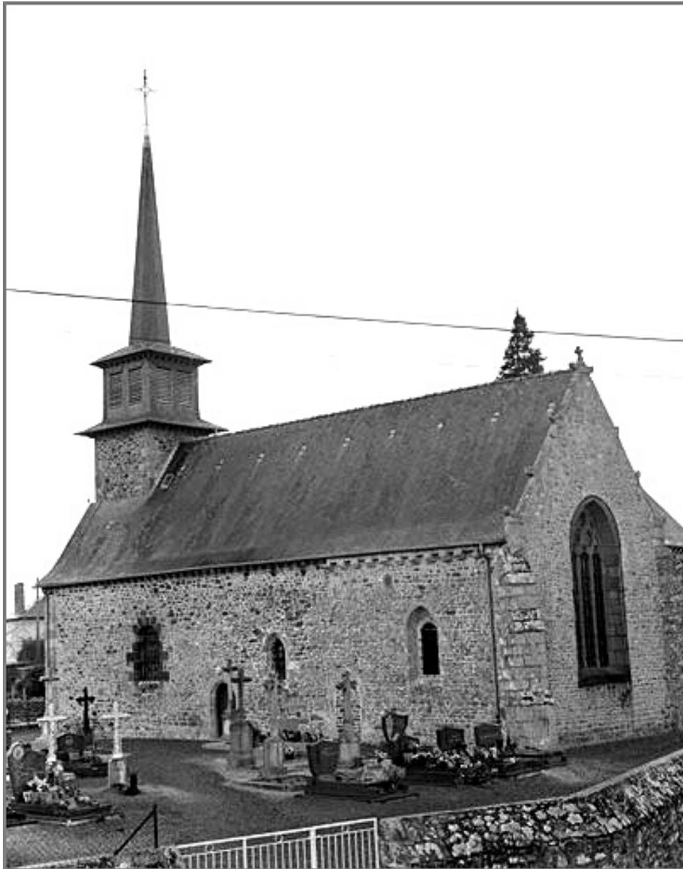
Elévation Sud-Est : vue générale