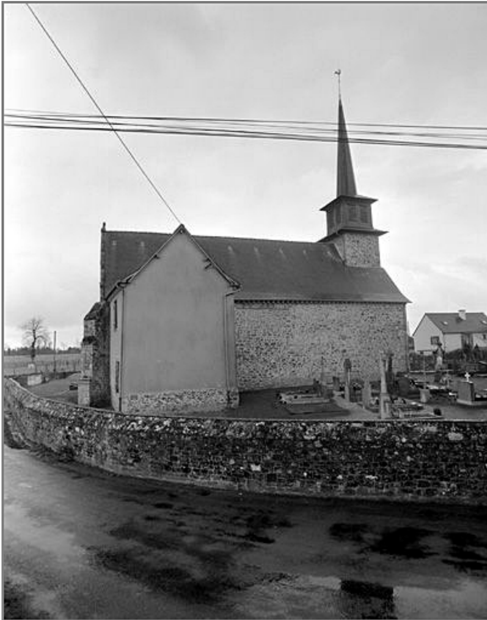
Elévation Nord : vue générale