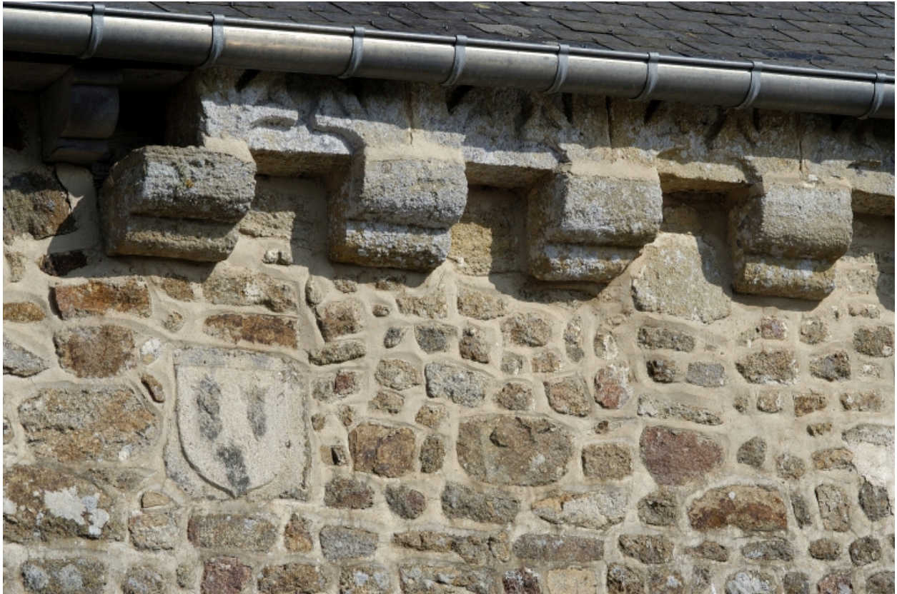
Détail de la corniche