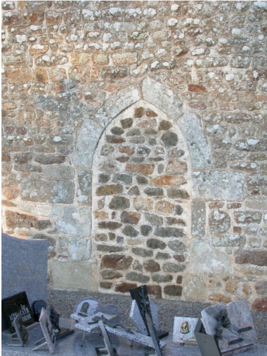
Porte murée sur le mur sud