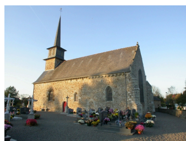
Façade sud IVR53_20053520570NUCA