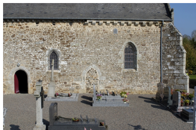
Détail de la partie sud-est IVR53_20053502783NUCA