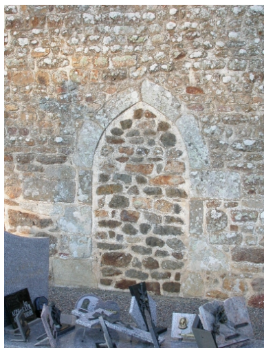
Porte murée sur le mur sud IVR53_20053520571NUCA