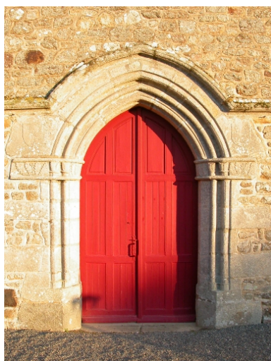
Porte ouest IVR53_20053520572NUCA