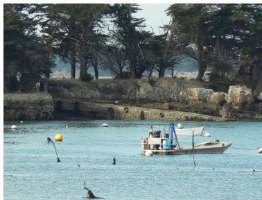
Vue générale de la cale de l'île de Boëdic