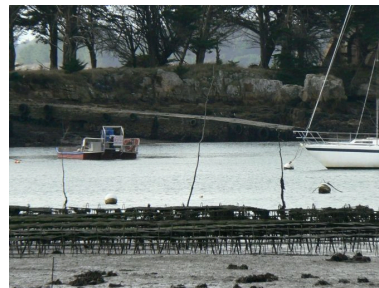
Cale de l'île de Boëdic