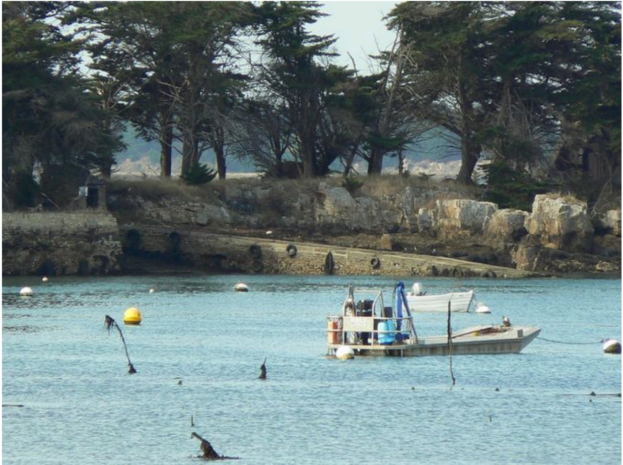
Vue générale de la cale de l'île de Boëdic