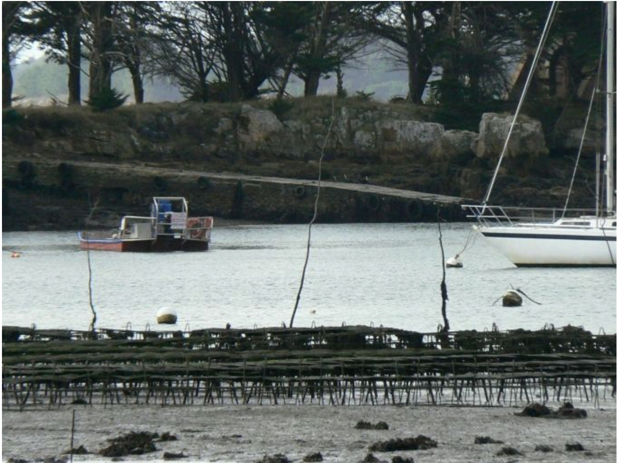
Cale de l'île de Boëdic