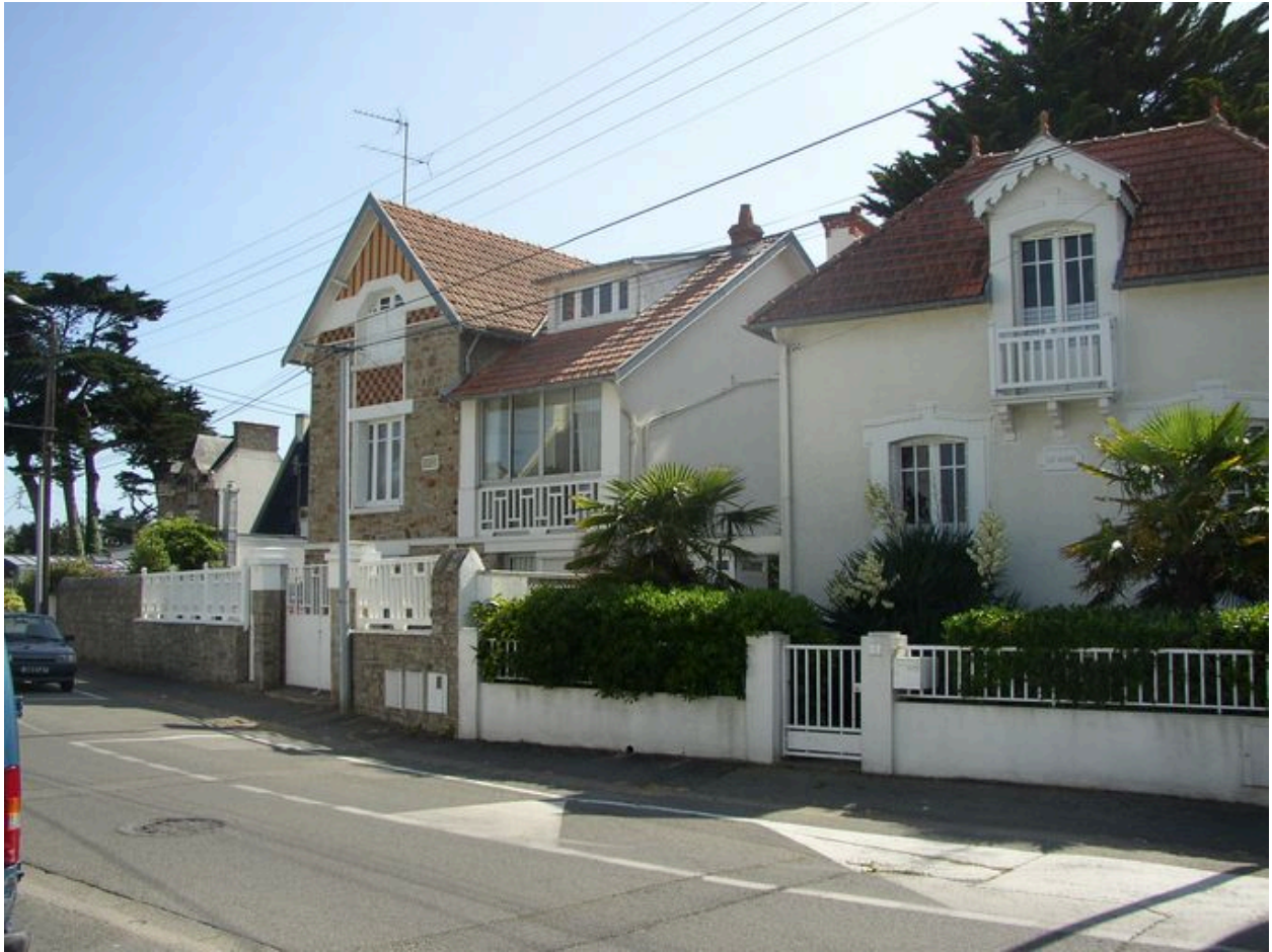
Maison de villégiature Les Glycines