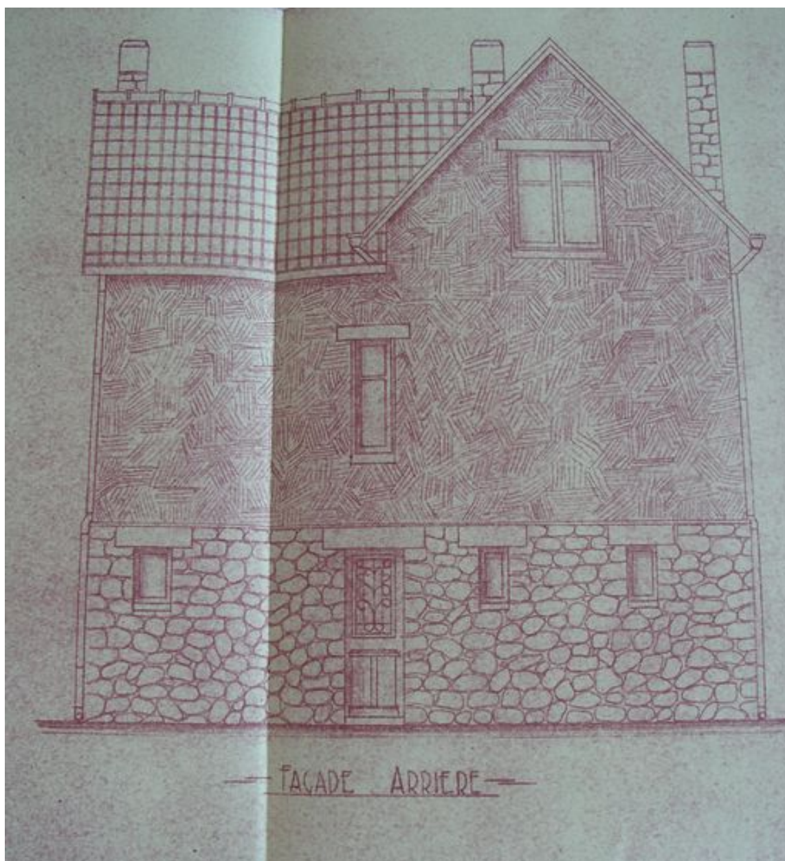
Plan datant du milieu du 20e siècle de la façade arrière de la maison de villégiature Les Glycines