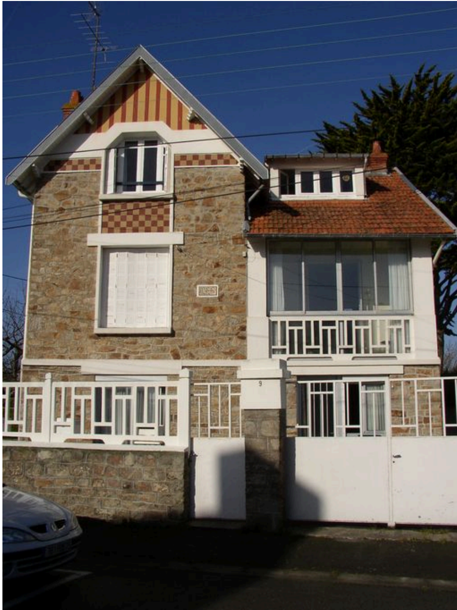
Vue générale de la maison de villégiature Les Glycines