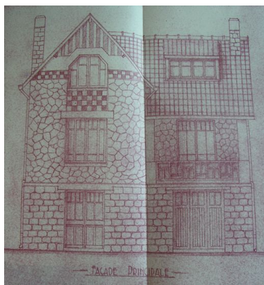
Plan datant du milieu du 20e siècle de la façade principale de la maison de villégiature Les Glycines IVR53_20075605634NUC