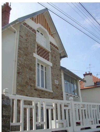
Maison de villégiature Les Glycines IVR53_20065606545NUCA