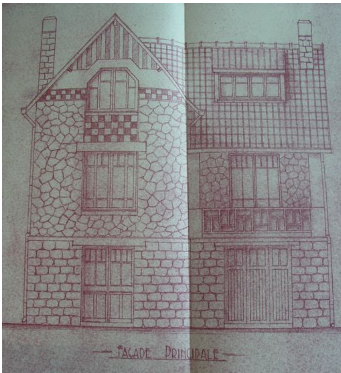
Plan datant du milieu du 20e siècle de la façade principale de la maison de villégiature Les Glycines