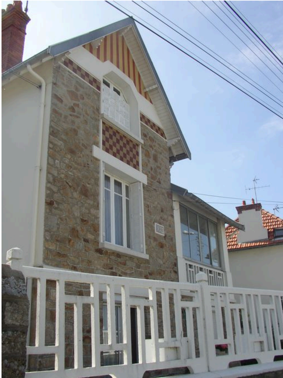
Maison de villégiature Les Glycines