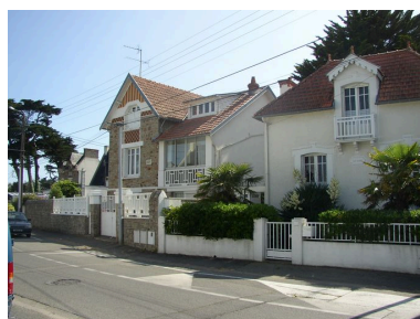
Maison de villégiature Les Glycines IVR53_20065606546NUCA