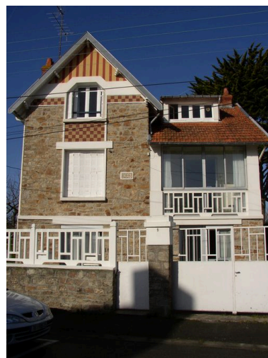
Vue générale de la maison de villégiature Les Glycines