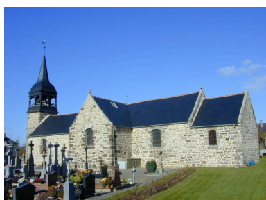
Vue générale sud-est IVR53_20013517549NUCA