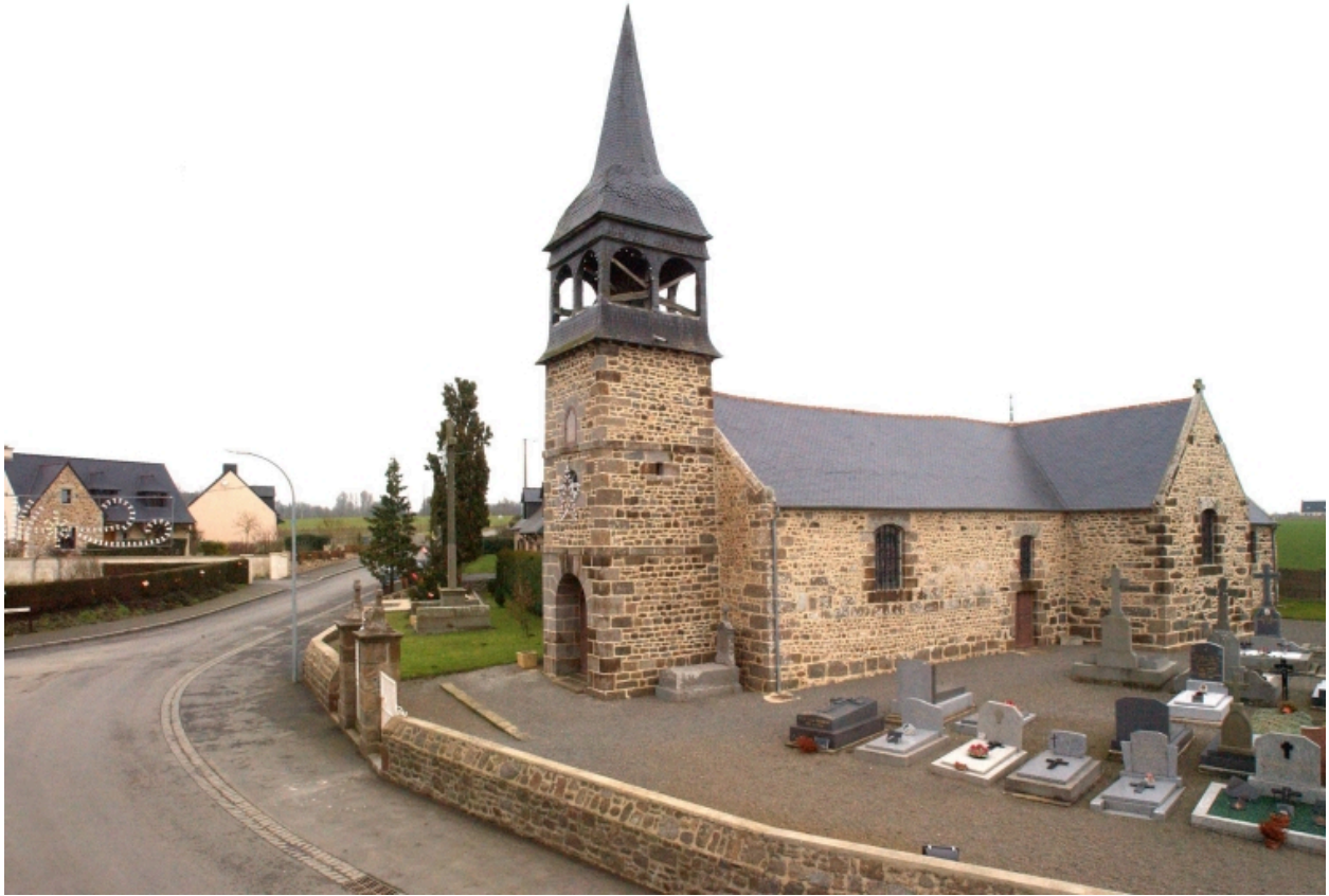
L'église Saint-Martin et son enclos : vue de situation sud-ouest