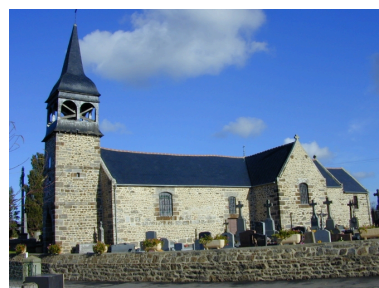
Vue générale sud-ouest IVR53_20013517548NUCA