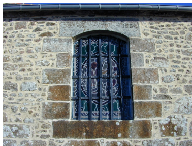
Fenêtre de la nef gravée de la date 1832 : vue générale sud IVR53_20013517553NUCA