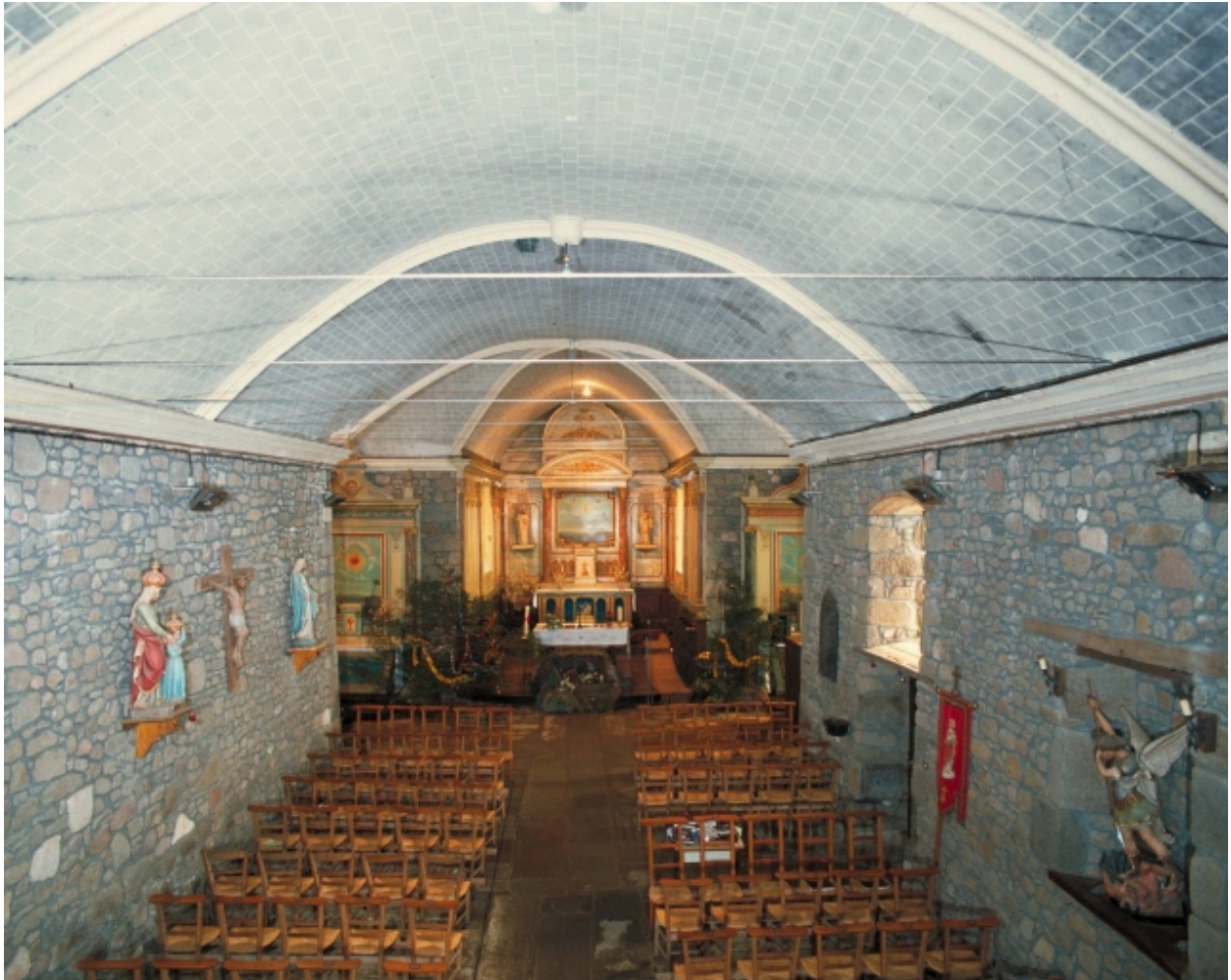
Vue intérieure prise de la nef vers le chœur