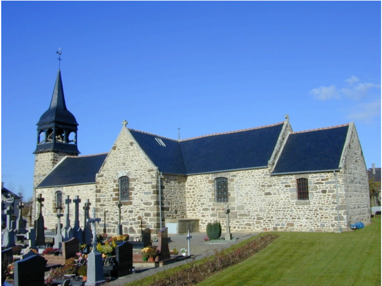
Vue générale sud-est