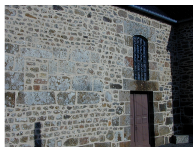
Porte donnant sur le cimetière et fenêtre murée : vue générale sud-ouest IVR53_20013517551NUCA