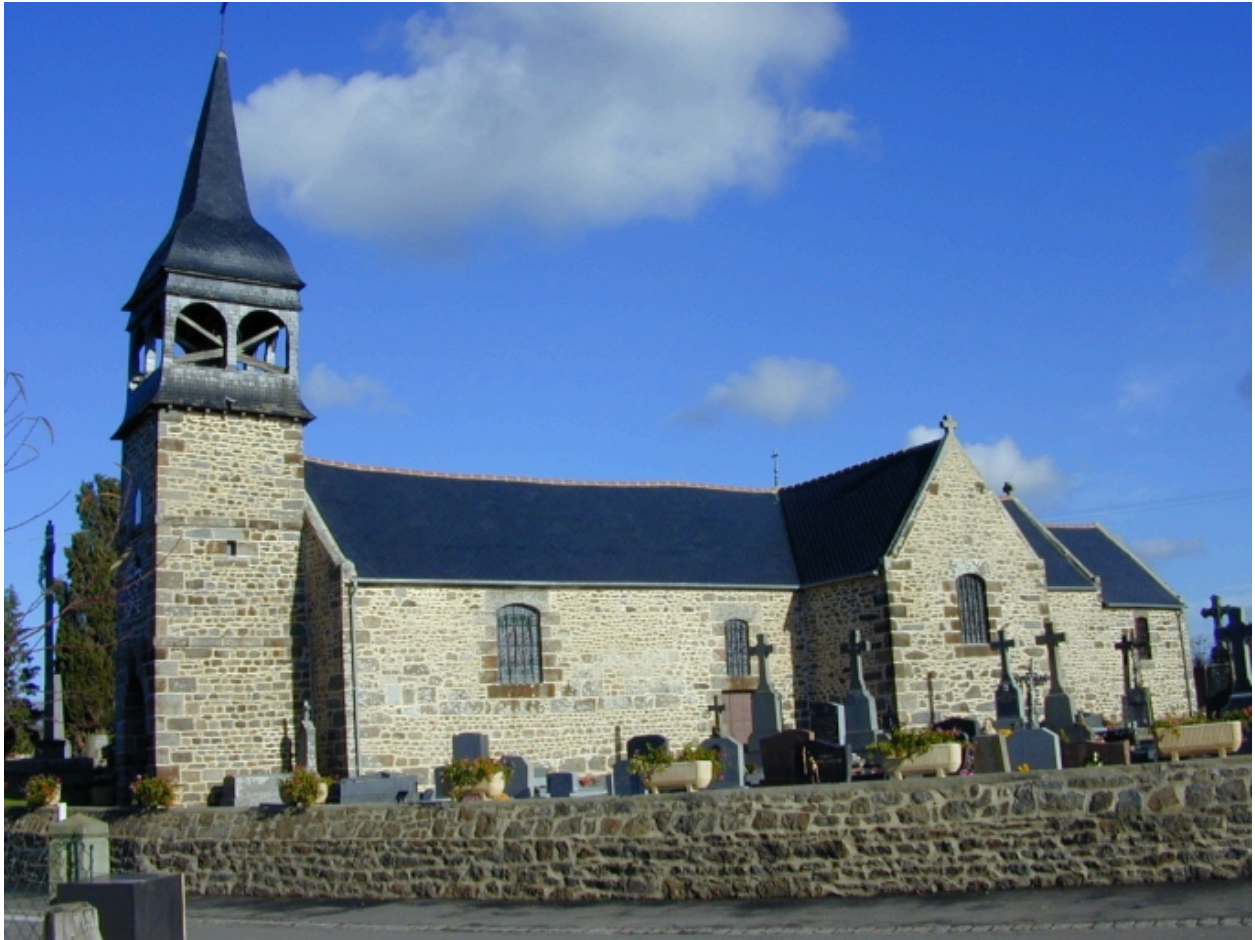
Vue générale sud-ouest