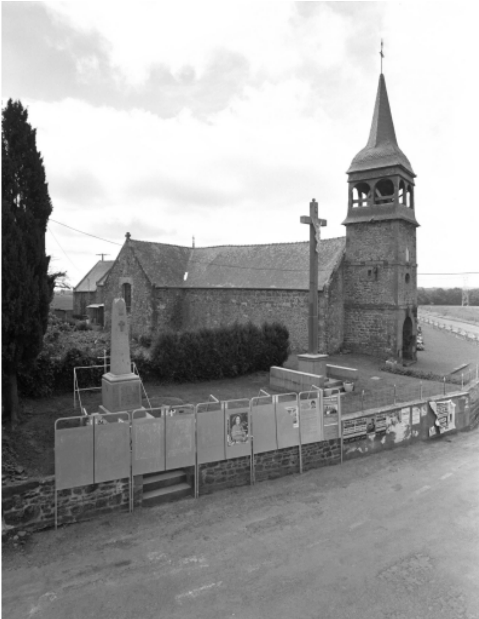
Vue générale nord-ouest