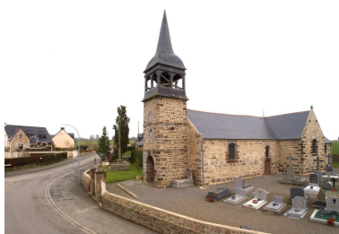
L'église Saint-Martin et son enclos : vue de situation sud-ouest IVR53_20023502519NUCA