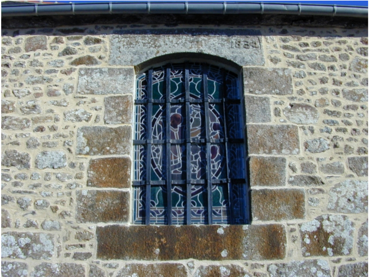
Fenêtre de la nef gravée de la date 1832 : vue générale sud