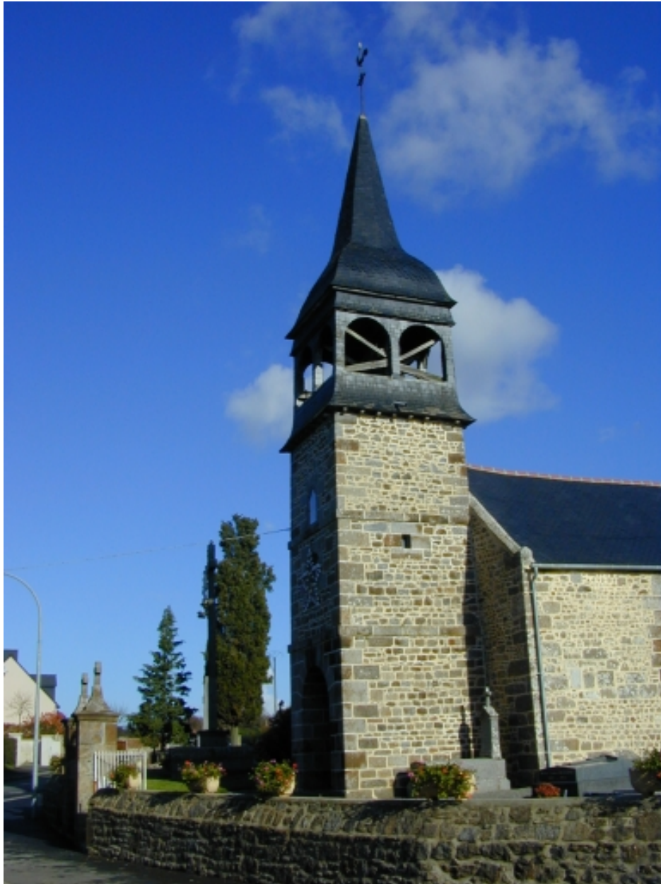
Le clocher : vue générale sud-ouest