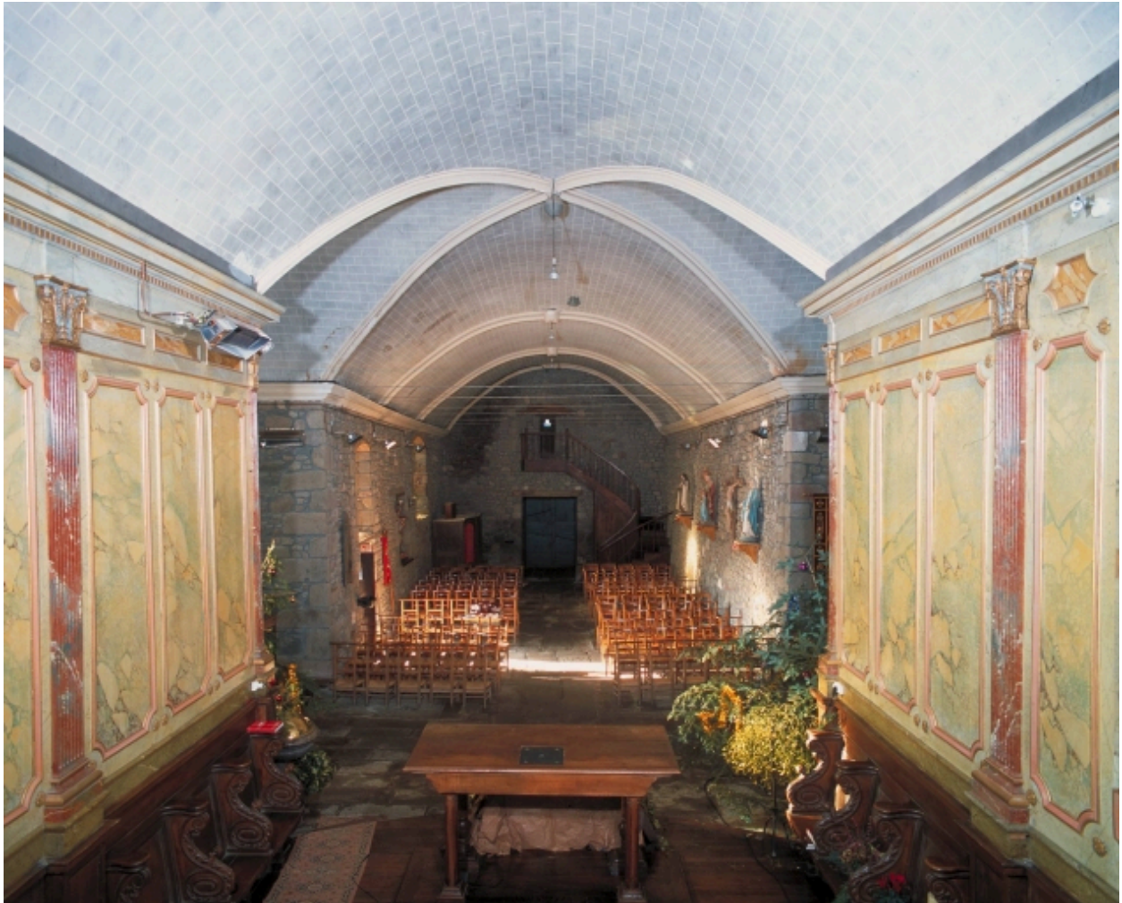
Vue intérieure prise du chœur vers la nef