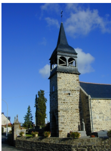
Le clocher : vue générale sud-ouest IVR53_20013517550NUCA