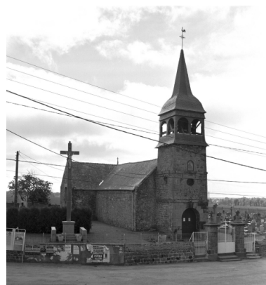
Vue générale nord-ouest IVR53_19943500611X