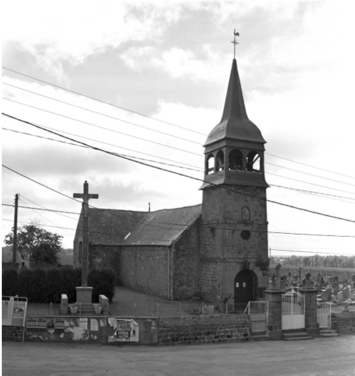
Vue générale nord-ouest