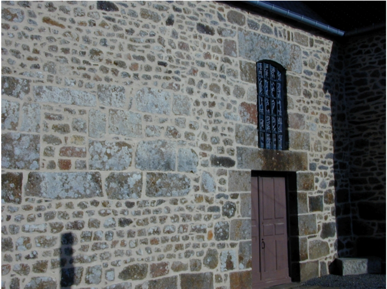
Porte donnant sur le cimetière et fenêtre murée : vue générale sud-ouest