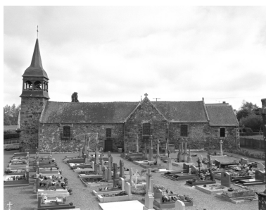
Vue générale sud IVR53_19943500610X