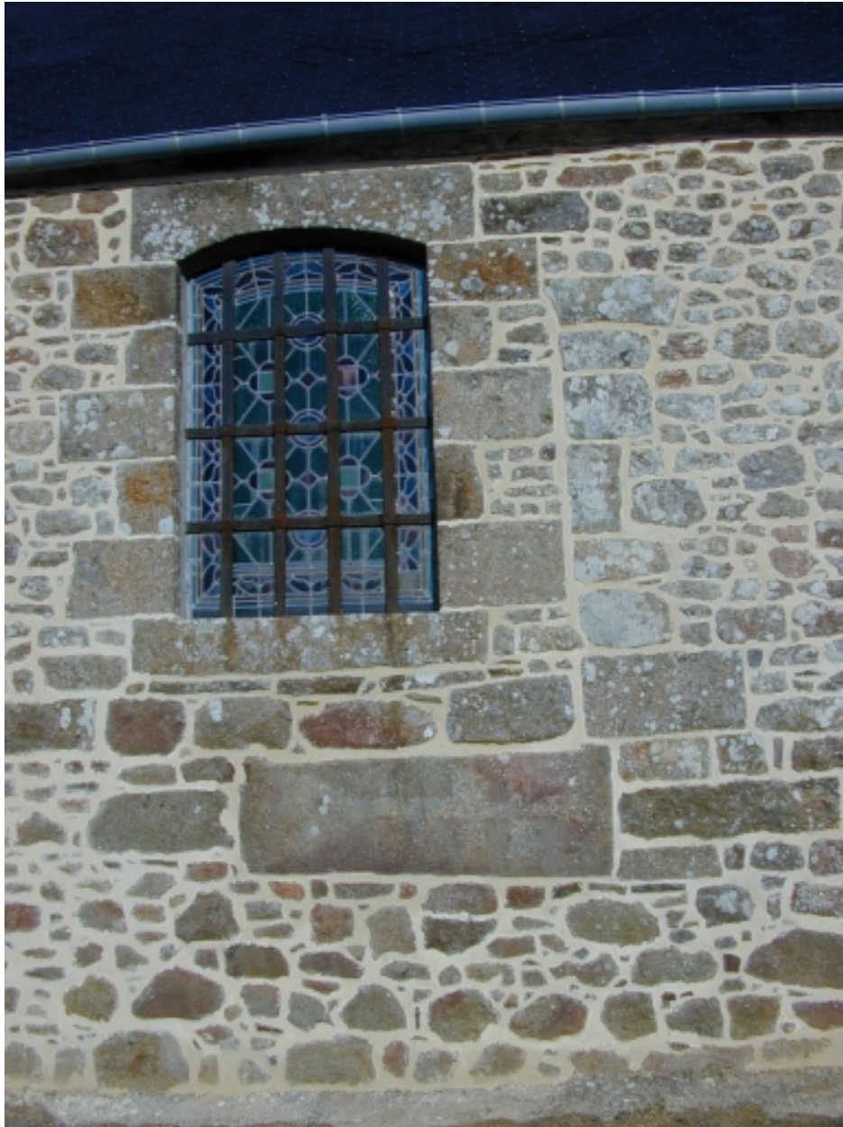
Reprise de l'ancienne fenêtre du choeur : vue générale sud-est