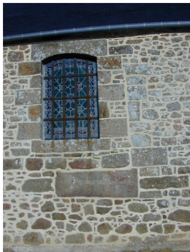
Reprise de l'ancienne fenêtre du choeur : vue générale sud-est IVR53_20013517552NUCA