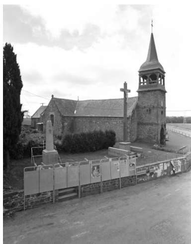
Vue générale nord-ouest IVR53_19943500612X