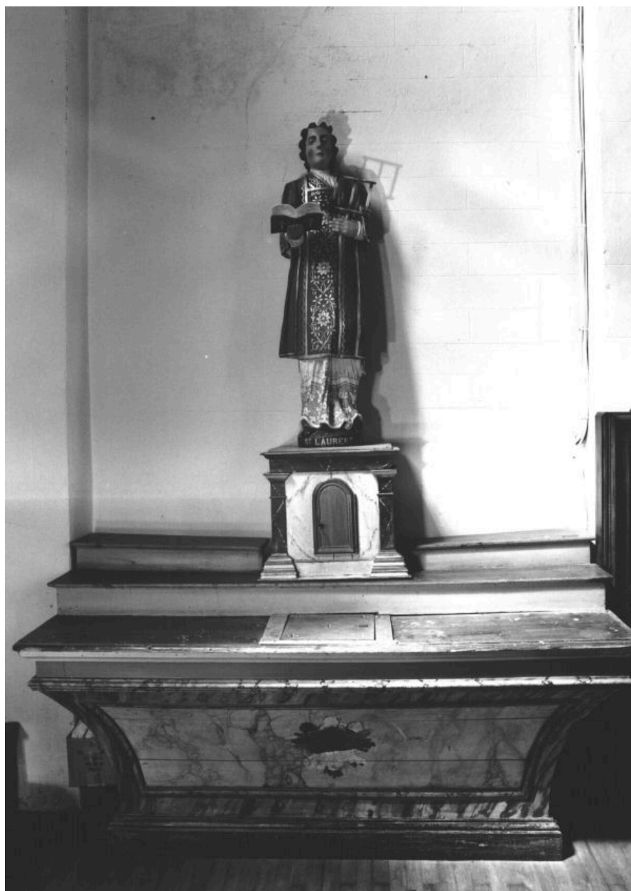
LA GRÉE SAINT-LAURENT, église paroissiale Saint-Laurent, autel, tabernacle nord, vue générale.