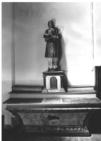
LA GRÉE SAINT-LAURENT, église paroissiale Saint-Laurent, autel, tabernacle nord, vue générale.