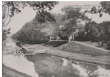
Les écluses du canal d'Ille-et- Rance sur une carte postale ancienne IVR53_20053518379NUCA