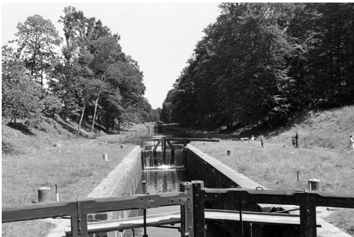
Les écluses, vue depuis la Madeleine