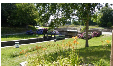
Vue de l'écluse et du pont IVR53_20243531608NUCA