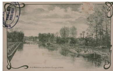
Les écluses