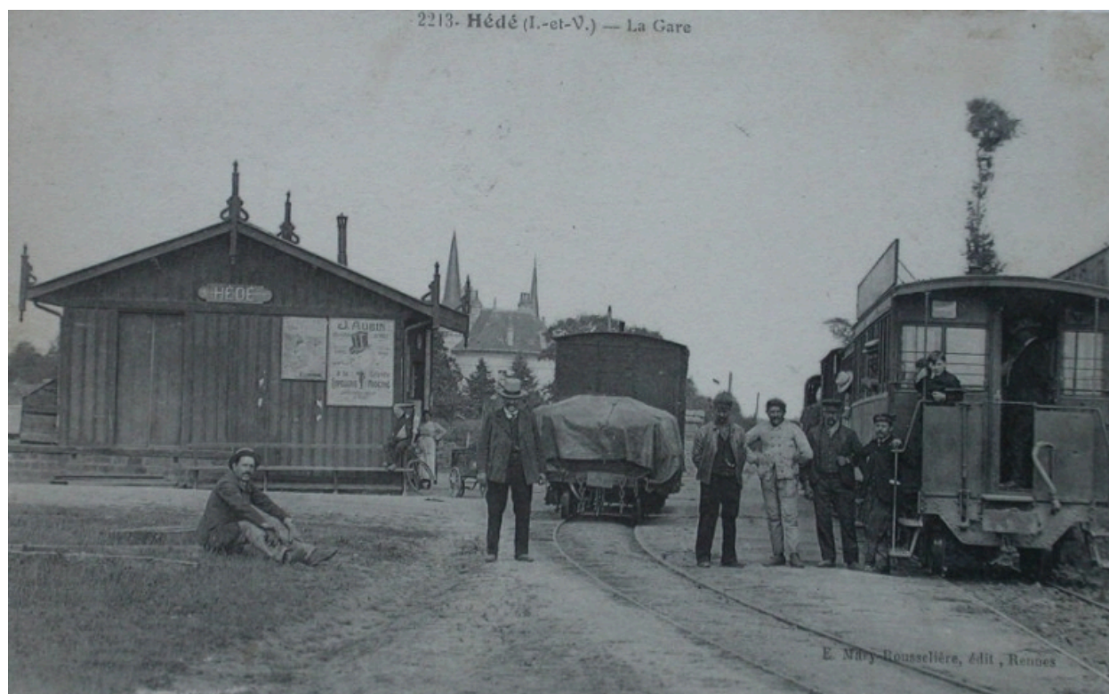
La gare de Hédé sur une carte postale ancienne