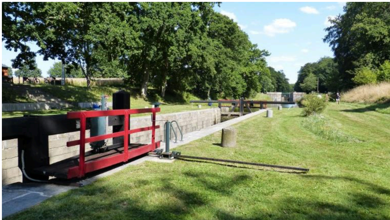
Vue de l'écluse