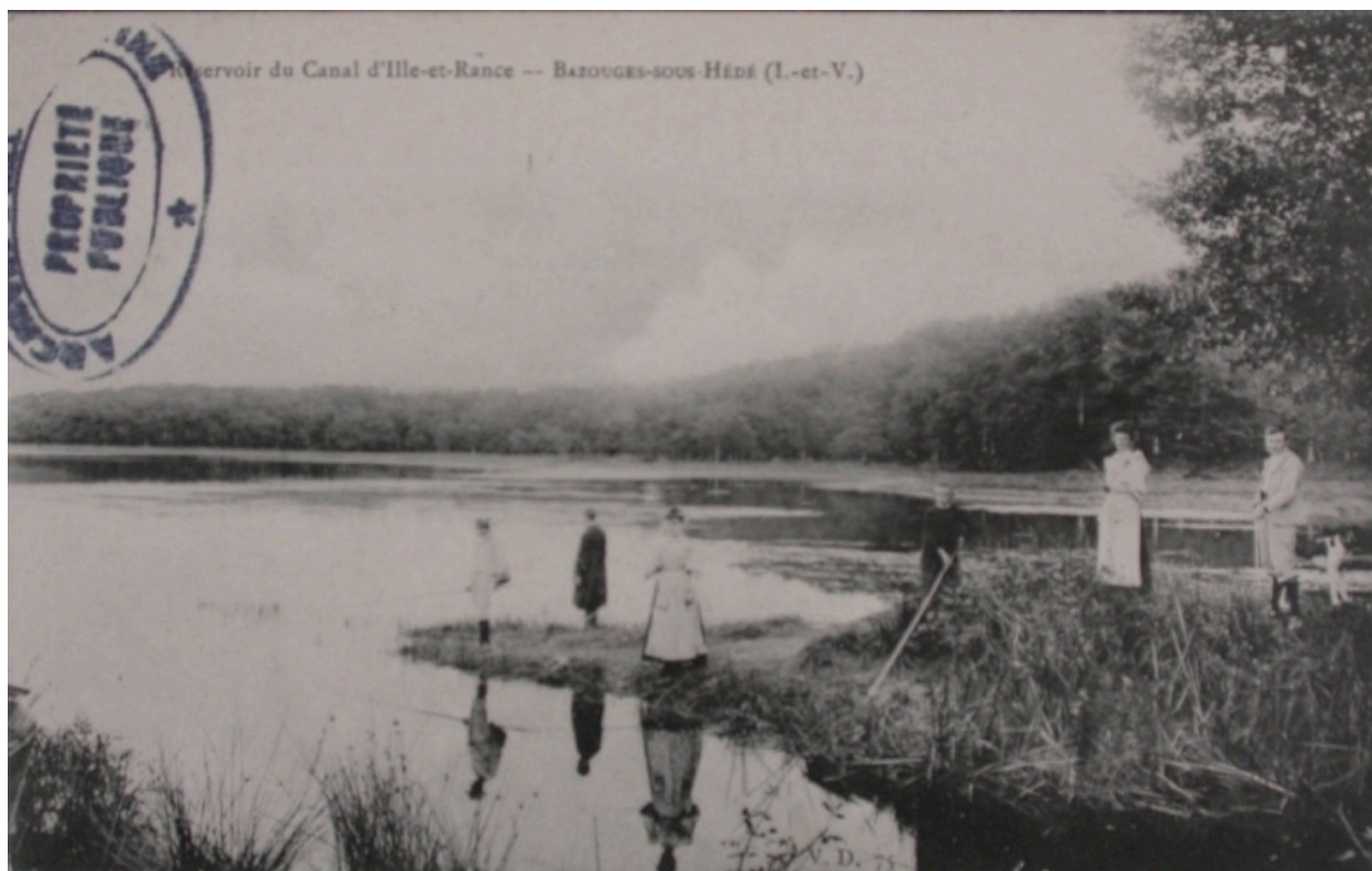
Le réservoir du canal sur une ancienne carte postale