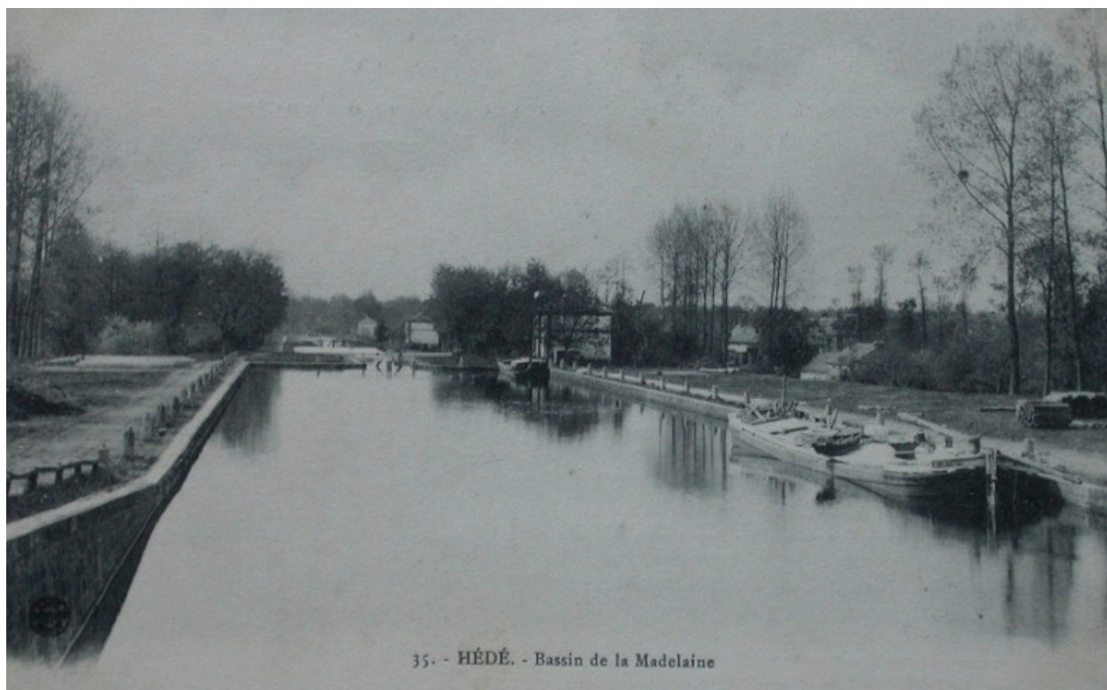
Carte postale ancienne du bassin de la Madeleine