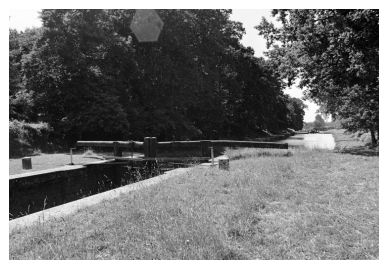
Les écluses IVR53_19753501165Z