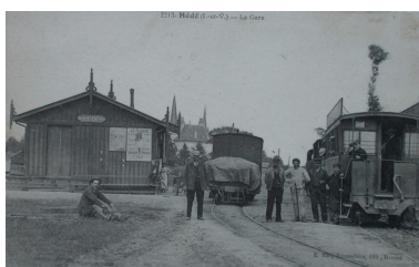
La gare de Hédé sur une carte postale ancienne