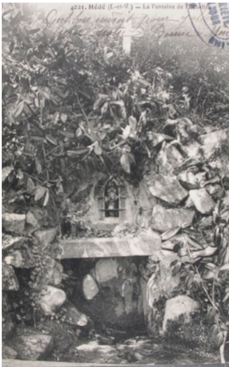
La Fontaine de l'Ecuelle