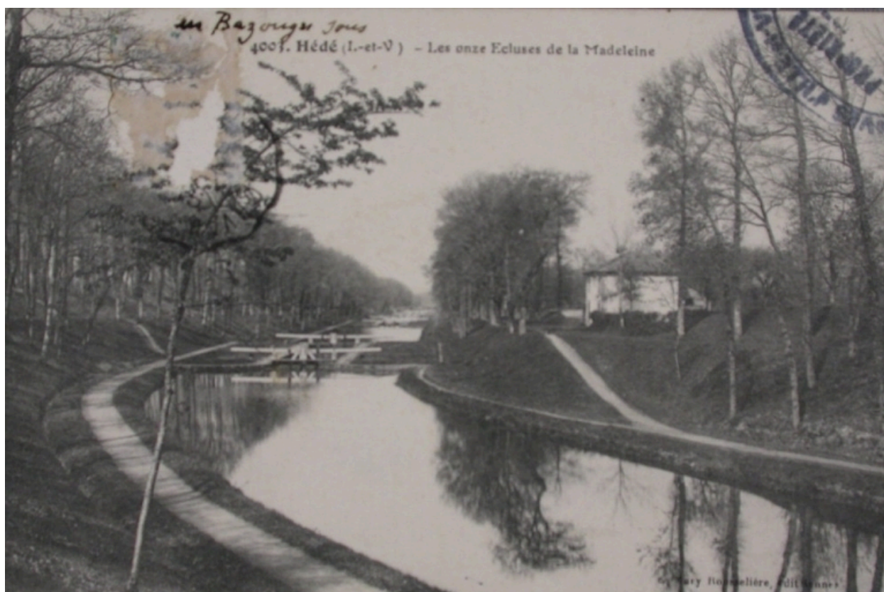
Les écluses sur une carte postale du début du 20e siècle