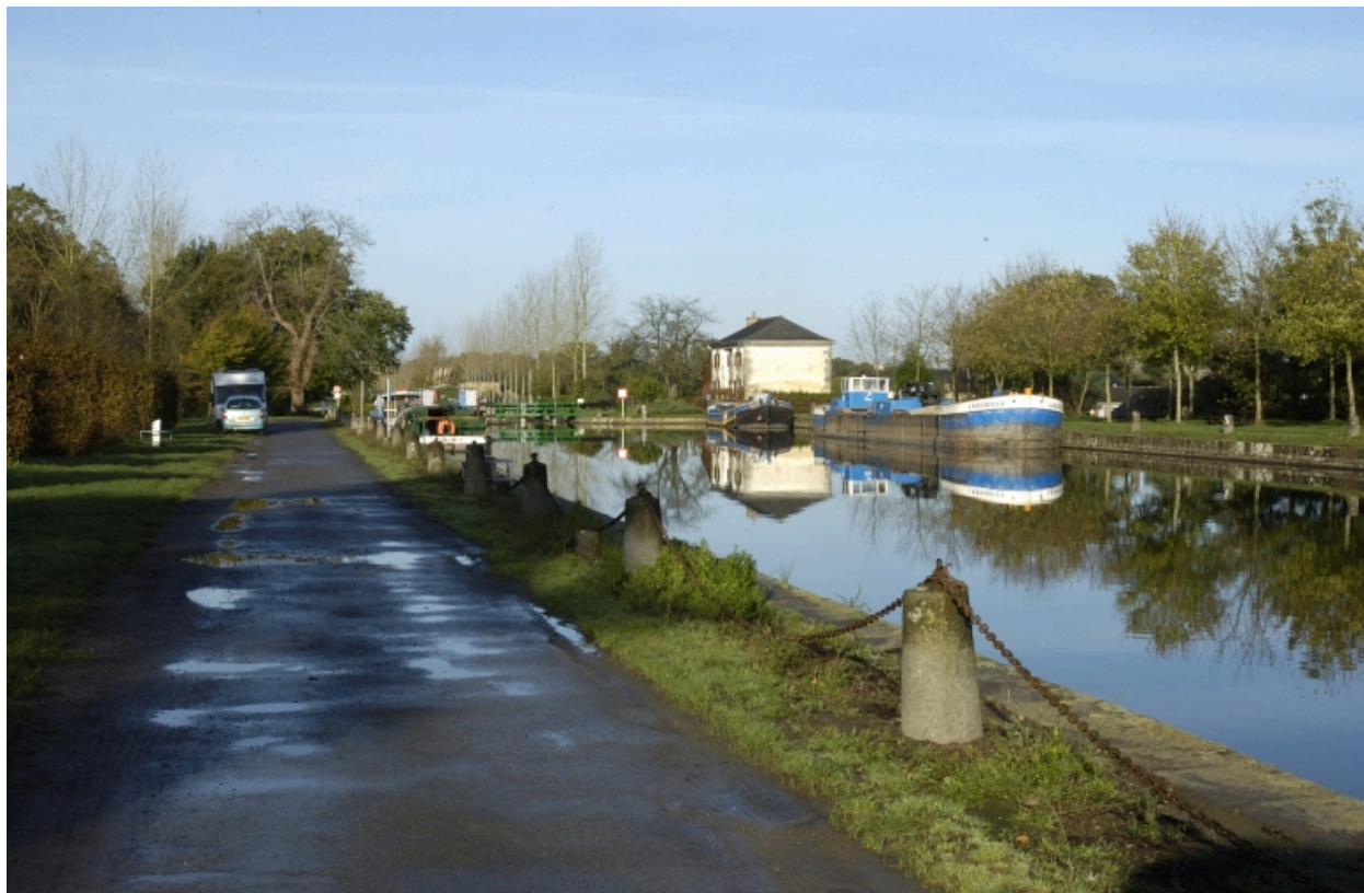
Le canal d'Ille-et-Rance