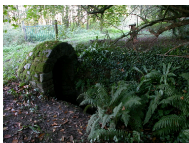
La fontaine du Pertuis Chaud