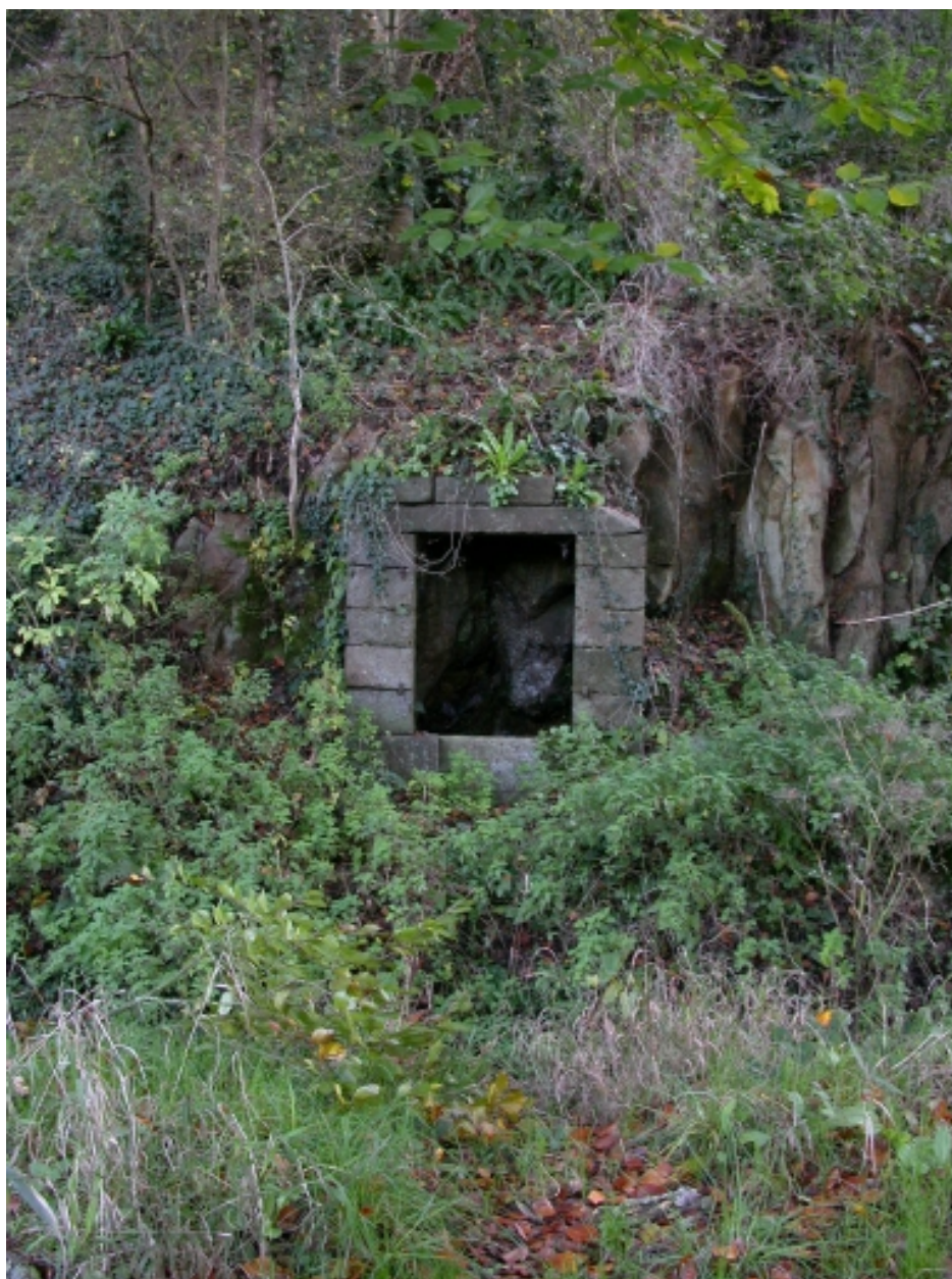
La fontaine de la côte du Chat