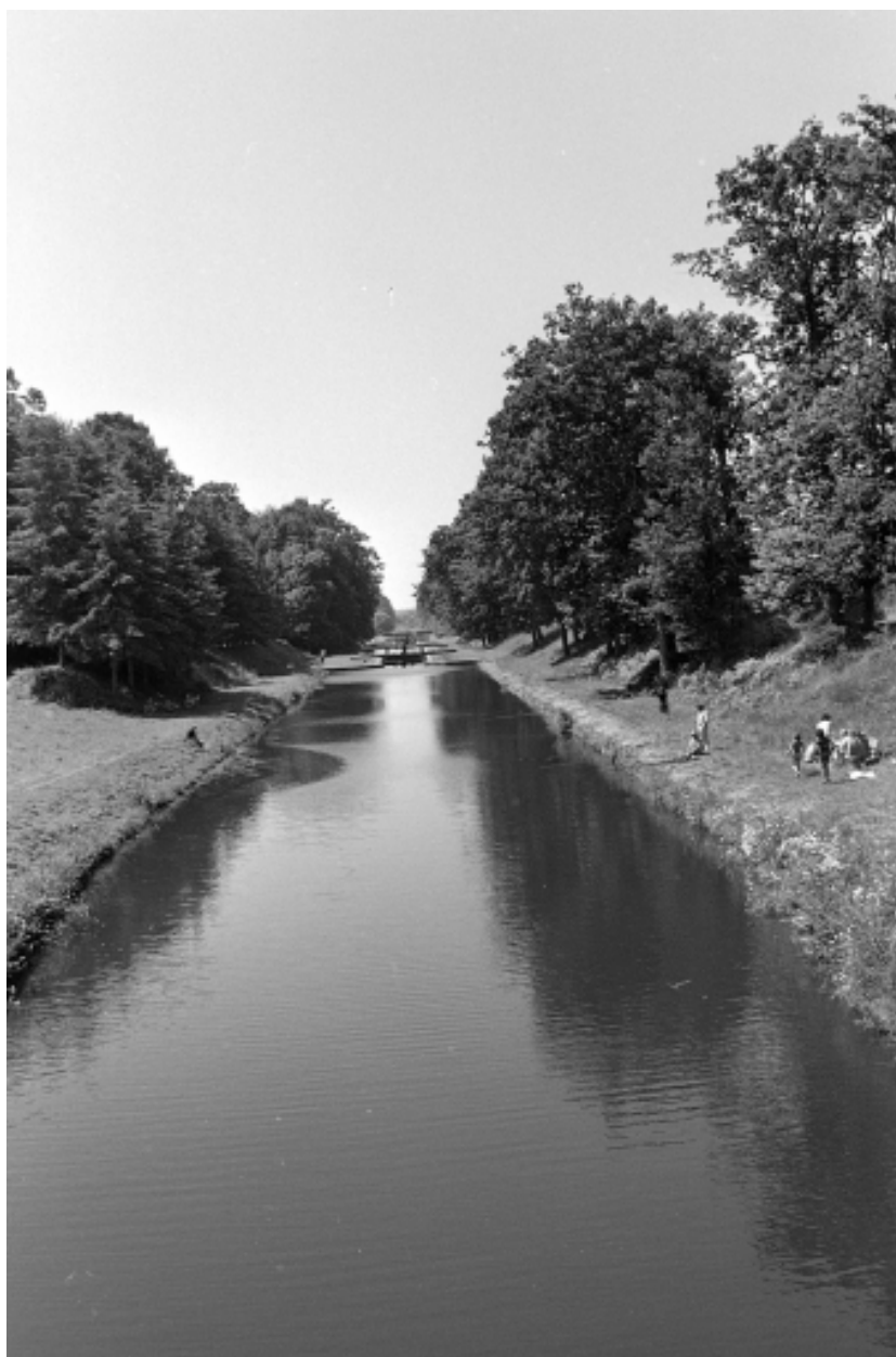
Le canal en 1975