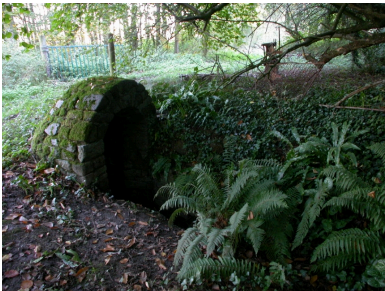
La fontaine du Pertuis Chaud