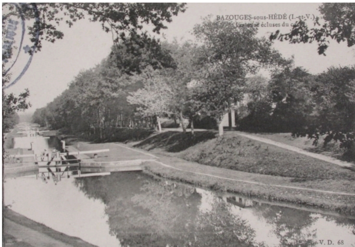
Les écluses du canal d'Ille-et-Rance sur une carte postale ancienne