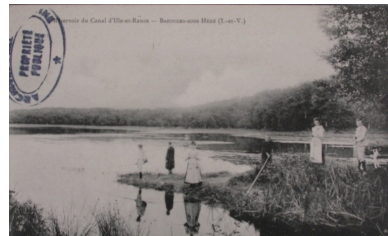
Le réservoir du canal sur une ancienne carte postale IVR53_20053518381NUCA