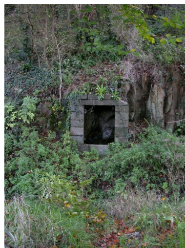
La fontaine de la côte du Chat