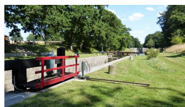
Vue de l'écluse IVR53_20243531596NUCA