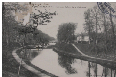
Les écluses sur une carte postale du début du 20e siècle IVR53_20053518380NUCA