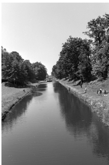
Le canal en 1975 IVR53_19753501164Z