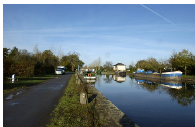
Vue générale du canal à la Madeleine IVR53_20053503037NUCA