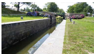
Vue vers l'ouest IVR53_20243531606NUCA