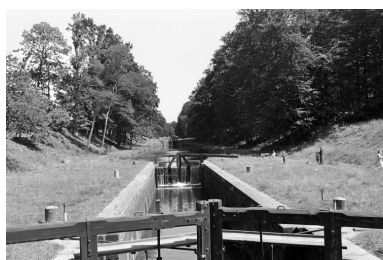
Les écluses, vue depuis la Madeleine IVR53_19753501163Z