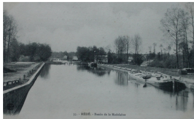
Carte postale ancienne du bassin de la Madeleine IVR53_20053519253NUCA