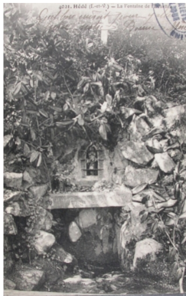
La Fontaine de l'Ecuellée IVR53_20053518360NUCA