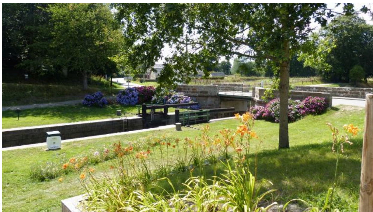
Vue de l'écluse et du pont