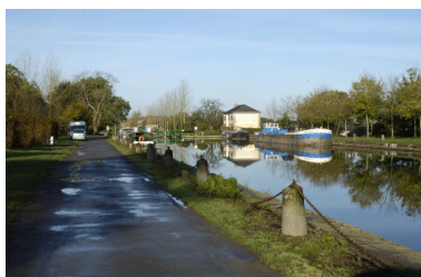
Le canal d'Ille-et-Rance IVR53_20053503035NUCA