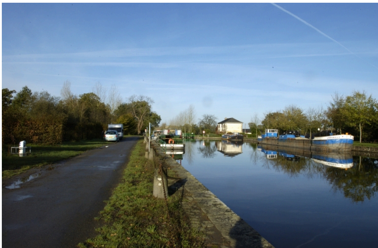
Vue générale du canal à la Madeleine