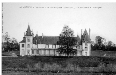
Vue générale nord IVR53_20042209067NUCB