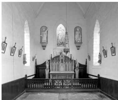
Intérieur : vue générale vers le chœur