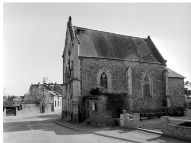
Elévation Ouest : vue générale IVR53_19933500171X