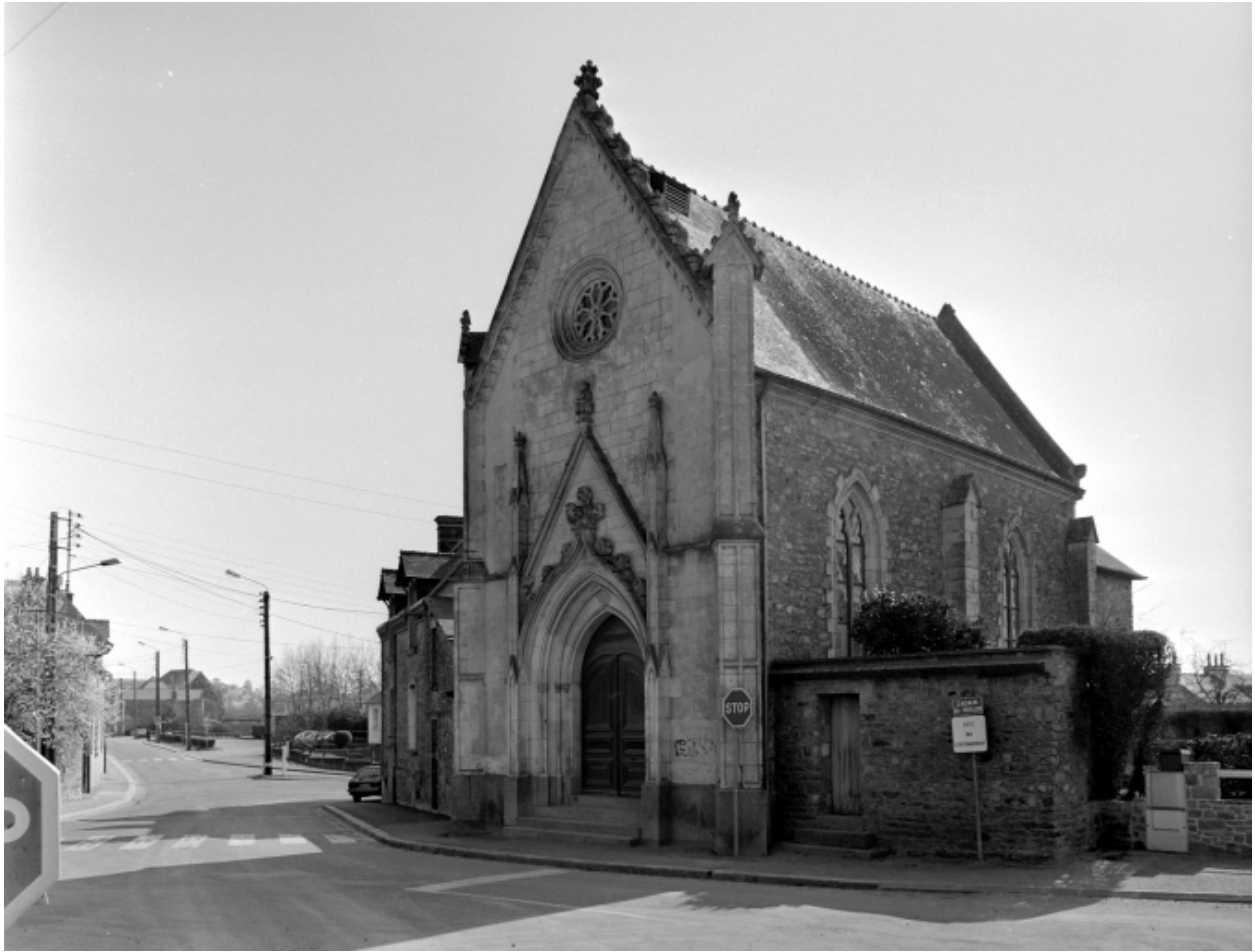
Elévation Nord : vue générale