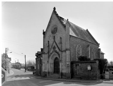
Elévation Nord : vue générale IVR53_19933500172X