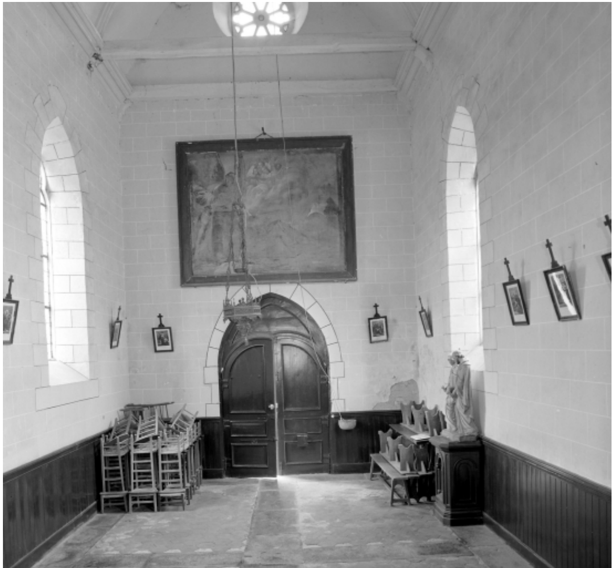
Intérieur, nef : vue générale