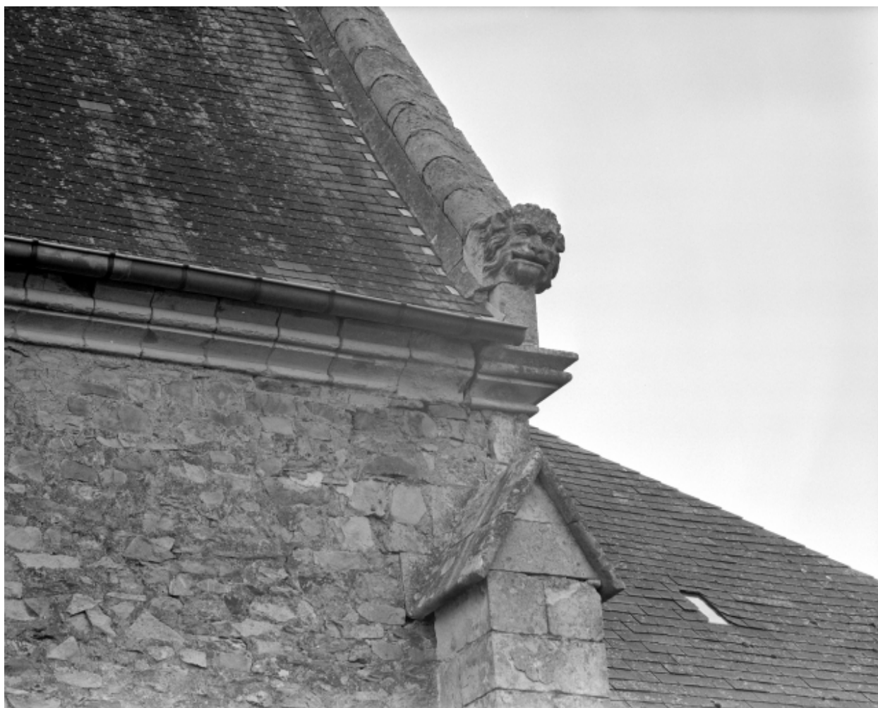
Elévation Ouest, pignon Sud, tête de lion : vue générale