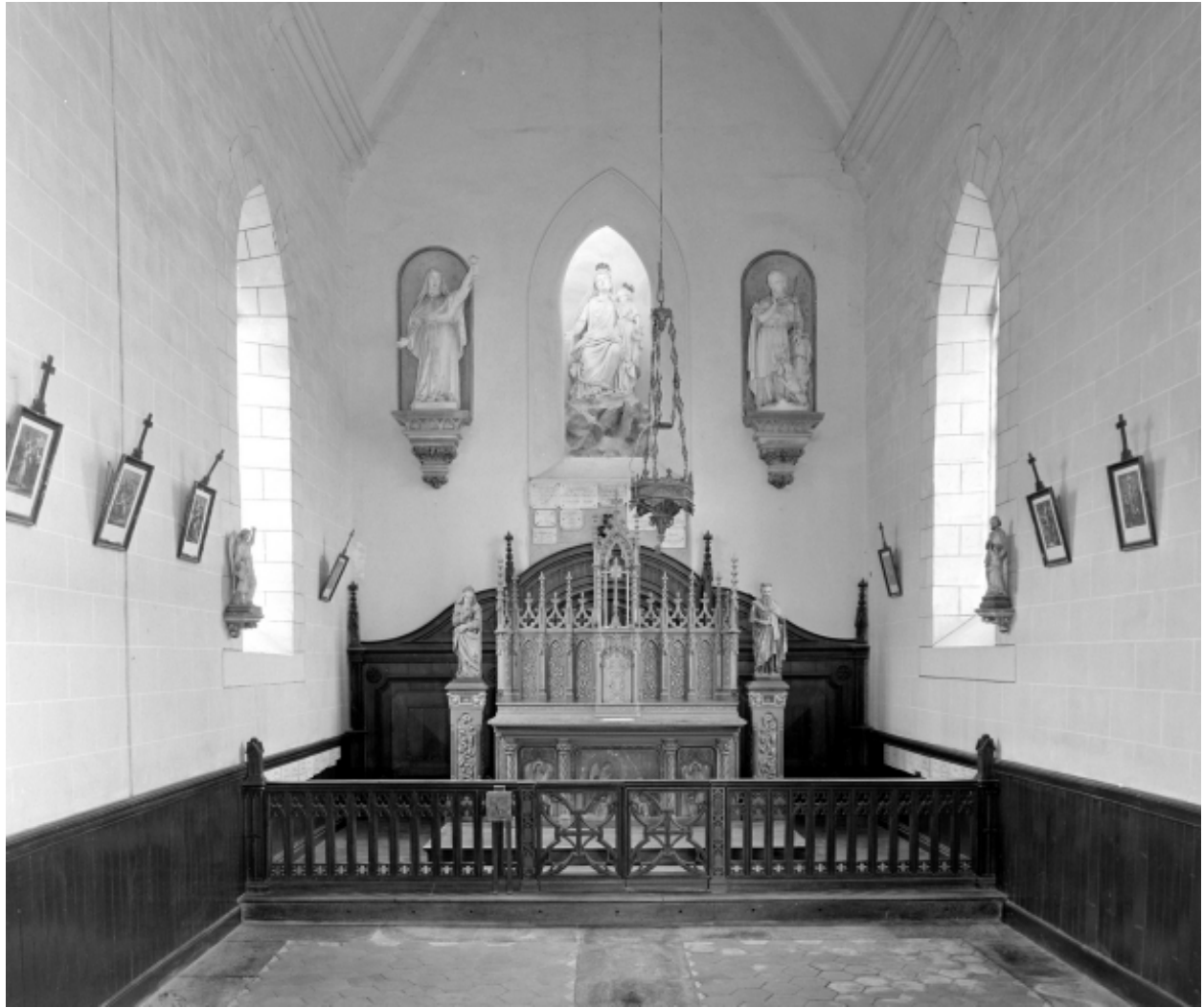
Intérieur : vue générale vers le choeur