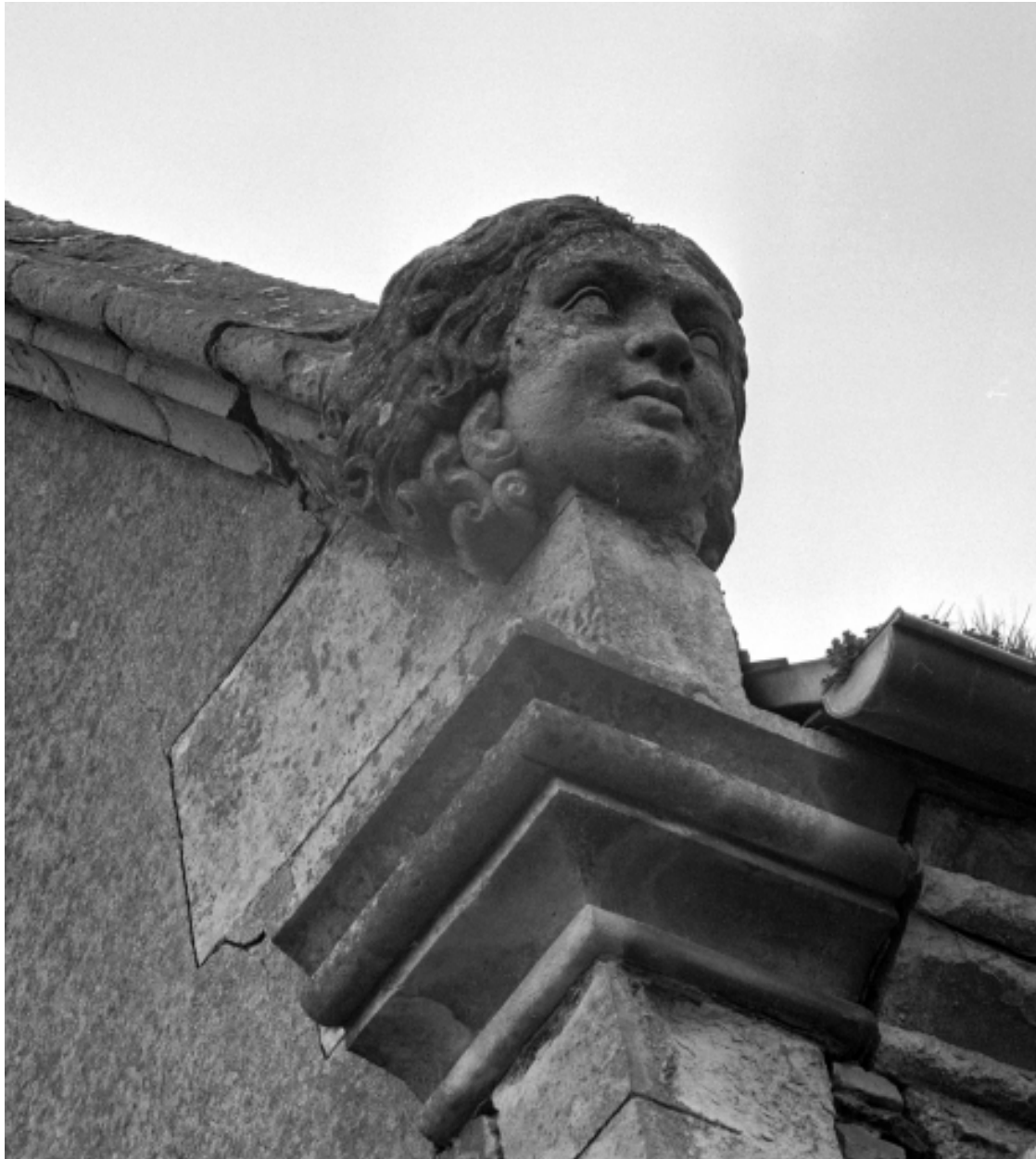
Elévation Est, pignon Sud, tête de femme : vue générale