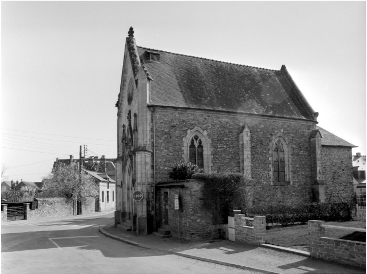
Elévation Ouest : vue générale