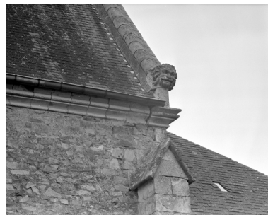
Elévation Ouest, pignon Sud, tête de lion : vue générale IVR53_19933500424X