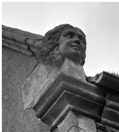
Elévation Est, pignon Sud, tête de femme : vue générale IVR53_19933500425X