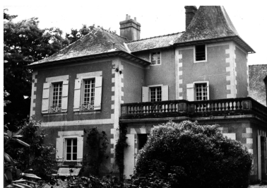
Façade antérieure du logis IVR53_20013503305X