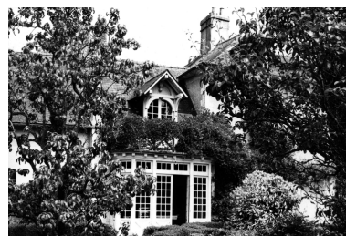
Façade ouest : détail de la véranda IVR53_19783501050X