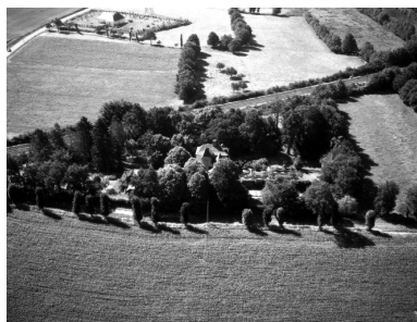
Vue aérienne prise du nord IVR53_19843500723X