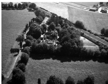
Vue aérienne prise de l'ouest IVR53_19843500733X