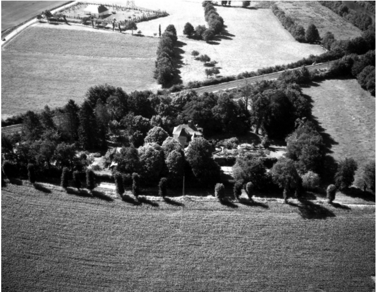
Vue aérienne prise du nord