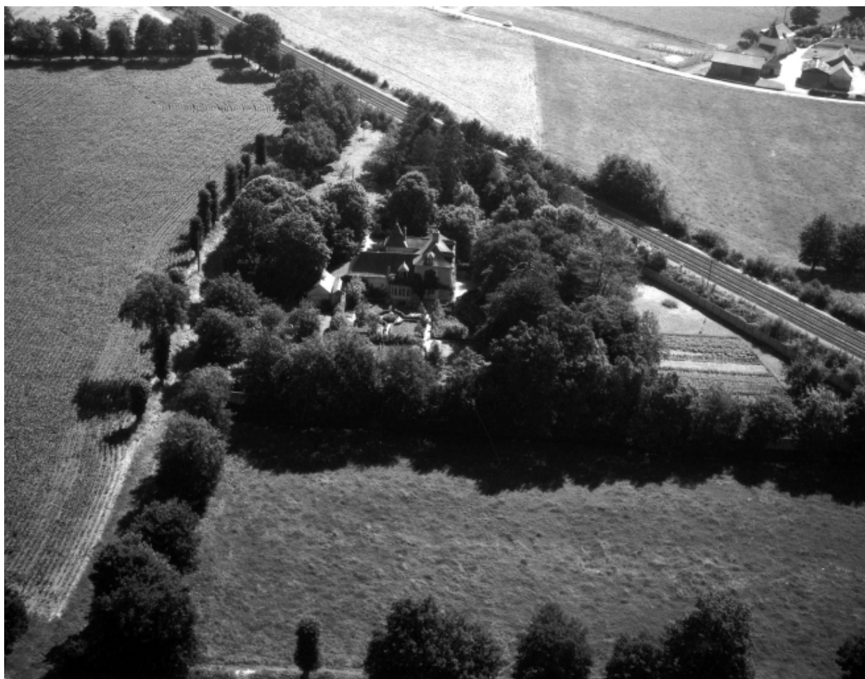
Vue aérienne prise de l'ouest