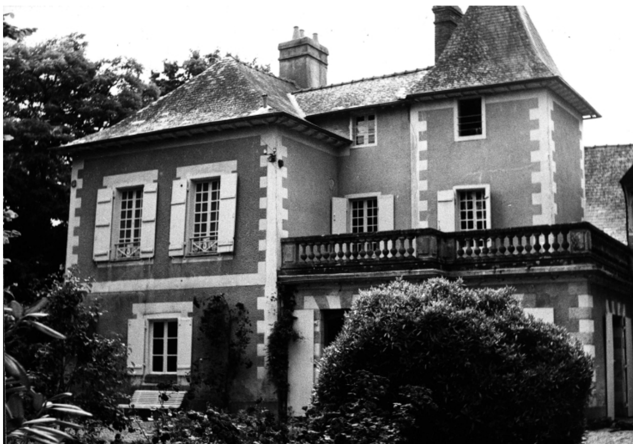
Façade antérieure du logis