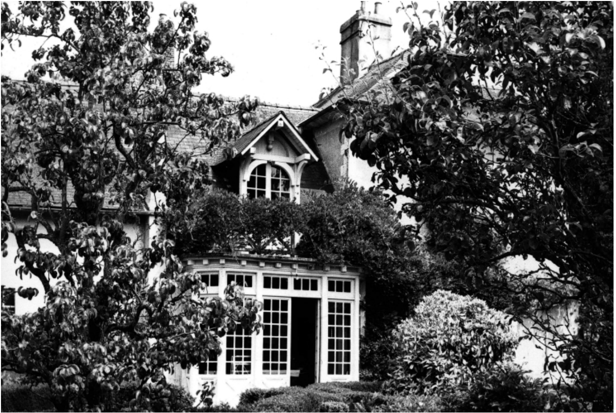
Façade ouest : détail de la véranda