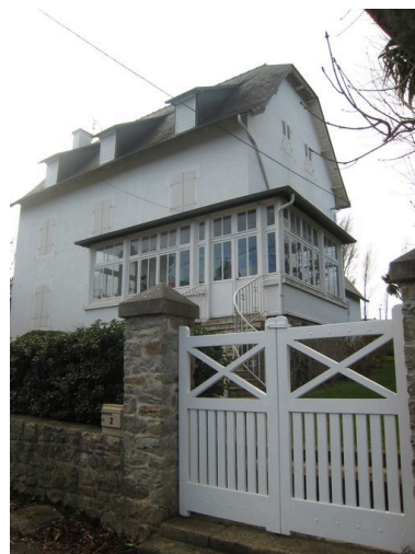
Vue générale IVR53_20072908795NUCA