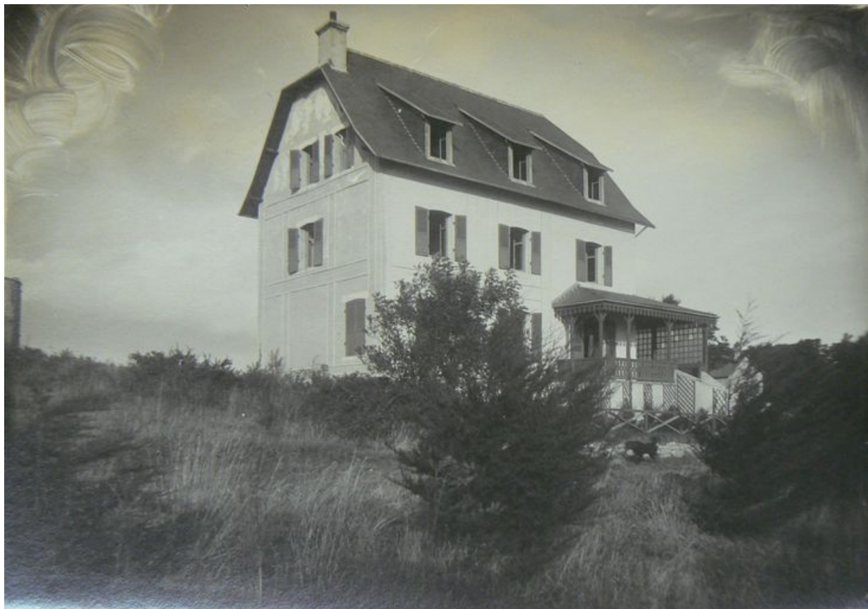
Vue ancienne de la villa