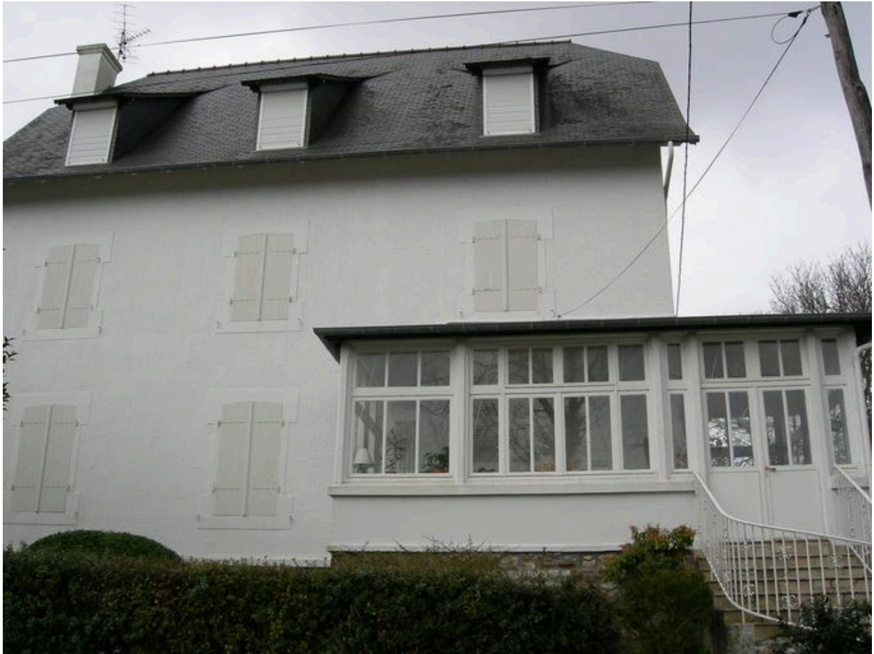
Vue arrière de la villa