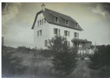
Vue ancienne de la villa