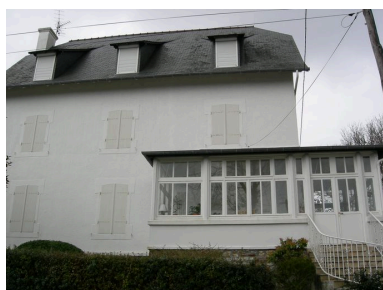
Vue arrière de la villa