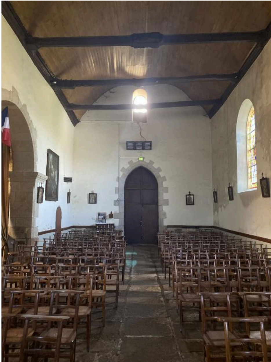
Vue générale de l'intérieur