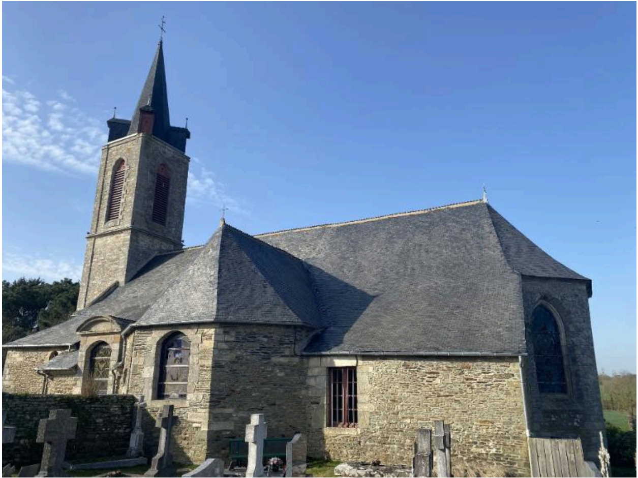
Vue sud-est, depuis le cimetière