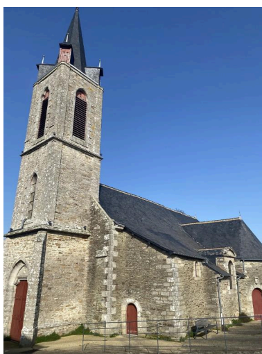
Vue sud-ouest IVR53_20265610537NUCA