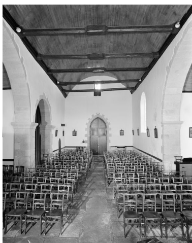
Vue générale vers la nef