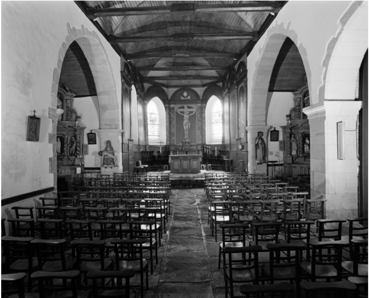
Vue générale vers le chœur