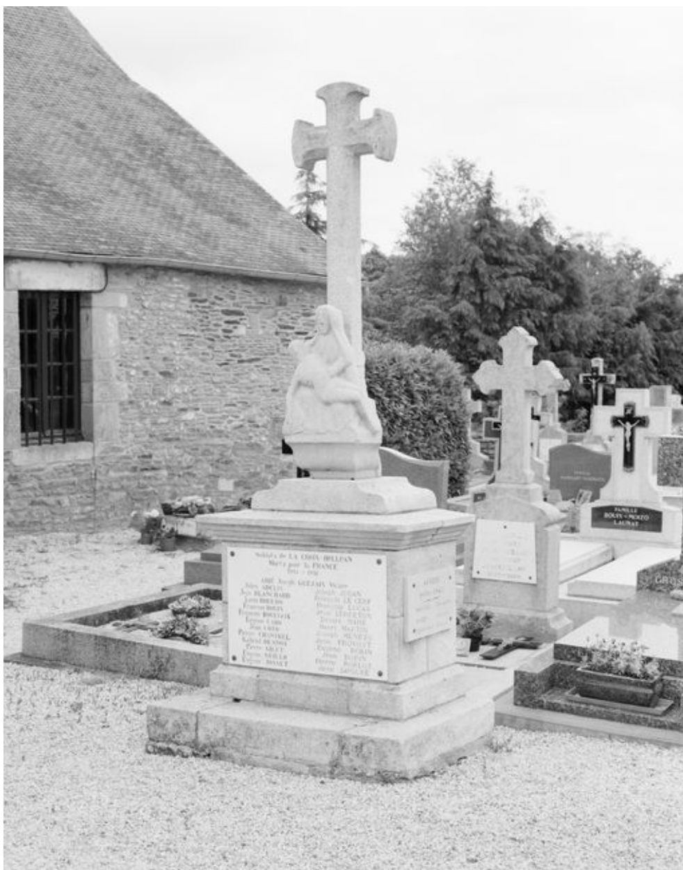
Croix 2 du cimetière