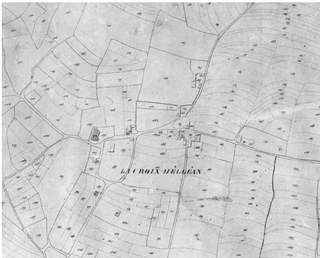
Cadastre de 1831