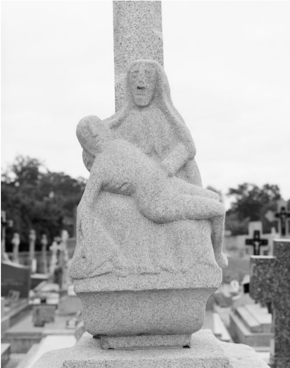
Croix 2 du cimetière, Vierge de pitié : détail