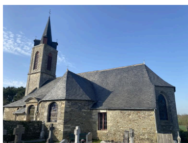
Vue sud-est, depuis le cimetière IVR53_20265610541NUCA