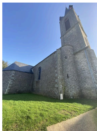
Vue nord-ouest IVR53_20265610538NUCA