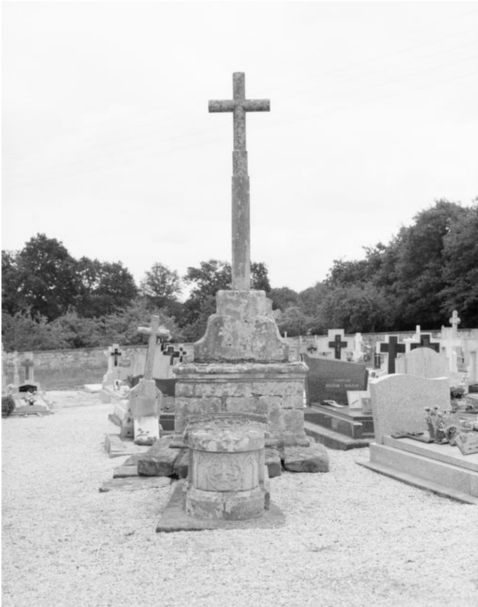
Croix 1 du cimetière