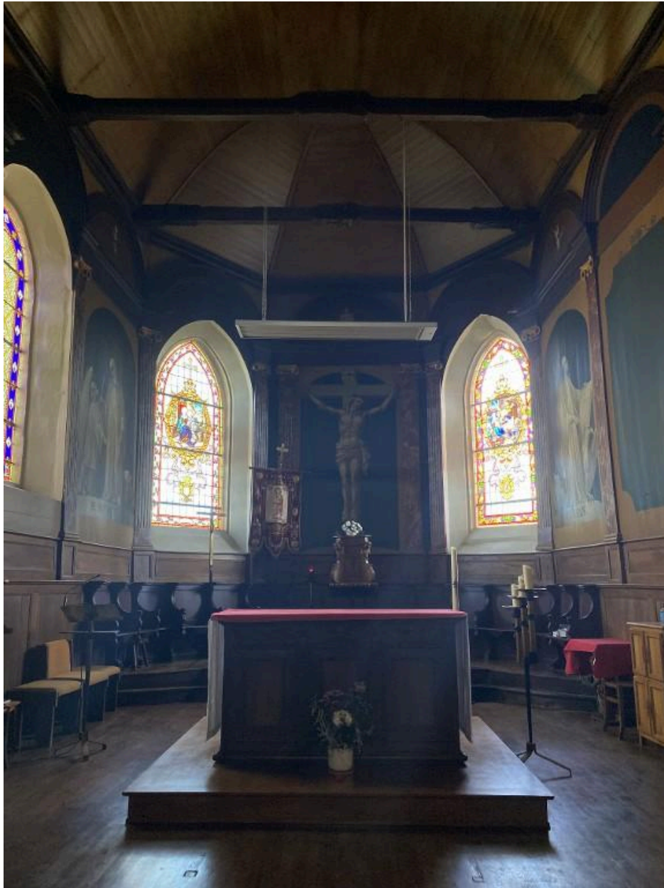
Vue de l'autel et du ch#ur