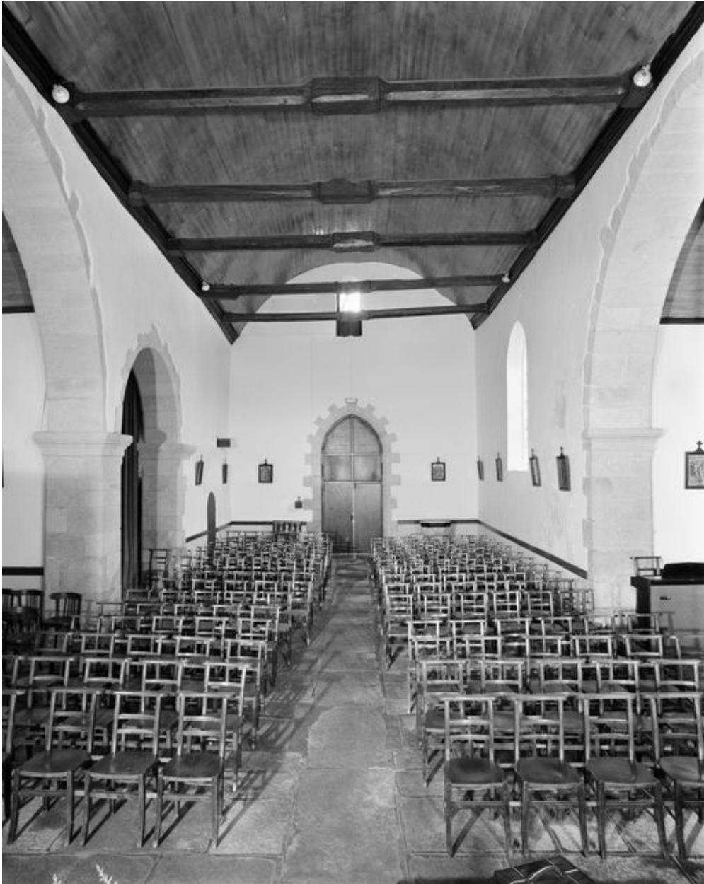
Vue générale vers la nef