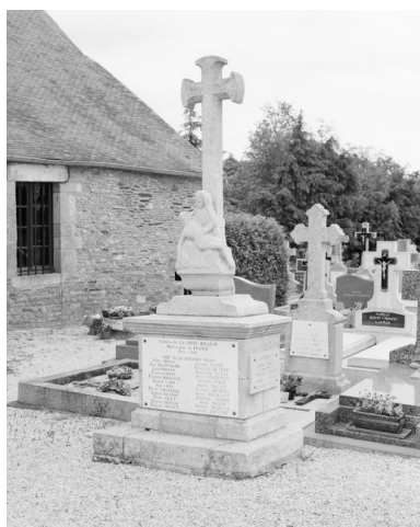
Croix 2 du cimetière IVR53_19915600544X