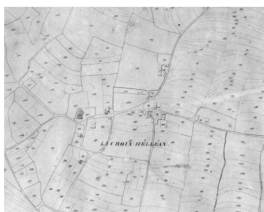
Cadastré de 1831