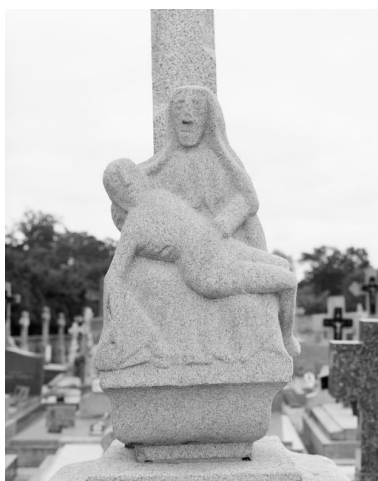
Croix 2 du cimetière, Vierge de pitié : détail