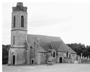
Vue sud-ouest IVR53_19915600547X