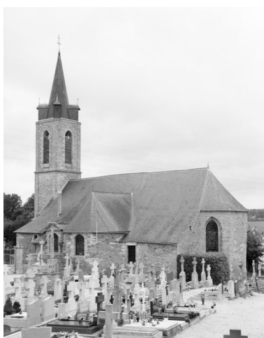
Vue sud-est IVR53_19915600542X