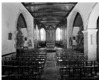
Vue générale vers le chœur, IVR53_19935601491X