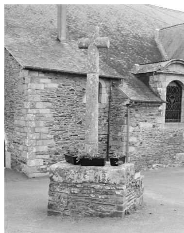
Croix 3 IVR53_19915600546X