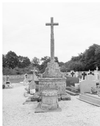
Croix 1 du cimetière