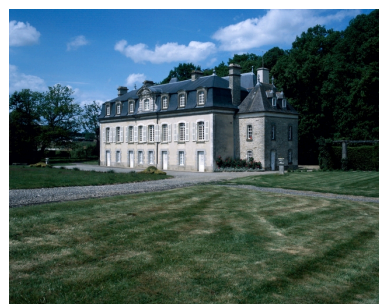
Vue de profil. IVR53_19973500759XA