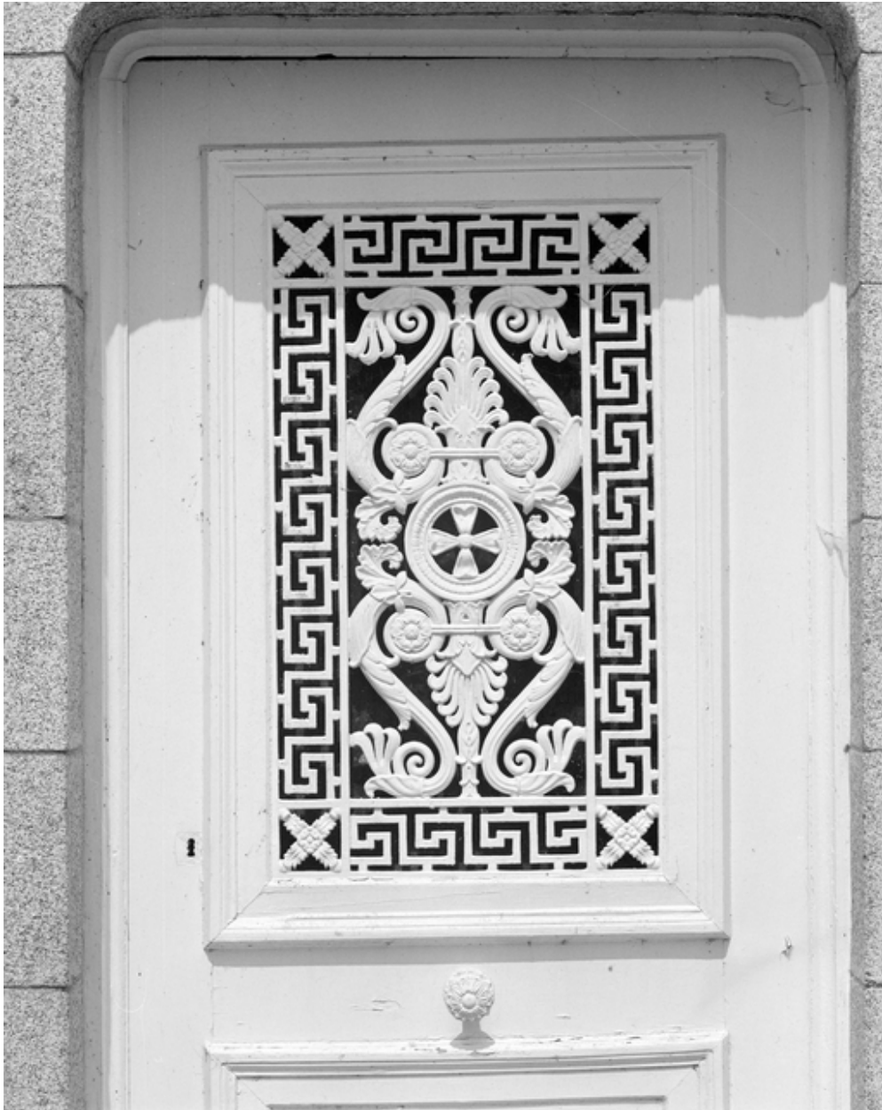
Panneau en fonte d'art : détail.