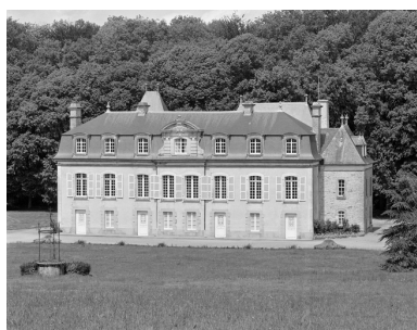
Élévation antérieure, vue générale. IVR53_19973502111X