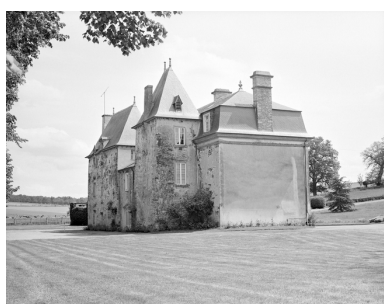
Vue générale sud-ouest de l'élévation postérieure. IVR53_19973502115X