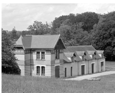
Vue générale des communs. IVR53_19973502112X