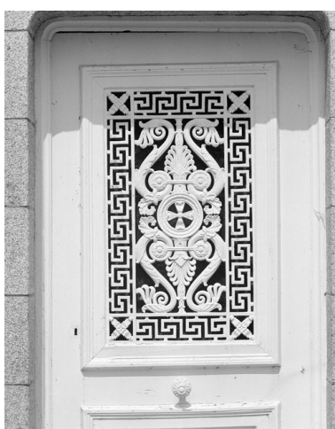
Panneau en fonte d'art : détail. IVR53_19973502116X