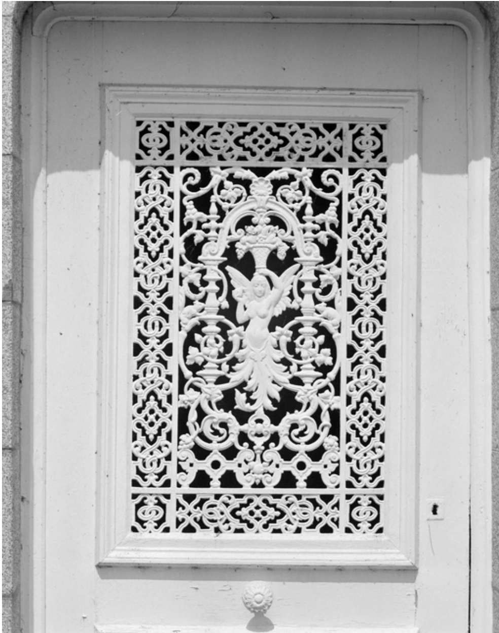
Panneau en fonte d'art : détail.