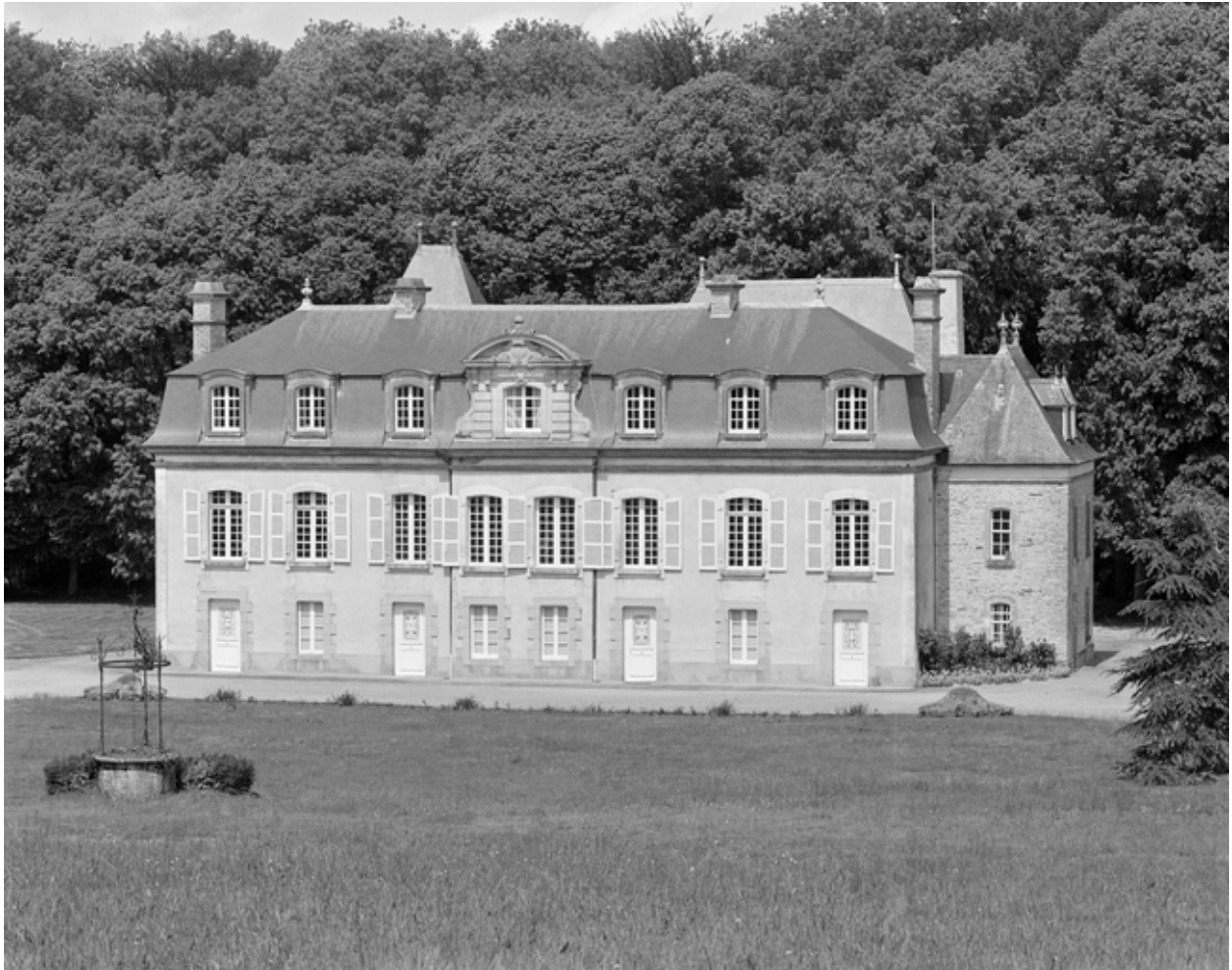
Elévation antérieure, vue générale.