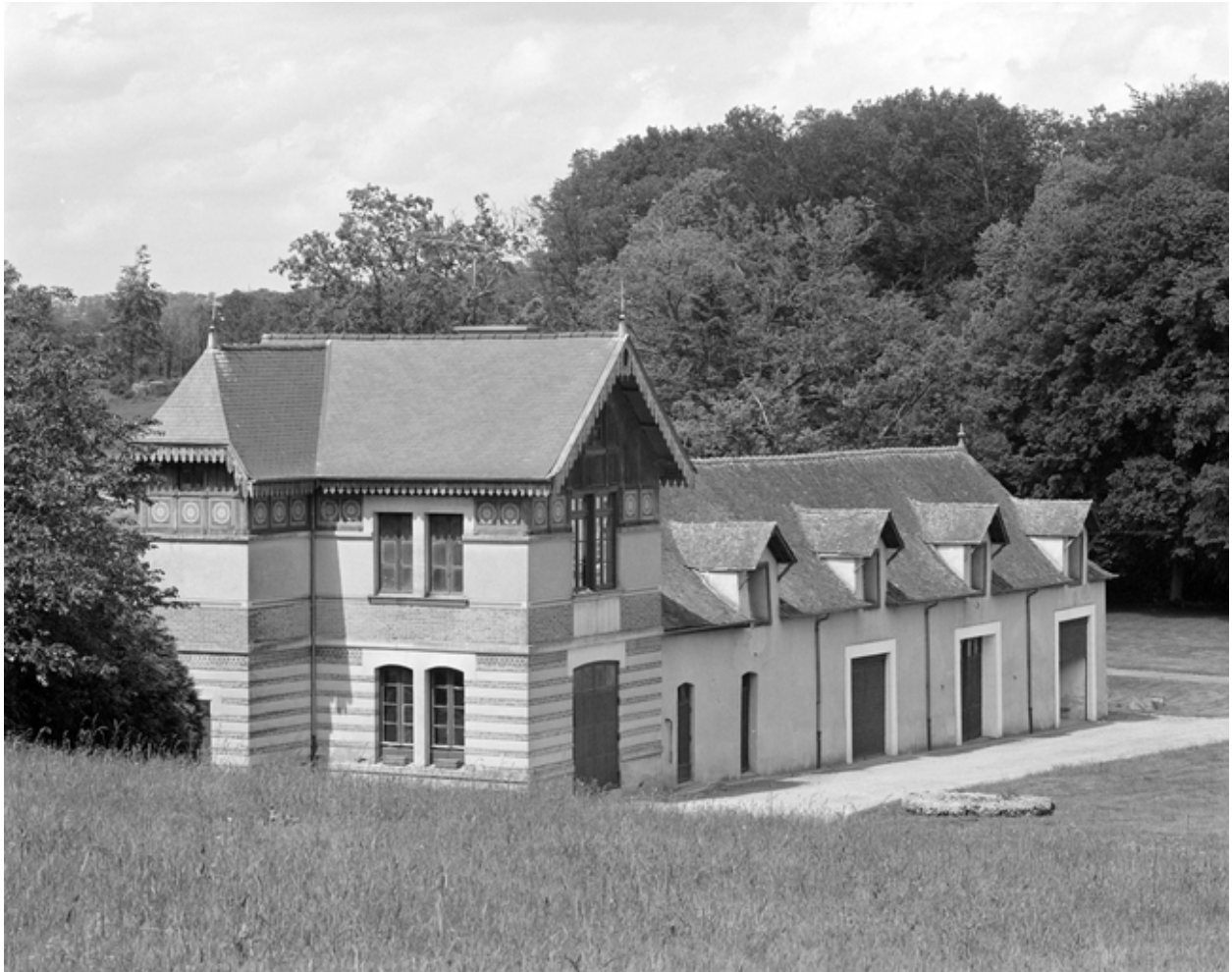
Vue générale des communs.