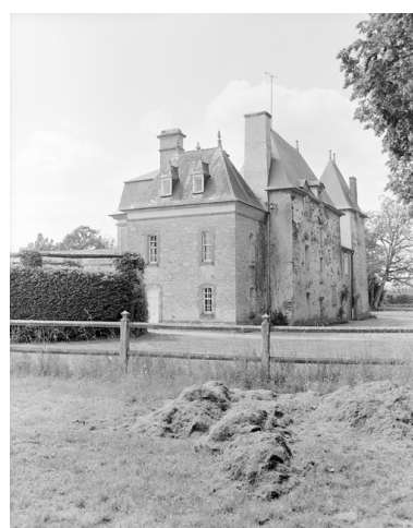
Vue générale sud-est de l'élévation postérieure.