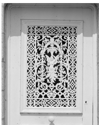
Panneau en fonte d'art : détail. IVR53_19973502117X