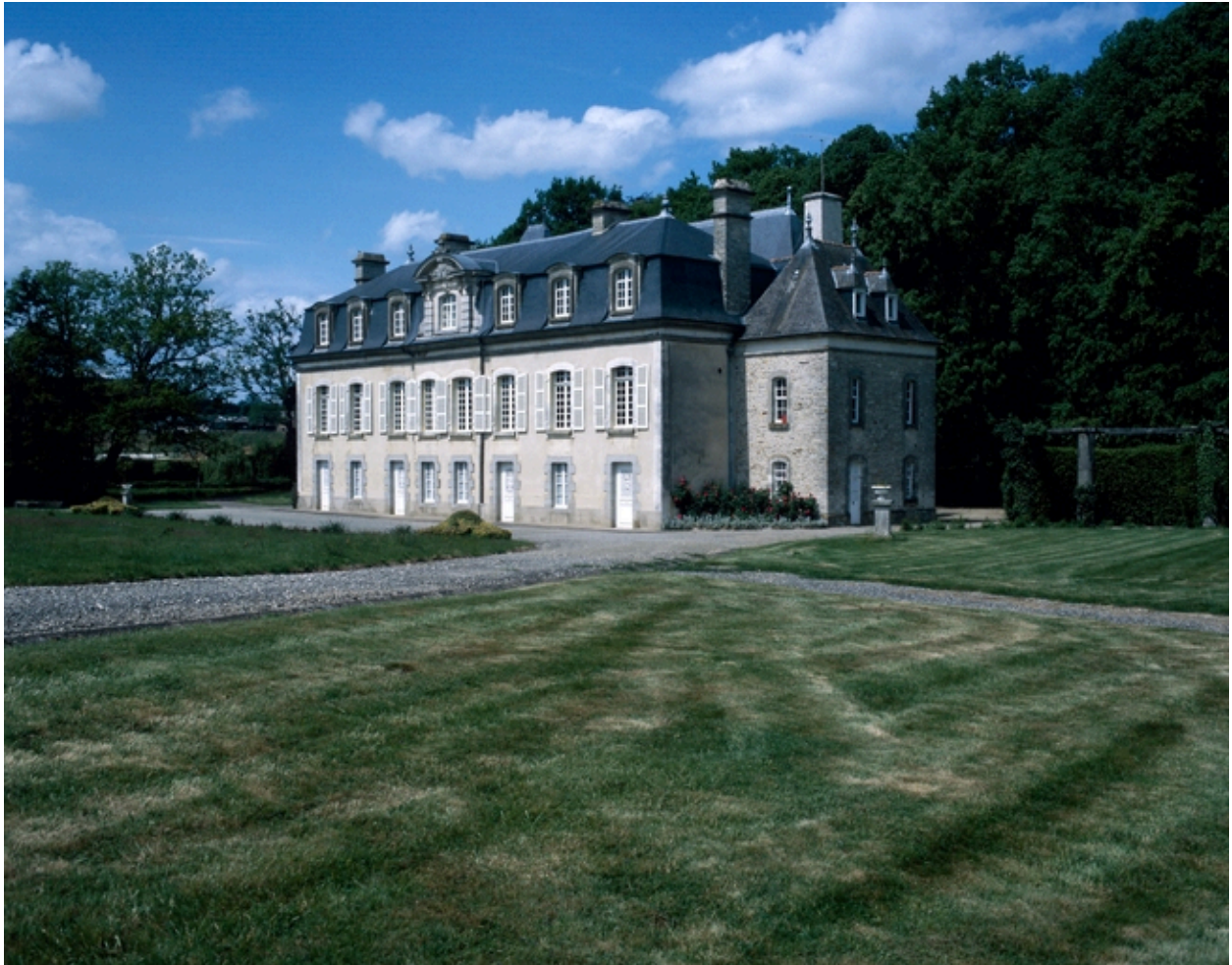
Vue de profil.