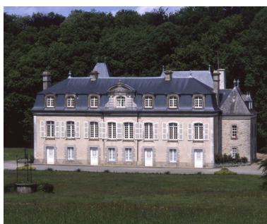
Vue de situation. IVR53_19973500758XA