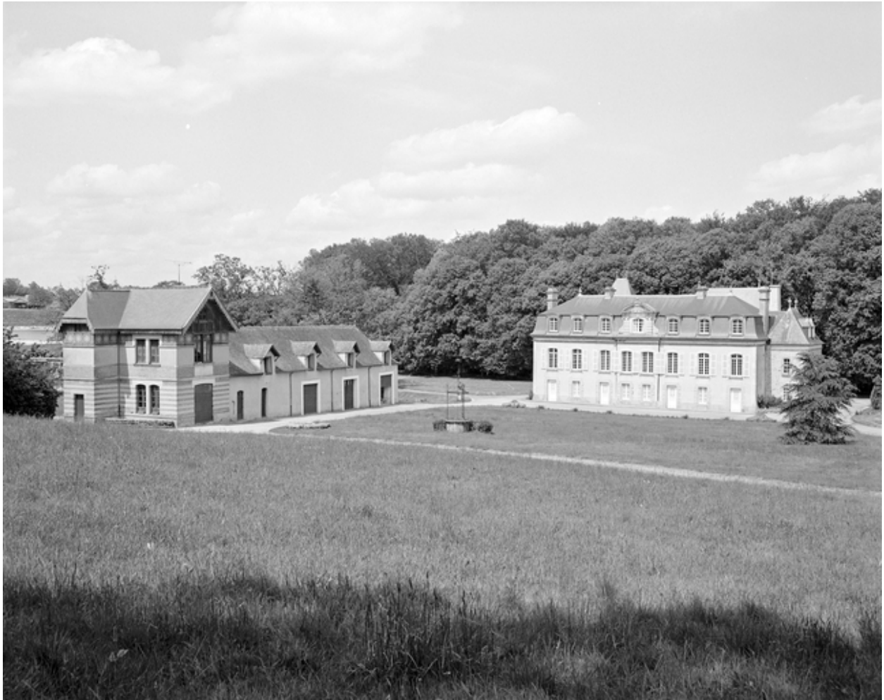
Château et communs : vue générale.