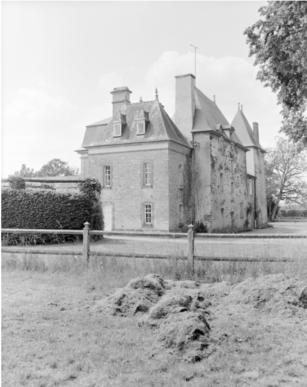
Vue générale sud-est de l'élévation postérieure.