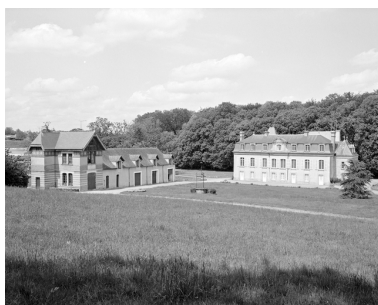
Château et communs : vue générale.