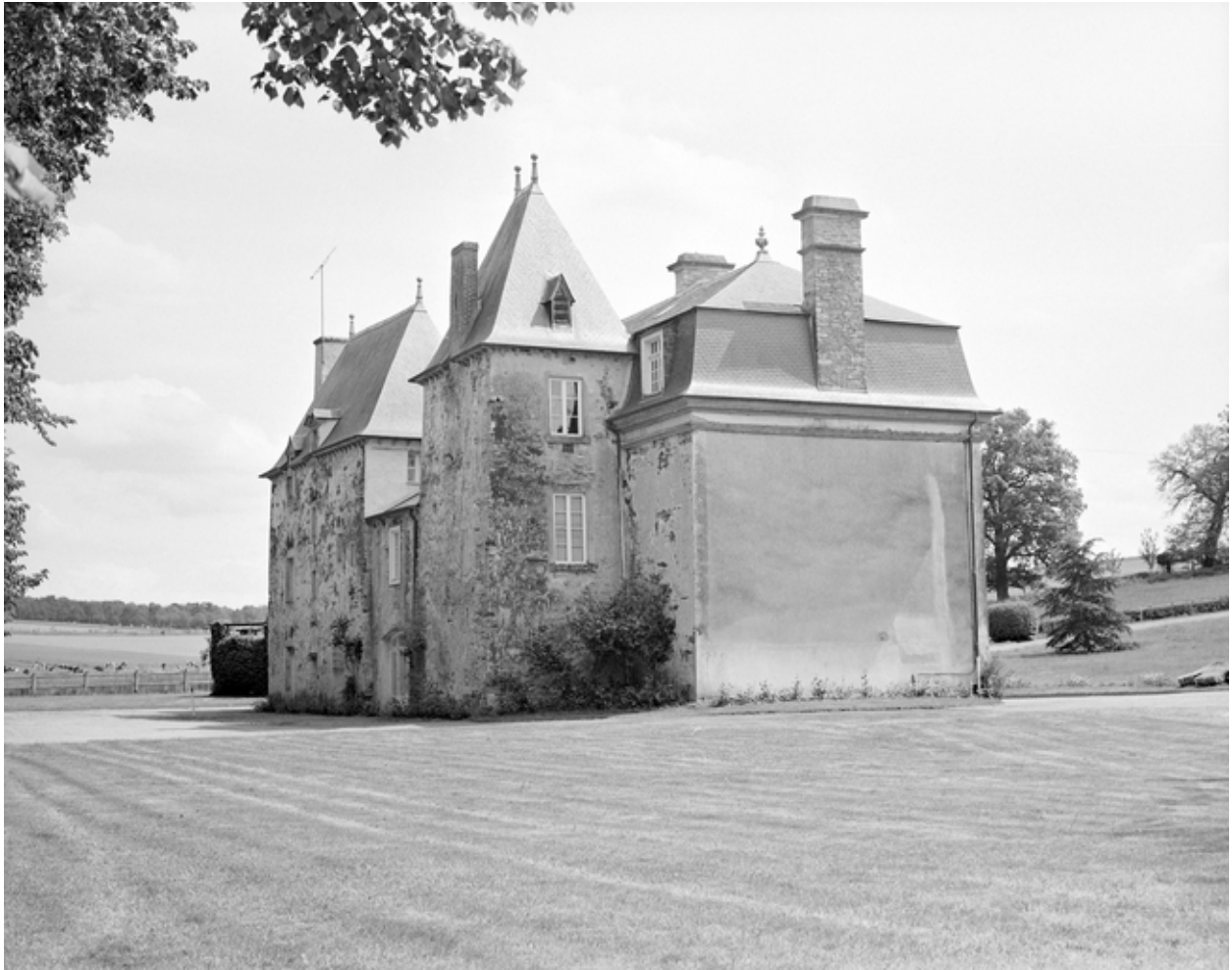
Vue générale sud-ouest de l'élévation postérieure.