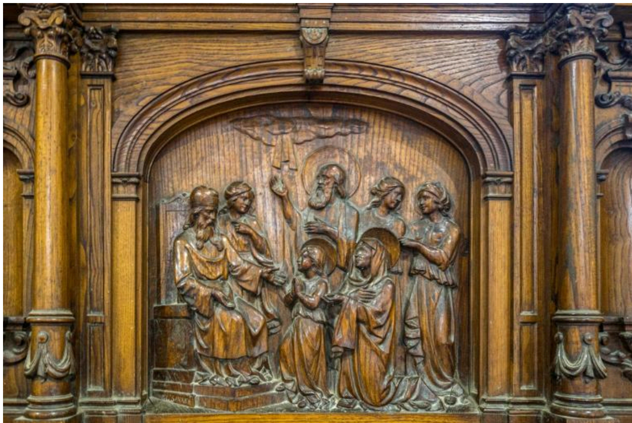
Présentation de la Vierge au temple