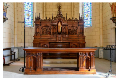
Vue générale IVR53_20265611039NUCA