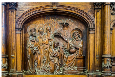
Couronnement de la Vierge IVR53_20265611038NUCA