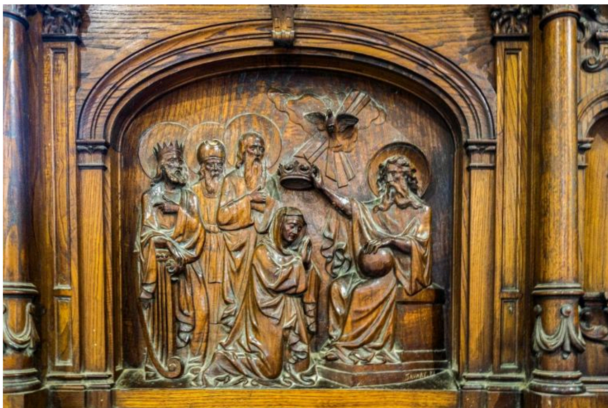
Couronnement de la Vierge