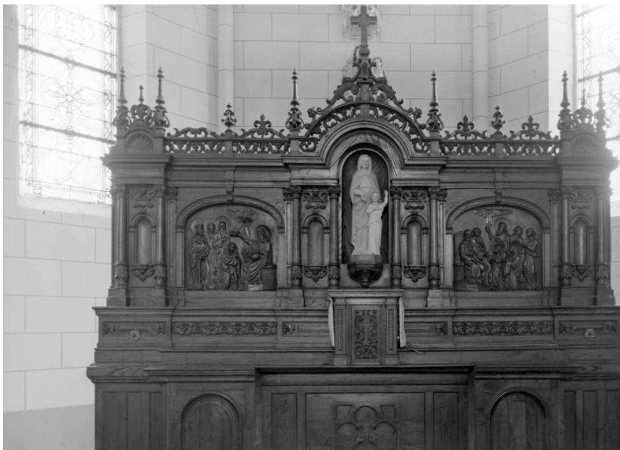
Ensemble du maître-autel (état en 1984)