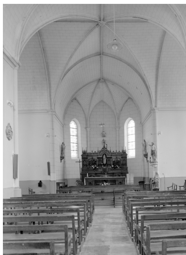
Maître-autel (état en 1984) IVR53_19845601665V