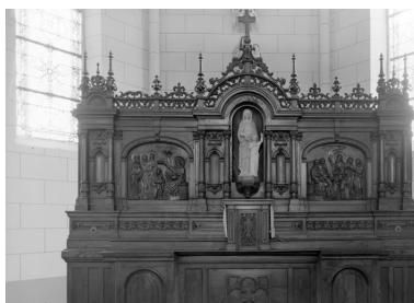
Ensemble du maître-autel (état en 1984)