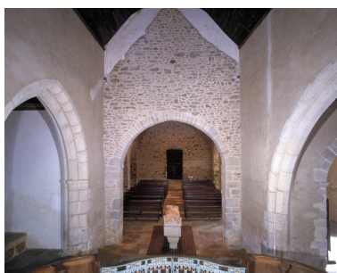
Vue intérieure prise du chœur vers la nef IVR53_20003501694XA