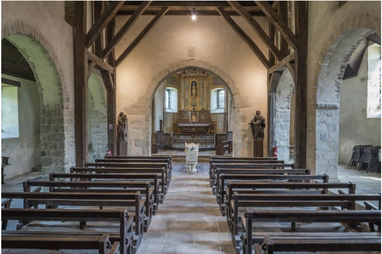
Vue intérieure du bas de la nef vers le chœur