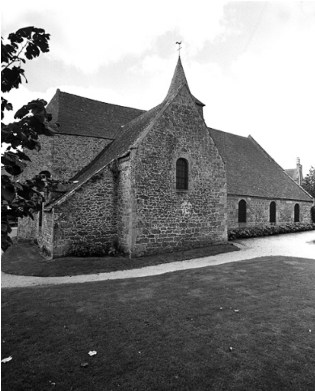
Vue depuis l'ouest