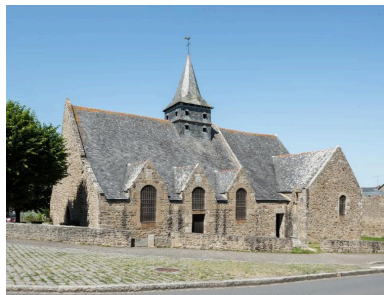
Vue générale IVR53_20203500496NUCA