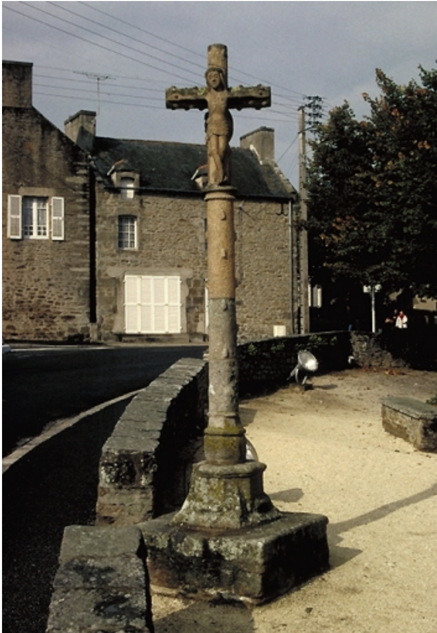
La croix de cimetière