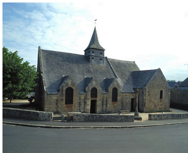
Vue générale IVR53_19953500321XA