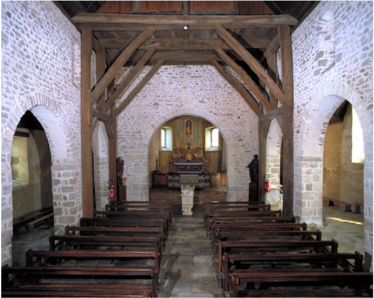
Vue intérieure prise de la nef vers le chœur