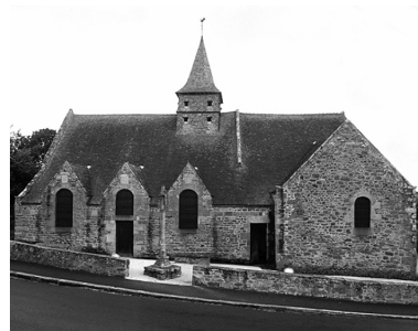
Vue depuis le sud IVR53_19943501849X