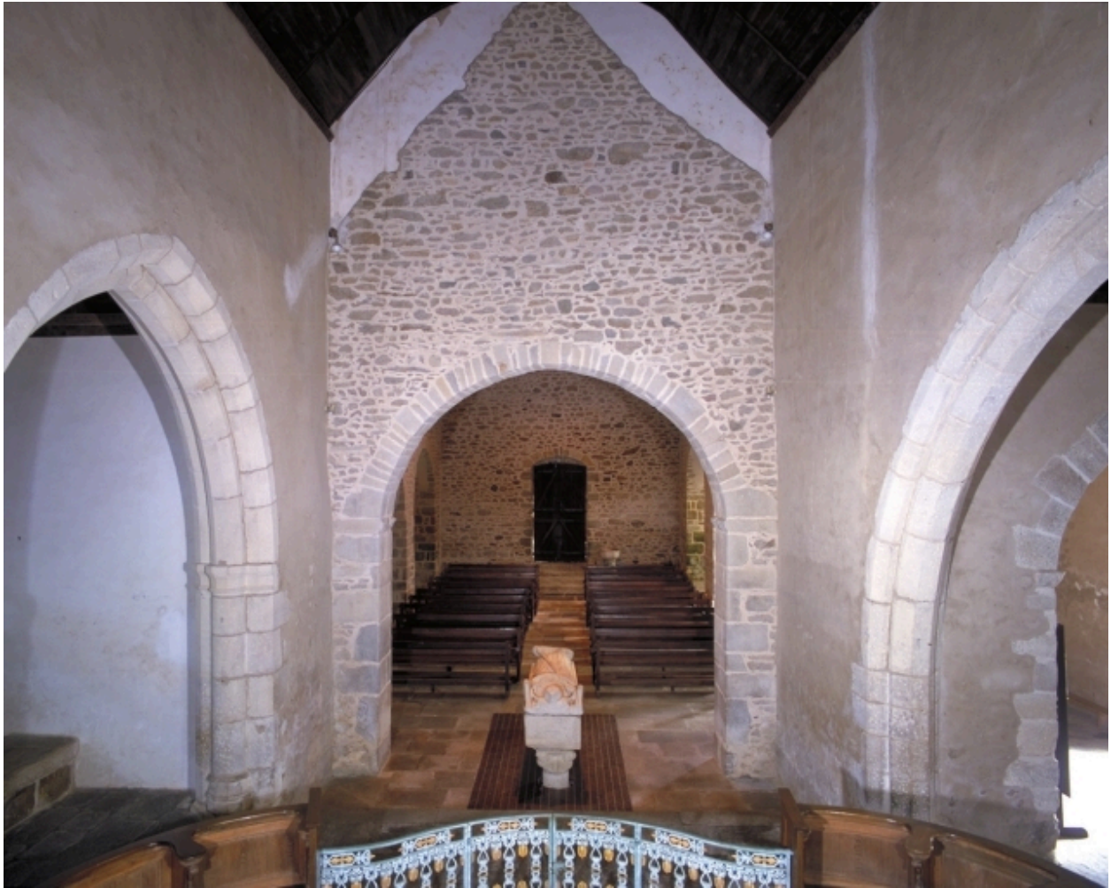
Vue intérieure prise du chœur vers la nef