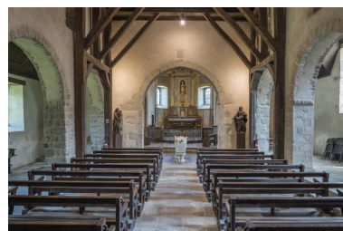
Vue intérieure du bas de la nef vers le chœur IVR53_20203500497NUCA