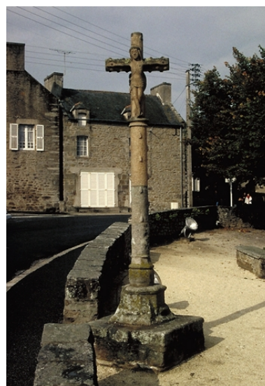
La croix de cimetière