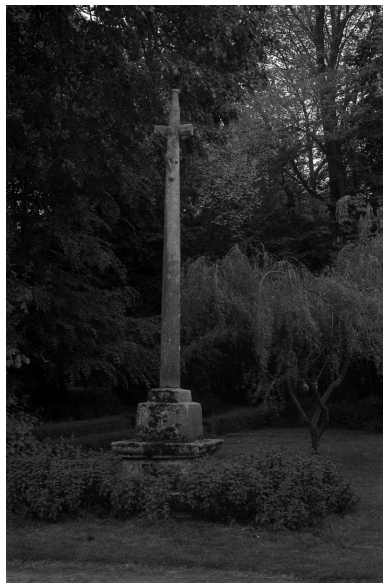
Vue d'ensemble IVR53_19742205330Z