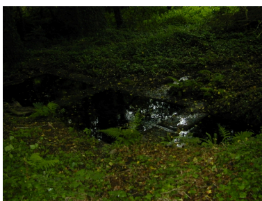
Lavoirs IVR53_20042904591NUCA