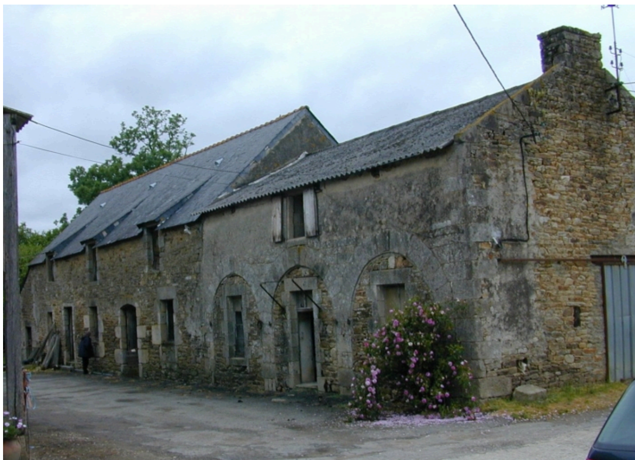
Anciennes écuries et remise, vue générale