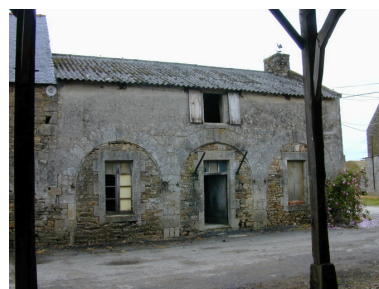
Ancienne remise IVR53_20042904589NUCA