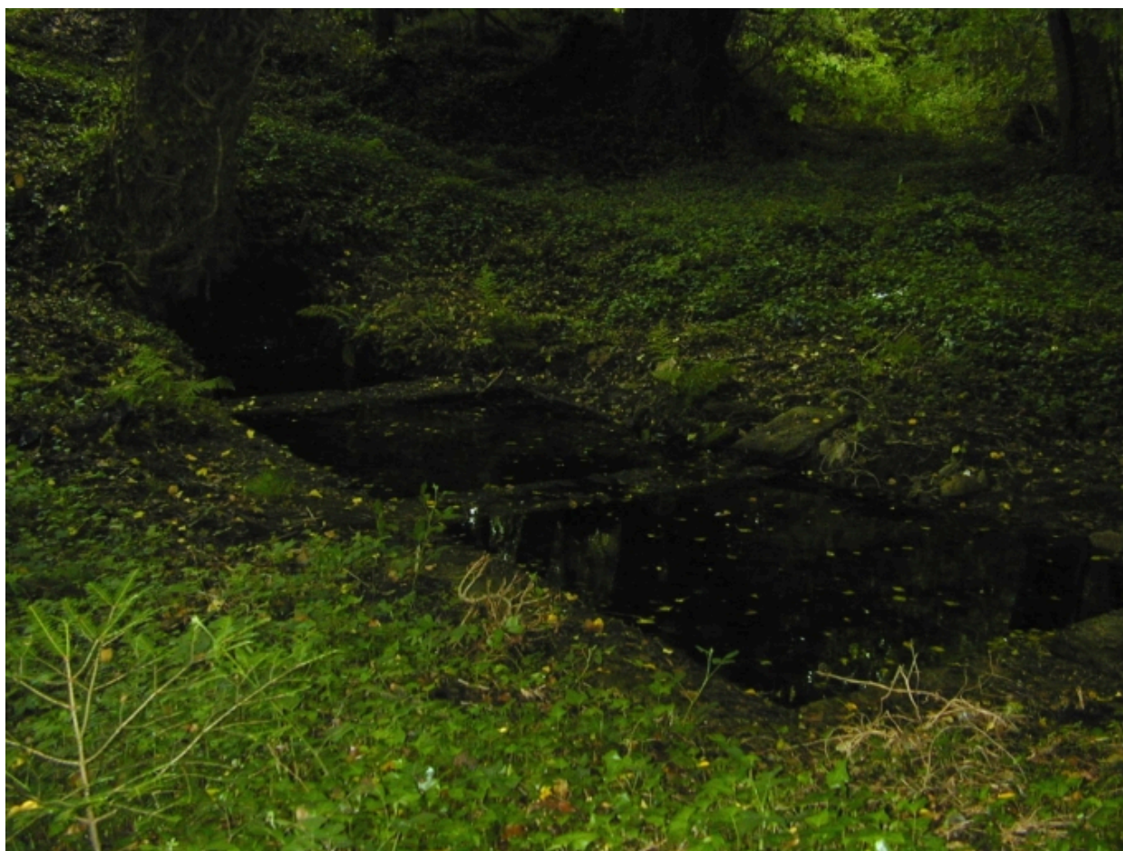
Fontaine et lavoirs