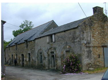
Anciennes écuries et remise, vue générale IVR53_20042904590NUCA

IVR53_20042904588NUCA