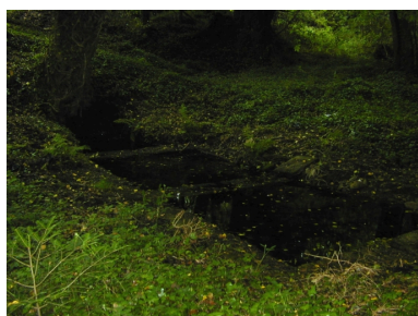
Fontaine et lavoirs IVR53_20042904592NUCA