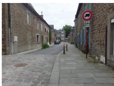
Vue générale est de la rue IVR53_20253510311NUC