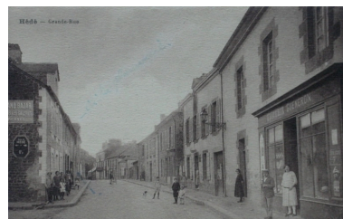
La Grande Rue