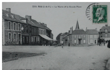
La place de la Mairie IVR53_20053519244NUCA