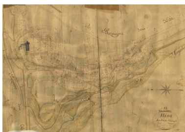
La ville sur le cadastre de 1835