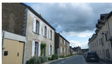
partie est de la rue