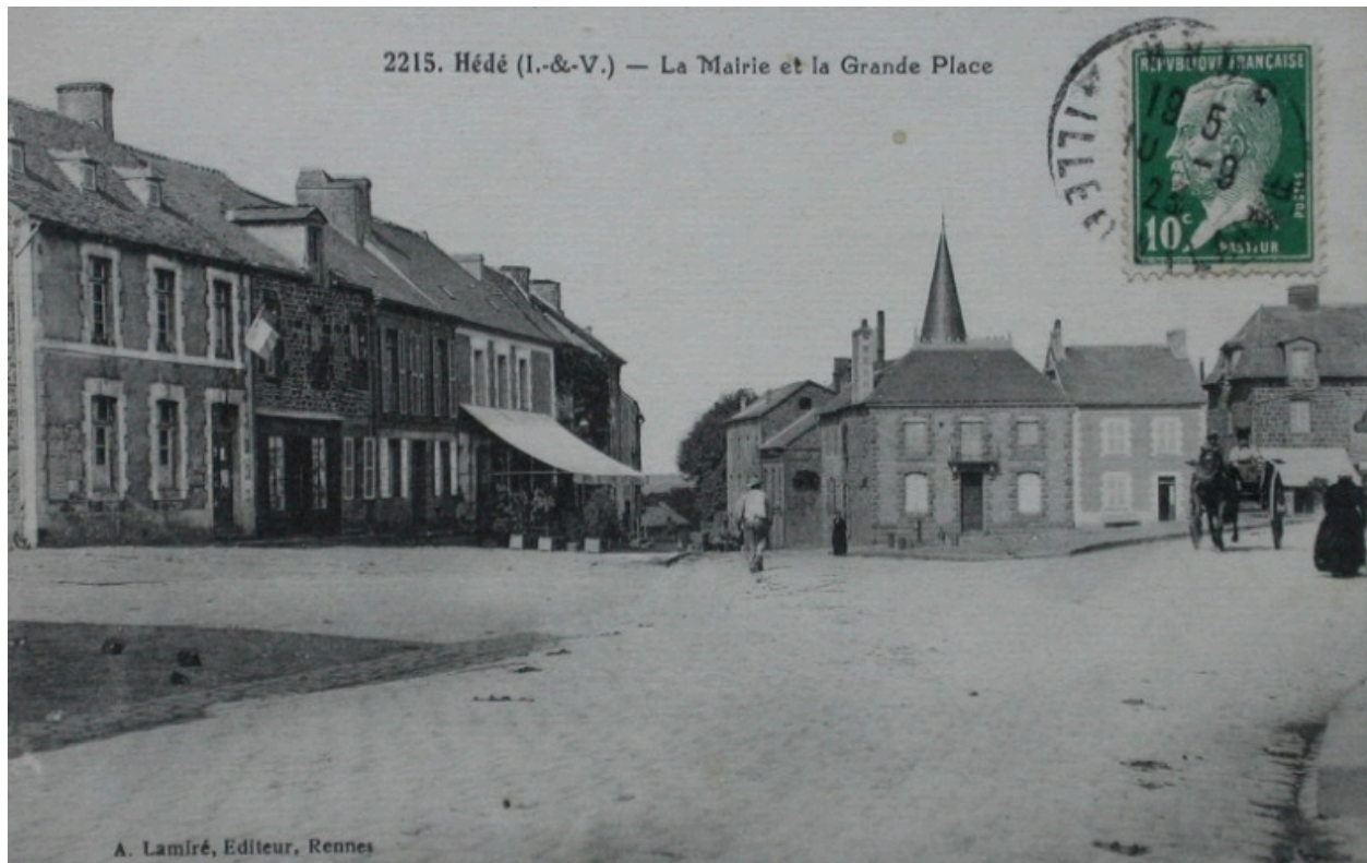
La place de la Mairie