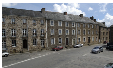
Place de la Mairie IVR53_20053501700NUCA