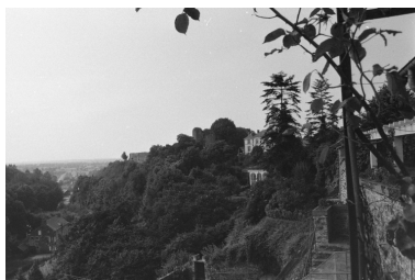
Vue sud-ouest en 1975