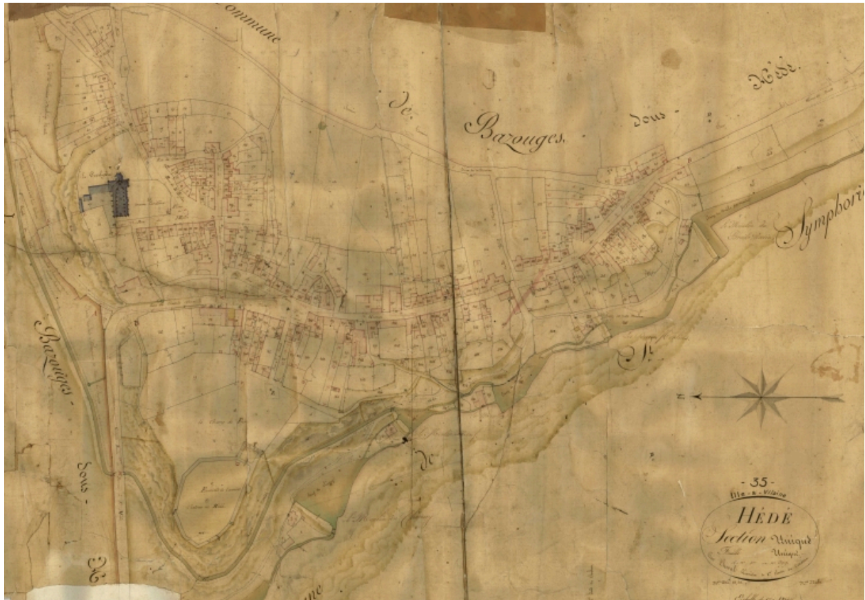
La ville sur le cadastre de 1835