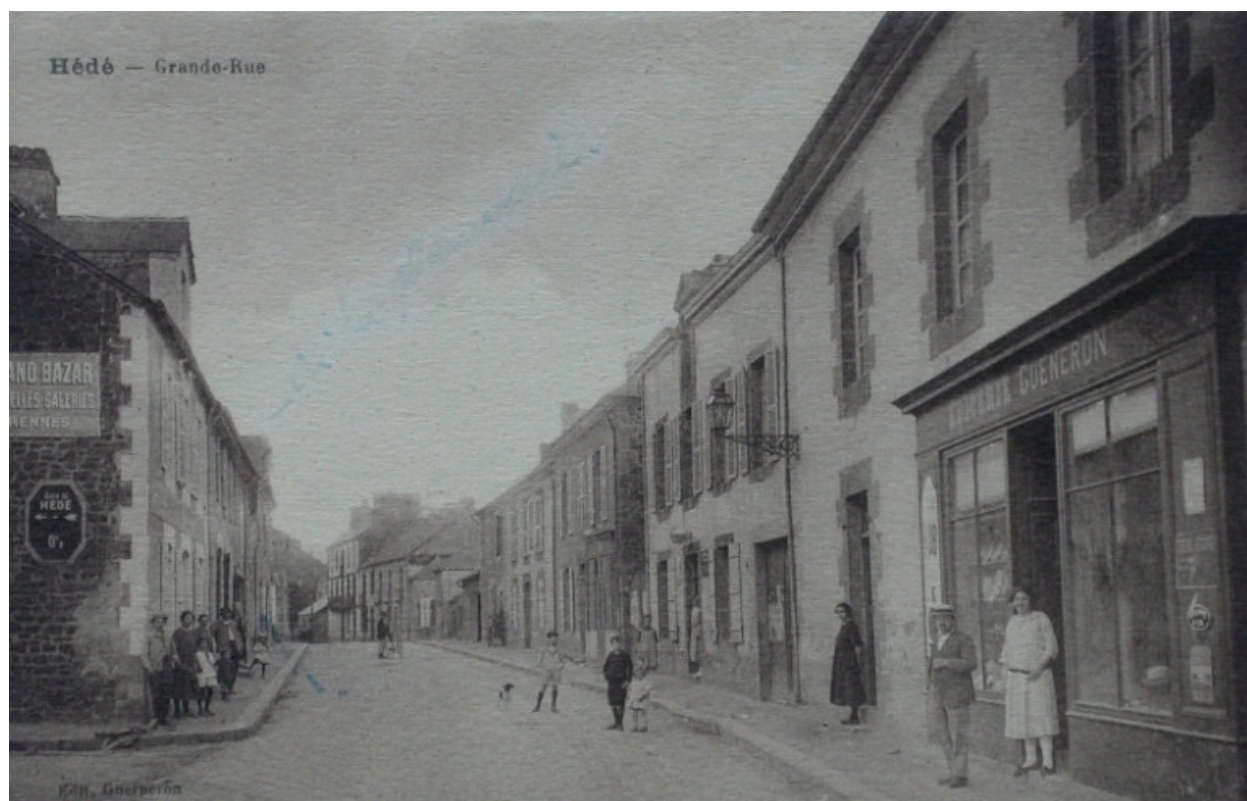
La Grande Rue