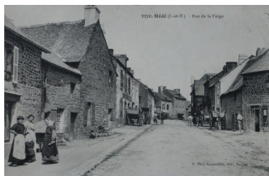
La rue des Forges IVR53_20053519248NUCA