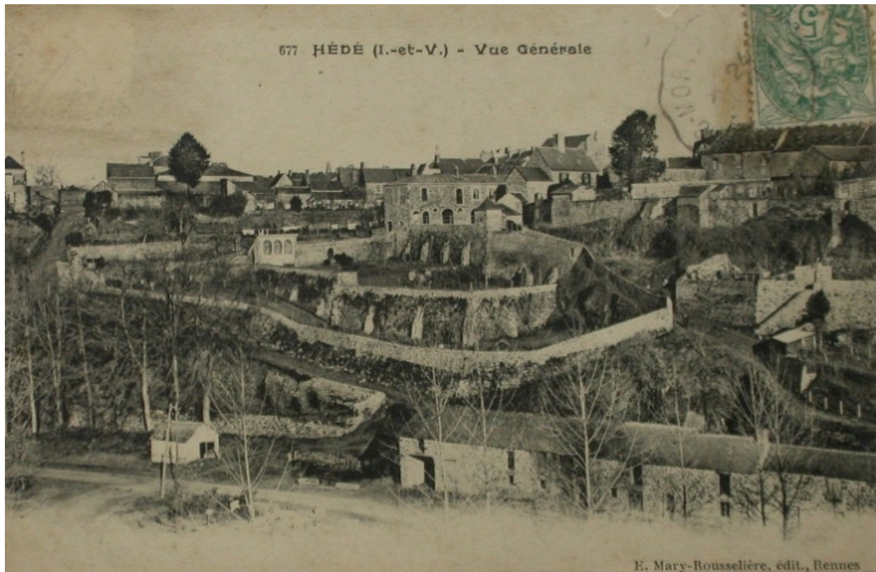
Vue générale de Hédé au début du 20e siècle