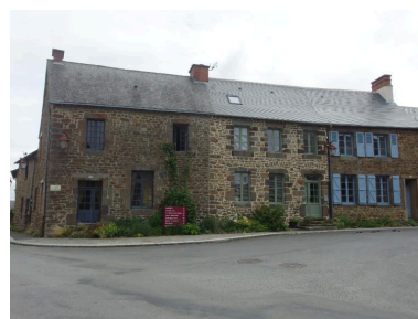
Vue ouest