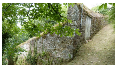
Chemin des Roquets