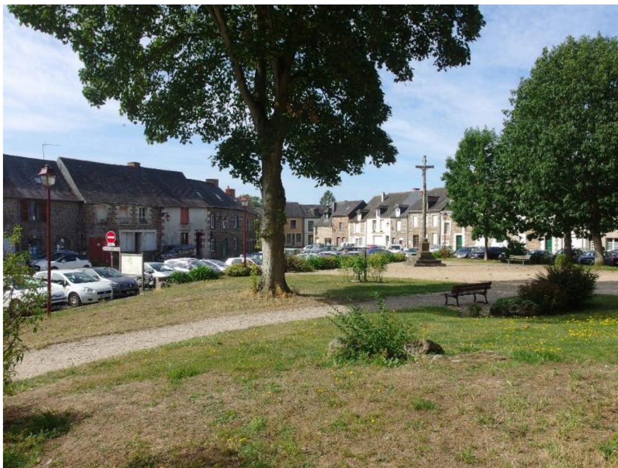
Vue de l'église vers le sud de la place