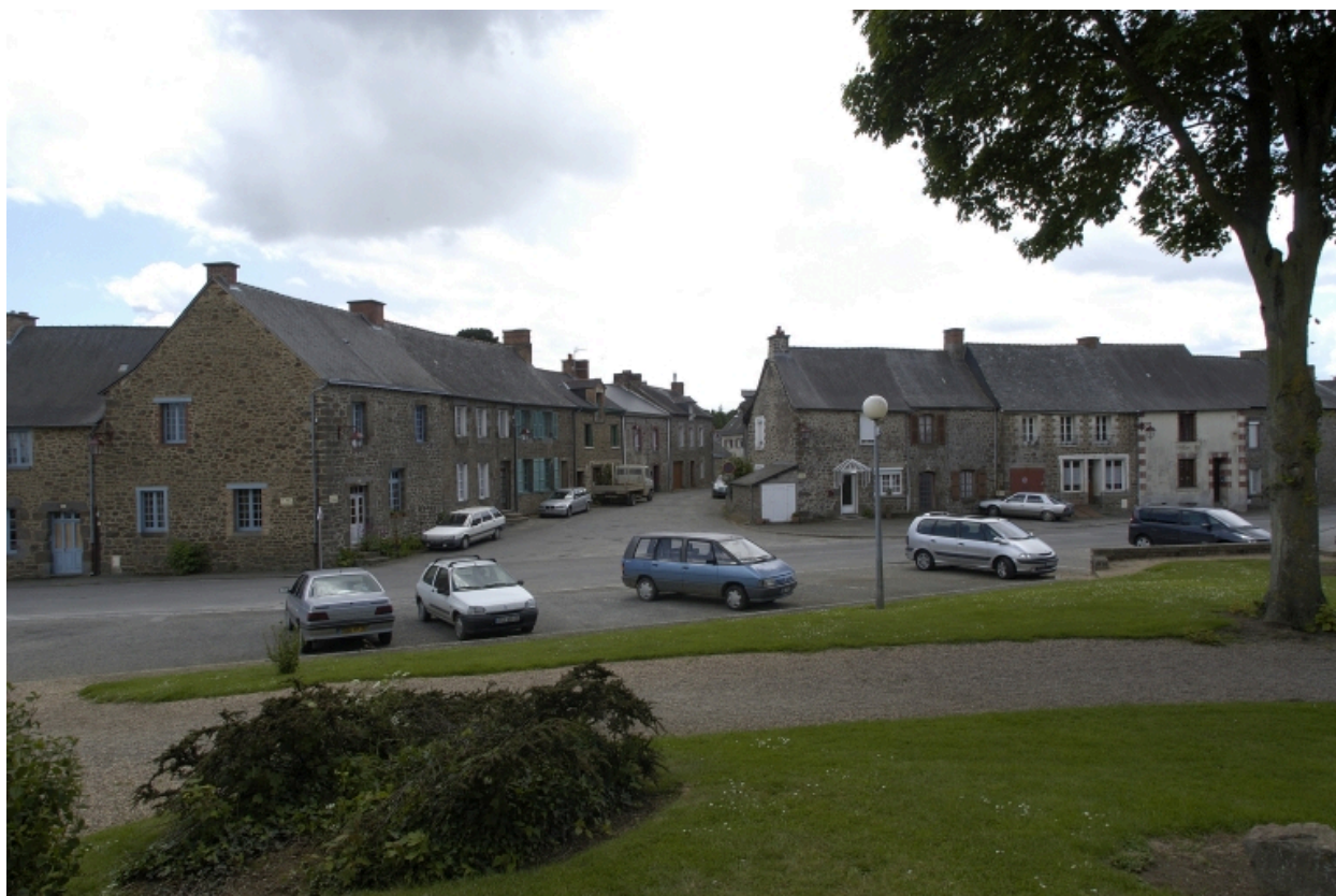
Place de l'église