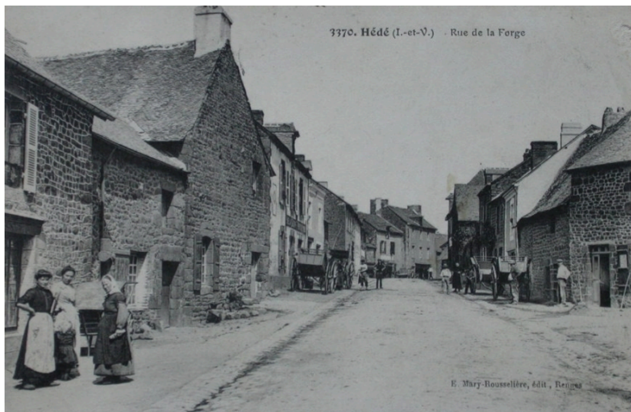
La rue des Forges