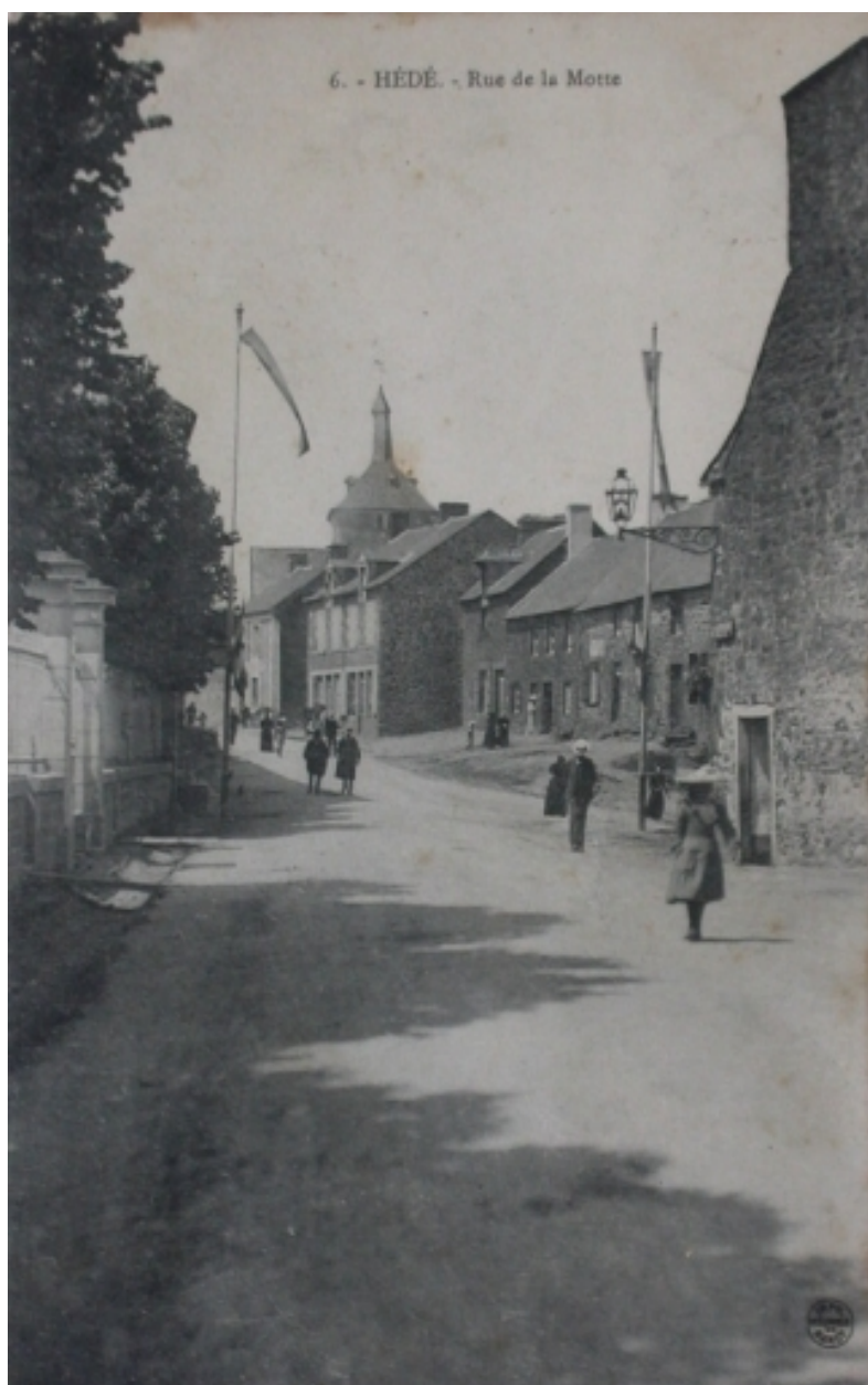
La rue de la Motte