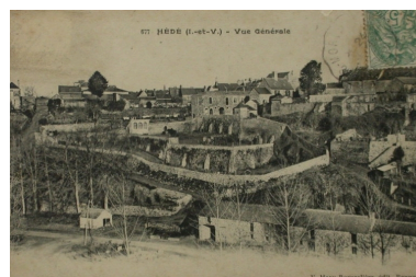
Vue générale de Hédé au début du 20e siècle