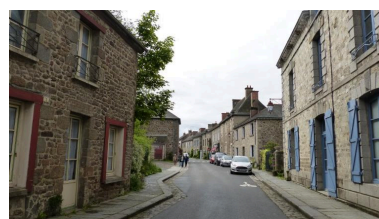
Vue générale de la rue IVR53_20253510307NUCA