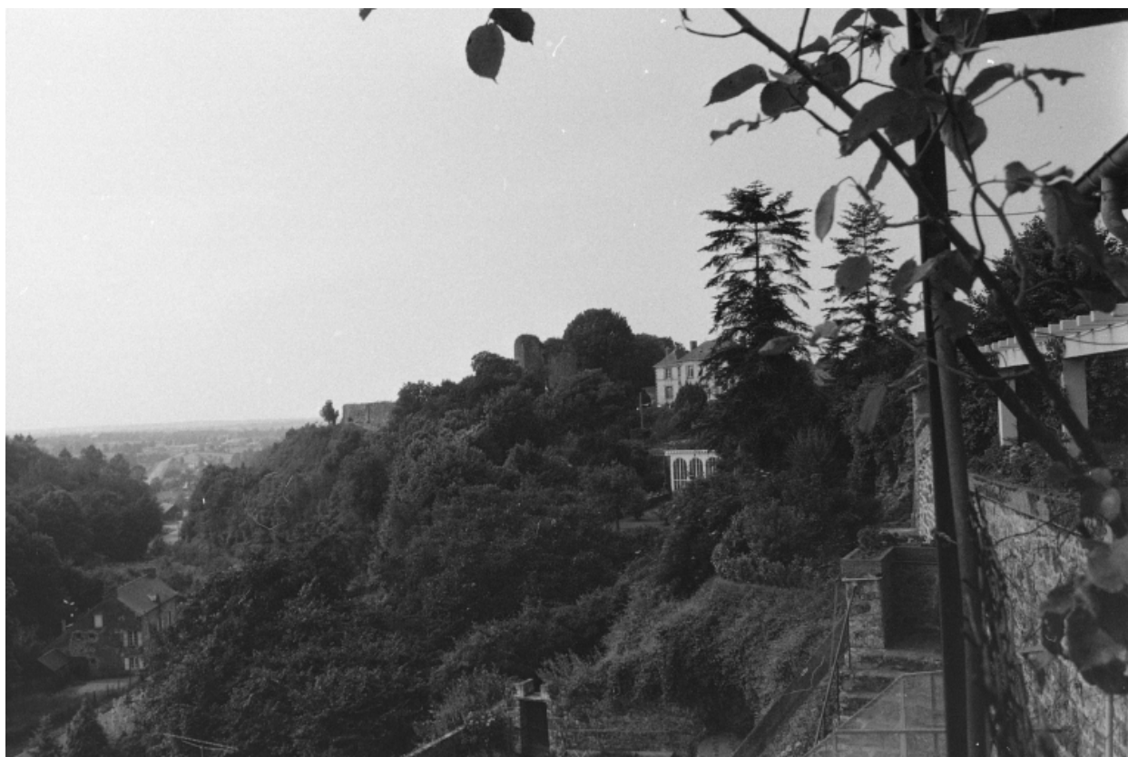
Vue sud-ouest en 1975