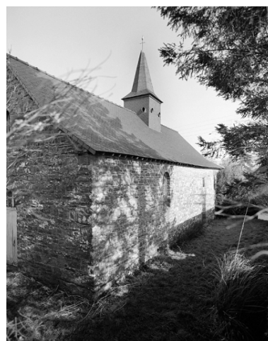
Vue partielle sud-ouest