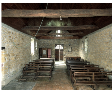
Vue intérieure prise du chœur vers la nef