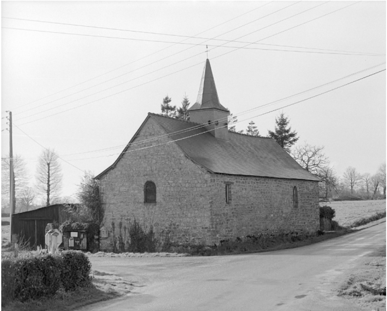
Vue générale nord-est en 1982