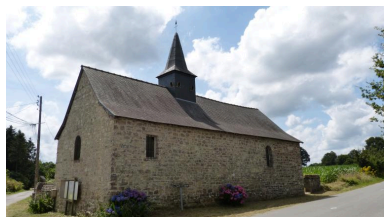
Vue générale nord-est en 2018 IVR53_20183506994NUCA