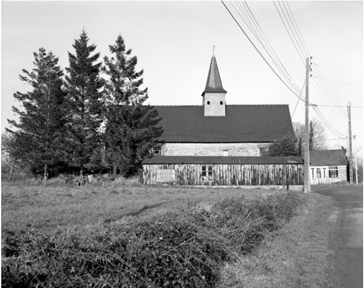
Vue générale sud en 2002