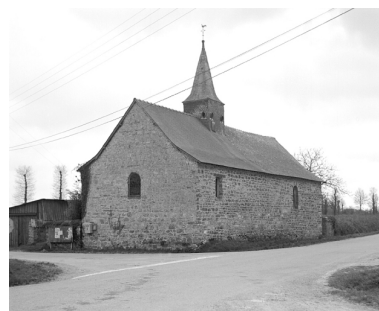
Vue générale nord-est en 1982