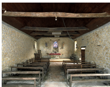
Vue intérieure prise de la nef vers le chœur IVR53_20023501708XA