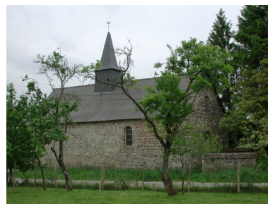
Vue générale nord-ouest IVR53_20023512762NUCA