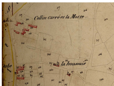
La chapelle -en haut à gauche- sur le cadastre de 1823 IVR53_20003517195NUCA