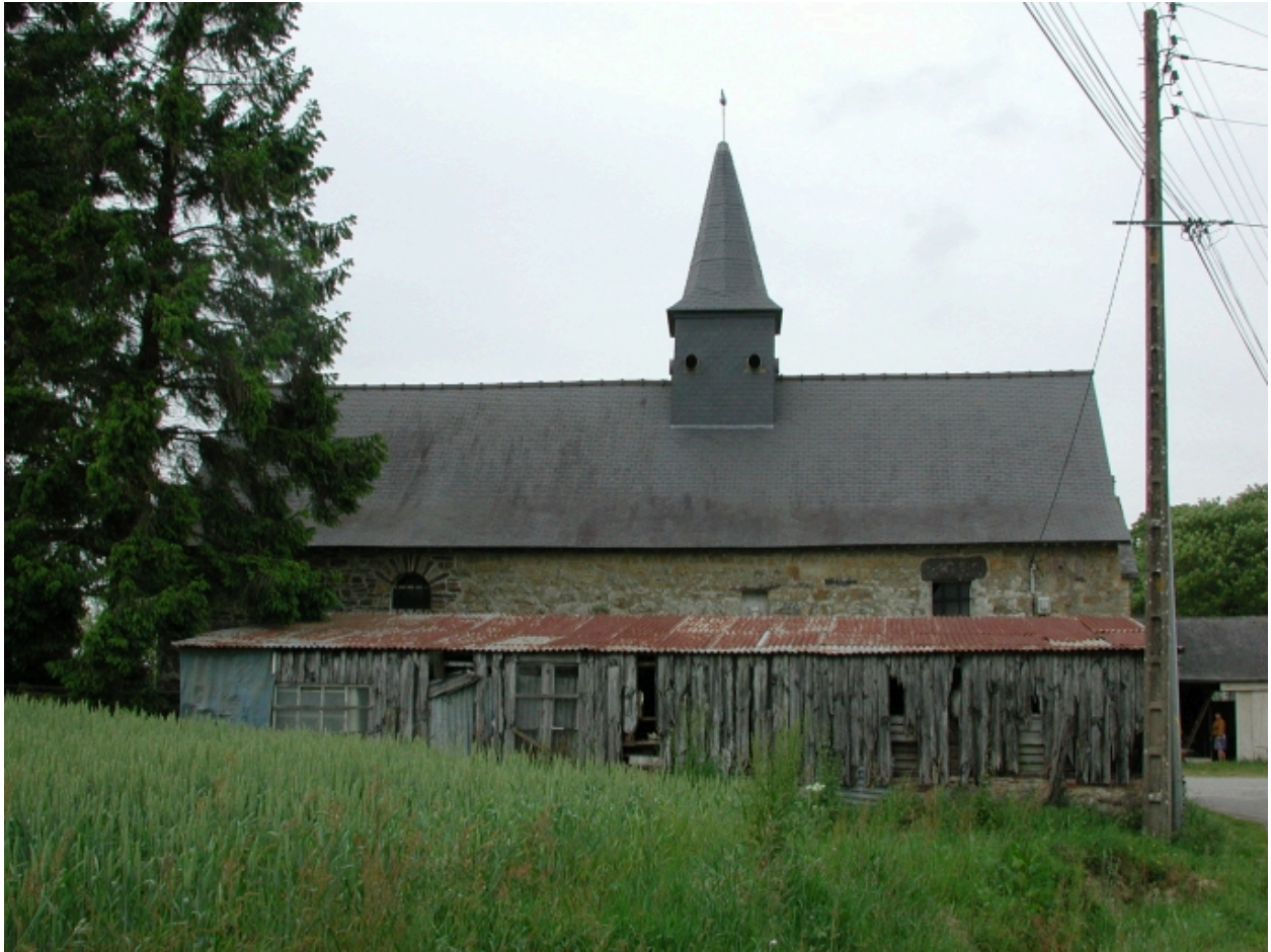
Vue générale sud en 2002