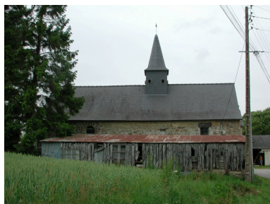
Vue générale sud en 2002 IVR53_20023512763NUCA