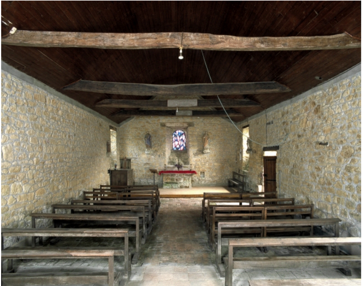
Vue intérieure prise de la nef vers le chœur