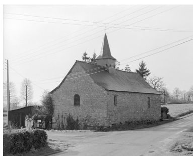
Vue générale nord-est en 1982 IVR53_19933500047X