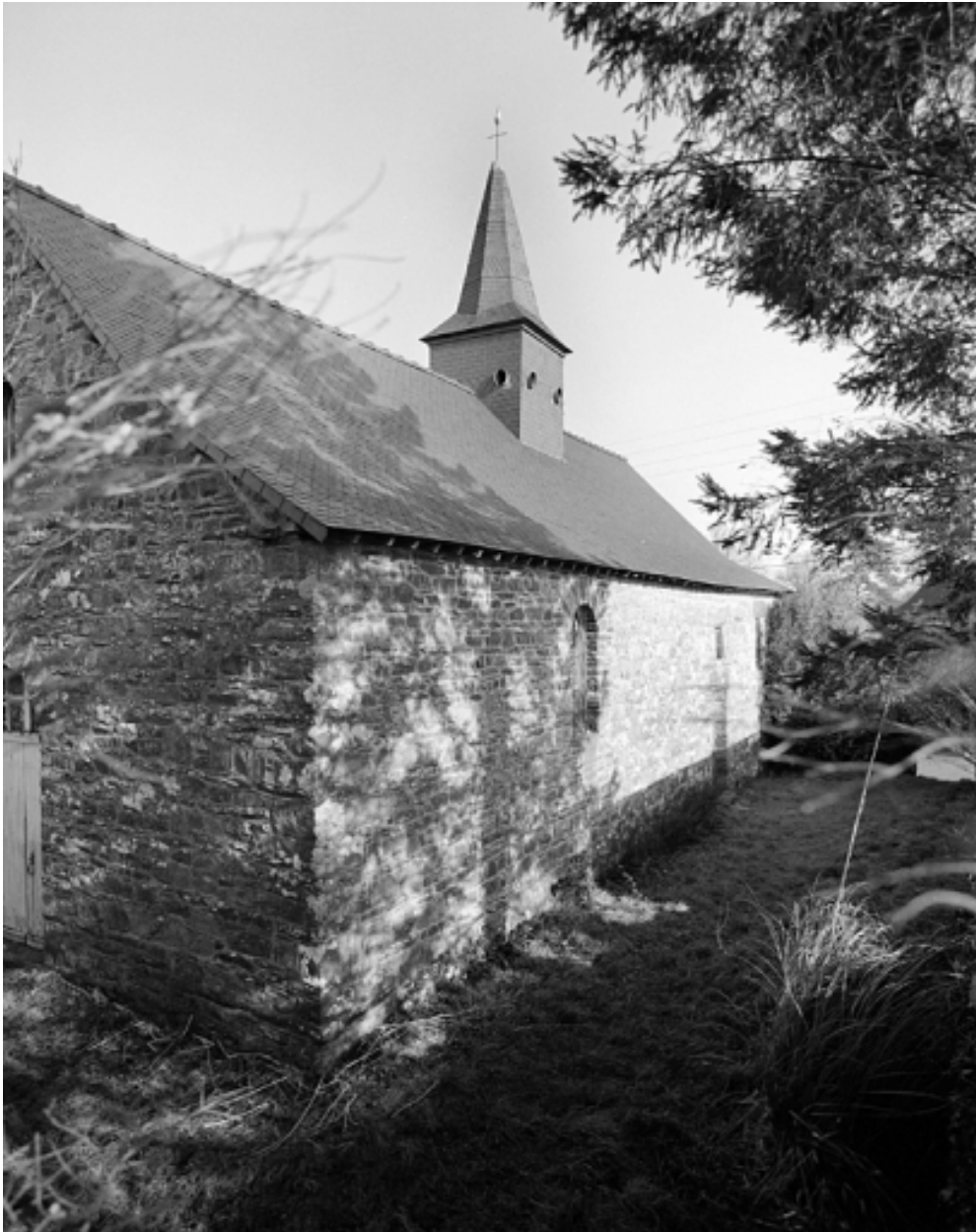
Vue partielle sud-ouest