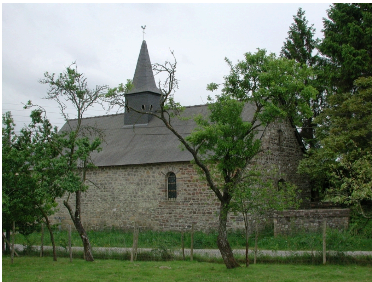
Vue générale nord-ouest