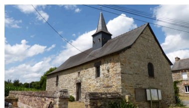
Vue générale sud-est en 2018 IVR53_20183506993NUCA