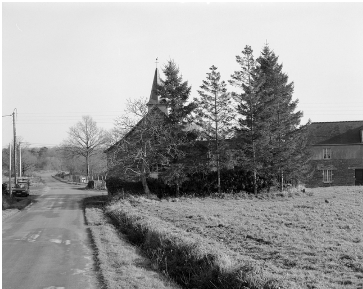
Vue de situation ouest