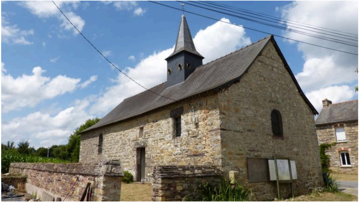
Vue générale sud-est en 2018