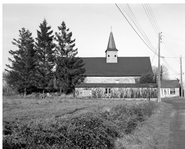
Vue générale sud en 2002 IVR53_19933500049X