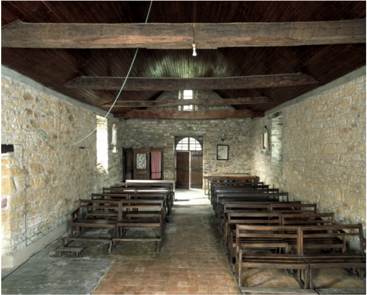
Vue intérieure prise du chœur vers la nef