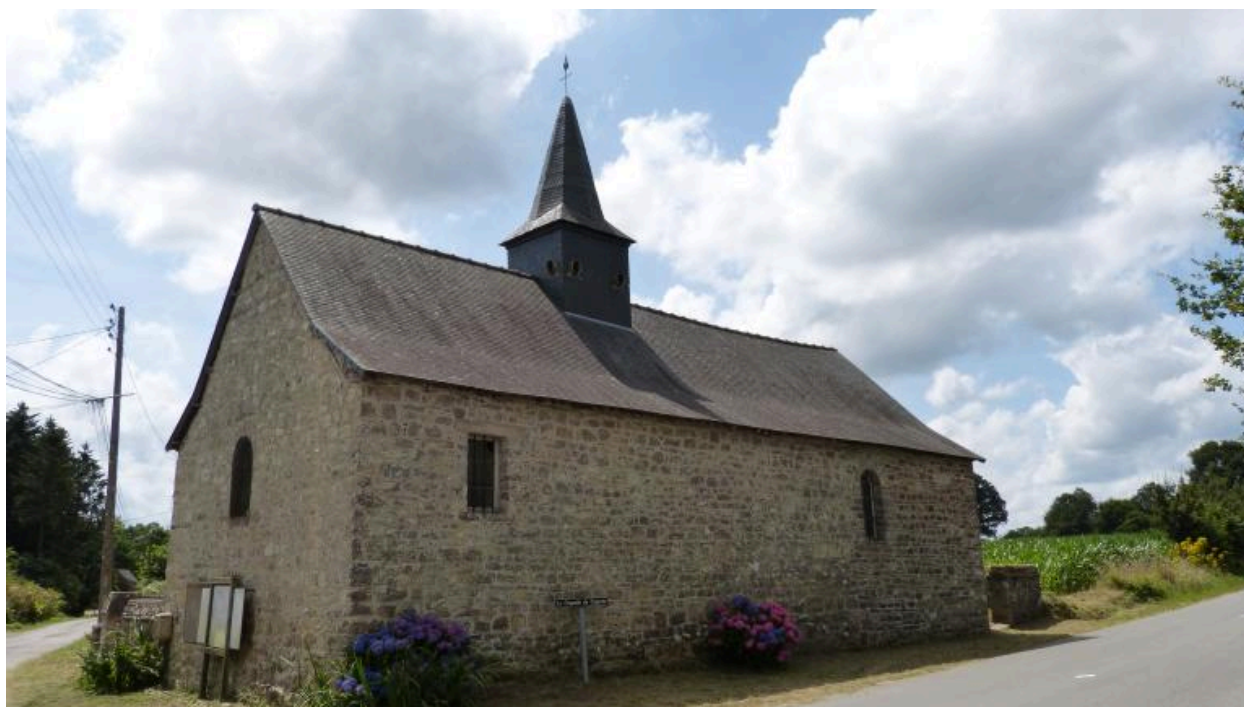
Vue générale nord-est en 2018