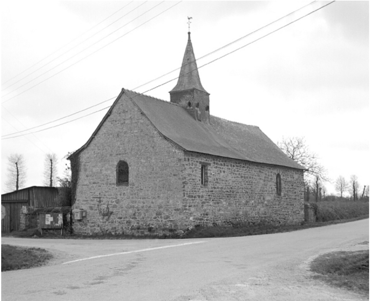
Vue générale nord-est en 1982