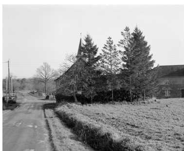
Vue de situation ouest IVR53_19933500048X