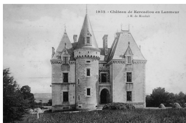
Vue générale IVR53_20042905469NUCB