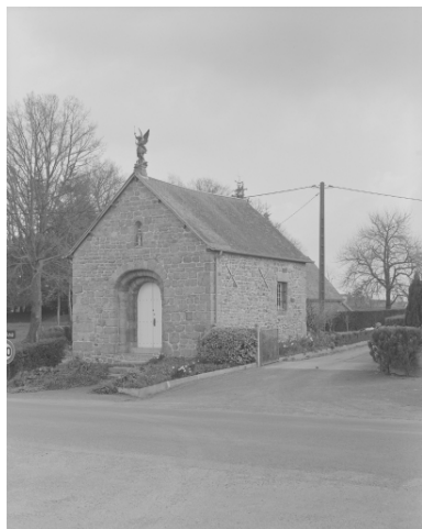
Elévation Sud-Ouest : vue générale IVR53_19933500320X