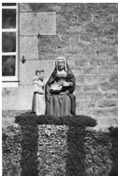
Statue Sainte-Anne, vue générale. IVR53_19913500131V