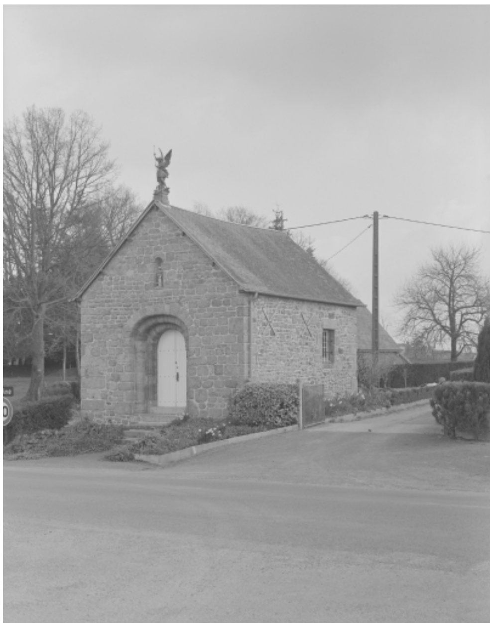
Elévation Sud-Ouest : vue générale