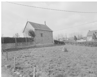
Elévation Nord-Est : vue générale IVR53_19933500321X