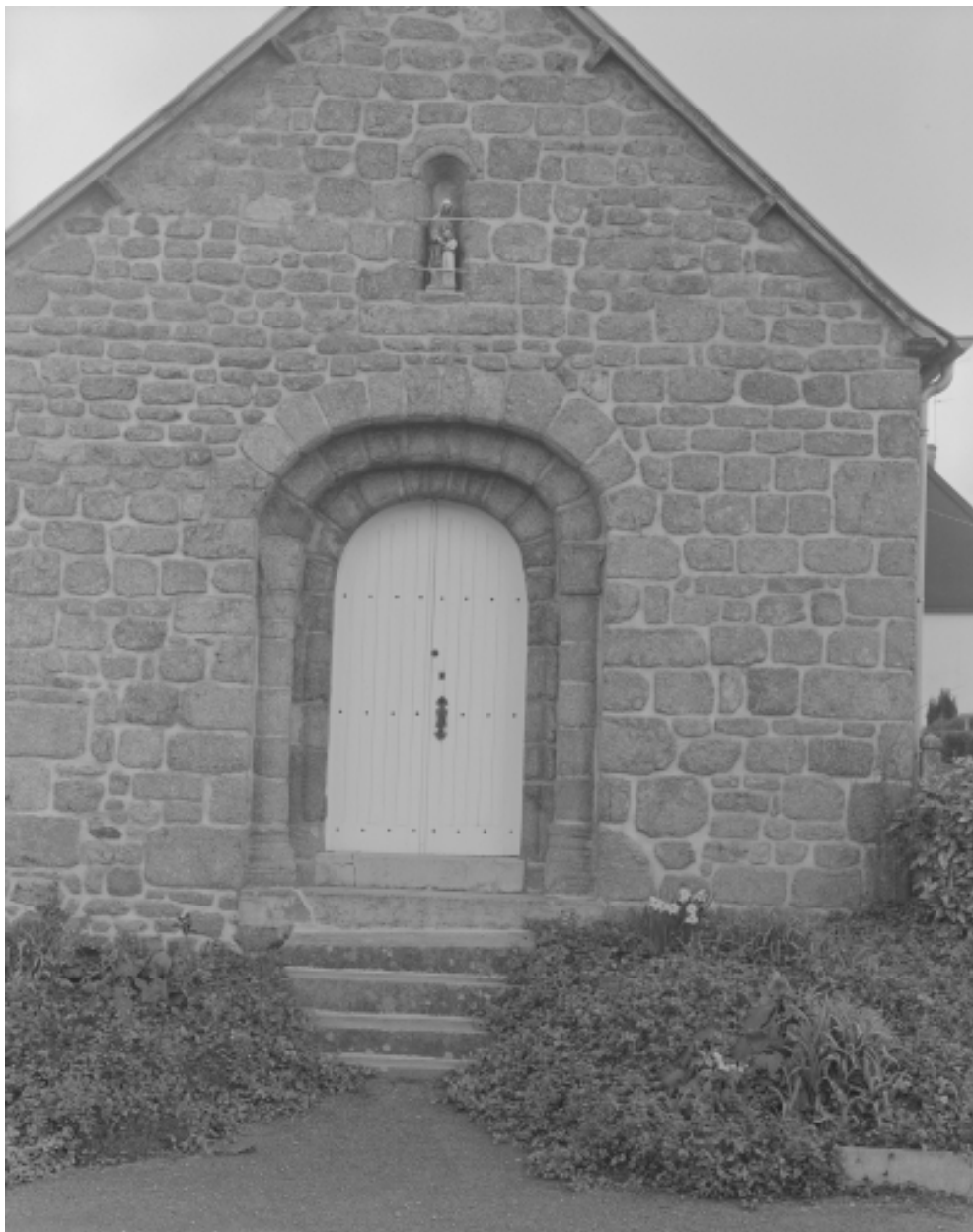
Elévation Ouest, porte : vue générale