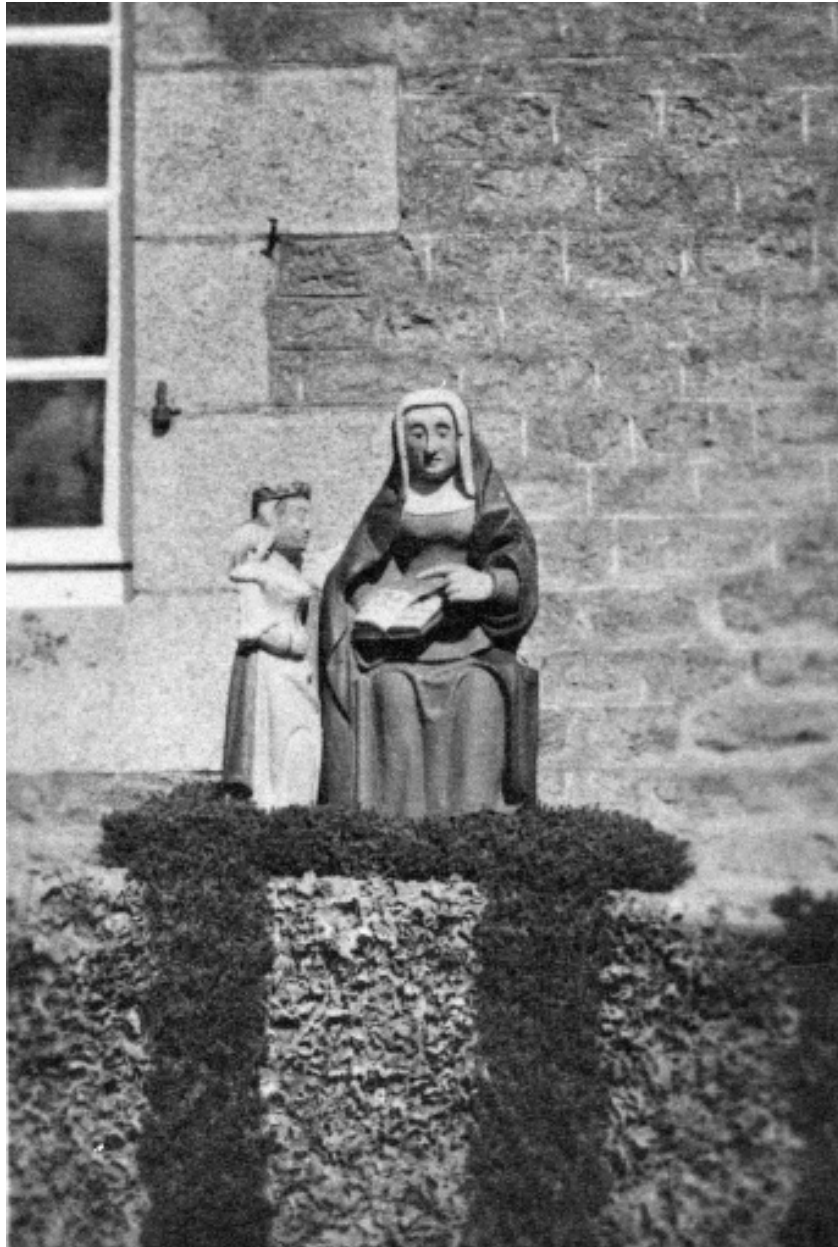
Statue Sainte-Anne, vue générale.