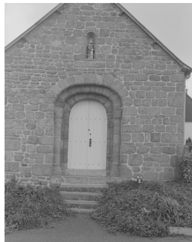
Elévation Ouest, porte : vue générale IVR53_19933500322X