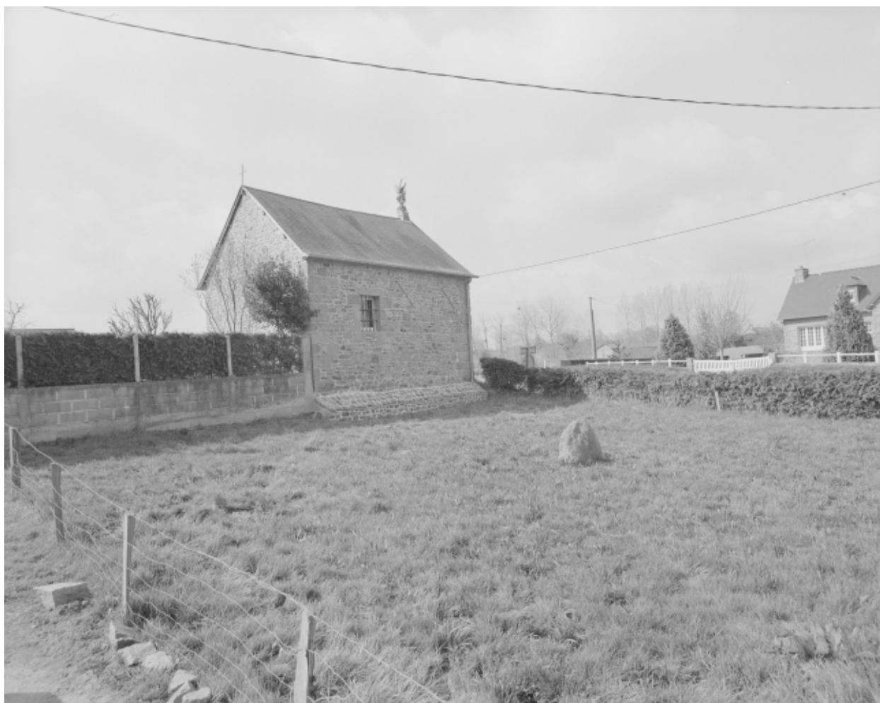
Elévation Nord-Est : vue générale